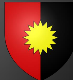
Blason de Maussane

D'or au gousset renversé d'azur chargé en cœur d'une fleur de lys du champ surmontée d'un lambel de gueules brochant sur le tout.