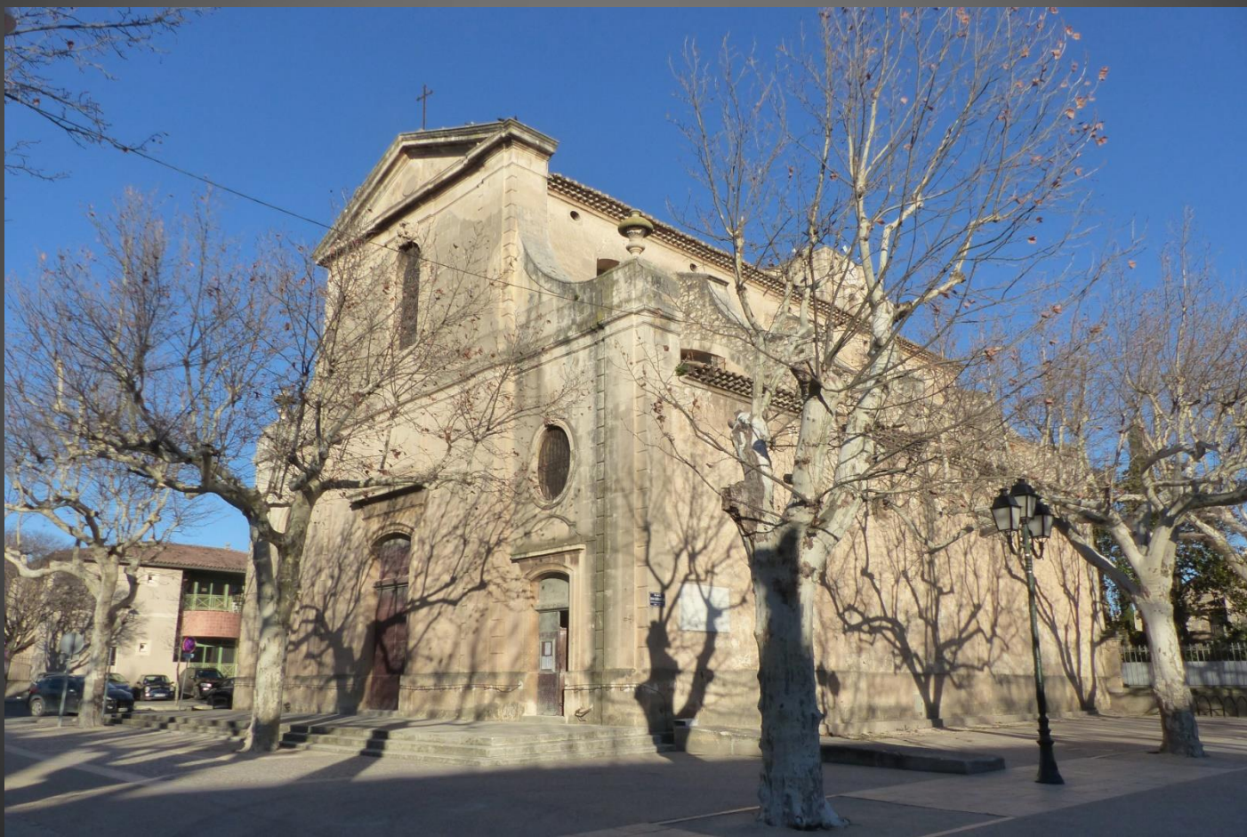
MAUSSANE L'église Sainte-Croix