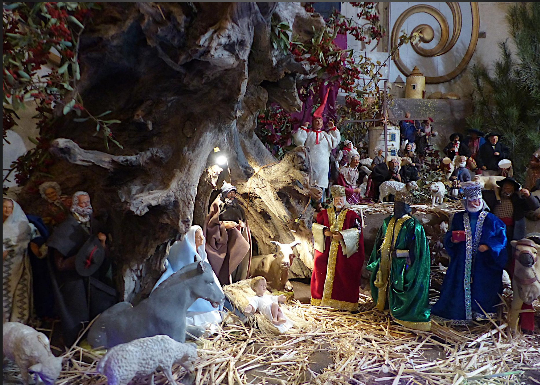
Nativité _ Or, pendant qu'ils étaient là, arrivèrent les jours où elle devait enfanter. Et elle mit au monde son fils premier-né; elle l'emballota et le coucha dans une mangeoire, car il n'y avait pas de place pour eux dans la salle commune. (Luc 2, 7).