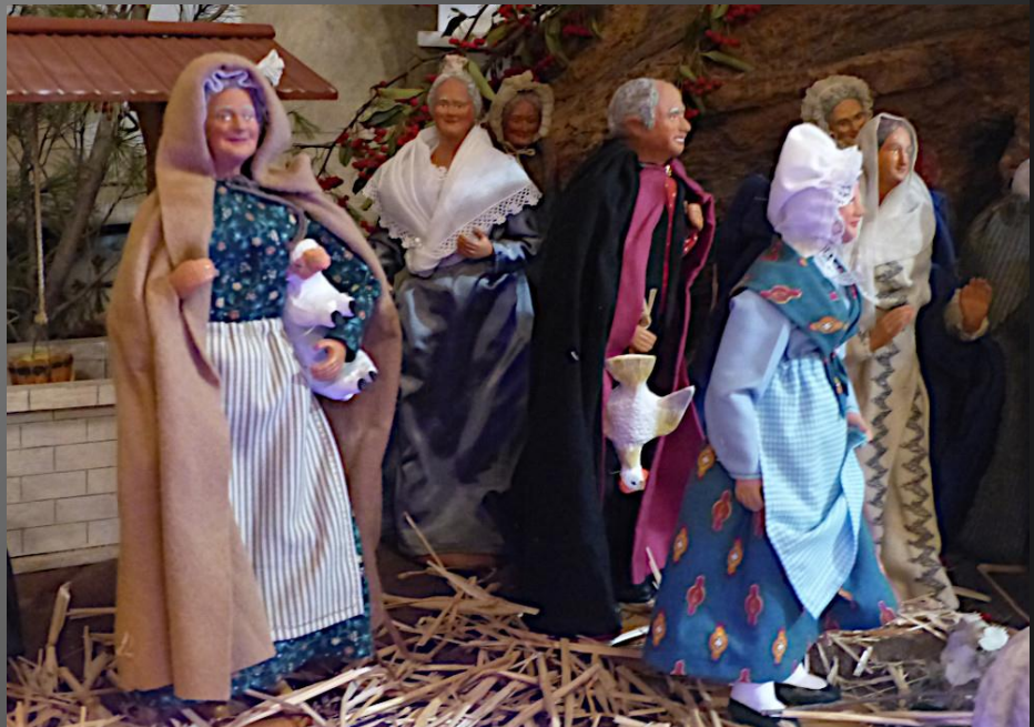
La crèche est abritée par un vénérable pied d'olivier.