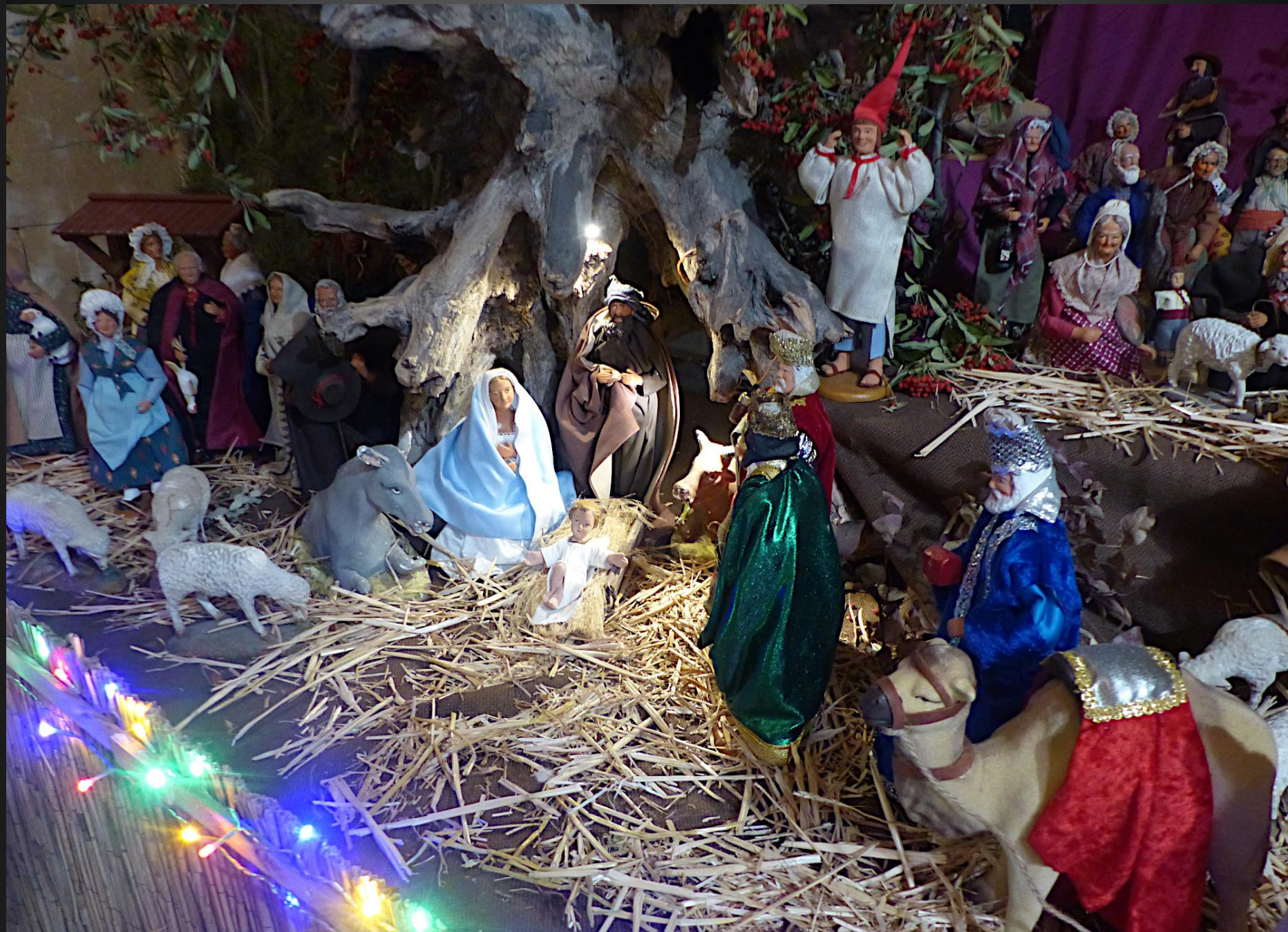
Les rois mages ont suivi l'étoile jusqu'à l'étable de Bethléem où ils ont offert à l'Enfant-Roi de l'or, de l'encens et de la myrrhe, avant de repartir vers l'Orient.