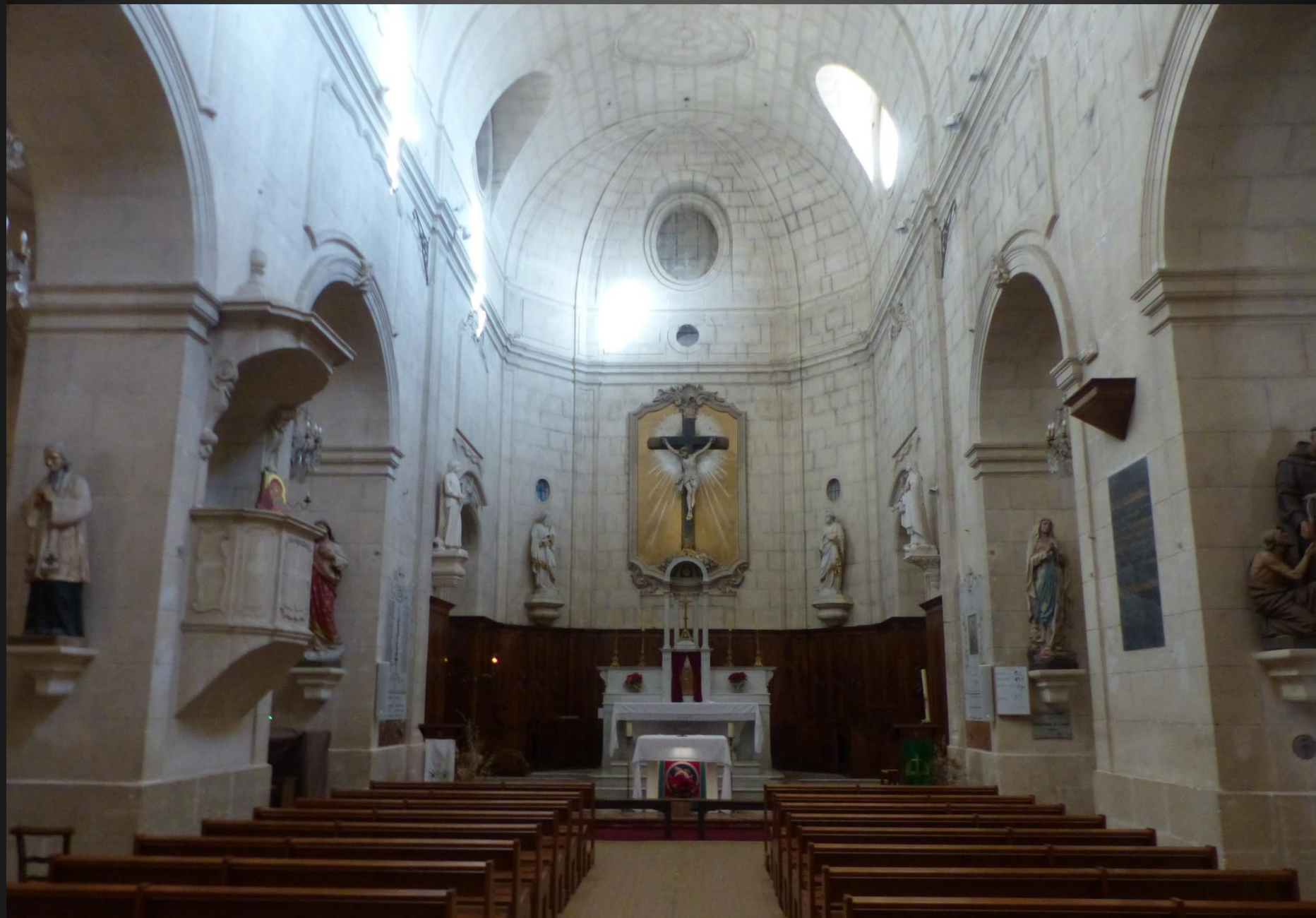
Eglise Sainte-Croix _ Le 27 août 1750, Joseph Laugier de Monblan, seigneur de Monblan, achète un terrain au centre du village. C'est là qu'il va entièrement financer et faire ériger l'édifice religieux. En septembre 1754, l'église Sainte-Croix est offerte aux Maussanais et consacrée par l'archevêque d'Arles, Jean-Joseph de Jumilhac. Avec la construction de l'église, le centre du village se déplace. Maussane se développe le long de l'actuelle avenue de la vallée des Baux et autour de l'Eglise, notamment grâce à sa place qui demeure le cœur naturel du village. (Source https://maussane.com/patrimoine/eglise-sainte-croix/ )