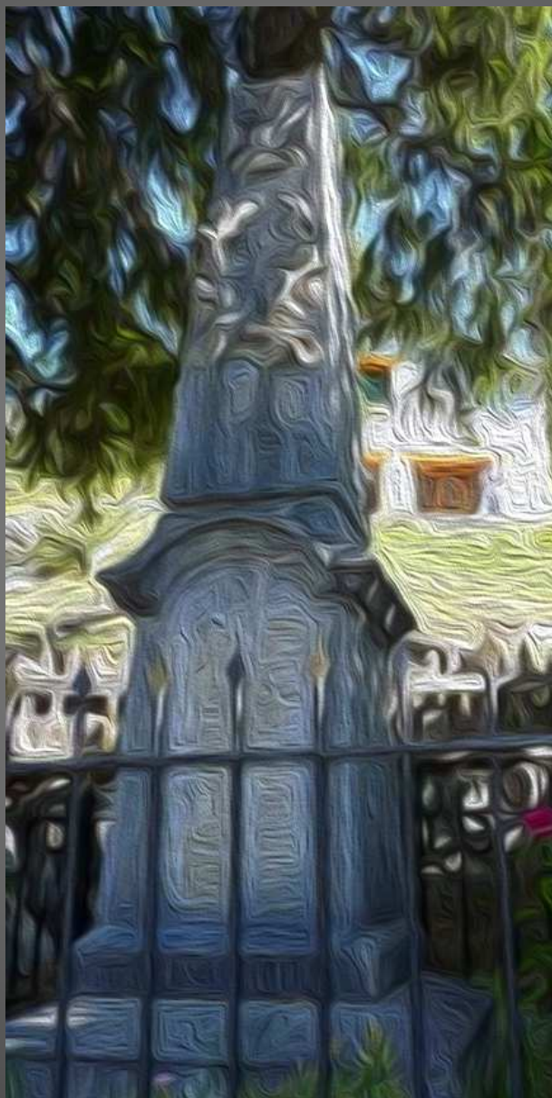
Monument aux morts 14-18 de Uvernet-Fours (Alpes-de-Haute-Provence) PHOTO DU WEB