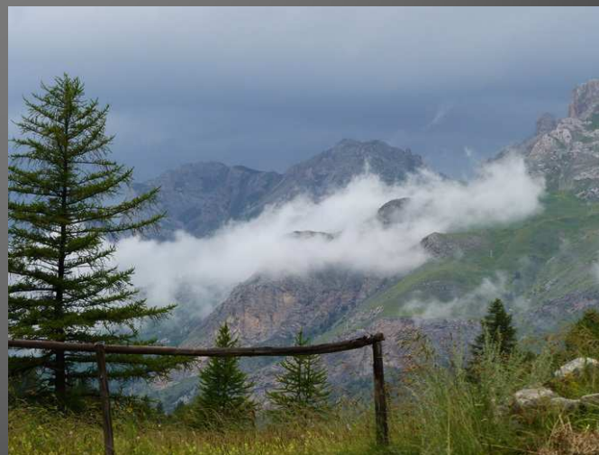
BAYASSE _ Le climat à 1800m dans le parc du Mercantour est rude, les enfants du pays étaient souvent mobilisés dans les chasseurs alpins en 14-18. De g. à dr : calvaire à l'entrée du cimetière, pont de bois sur un torrent, temps d'orage le 12 juillet 2016 au matin.