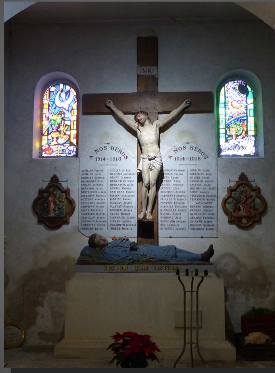
Mémoire des Morts pour la France 1914-1918 Dans l'église Saint-Césaire

Un gisant, représentant un Poilu de 14-18, au pied d'un Christ en croix, entouré de deux plaques de marbre où sont gravés les noms des enfants du pays tombés pendant la Grande Guerre.