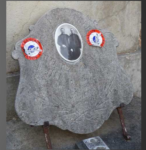
Texte non lisible.