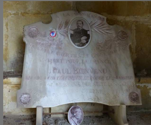
BIENVENU Paul, mort pour la France en 1919, âgé de 28 ans, par suite des gaz.