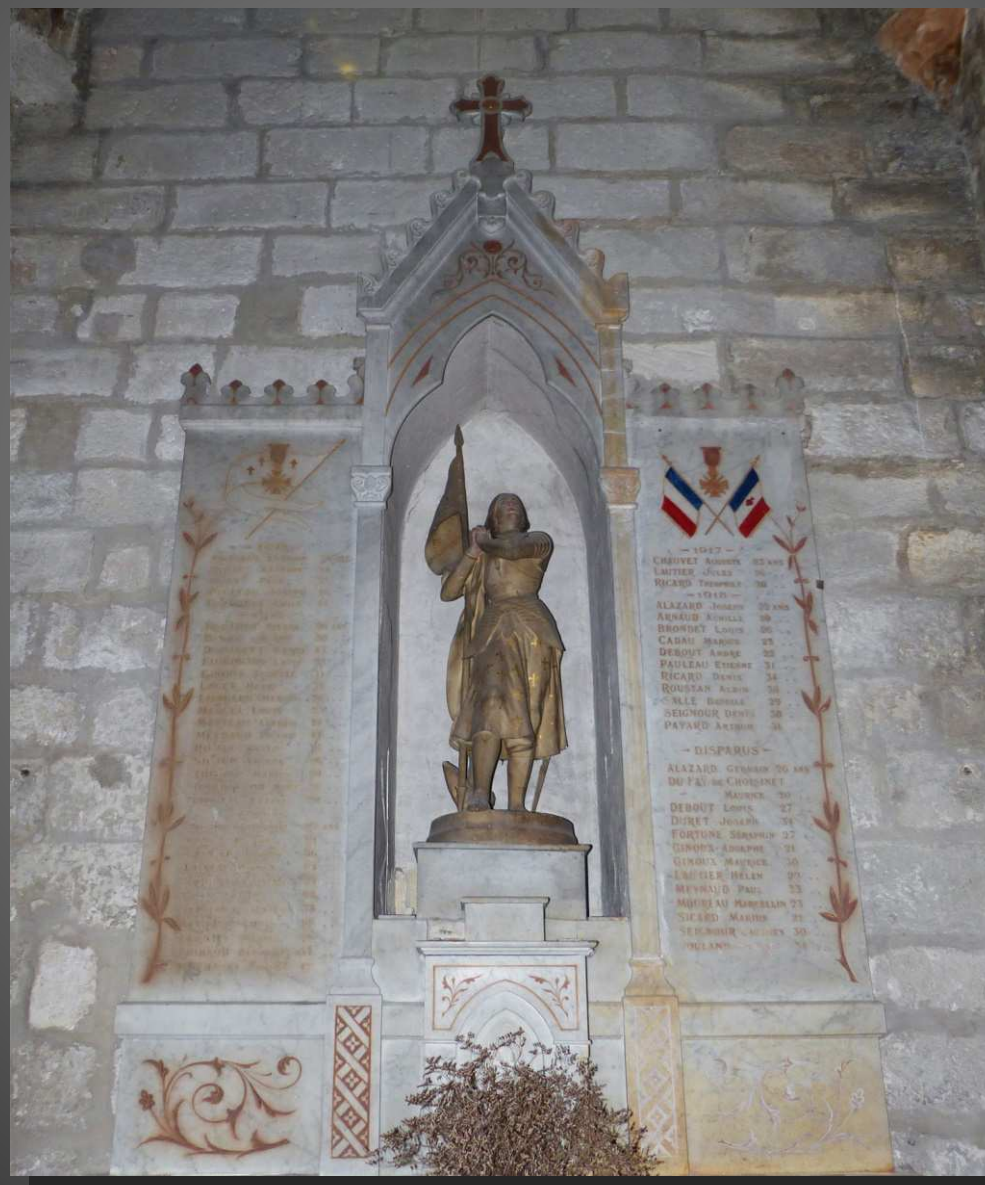
Monument à la mémoire des enfants de Noves m:orts pour la France durant la Grande Guerre 1914-1918.