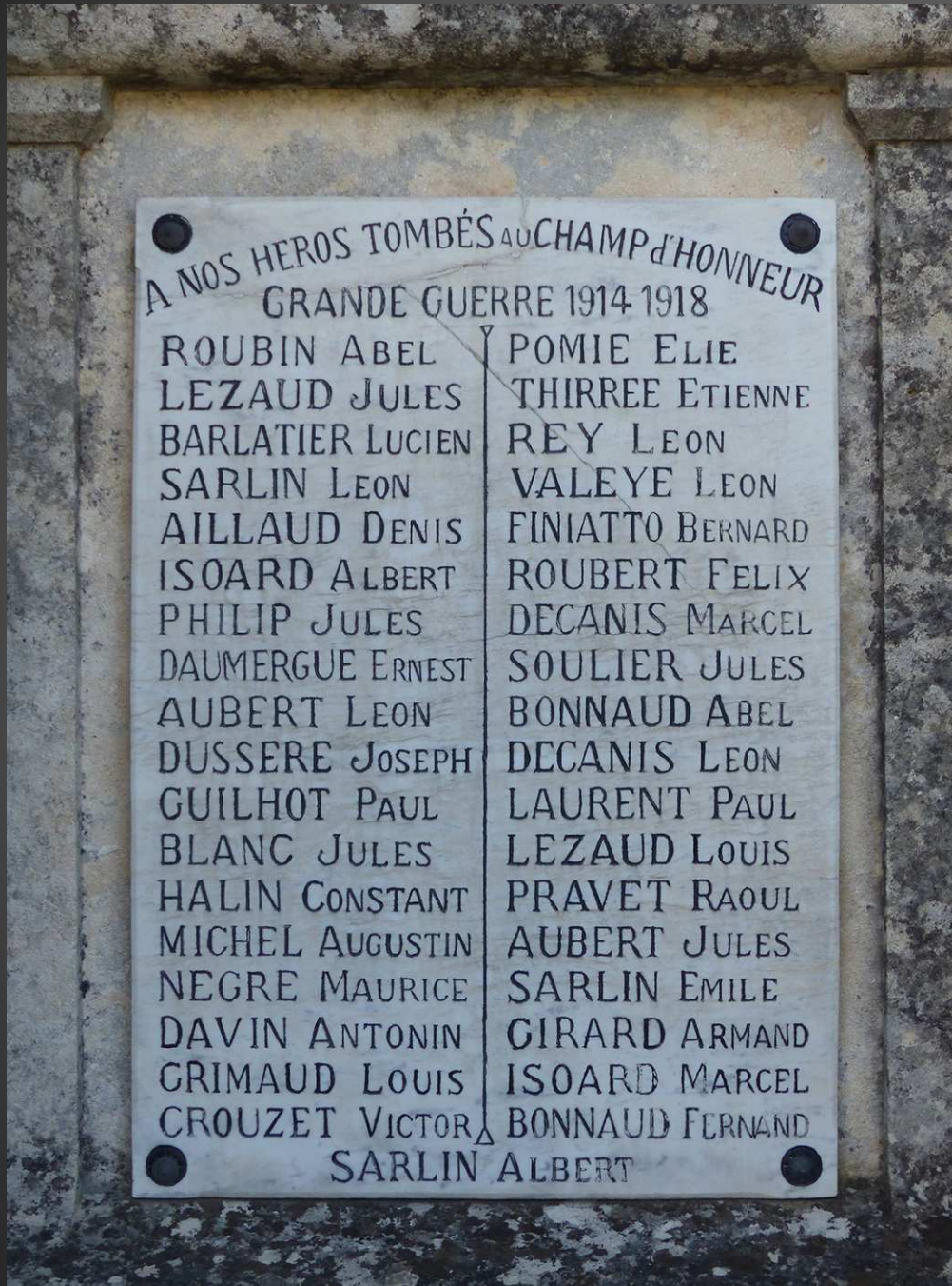
Plaque des Morts pour la France sur la face avant du piédestal du monument.