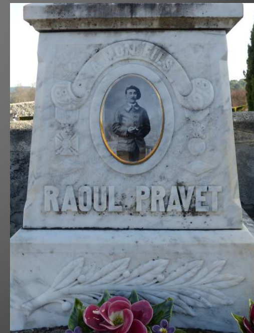
Plaque en mémoire d'un Poilu dans le cimetière.