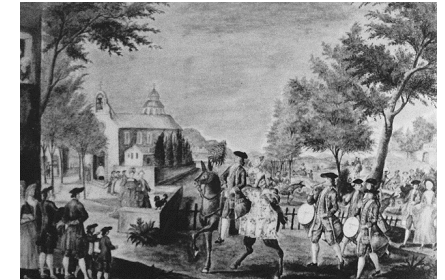
Anonyme du XVIIIe siècle, Cortège de mariage, Grasse, musée d'Art provençal