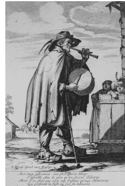
Abraham Bosse, Tambourinaire (XVIIe siècle) Paris, Bibl. Nat., Cabinet des Estampes