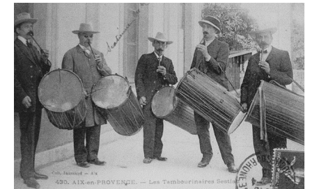
Li Tambourinaire Sestian, vers 190, Aix-en-Provence