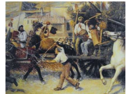
Pierre Grivolos, La Carreto Ramado (détails) XIXe siècle, Avignon, musée Calvet