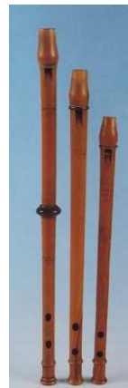
La dynastie des Michel, facteurs aixois d'instruments provençaux, est originaire de La Fare-les-Oliviers. (Voir page 2)