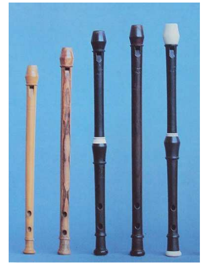
Galoubets de Marius Fabre, (de gauche à droite) : En ré (buis), en ut (olivier), en si (deux corps, ébène et os, palissandre, deux corps, ébène et os )