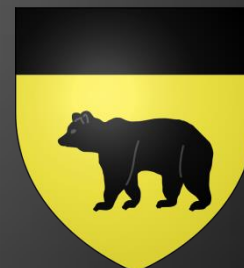
Blason de Coudoux

D'or au gousset renversé d'azur chargé en cœur d'une fleur de lys du champ surmontée d'un lambel de gueules brochant sur le tout.