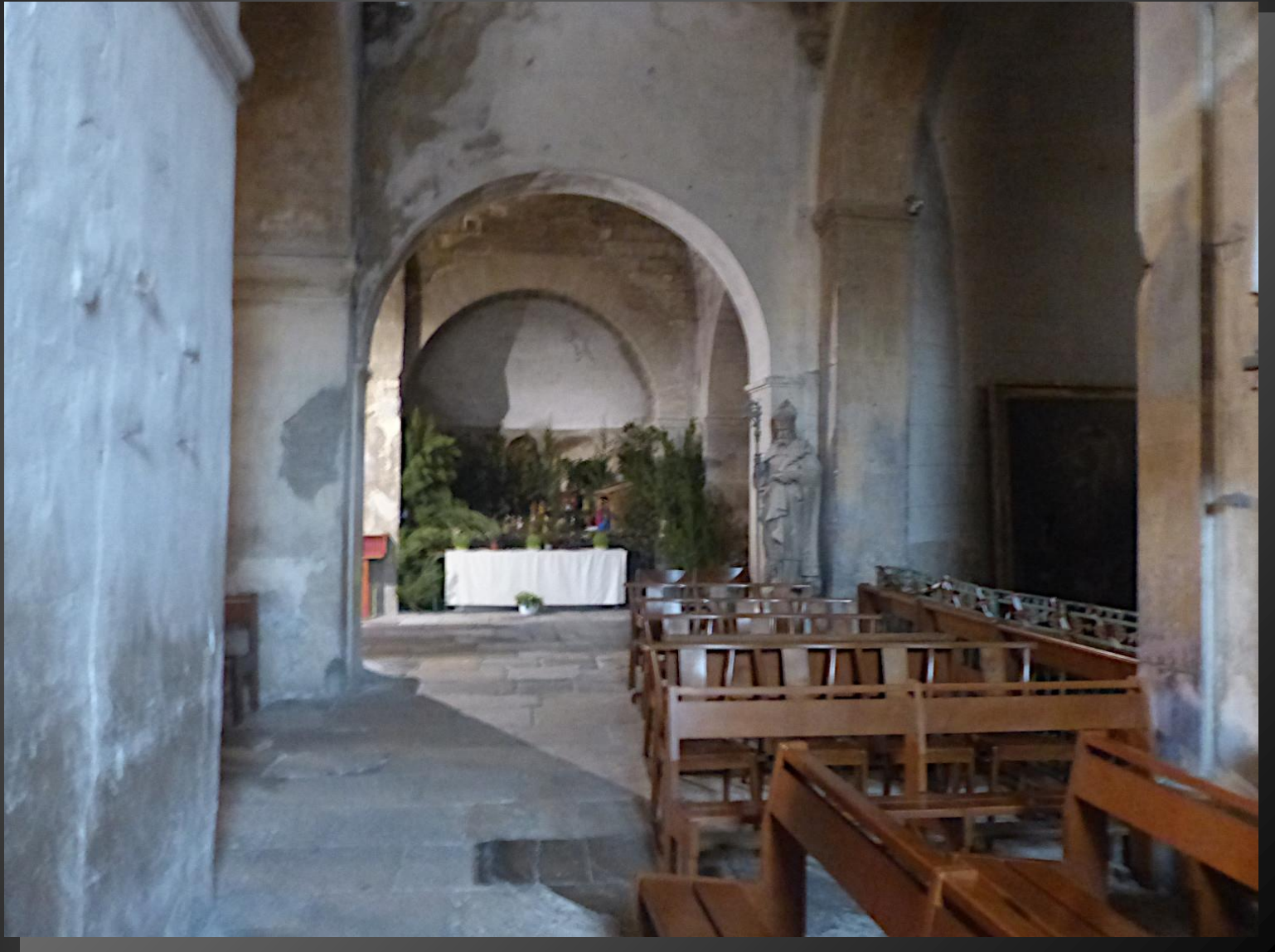
La crèche se situe au fond de l'église, dans le collatéral gauche.