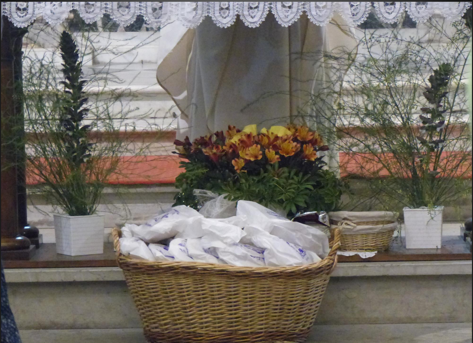
Eglise Saint-Baudile _ Les petits pains ont été bénis et seront distribués aux fidèles par les membres de la Counfrérie de Sant Aloï.