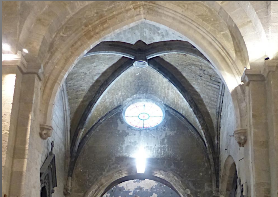
Eglise Saint-Baudile _ Coupole de l'abside, voûte de la nef en arcs brisés, chapiteaux corinthien des colonnes de l'abside ...