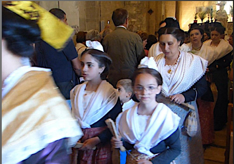
Eglise Saint-Baudile _ Procession de sortie, les Arlésiennes précèdent la croix, la bannière et la statue de Saint Eloi.