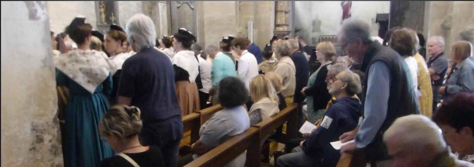
Eglise Saint-Baudile _ Coumunioun : Pan de Vido, cors e sang de Jésu Crist - Douno d'amour que lou Segnour alargué – Cors vertadié qu'un Sauvaire l'oufris.