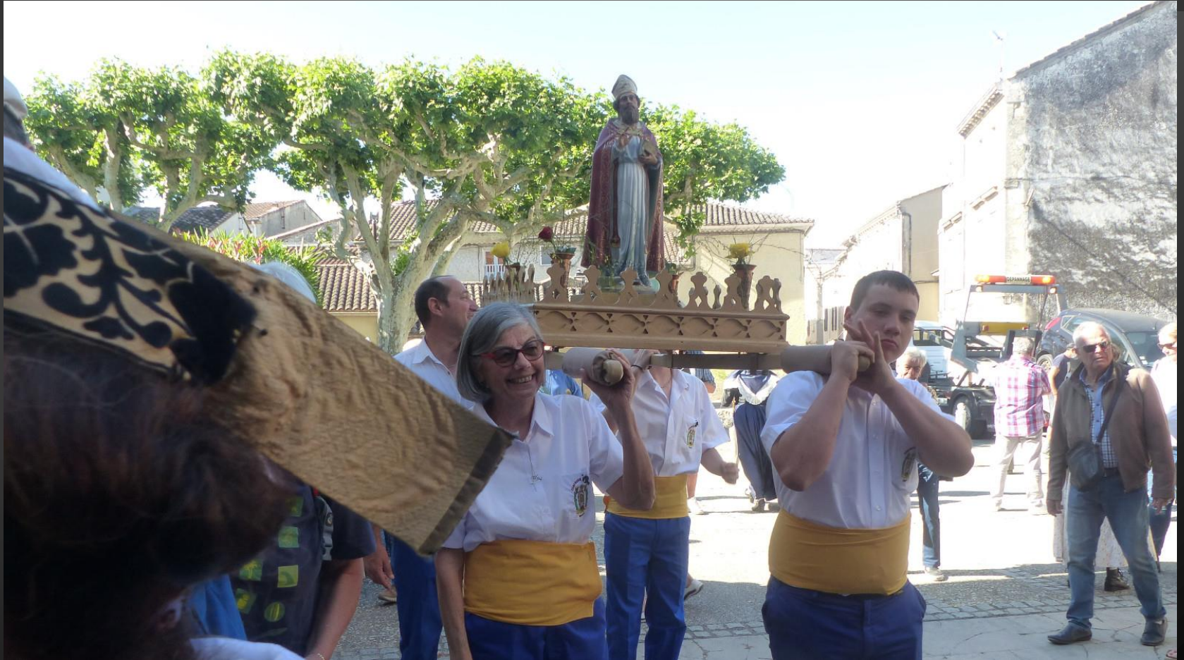
NOVES_ Statue de St Eloi portée par quatre membres de la Confrérie, pour la procession d'entrée dans l'église.