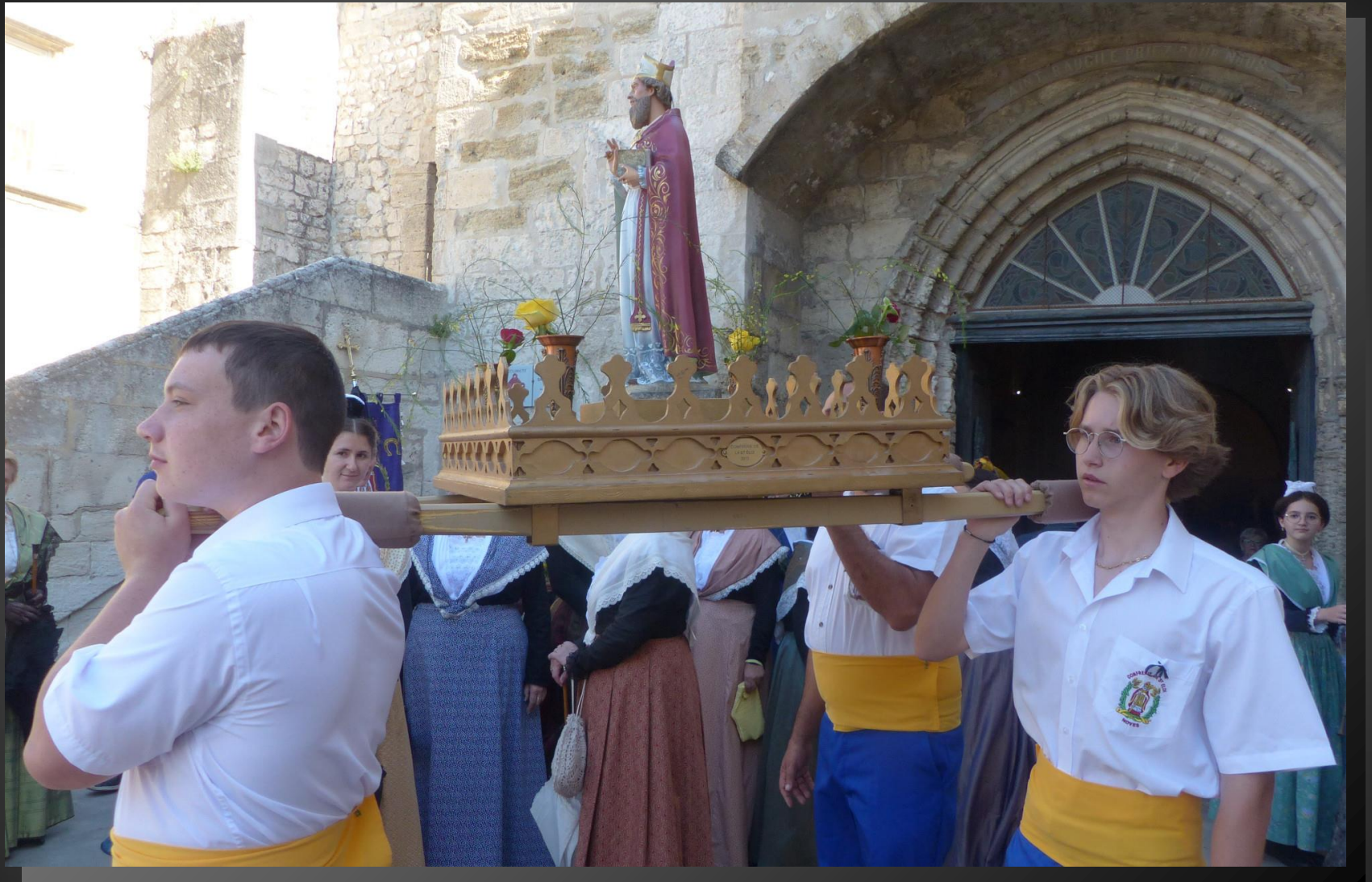
NOVES_ La statue de St Eloi va maintenant être portée en procession autour de la ville ...