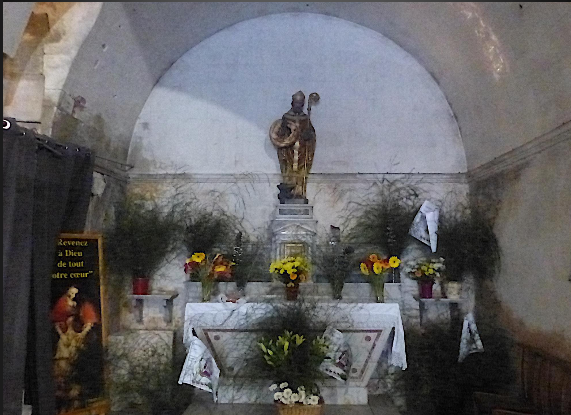
Eglise Saint-Baudile _ L'autel de Saint-Eloi est décoré avec soin pour la grande fête, une tortillade passée à son bras droit, c'est la tradition ...