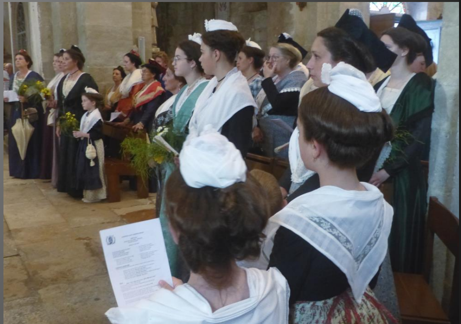
Eglise Saint-Baudile _ Glòria : Glòri à Diéu dins lou cèu, Glòri à Diéu pas is ome !