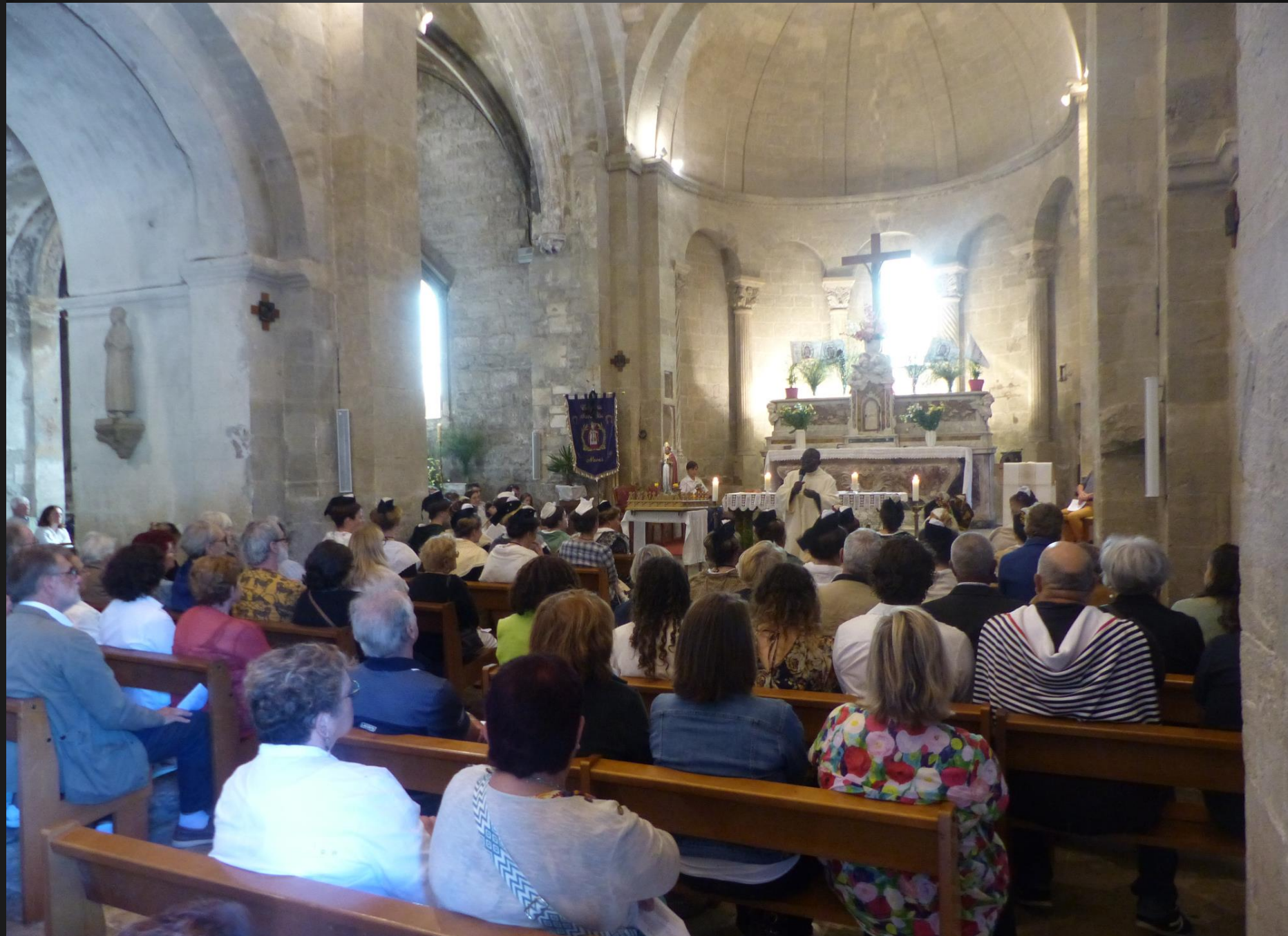
Eglise Saint-Baudile _ Un prêche qui se termine par un chant entraînant de Gospel mené par le Père Lazare.