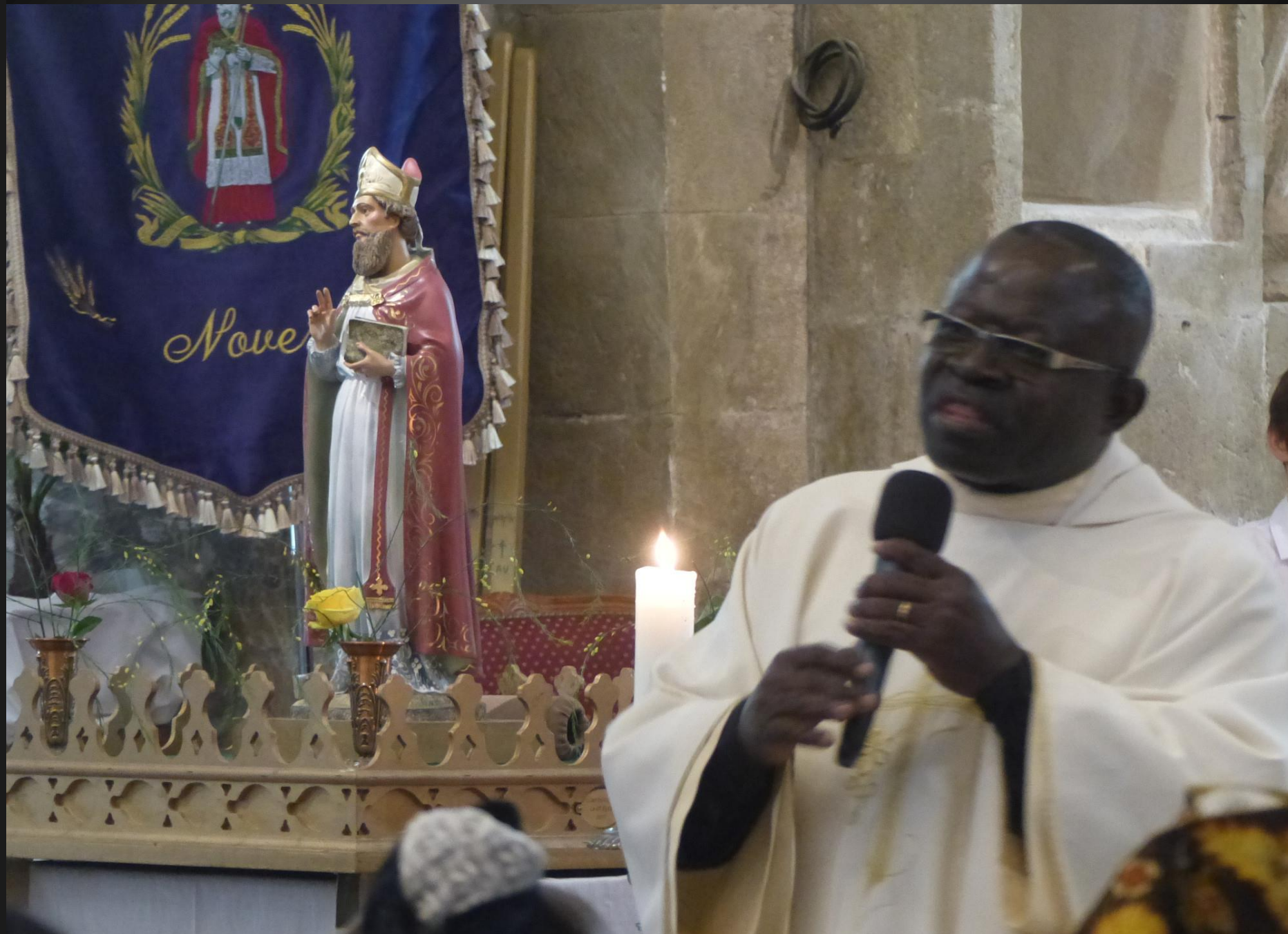
Eglise Saint-Baudile _ Une homélie forte, sur la Présence réelle, Corps et Sang du Christ après la transsubstantiation, l'essence-même du Christianisme, combattue par les forces des Ténèbres.