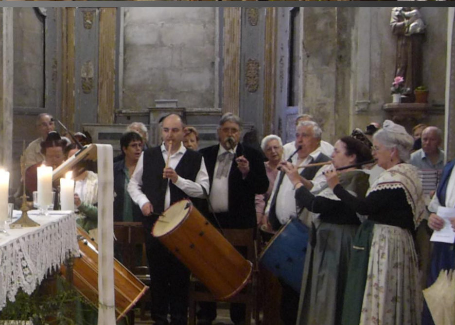
Eglise Saint-Baudile _ Preparacioun Penitencional : Segneur Jésus, que lou Paire a manda pèr gari li cor repentous. Pieta pèr nous autre !