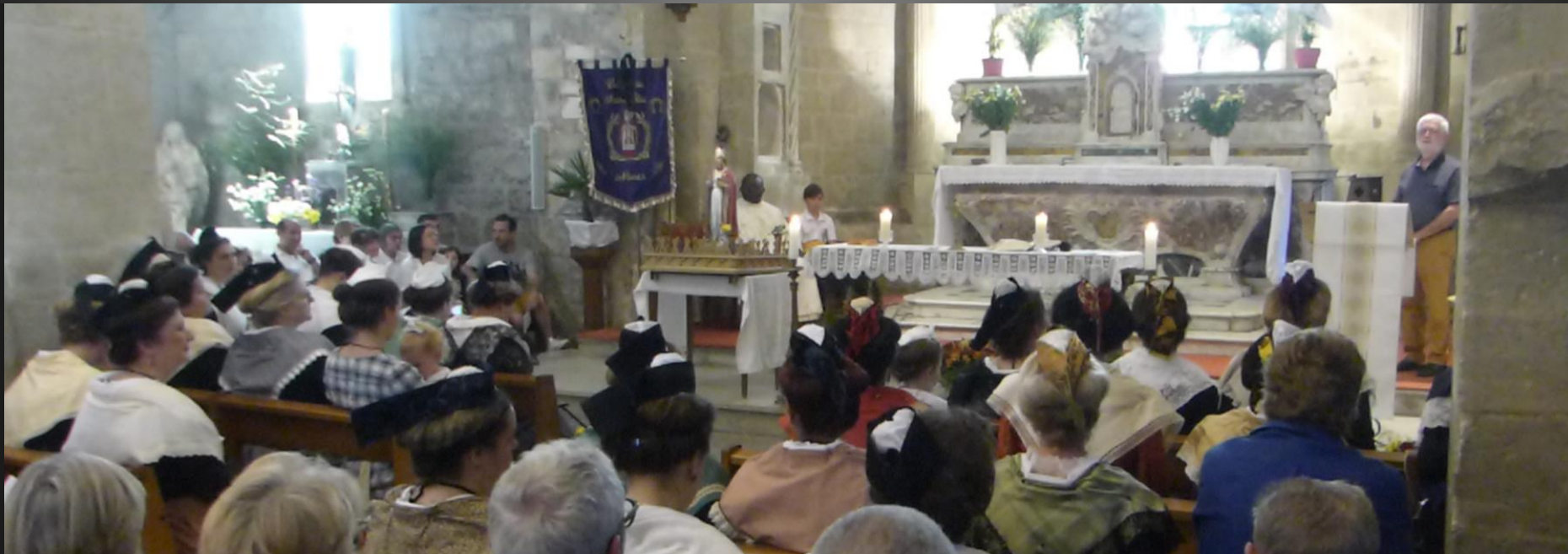
Eglise Saint-Baudile _ Proucessioun di óufrèndo – Tambourinaire.