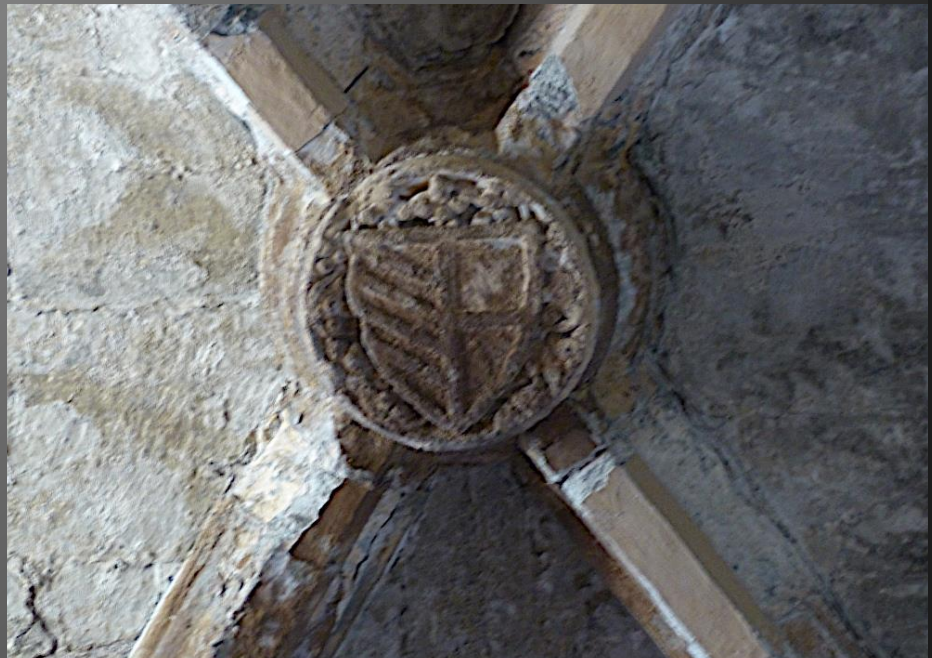
Eglise Saint-Baudile _ Voûtes en croisées d'ogives et clés de voûte avec armoiries sculptées, qui nous renvoient à l'Histoire de la France.