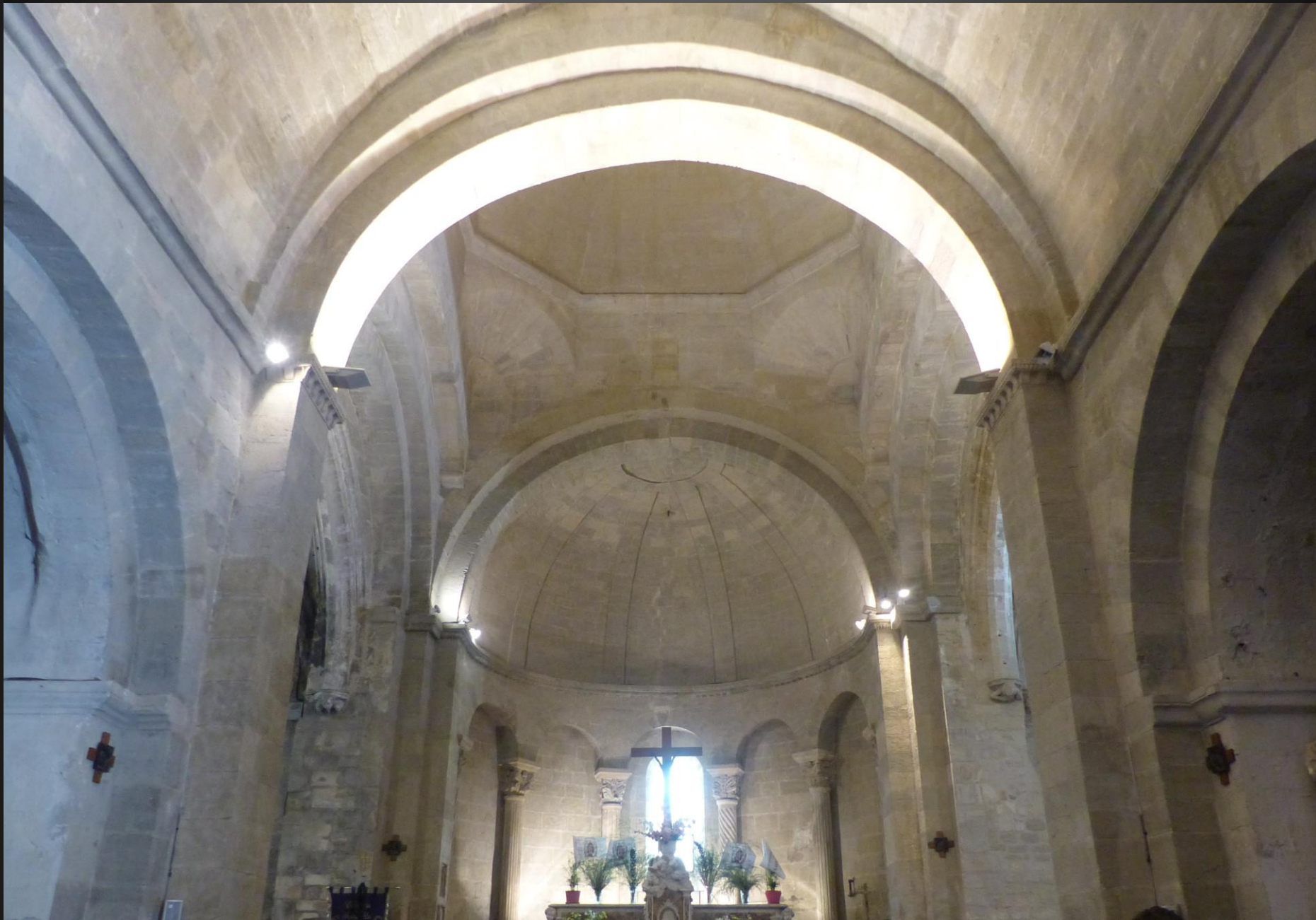
Eglise Saint-Baudile _ L'architecture romane pure et dépouillée de l'église Saint-Baudile, dont les pierres furent témoins de tant de prières, supplications, vœux et remerciements d'une interminable lignée de Catholiques, nous incite à une saine humilité et une profonde réflexion sur notre propre fin. « Dans les églises romanes se réalise le mystère de l'Incarnation, sous leurs voûtes en plein cintre. Dieu descend en l'homme pour le régénérer. Ce sont des lieux d'intériorisation, d'unification et de conversion ». Paul Trilloux, Guide de l'Art Roman, Editions Dervy, Paris, 1993.