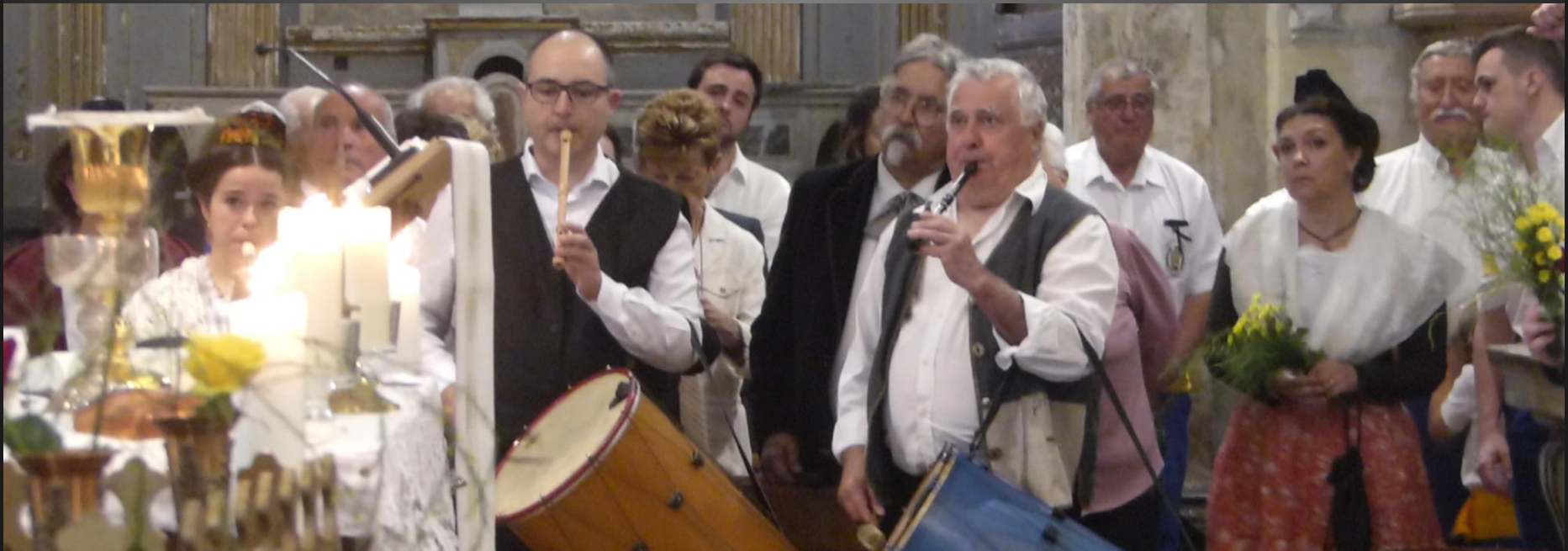
Eglise Saint-Baudile _ Les tambourinaires accompagnent le chant à Notre-Dame de Provence: Prouvençau e Catouli , repris par toute l'assemblée.