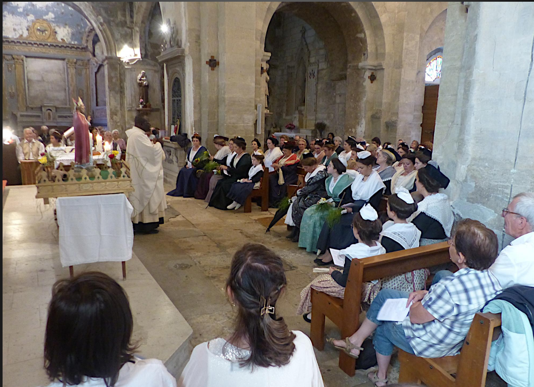
Eglise Saint-Baudile _ L'Oumelio du Père Lazare.