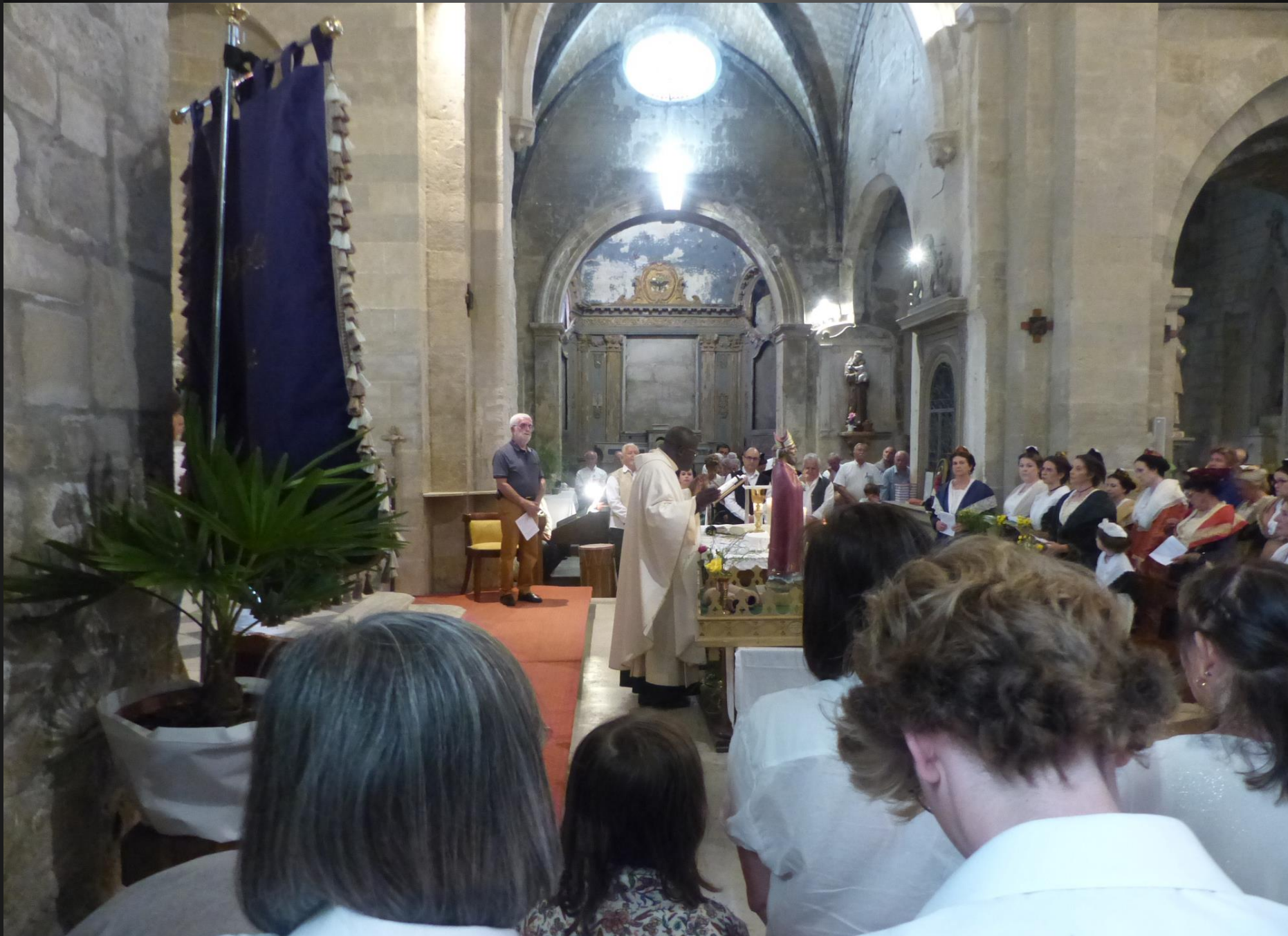
Eglise Saint-Baudile _ Anamnesse : Lou mistèri de la fé.