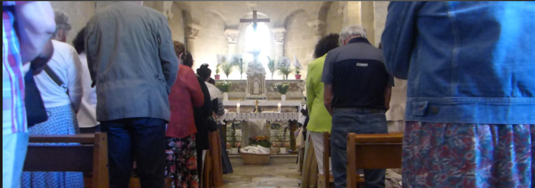
Eglise Saint-Baudile _ Elévation du Sang du Christ ...