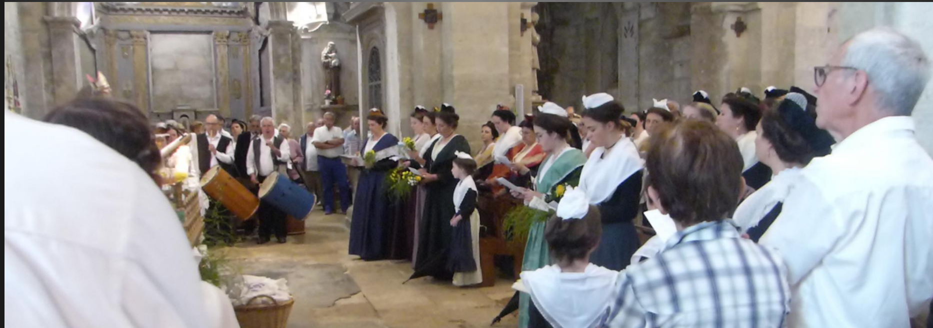
Eglise Saint-Baudile _ Preguiero dou Segnour, Lou Pater.