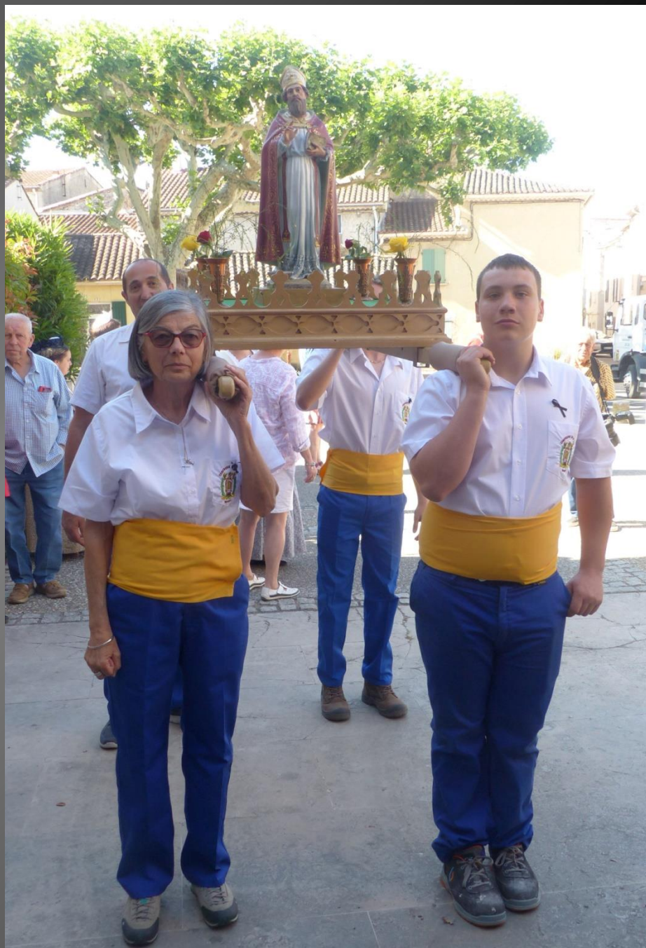
Eglise Saint-Baudile _ Bannière et statue de Saint Eloi vont entrer en procession dans l'église.