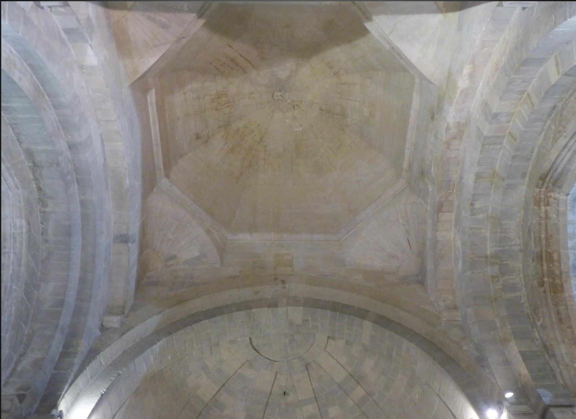
Eglise Saint-Baudile _ Coupole octogonale sur trompes du transept, on admire l'élégant savoir-faire des bâtisseurs.