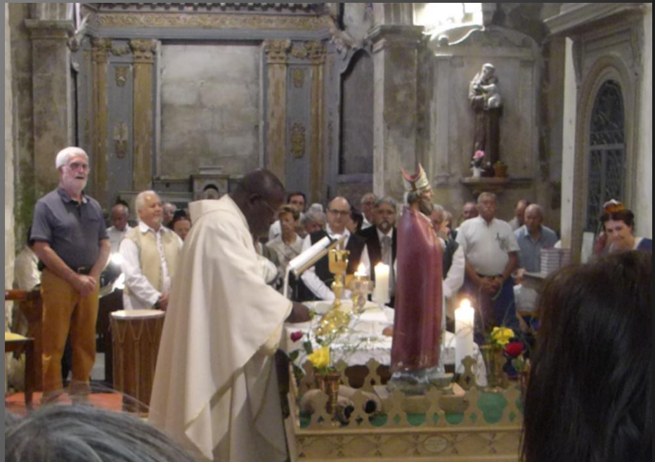
Eglise Saint-Baudile _ Fractioun dóu pan : Agnèu de Diéu que lèves le pecat dóu mounde, Piéta pèr nous autre !