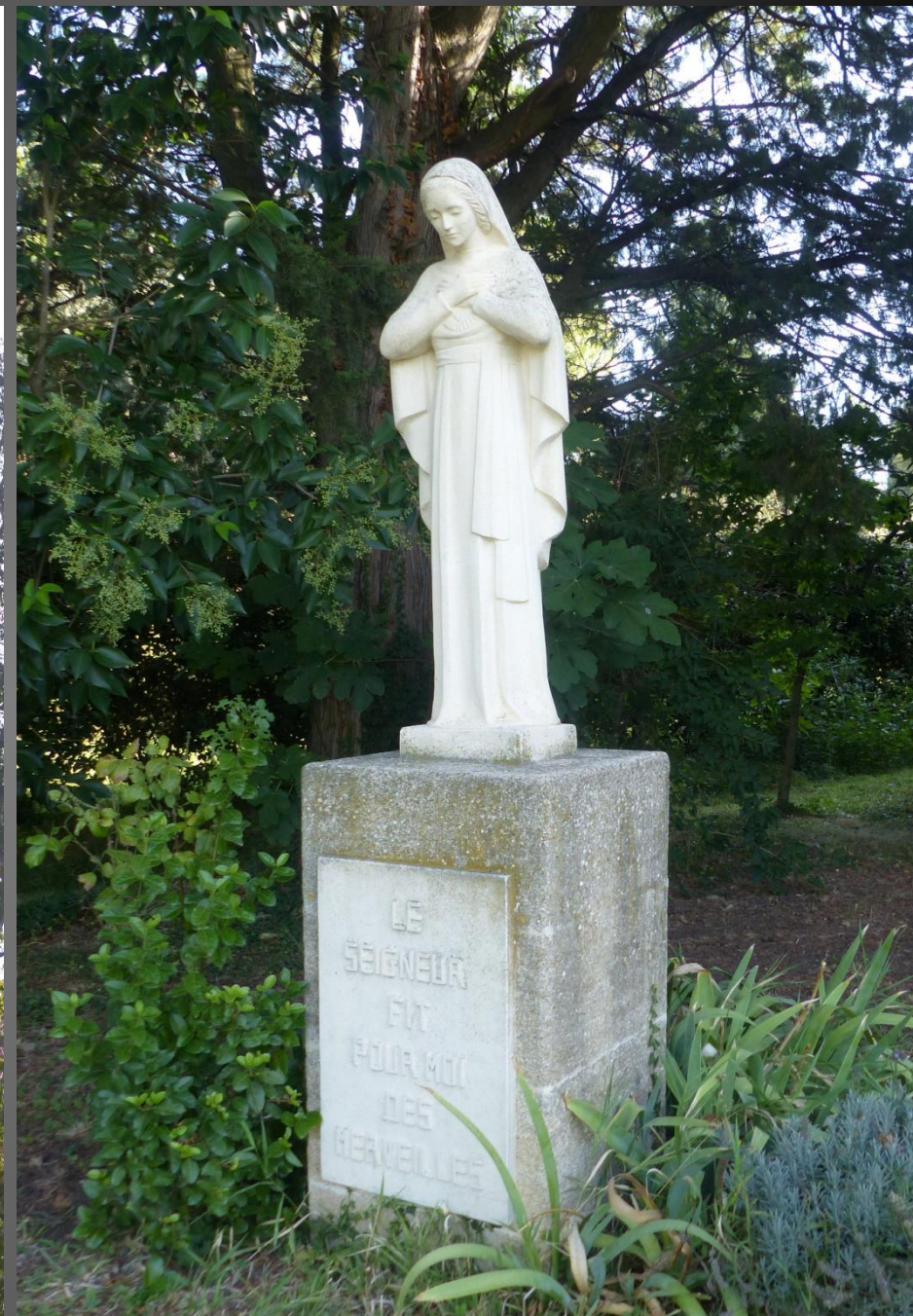
LI PALUN _ Petit parc derrière la chapelle du Sacré-Cœur, statue de la Vierge Marie avec la dédicace « LE SEIGNEUR FIT POUR MOI DES MERVEILLES ».