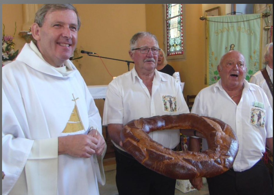
LI PALUN _ Présentation de la couronne bénie, sous le regard de Ste Jeanne d'Arc ... qui a fait couronner le Roi à Reims en 1429.