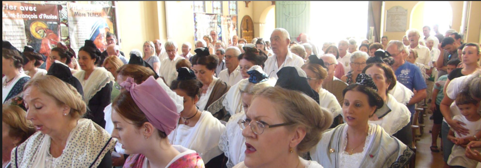
LI PALUN _ Lou Pater : « Que toun noum se santifique – Paire que siès dins lou cèu – Que toun règne pacifique – Sus la terro vèngne lèu. »