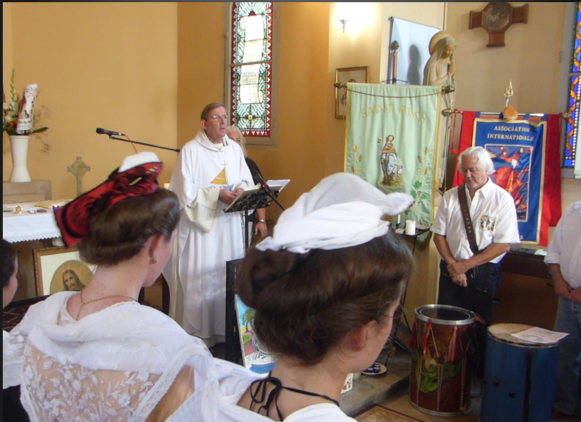
LI PALUN _ Lecture de l'Évangile de Jésus-Christ selon saint Matthieu 16,21-27.