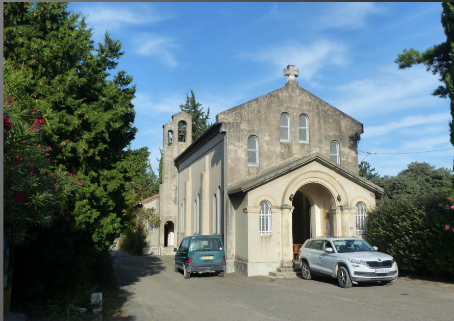
LI PALUN_ La chapelle du Sacré-Cœur et la grande fresque murale de la Carreto de San Ro.