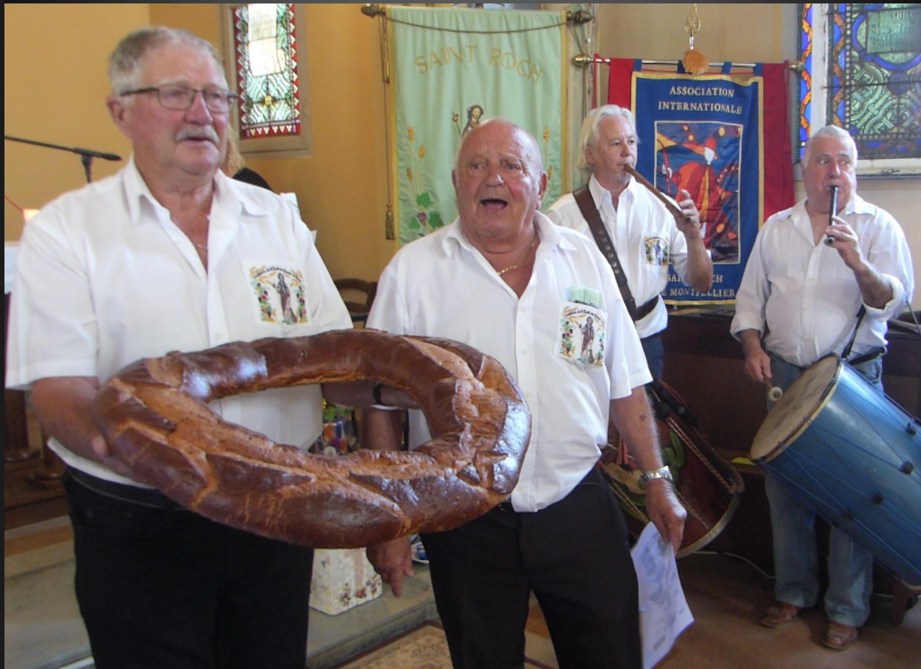
LI PALUN_ Chant final : « Cantico à Nosto Damo de Prouvenço : Prouvençau e Catouli. »