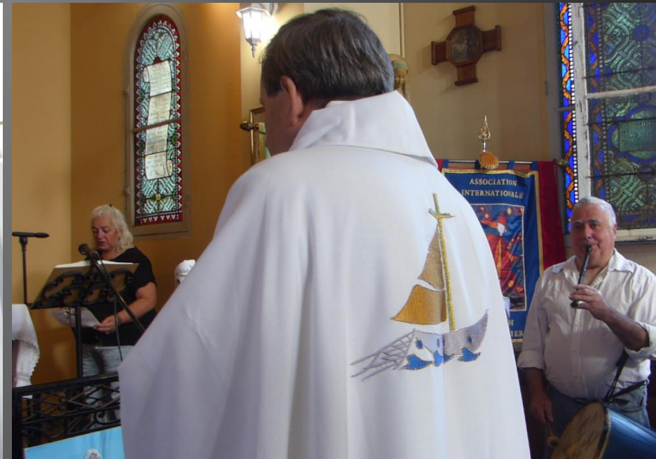
LI PALUN _ Chant d'entrée « Saint Roch, patron tutélaire – Fais sentir ton puissant secours – Bénis la paroisse entière – Qui t'implore en ces heureux jours. »