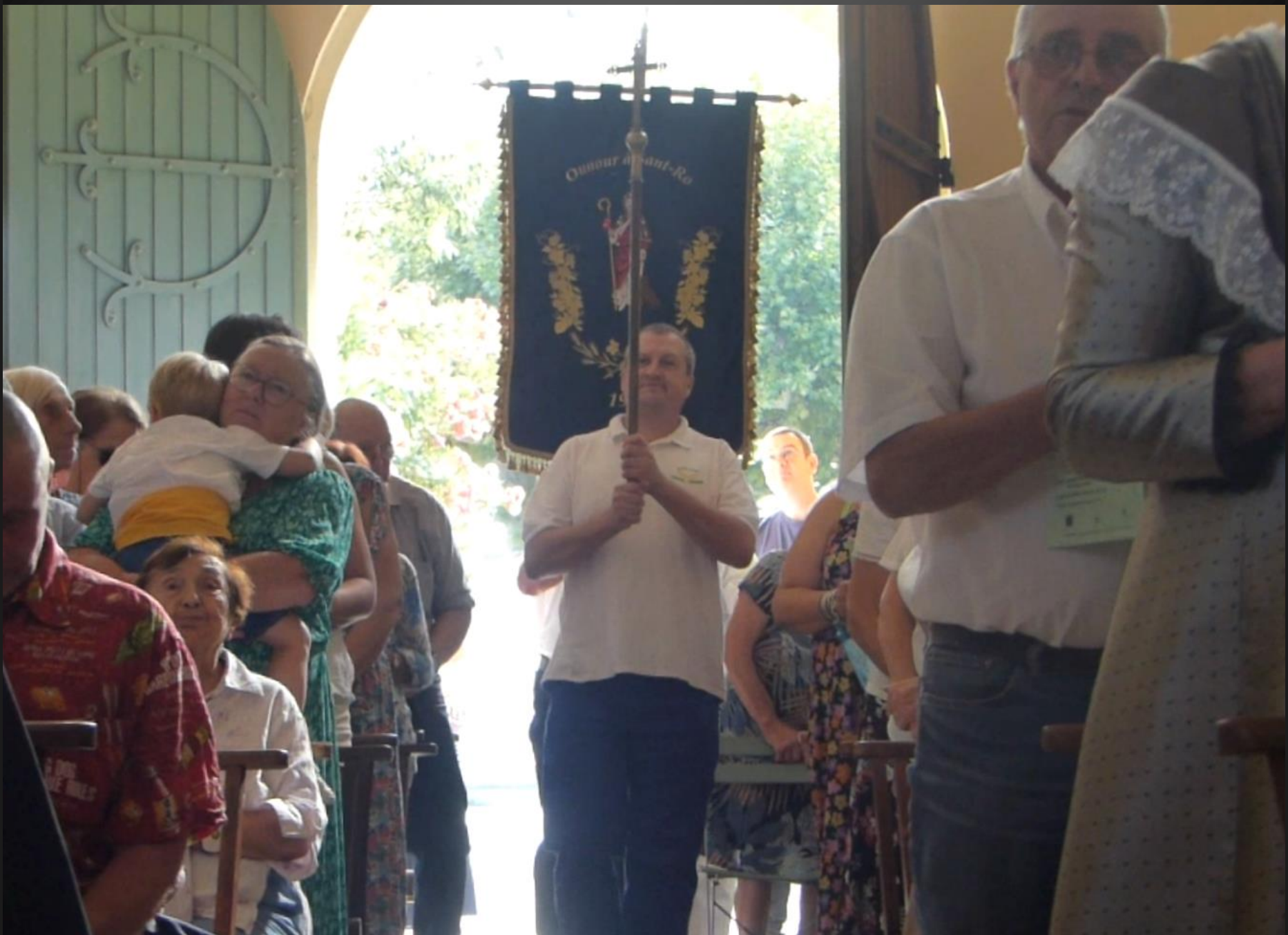
LI PALUN _ Procession d'entrée avec la nouvelle bannière de Saint Roch, bleu et or.