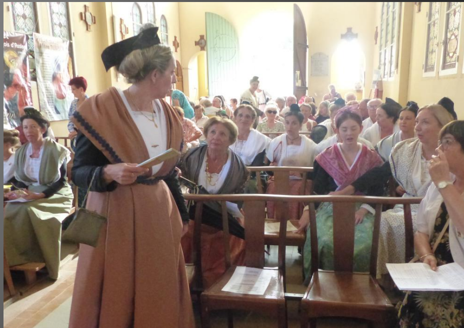
LI PALUN_ La chapelle du Sacré-Cœur s'est vite remplie de fidèles, on remarque beaucoup d'Arlésiennes.