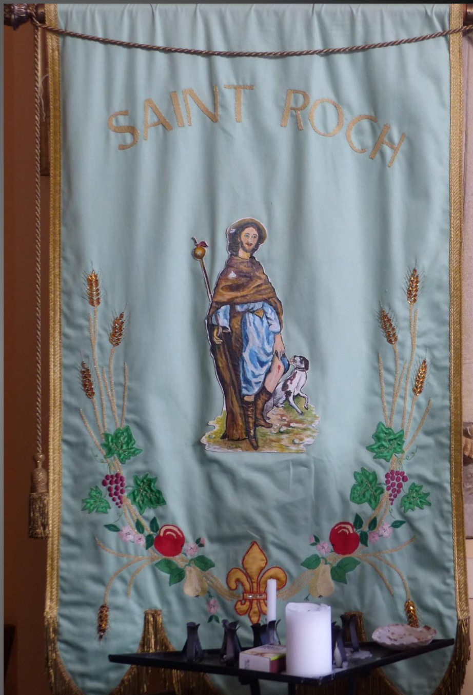
LI PALUN _ Vitrail et ancienne bannière de saint Roch.