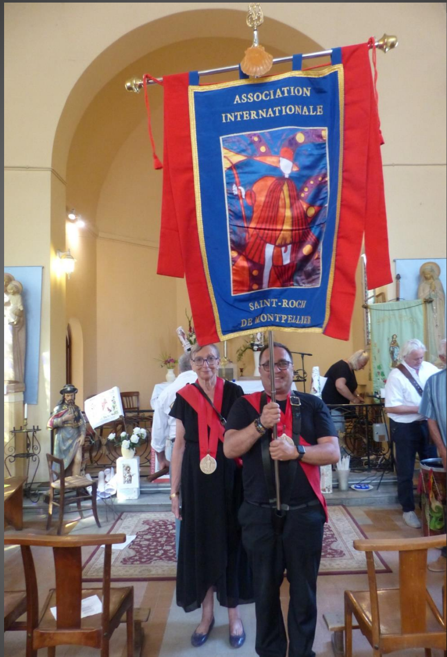
LI PALUN_ Procession de sortie.