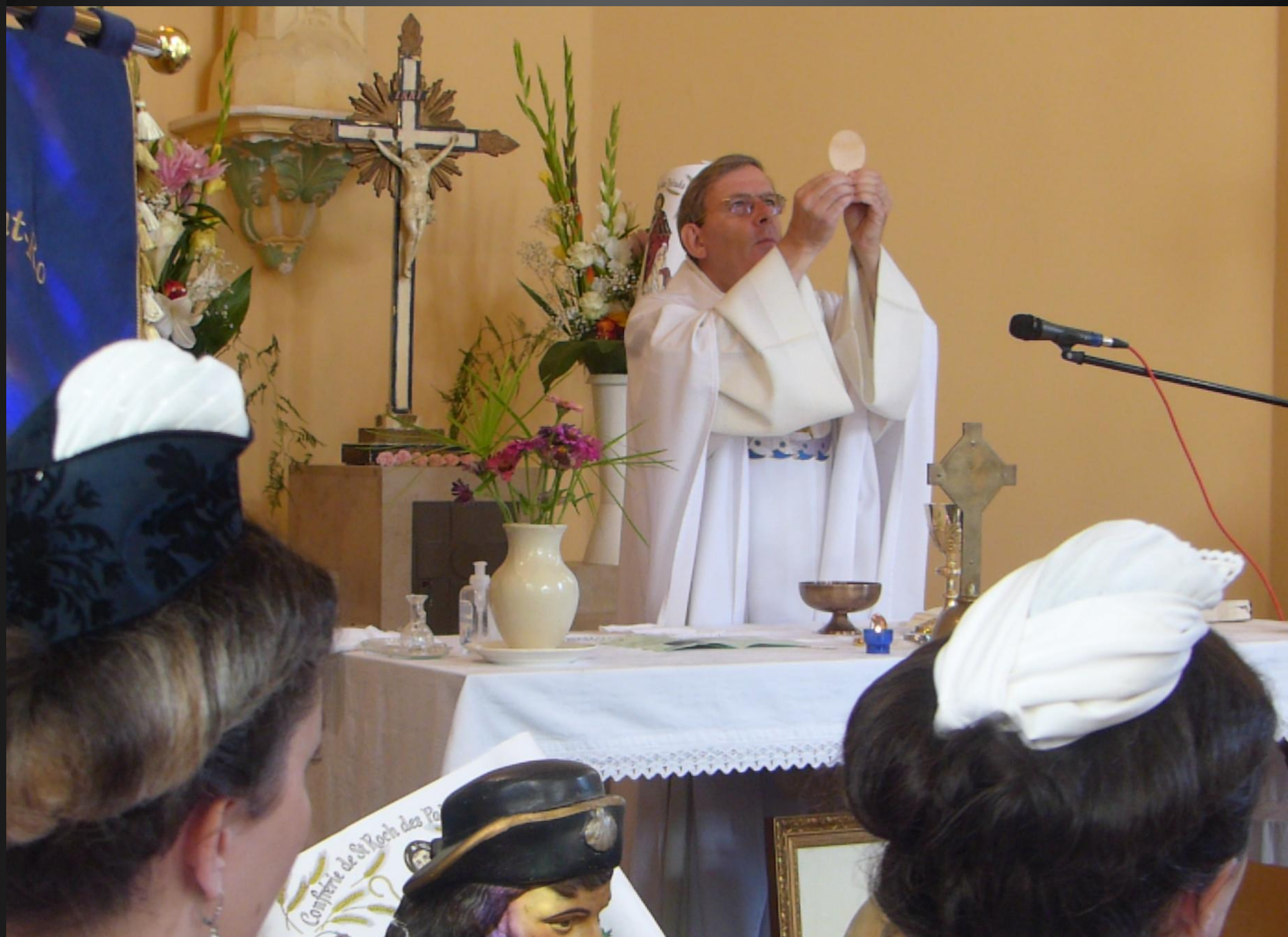
LI PALUN_ Elévation : Consécration du pain qui devient vrai Corps du Christ par la transsubstantiation. (Tambourinaires)