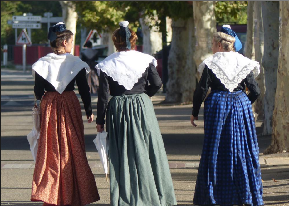
LI PALUN _ Des Provençales en costume d'Arles sont en marche vers la chapelle.