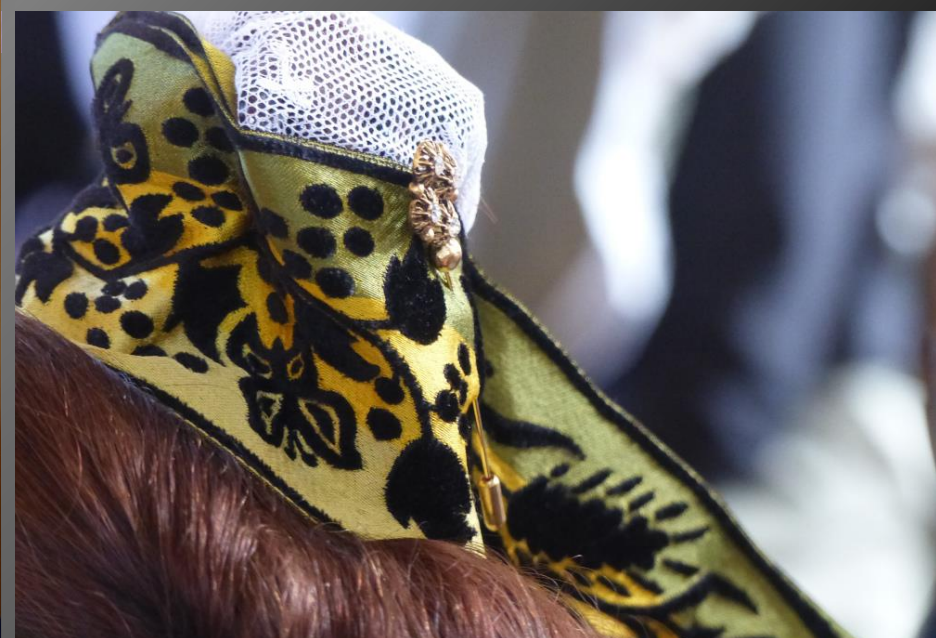
LI PALUN _ La beauté du Costume d'Arles est célébrée à Mouriés au mois de juin avec l'élection de la Reine du Ruban lors d'une grande fête traditionnelle. VOIR https://www.thegoodarles.com/good-time-agenda-sorties-et-evenements-pays-d-arles/fete-du-ruban-mouries-arpilles/