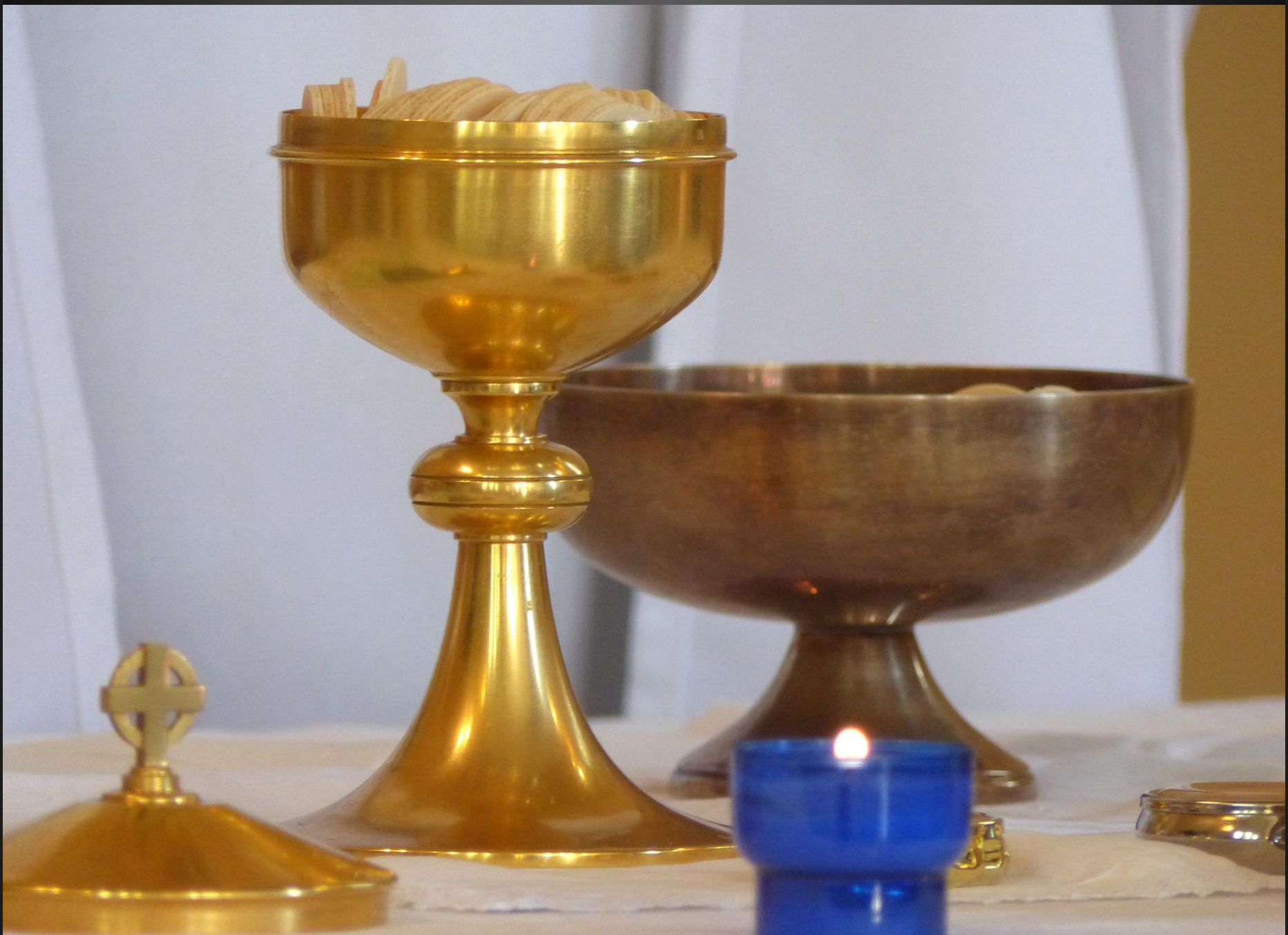
LI PALUN _ Le moment sacré de la Communion.