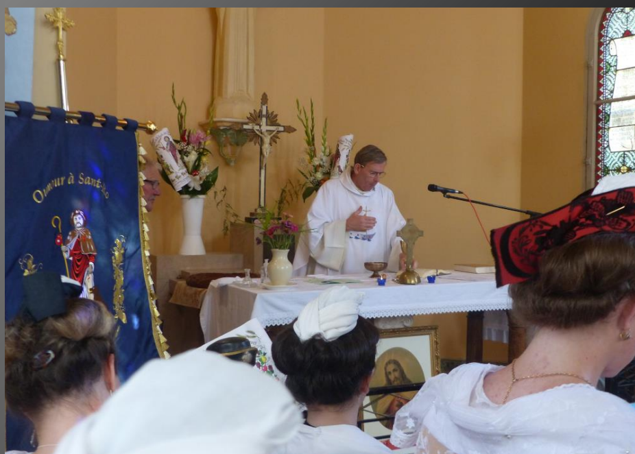
LI PALUN_ Offertoire, la procession des offrandes et des petits pains à bénir.