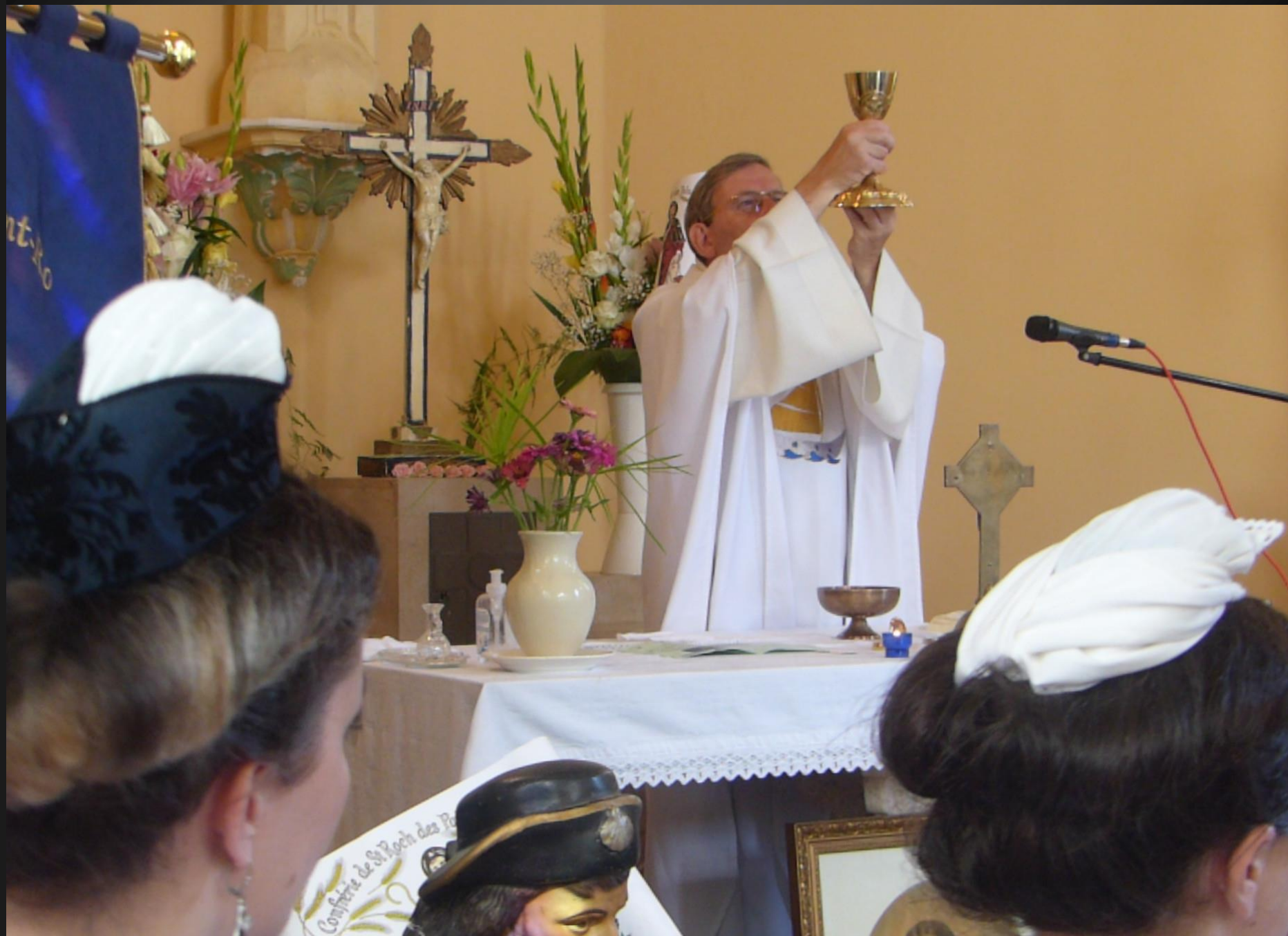
LI PALUN_ Elévation : Consécration du vin qui devient vrai Sang du Christ par la transsubstantiation. (Tambourinaires)