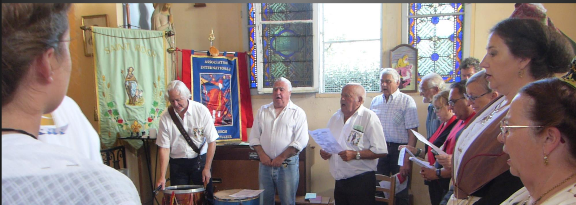
LI PALUN _ Deuxième Lecture, Lettre de saint Paul Apôtre aux Romains 12,1-2. / Acclamation de l'Évangile.