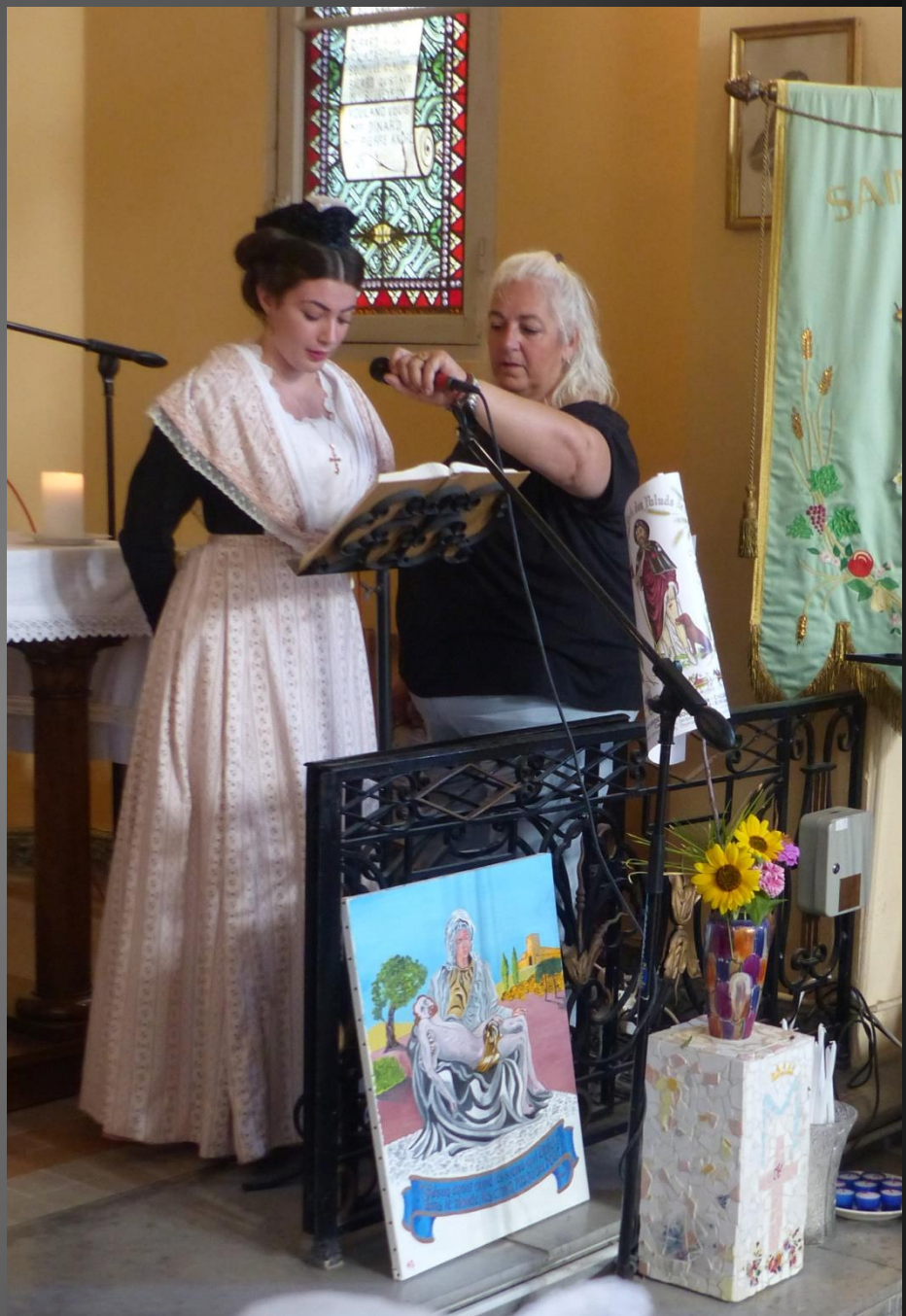
LI PALUN _ Première Lecture, Livre de Jérémie 20,7-9.