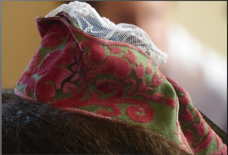
LI PALUN _ Le Ruban du costume d'Arles n'est porté qu'après le rite de passage de la Festo Vierginenco aux Saintes-Maries de la Mer, une journée créée en 1903 par Frédéric Mistral afin de revaloriser le costume d'Arlésienne. VOIR https://www.saintesmaries.com/la-festo-vierginenco