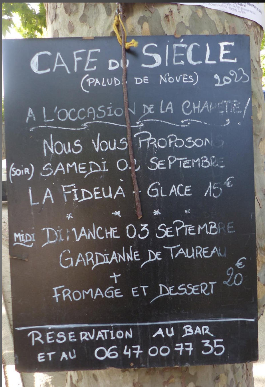
LI PALUN _ Le Café du Siècle, tôt le matin au centre du village.