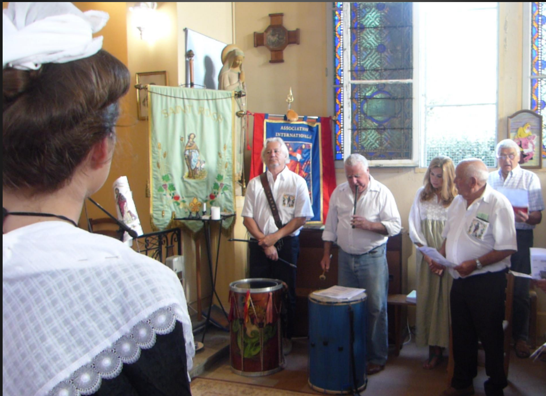
LI PALUN _ Kyrie : « Segnour Dieù, noste paire. Piéta pèr vostis enfant ! »