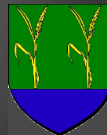
Blason des paluds-de-Noves « De sinople à deux roseaux posés sur une champagne d'azur »