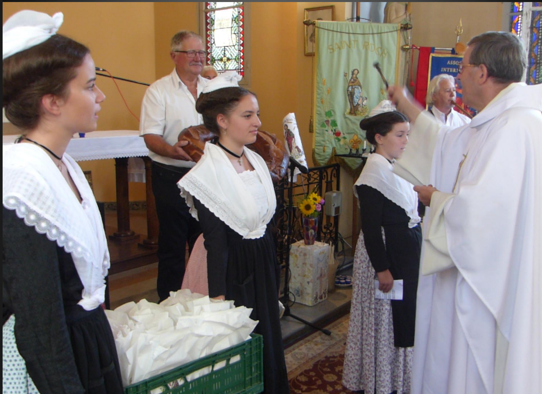
LI PALUN _ Bénédiction des petits pains et de la grande couronne qui sera partagée avec les fidèles.