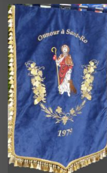
Bannière de la Confrérie de Saint-Roch des Paluds