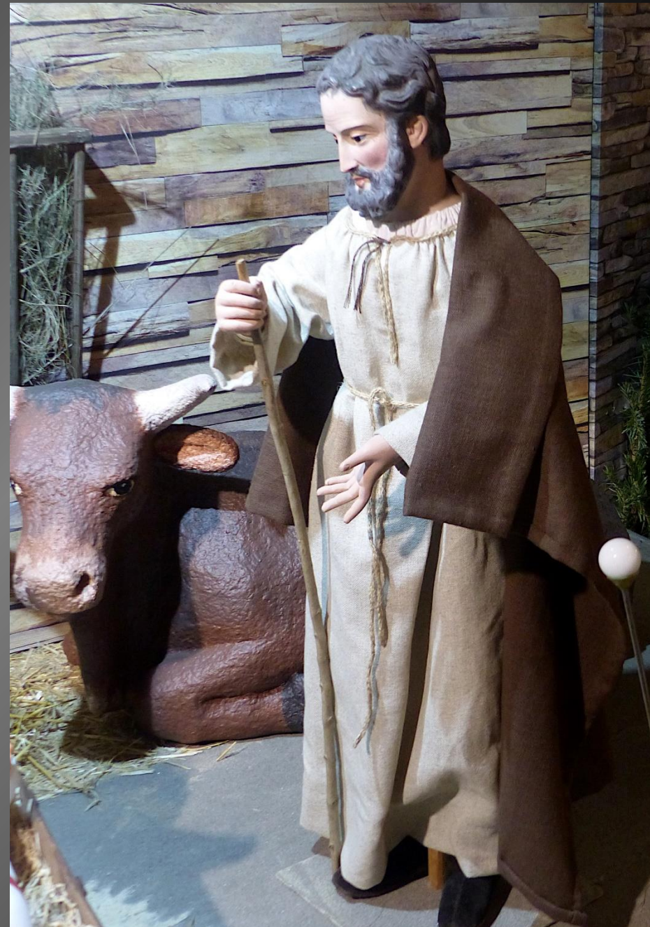
Nativité _ Or, pendant qu'ils étaient là, arrivèrent les jours où elle devait enfanter. Et elle mit au monde son fils premier-né; elle l'emballota et le coucha dans une mangeoire, car il n'y avait pas de place pour eux dans la salle commune. (Luc 2, 7).