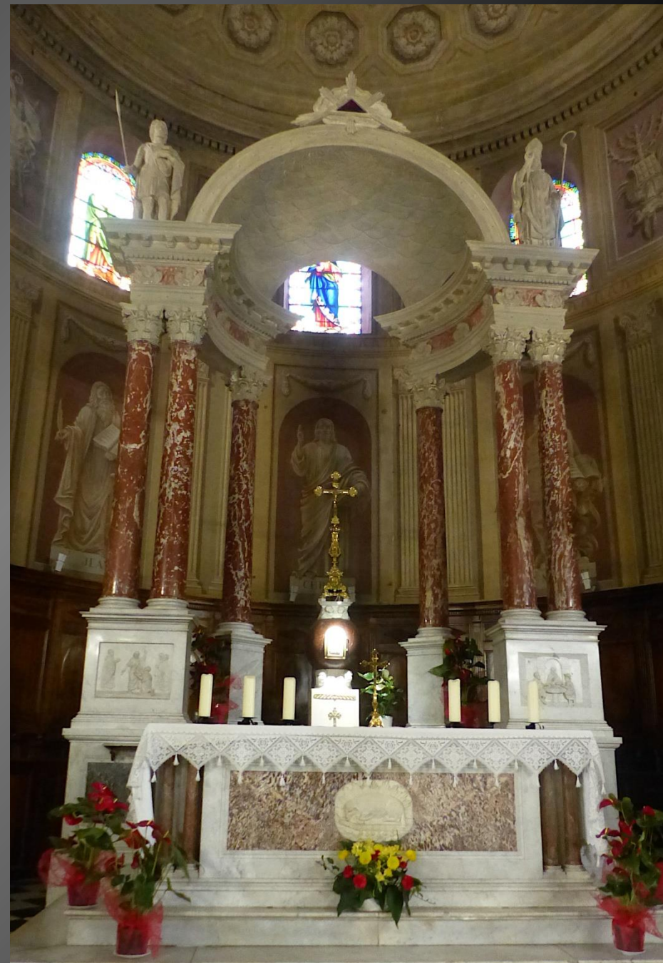
L'autel majeur de l'église Saint-Maurice.