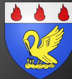
Blason de Pélissanne

D'or au gousset renversé d'azur chargé en cœur d'une fleur de lys du champ surmontée d'un lambel de gueules brochant sur le tout.