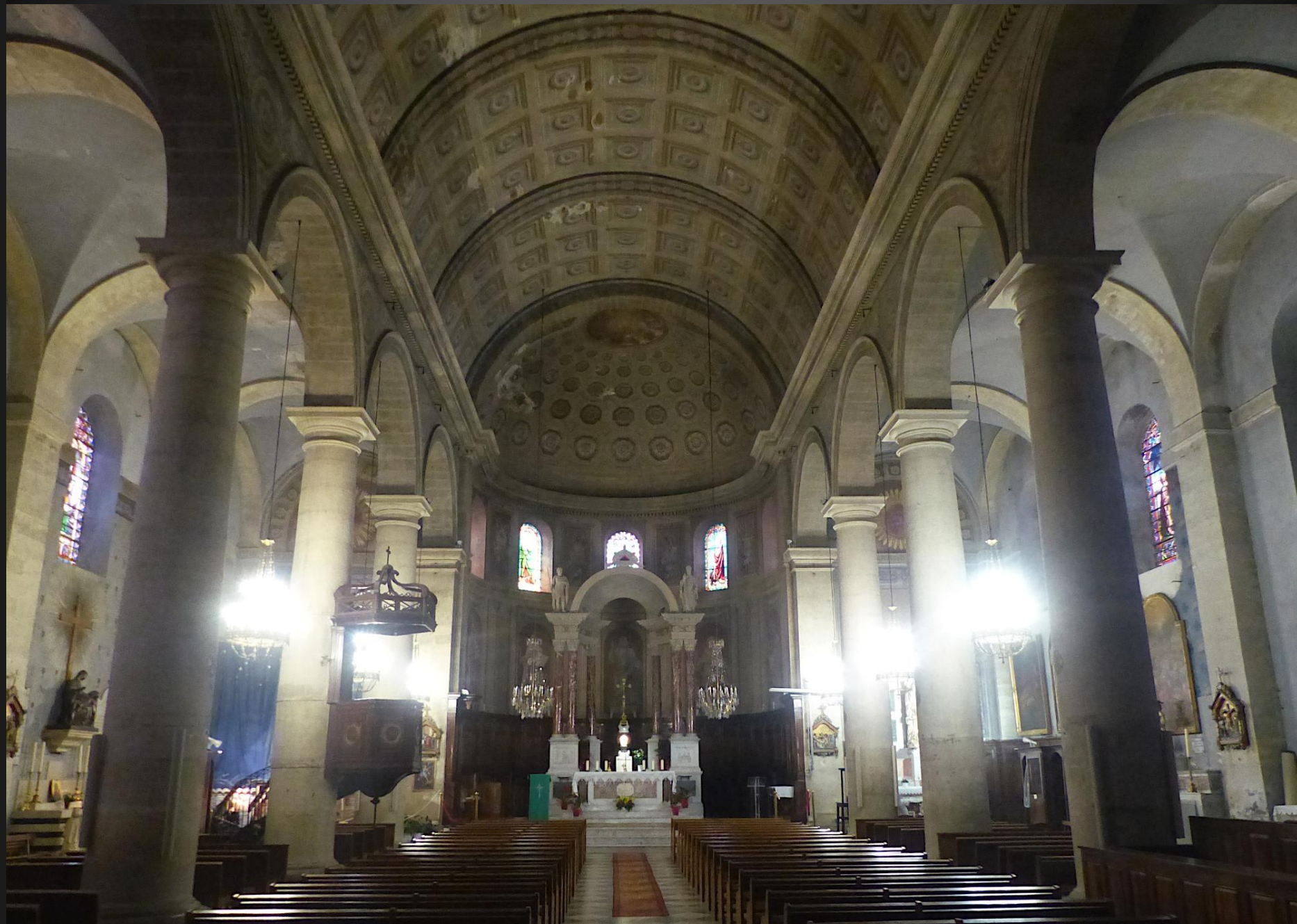
PELISSANNE _ L'église est consacrée à saint Maurice et saint Jean Chrysostome, architecture de style dorique italien datant de 1824 et rappelant les temples antiques. La nef centrale est imposante, 42m de long, 27 m de large et 17m de haut sous la voûte. Inscription MH en 1994. Le visiteur monte vers le chœur sous le regard bienveillant d'une multitude de Saints, en sculpture ou en vitrail dans les collatéraux...