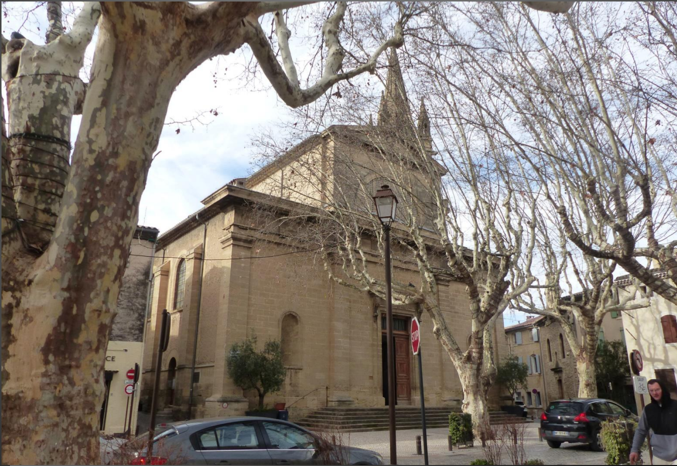
PELISSANNE _ L'église Saint-Maurice.