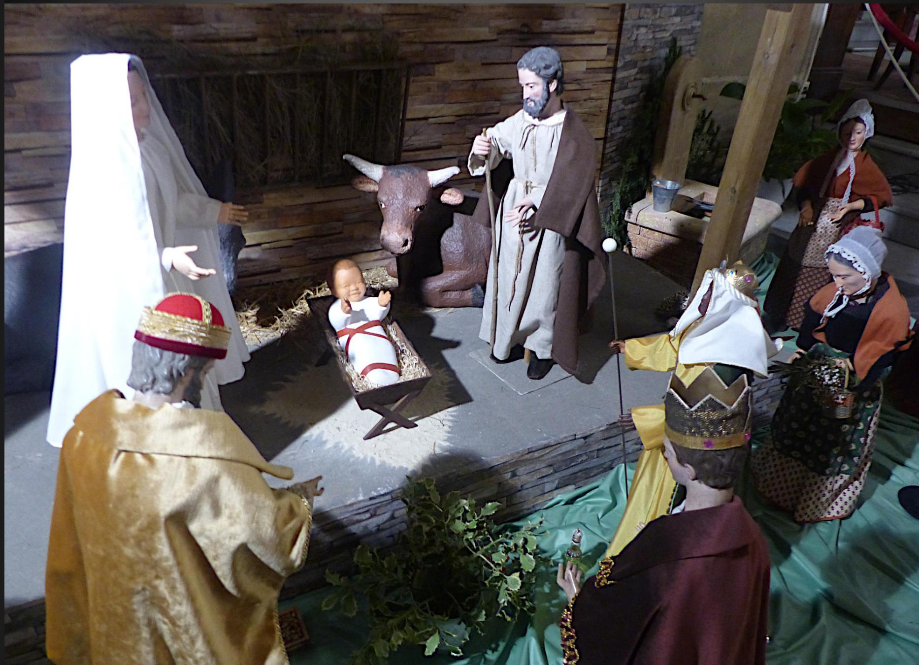
Les rois mages Gaspard, Melchior et Balthazar ont suivi l'étoile jusqu'à l'étable de Bethléem pour se prosterner devant le Roi des Juifs et lui offrir des présents royaux.