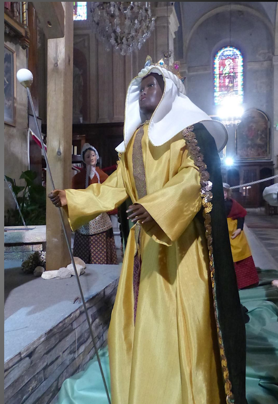
Le roi mage Balthazar, « au visage noir et portant également toute sa barbe » selon Bède le Vénérable, offre la myrrhe et représenterait l'Afrique.