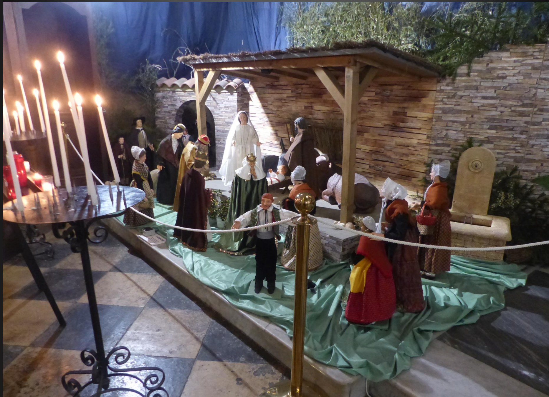
Beaucoup de bougies allumées devant la crèche qui représente la « Bonne Nouvelle » et l'ultime espérance d'une humanité souffrante et parfois désespérée devant le Mal omniprésent.