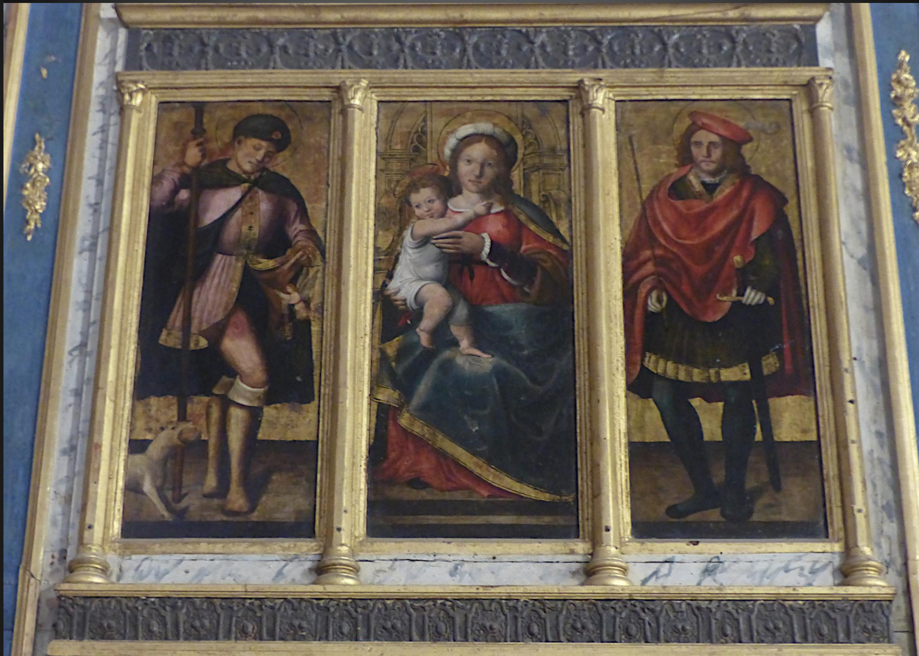
Eglise Saint Maurice, collatéral gauche _ Le retable en triptyque de l'autel St Roch, œuvre sur bois de la fin du XVe s. classée MH, sur laquelle figurent une Vierge à l'Enfant (panneau central), Saint-Roch (celui de gauche) et Saint-Sébastien (celui de droite). Ce triptyque fut probablement commandé pendant l'épidémie de peste.