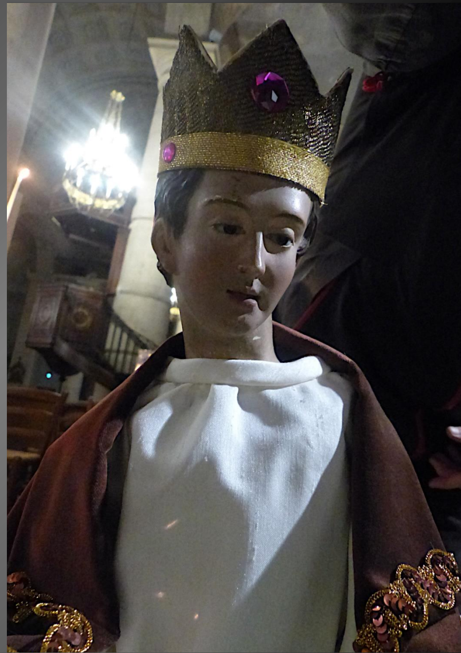
Le roi mage Gaspard « jeune encore, imberbe et rouge de peau », selon Bède le Vénérable, offre l'encens, en tant que roi en Inde.