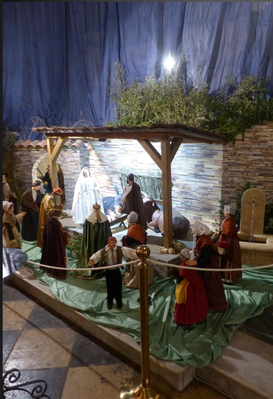
La crèche provençale, située sur la gauche du chœur, avec de très grands santons habillés.