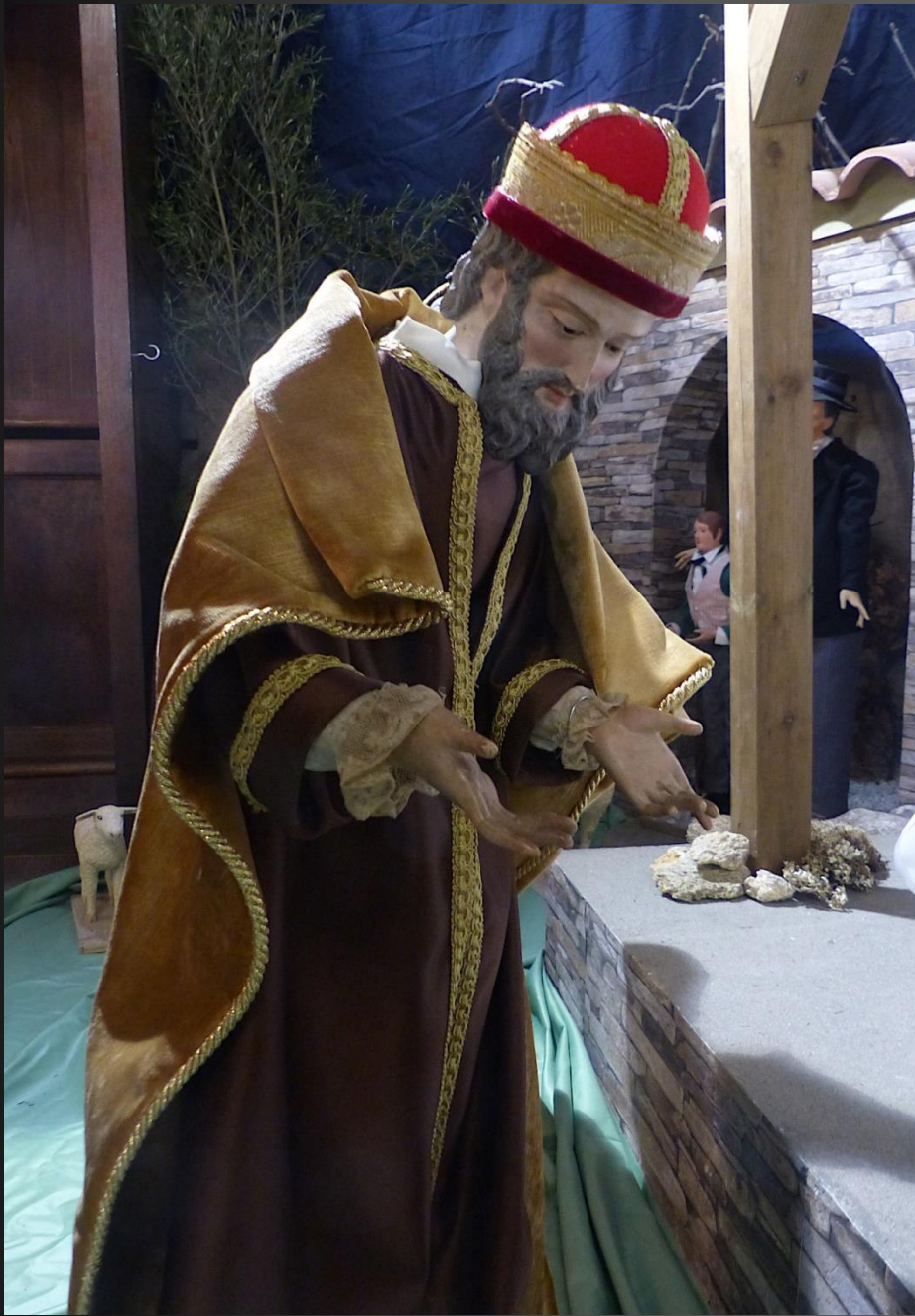
Le roi mage Melchior, « un vieillard à cheveux blancs et à la barbe longue », selon Bède le Vénérable, offre l'or et aurait été roi des Perses.