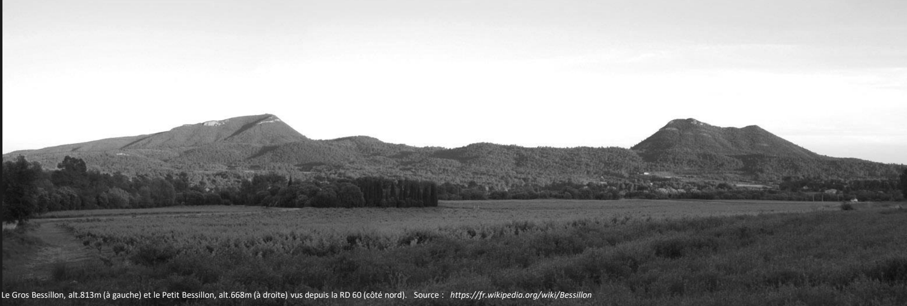
Le Gros Bessillon, alt.813m (à gauche) et le Petit Bessillon, alt.668m (à droite) vus depuis la RD 60 (côté nord).