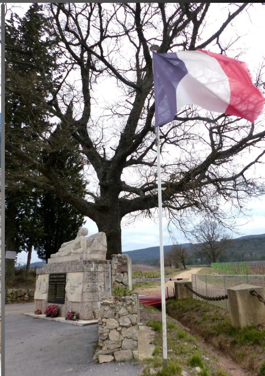
MÉMORIAL DE BESSILLON _ Le Bessillon a été un haut-lieu de la Résistance, pour sa situation isolée et très boisée. Le 27 juillet 1944, 8 maquisards et 10 otages sont tombés ici sous les balles des nazis et de la milice française. Ce monument aux héros et martyrs du Bessillon, œuvre du sculpteur Victor Nicolas, a été érigé au bord de la route D 560, entre Pontevès et Cotignac.