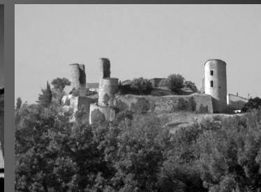
Le château de Pontevès

Document créé par le webmaster pour le site www.webmaster2010.org