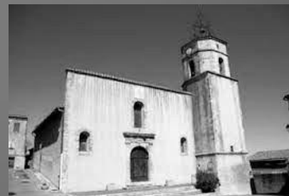
L'église Saints-Gervais-et-Protais de Pontevès

Blason de Pontevès : De gueules au pont de deux arches, alésé, d'or maçonné de sable