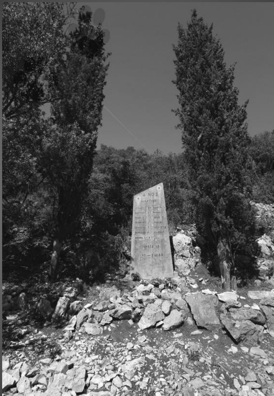
STELE COMMEMORATIVE sur le lieu de la bataille dans le maquis du Gros Bessillon du 27 juillet 1944. Dédicace : « A nos martyrs »

Image prise dans la partie haute du vallon de Valaurie, à l'est du sommet du Gros Bessillon .