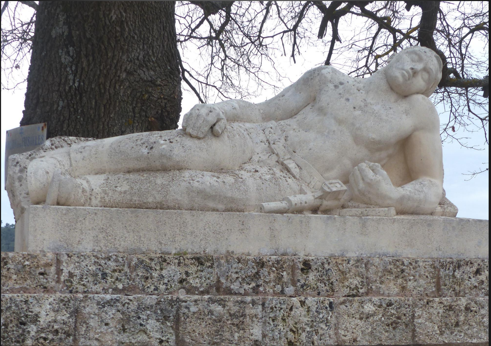
Monument aux Morts de la Résistance, Pontevès