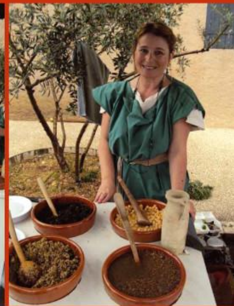
De la bonne pitance romaine: lentilles, pois chiches et purée d'olive aux épices préparée selon les indications de Caton l'Ancien