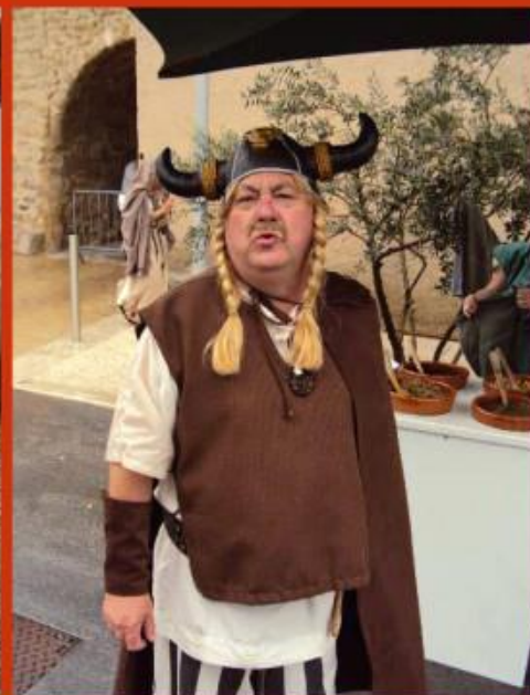
Pas de romains sans nos ancêtres, qui n'étaient pas cornus, seulement coquets...