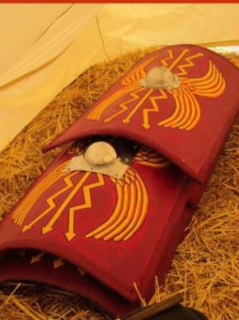
Boucliers de légionnaires