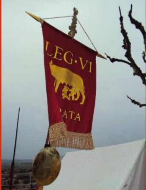
Bannière de la Légion VI