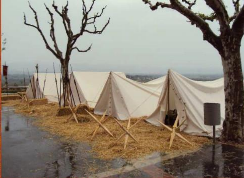
Campement de la Légion VI, sous un ciel lourd, typique de la Britannia plutôt que de la Provincia