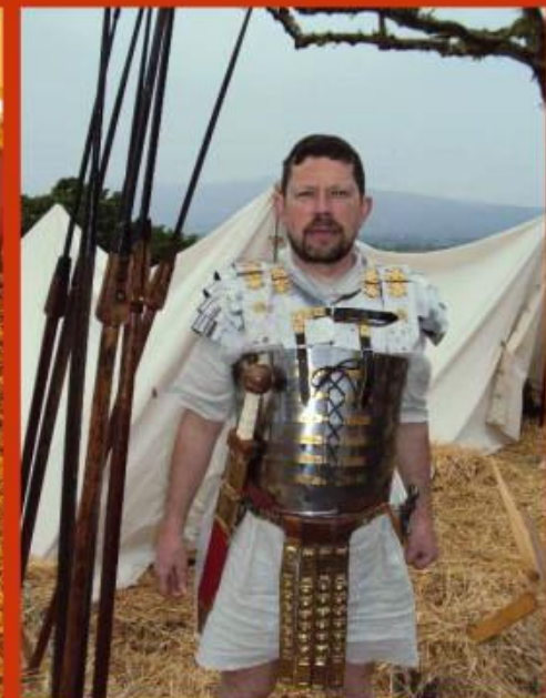
Légionnaire en repos, aussi webmaster pour legio6.com dans le civil