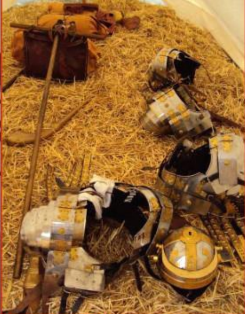
Casque, cuirasse et barda du légionnaire, sous la tente