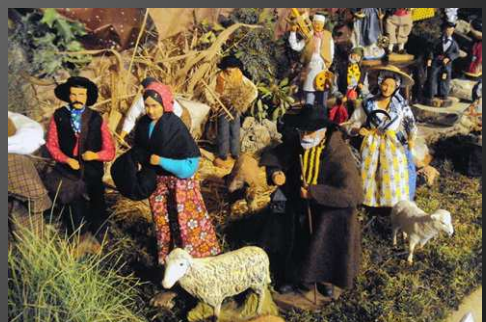
Un vrai livre d'histoire pour jeunes et moins jeunes, avec tous les métiers de l'époque de Louis-Philippe, début XIXe siècle, lorsque Jean-Louis Lagnel créa à Marseille le santon de Provence en argile non cuite, fabriqué avec des moules..