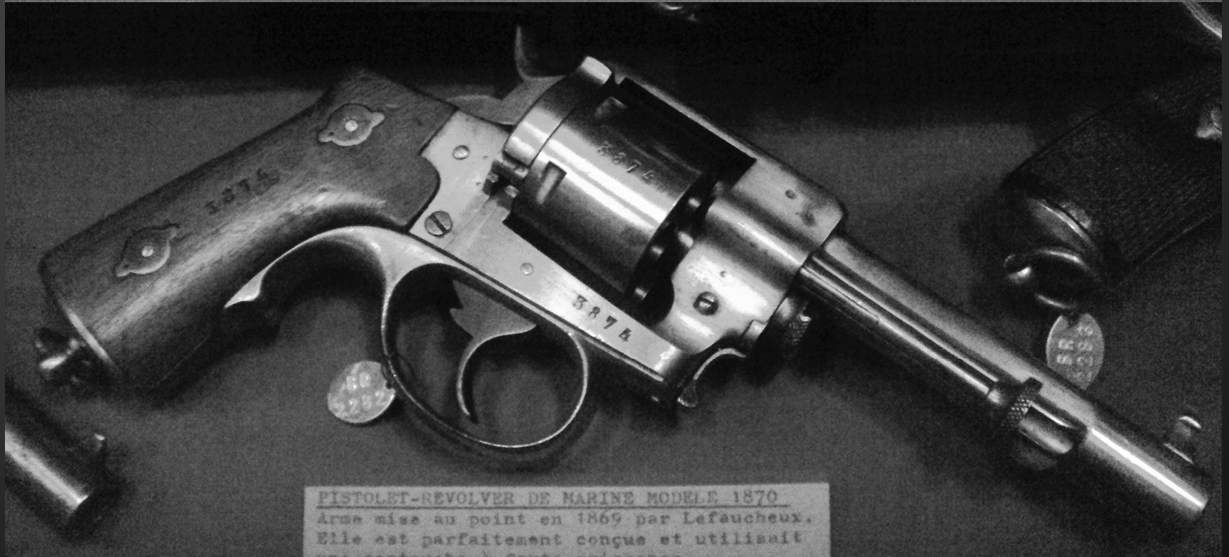
PISTOLET-REVOLVER DE MARINE MODELE 1870 Arme mise au point en 1869 par Lefauchaux. Elle est parfaitement conçue et utilisait une cartouche à forte puissance.

Pistolet-revolver Marine, Modèle 1870. Arme mise au point en 1869 par Lefauchaux. Elle est parfaitement conçue et utilisait une cartouche à forte puissance. Capacité 6 coups.