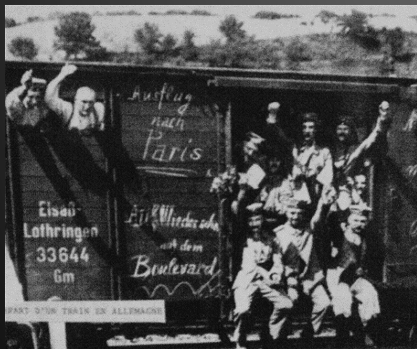
Départ d'un train en Allemagne.