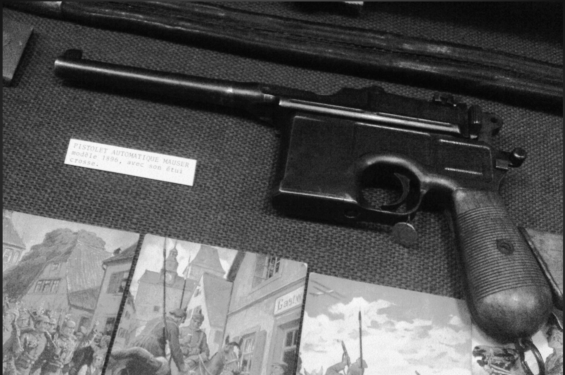
PISTOLET AUTOMATIQUE MAUSER modèle 1896, avec son étui crosse.

Pistolet Mauser, Modèle 1896, avec son étui crosse. Le Mauser C96. Ce pistolet semi-automatique allemand développé à partir de la fin du XIXe siècle devient quasi-réglementaire quand l'armée prussienne commande au fabricant 150 000 pièces en 1916. La production se poursuivra jusqu'en 1938. L'étui-crosse est un ingénieux système permettant de transformer ce pistolet semi-automatique en petite carabine. Ce choix pour une arme de poing était judicieux, avec la cartouche adaptée au tir à longue distance, le 7,63 Mauser. Cependant, afin de rationaliser la fourniture de munitions, les C96 de la série spécifique 1916 sont chambrés en 9 mm Parabellum. L'Empereur Guillaume II d'Allemagne et Winston Churchill avaient tous deux choisi le Mauser C96 comme arme personnelle, de même que Joseph Vissarionovitch Djougachvili (Joseph Staline) pendant son activité de braqueur de banques dans les années 1900...