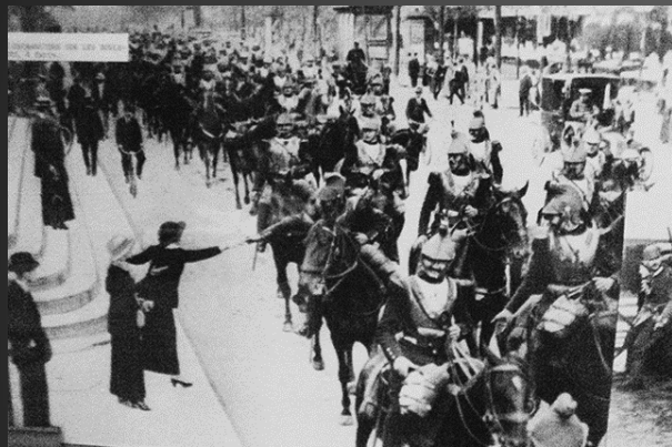
Les Cuirassiers sur les Champs-Élysées à Paris.

La mobilisation représente donc une opération d'une ampleur et d'une complexité jusqu'alors inconnues. Elle s'effectuera de part et d'autre suivant un programme minutieusement établi et sous la protection aux frontières de « troupes de couverture ».