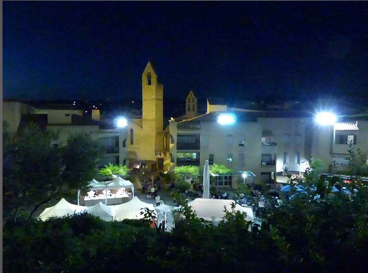
Place des Centuries la nuit, en arrière-plan, l'église Saint-Michel (début XIIIe s.) art roman, début du gothique. Classée M.H. 1983.