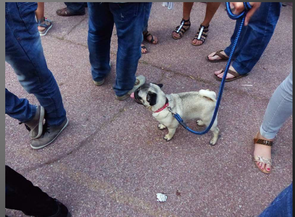
Nostradamus, le grand organisateur de la soirée, semble intrigué par la présence d'un petit « canis lupus », venu avec son maître... il a pourtant l'air inoffensif. Mais l'astrologue croit aux signes, notamment dans le ciel.