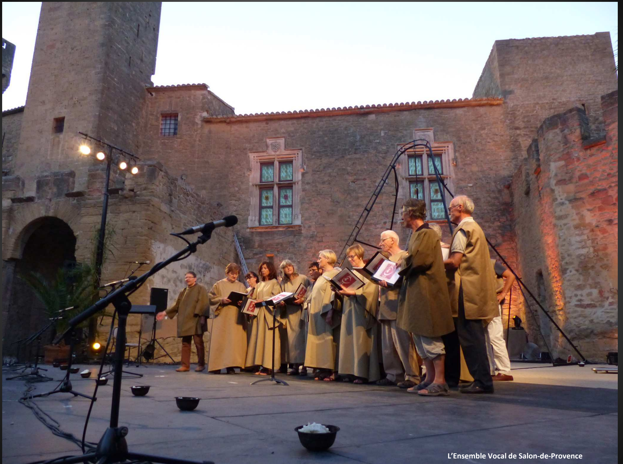
L'Ensemble Vocal de Salon-de-Provence