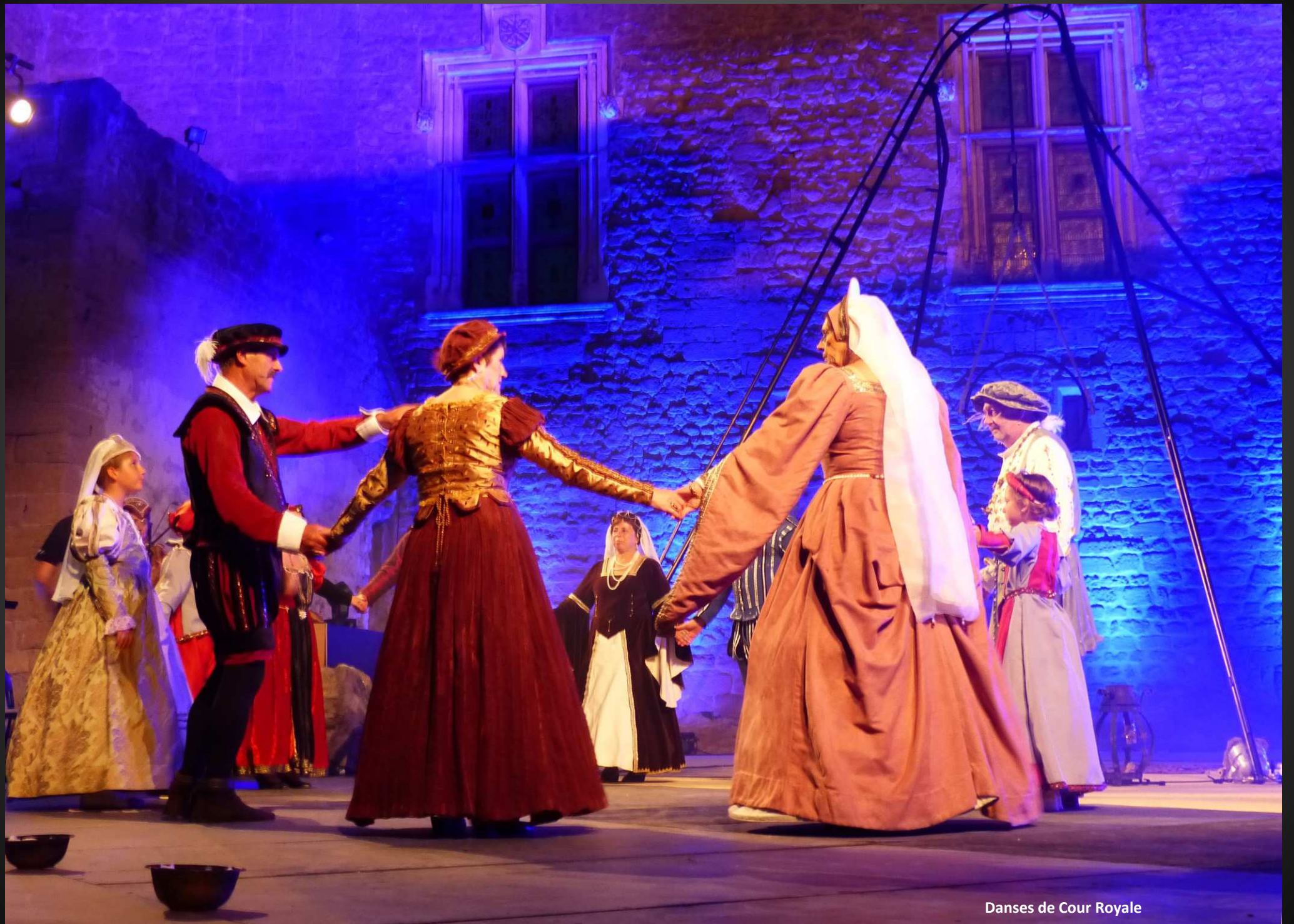
Danses de Cour Royale