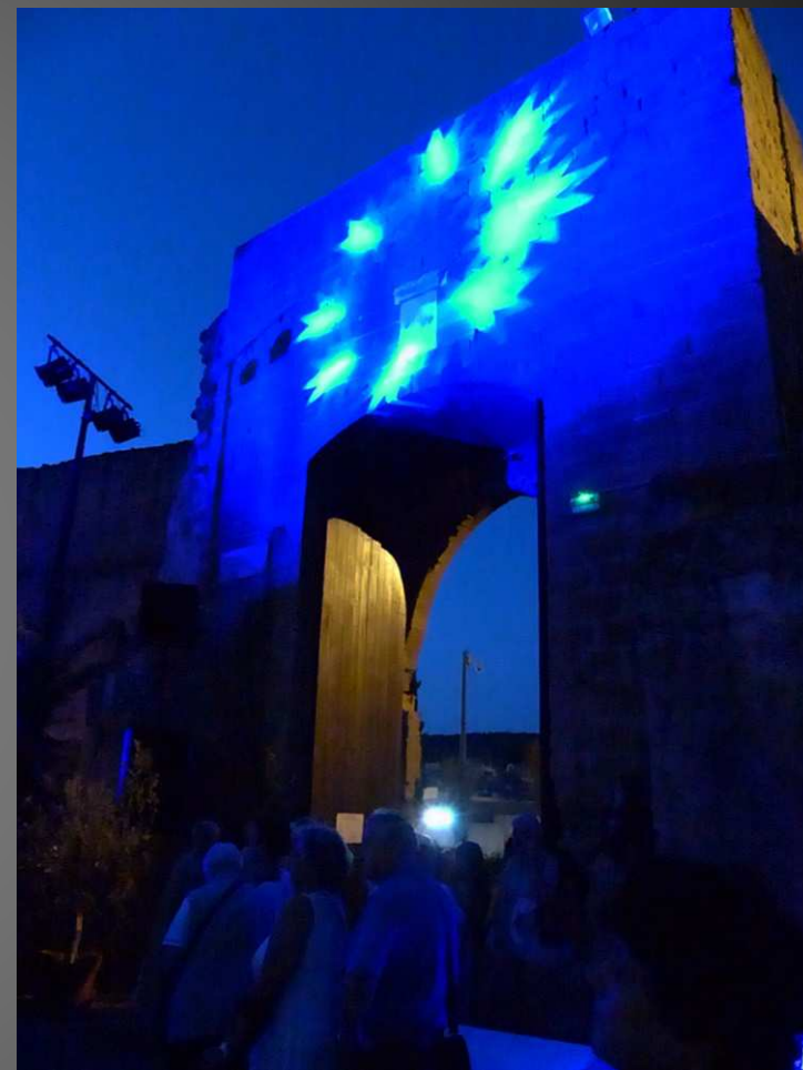
Après les chants du Moyen-Age et de la Renaissance par l'Ensemble Vocal de Salon, les Danses de Cour Royale vont interpréter des danses de la Renaissance, françaises et italiennes.