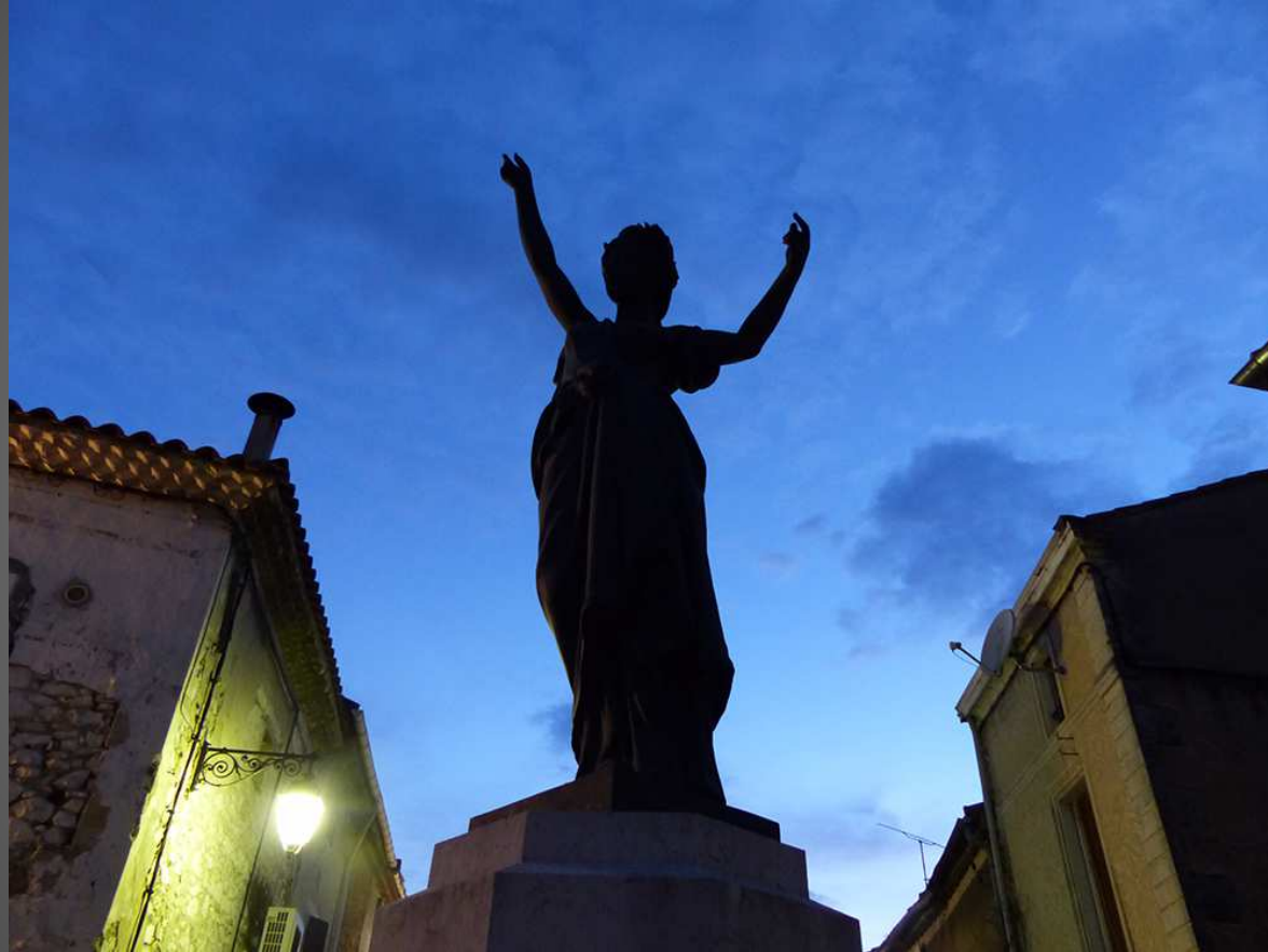
Saint-Andiol : fontaine inaugurée le 14 juillet 1904.