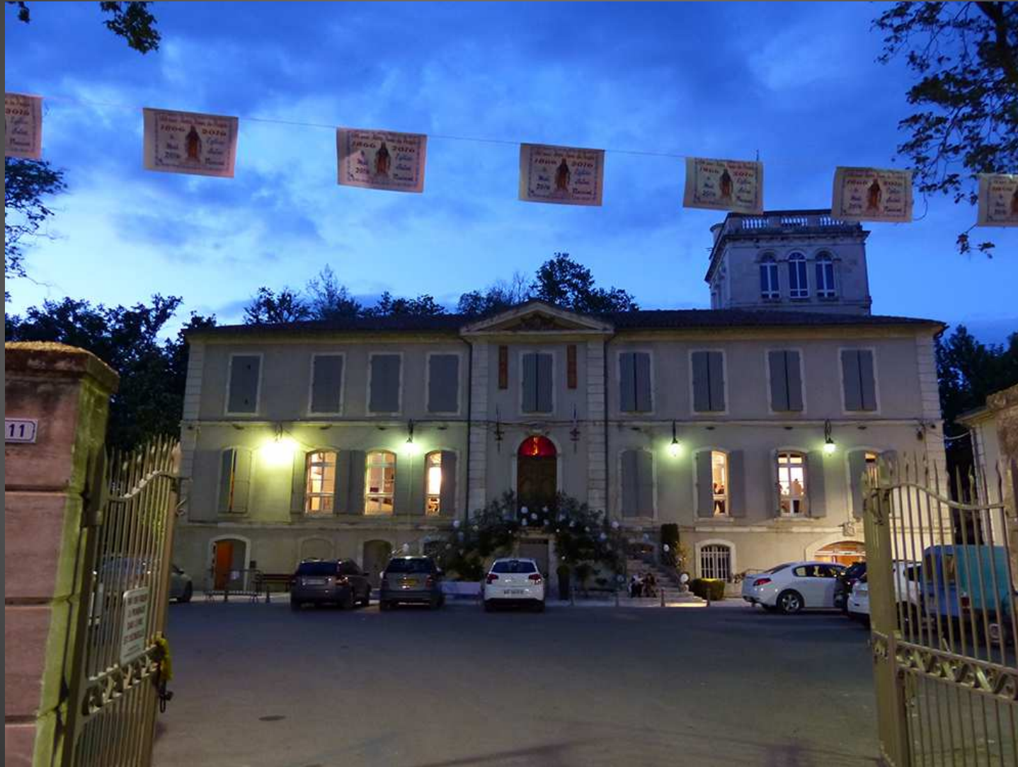
Le château de saint-Andiol : cette ancienne grande demeure a successivement appartenu aux familles d'Albe, de Varadier et d'Estourmel . Il est aujourd'hui centre socio-culturel, le phare intellectuel et le gardien des traditions du village de Saint-Andiol.