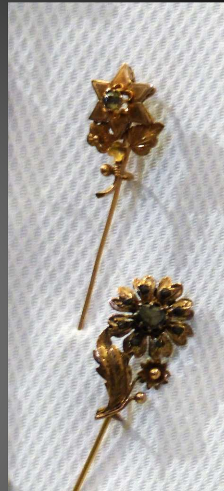
Belles broches d'Arlésiennes utilisées pour tenir le ruban autour des cheveux.

NOTE / Outre les décorations ci-dessus, il y avait aussi sur l'écharpe blanche de Notre-Dame une Croix de Guerre 14-18, une Médaille Militaire « Second Empire » (en vigueur de 1852 à 1870), et une Médaille Militaire « République » (en vigueur depuis 1870).