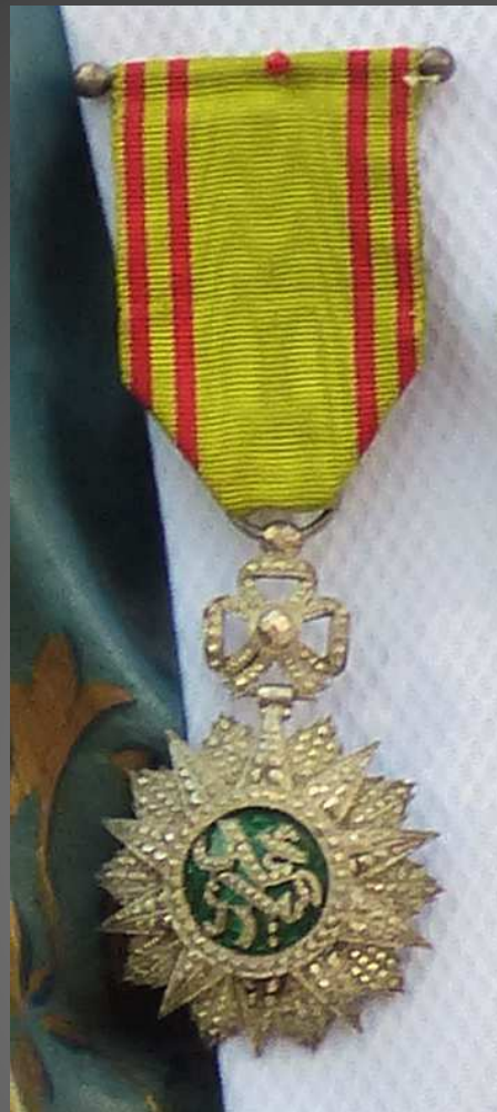
Décoration : Chevalier de 1ere classe de l'ordre tunisien du NICHAN IFTIKHAR (Ordre de la Gloire), décerné de 1837 à 1957.