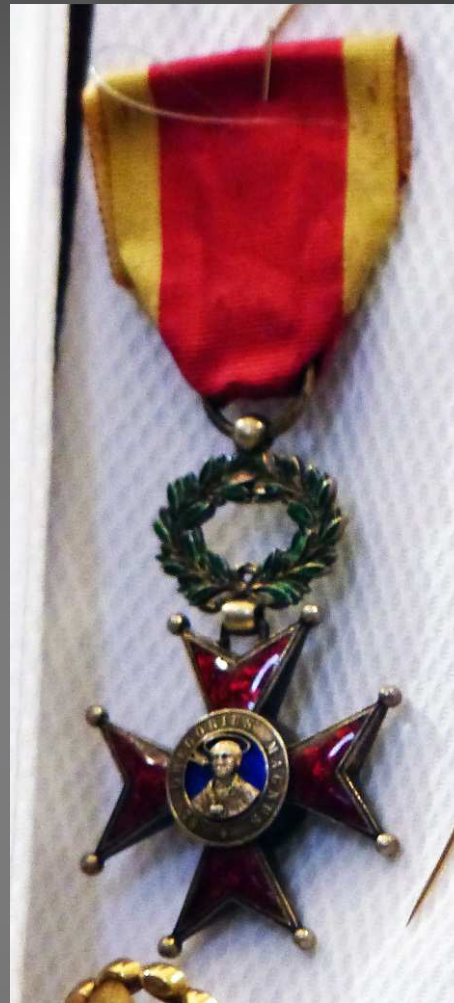
Décoration vaticane : probablement une variante de la croix Pro Ecclesia et Pontifice , créée par le Pape Léon XIII en 1888.