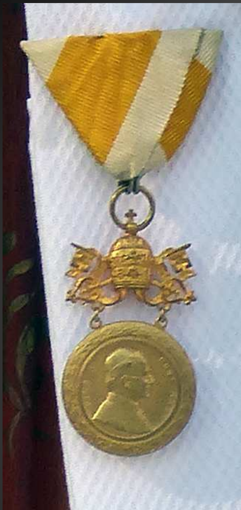
Décoration vaticane : Ordre de Saint Grégoire le Grand (chevalier), créé en 1831 par le pape Grégoire XVI.