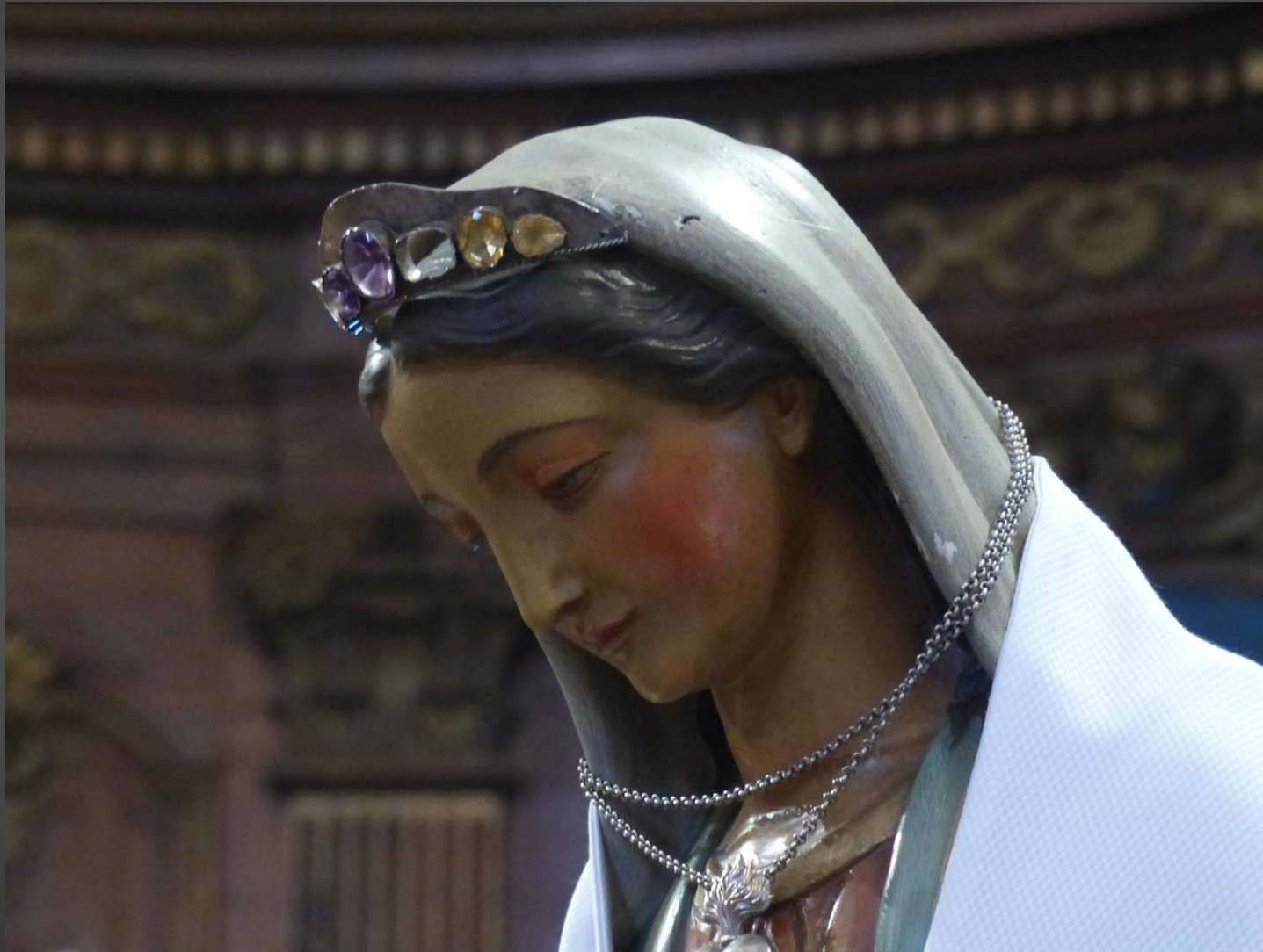
La statue de Notre-Dame du Peuple