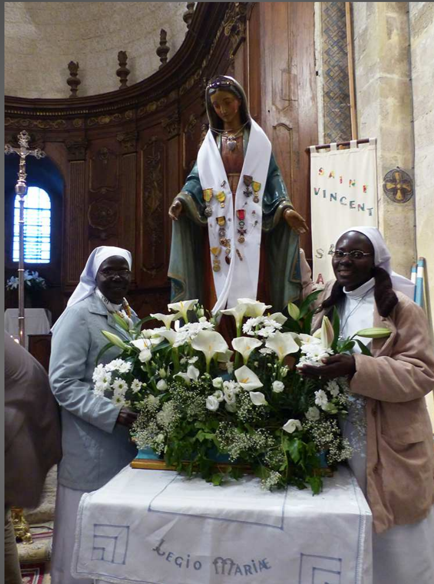
Avec Notre-Dame du Peuple, les sœurs de la congrégation des Filles du Saint Cœur de Marie (Sénégal), récemment installées à Mollégès.