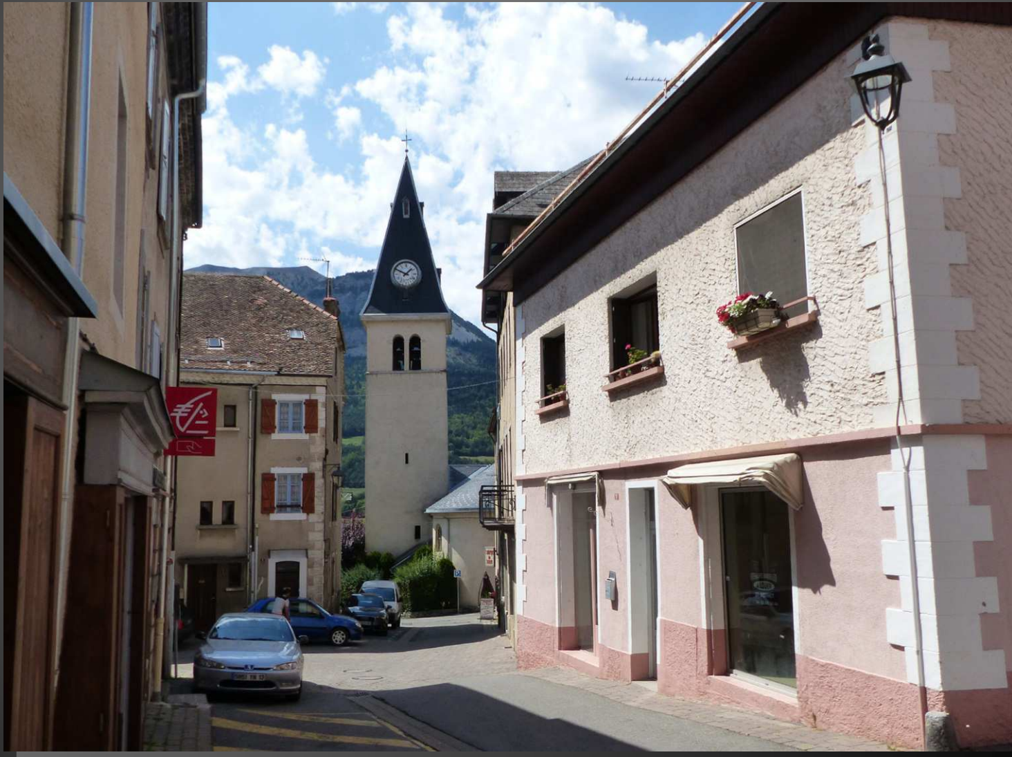
ST BONNET-EN-CHAMPSAUR (alt. 1025m) _ Eglise Saint-Bonnet, dans le bourg médiéval