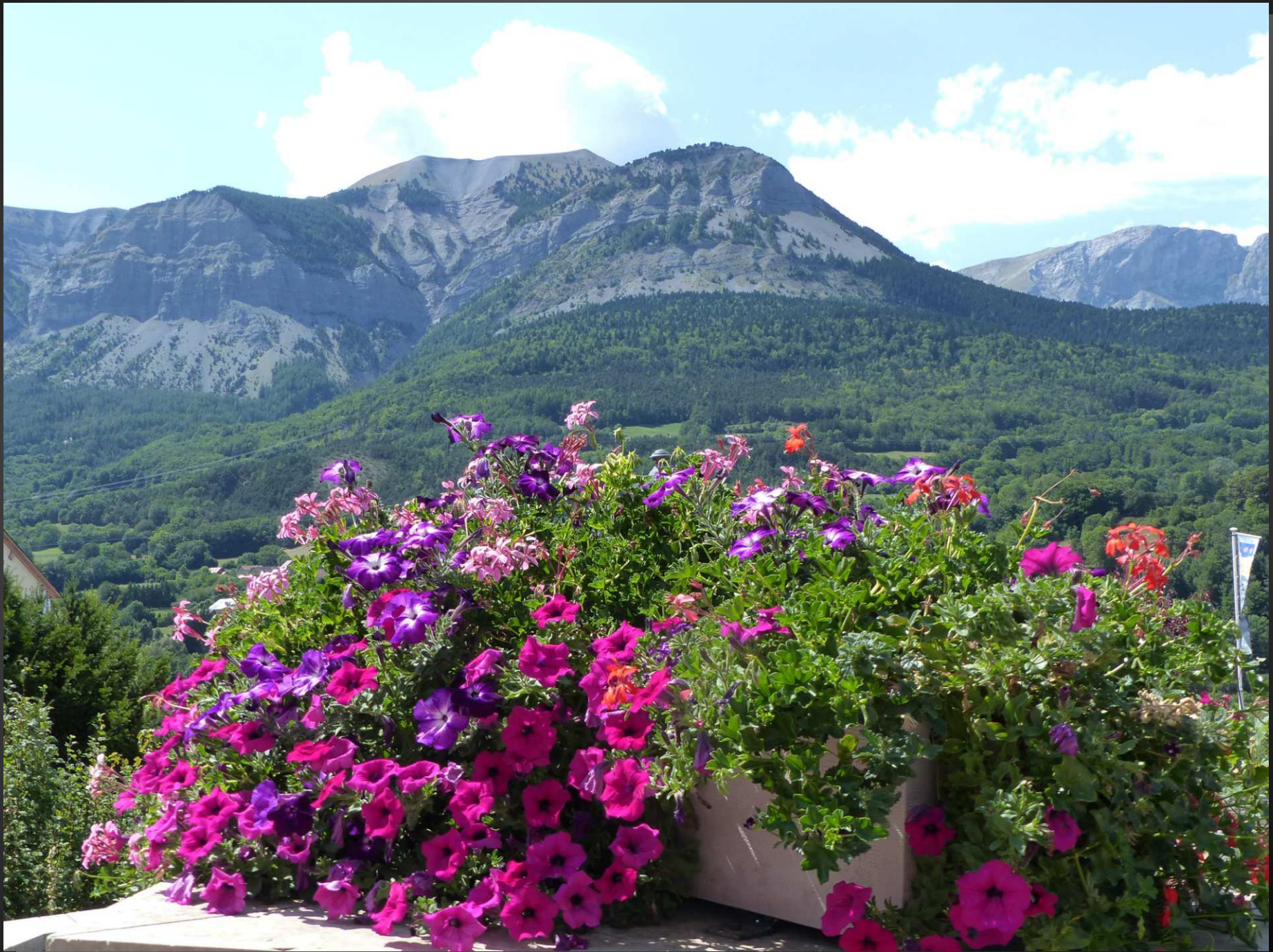
ST BONNET-EN-CHAMPSAUR _ Depuis le parvis de l'église, la vue sur le massif du Dévoluy est somptueuse.