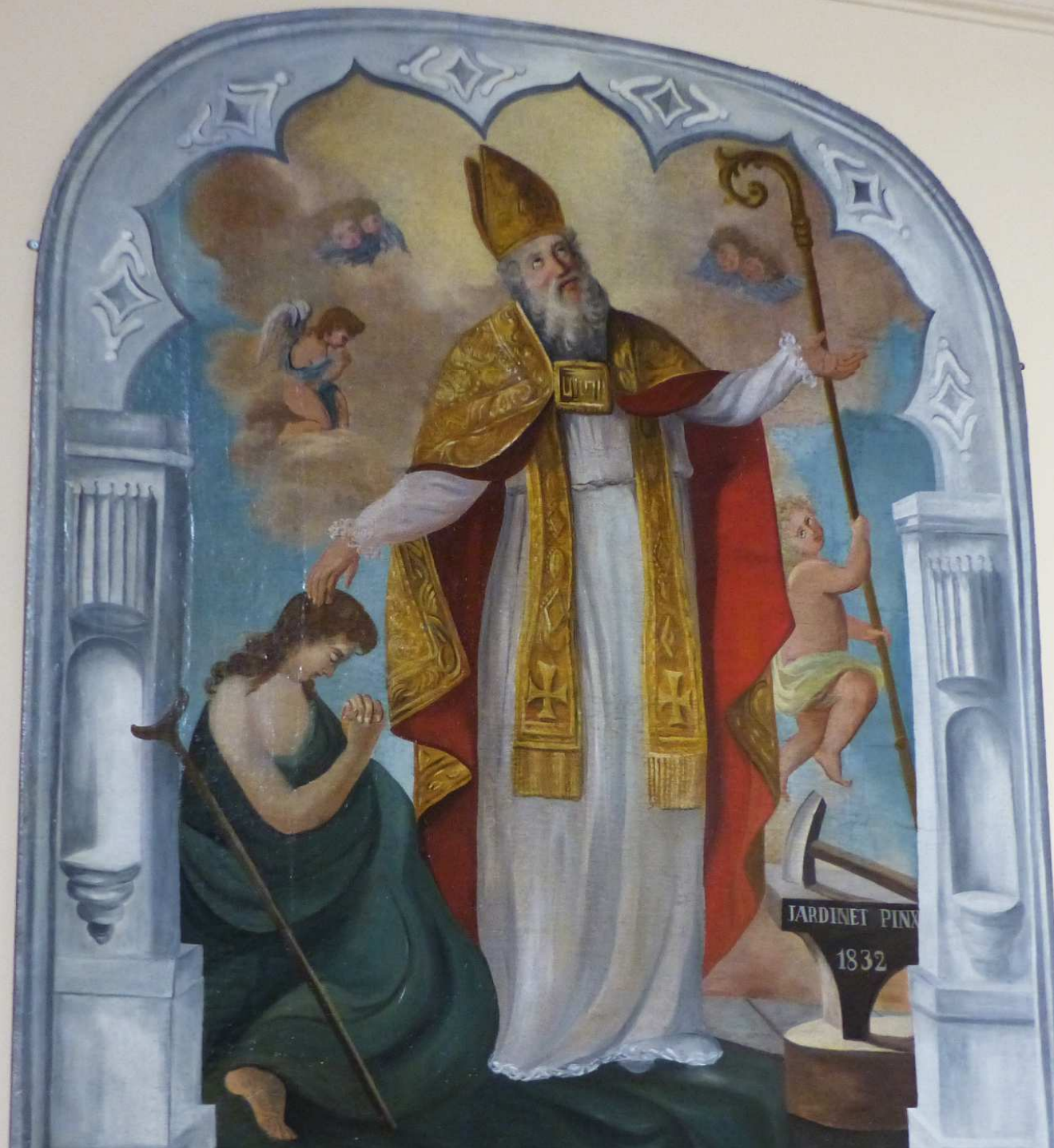
ST BONNET-EN-CHAMPSAUR _ Fresque représentant saint Bonnet en évêque, datée de 1832.