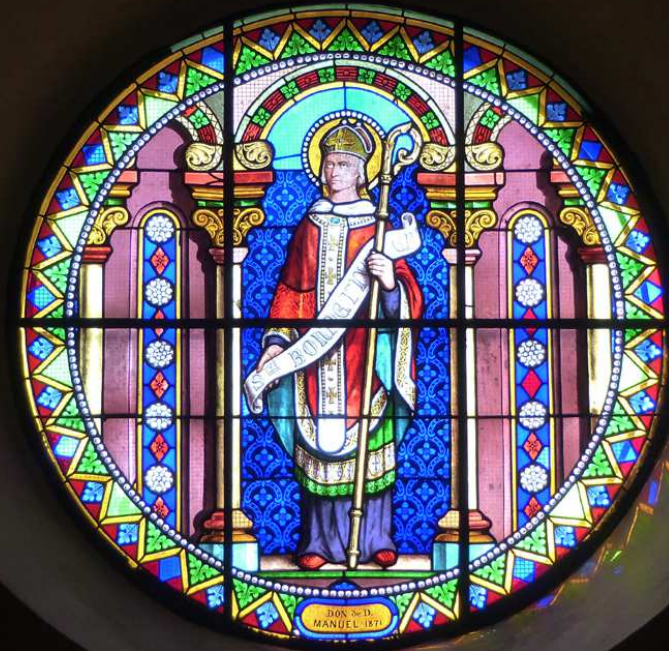
Vitrail de saint Bonnet, patron de la paroisse.