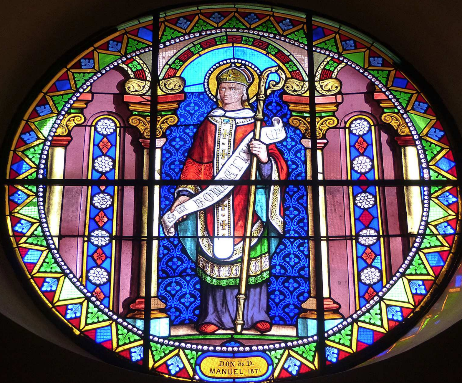
ST BONNET-EN-CHAMPSAUR _ Le grand vitrail représentant saint Bonnet avec sa crosse d'évêque est l'un des quatre vitraux circulaires illuminant l'intérieur de l'église.