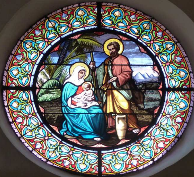
Vitrail de la fuite en Egypte de la Sainte Famille.