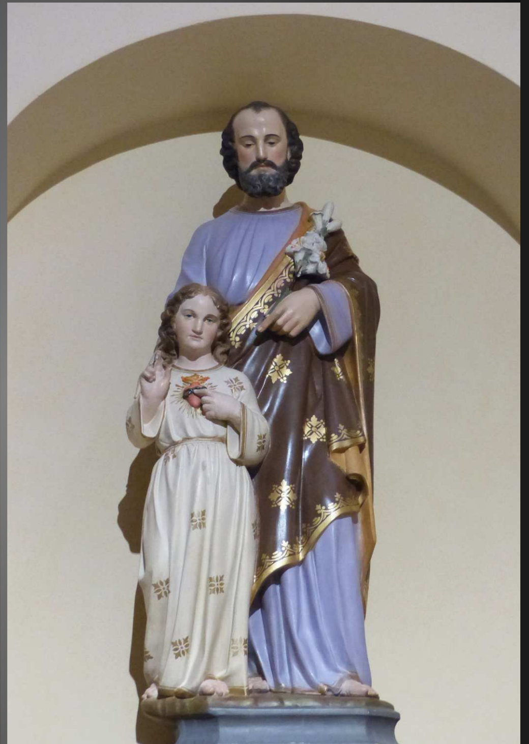
ST BONNET-EN-CHAMPSAUR_ Belle statue de saint Joseph, patron de l'Eglise universelle, avec son fils Jésus adolescent montrant son Cœur sacré...