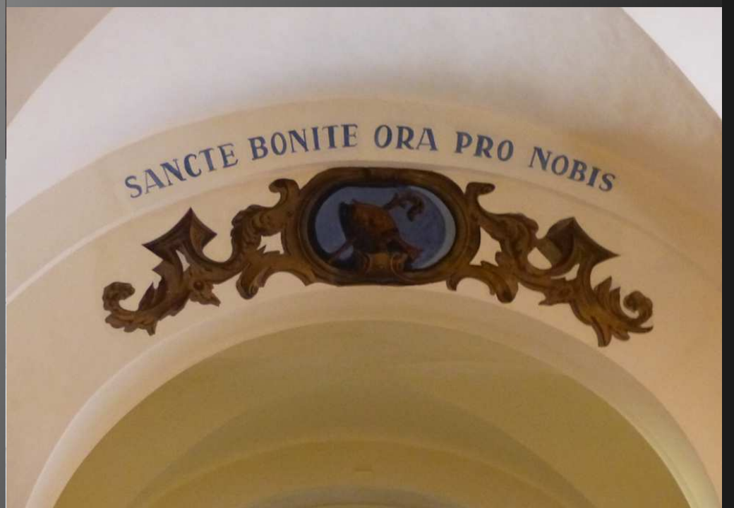
ST BONNET-EN-CHAMPSAUR _ Inscription sur l'arc triomphal, au-dessus du chœur : "SANCTE BONITE ORA PRO NOBIS" ( saint Bonnet priez pour nous) avec la crosse et la mitre en médaillon. Saint Bonnet (623-710) fut évêque de Clermont et finit ses jours comme simple moine dans l'abbaye de Manlieu. 39 localités en France, principalement en Auvergne, se sont placées sous son patronage.