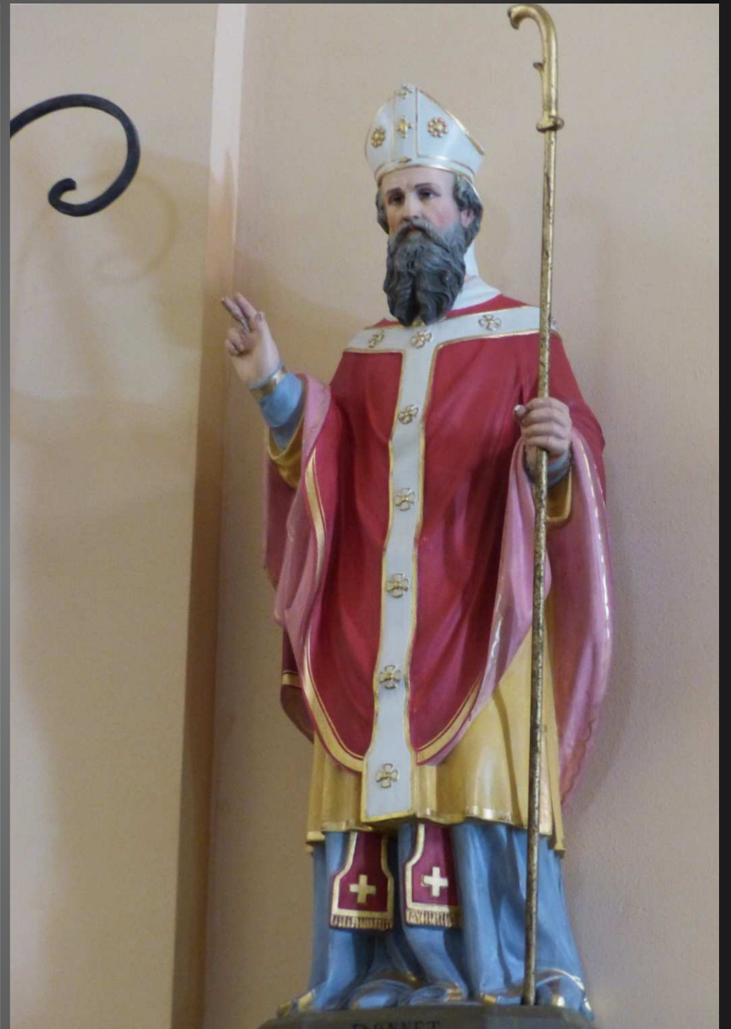
ST BONNET-EN-CHAMPSAUR_ Statues de la Vierge à l'Enfant et de saint Bonnet en habit d'évêque.