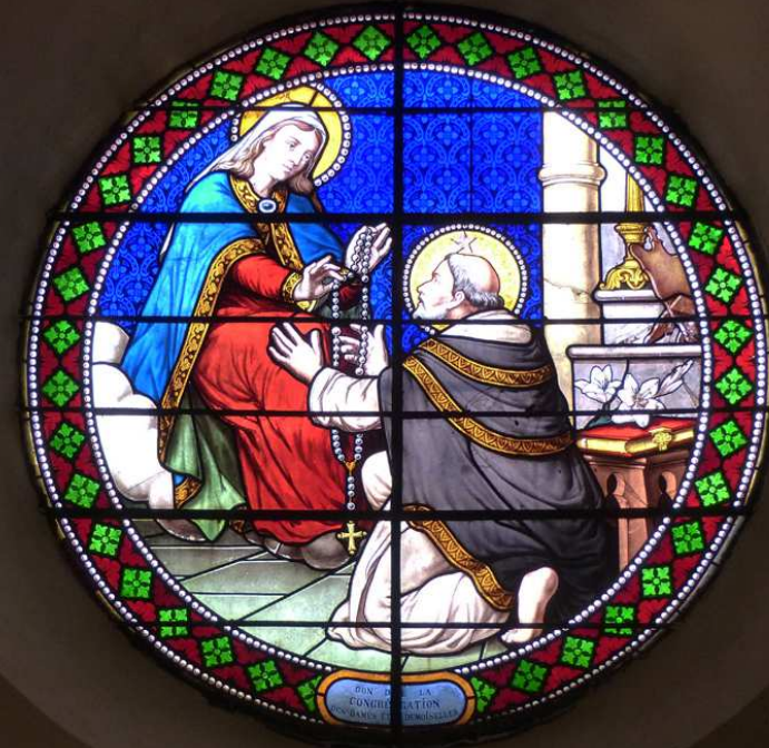
Vitrail de saint Dominique recevant le Rosaire des mains de Notre-Dame en l'an 1208.