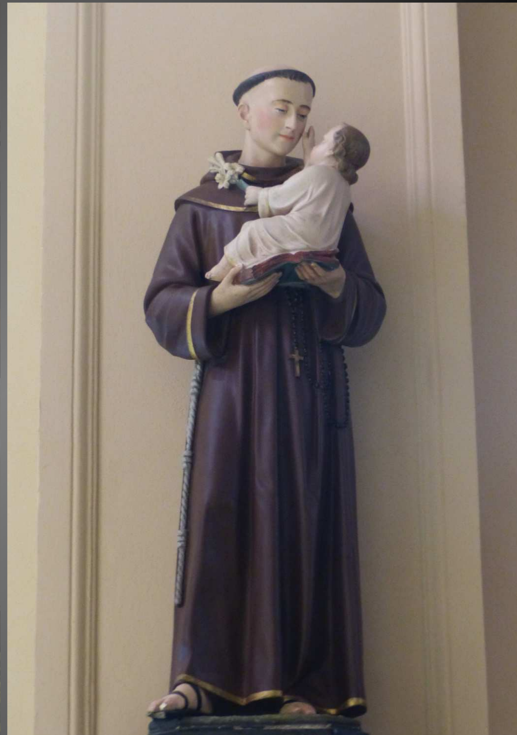
ST BONNET-EN-CHAMPSAUR _ La paroisse de Saint-Bonnet est mentionnée dès le XIIe siècle ; la partie la plus ancienne de l'église (en haut à g.) correspond à la Chapelle des Pénitents, édifée probablement par l'abbaye de Saint-Victor de Marseille, qui y a implanté un prieuré au XIe siècle ; de 1836 à 1920, la Chapelle des Pénitents est séparée de l'église pour être réservée à la Confrérie des Pénitents, dont les membres assuraient l'ordre pendant les offices, chantaient et portaient secours aux plus miséreux. Ils portaient les morts en terre également. Statue de saint Antoine de Padoue (à dr.)