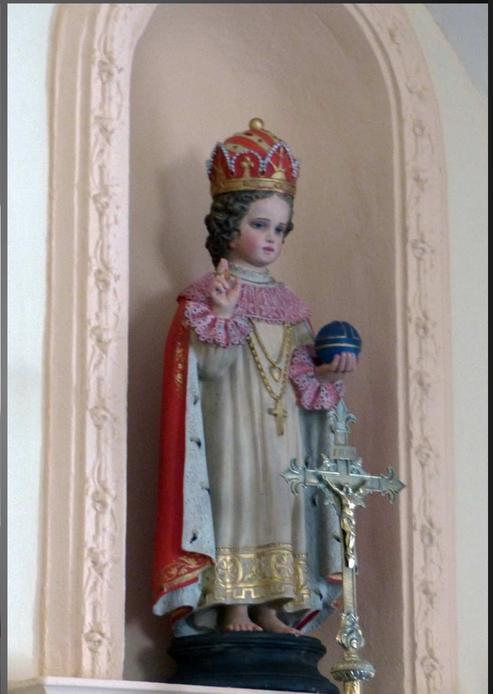
ST BONNET-EN-CHAMPSAUR _ Les initiales JHS sont une autre forme du monogramme IHS, abréviation du nom de Jésus en grec. Statue de l'Enfant-Jésus de Prague, coiffé d'une couronne et levant la main droite en signe de bénédiction tandis qu'il soutient le globe terrestre de sa main gauche. La statuette est également. Le globe et la couronne, symboles royaux, manifestent la toute-puissance de Jésus qui est également le fondateur et le protecteur du Royaume de Dieu. La statuette est revêtue de tenues brodées qui lui sont offertes par des fidèles en signe d'action de grâce, c'est-à-dire pour remercier l'Enfant-Jésus de grâces obtenues. Voir l'histoire de l'Enfant-Jésus de Prague : https://fr.wikipedia.org/wiki/Enfant_J%C3%A9sus_de_Prague .