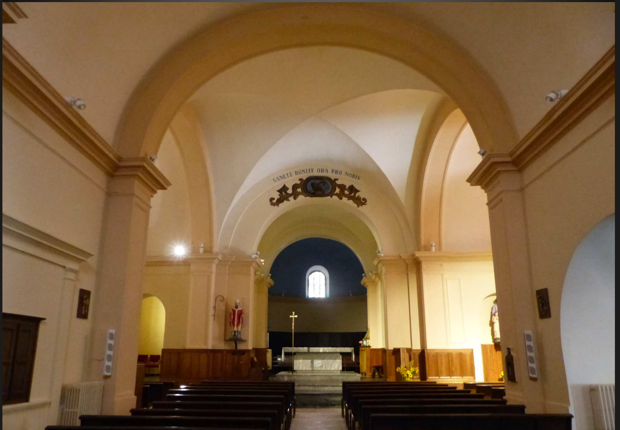
EGLISE SAINT BONNET _ L'édifice actuel, qui remonterait du XVII e siècle, a sans doute été réaménagé ou en partie reconstruit à la fin du XVIII e , puisque la date de 1784 est gravée sur la porte ouest ; d'autres interventions sur la construction ont dû avoir lieu, en témoigne l'inscription 1842 sur la porte sud ; la nef est constituée de deux travées voûtées en berceau et d'un transept voûté d'arêtes ; les bras du transept et le collatéral sud sont voûtés en berceau ; le chœur, tourné vers le nord-est, est formé d'une travée voûtée d'arêtes et d'une abside outrepassé couverte d'une coupole.