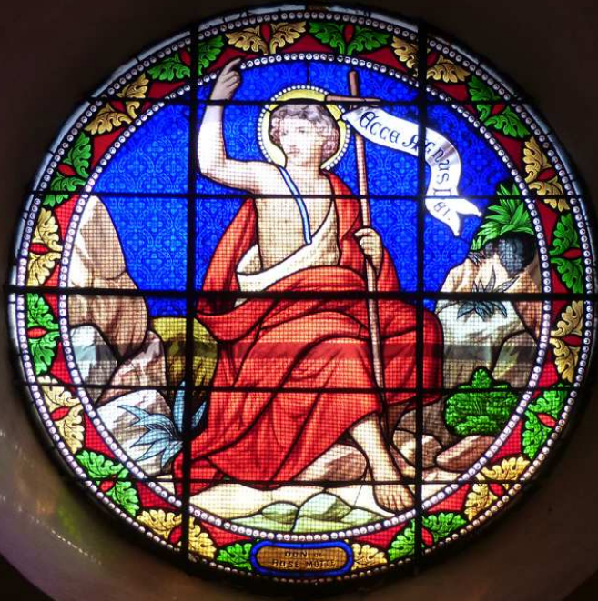
Vitrail de saint Jean-Baptiste, le Précurseur