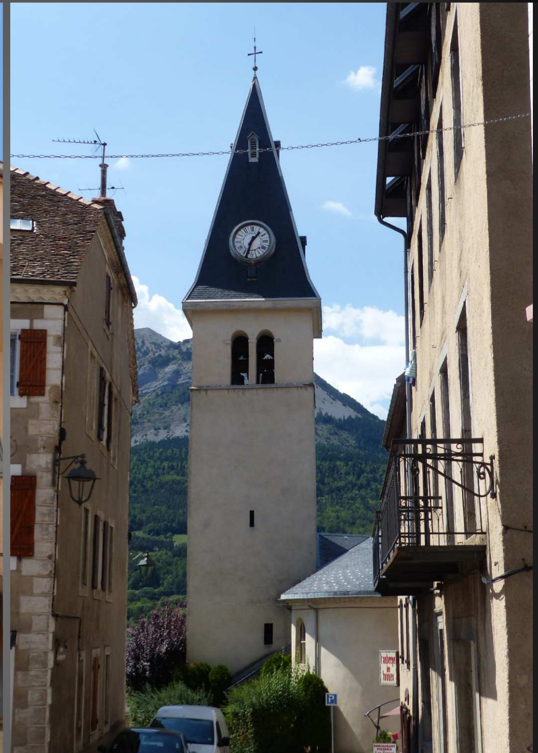
ST BONNET-EN-CHAMPSAUR_ Place Grenette, la Maison La Tour comporte un escalier à vis qui daterait du XVI e siècle. La rue Lesdiguières mène droit à l'église paroissiale et son clocher-tour : en 1935, la flèche en pierre de taille du clocher est remplacée par une flèche en charpente couverte d'ardoises ; le porche sud a été reconstruit en 1970.