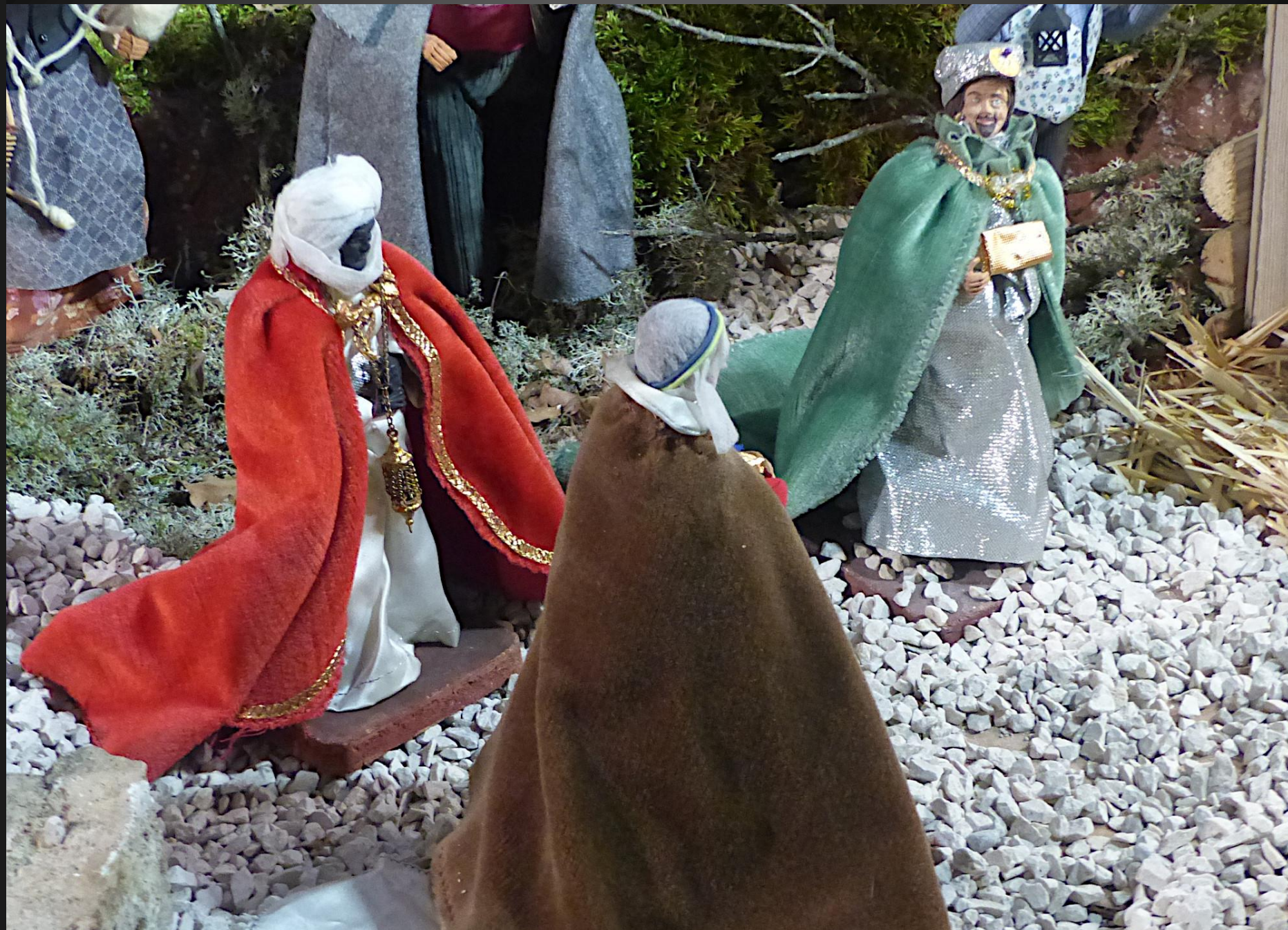
Les rois mages ont suivi l'étoile jusqu'à l'étable de Bethléem où ils ont offert à l'Enfant-Roi de l'or, de l'encens et de la myrrhe, avant de repartir vers l'Orient.