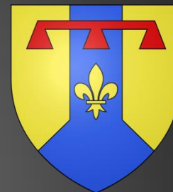
Blason des Bouches-du-Rhône

D'or au gousset renversé d'azur chargé en cœur d'une fleur de lys du champ surmontée d'un lambel de gueules brochant sur le tout.