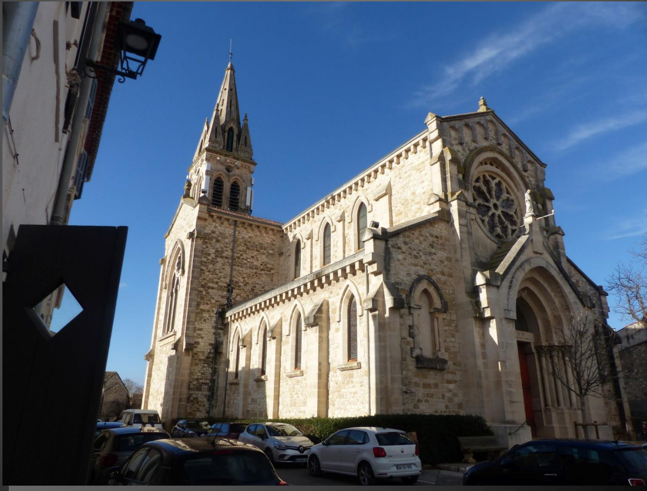
SAINT-CANNAT L'église Notre-Dame de Vie