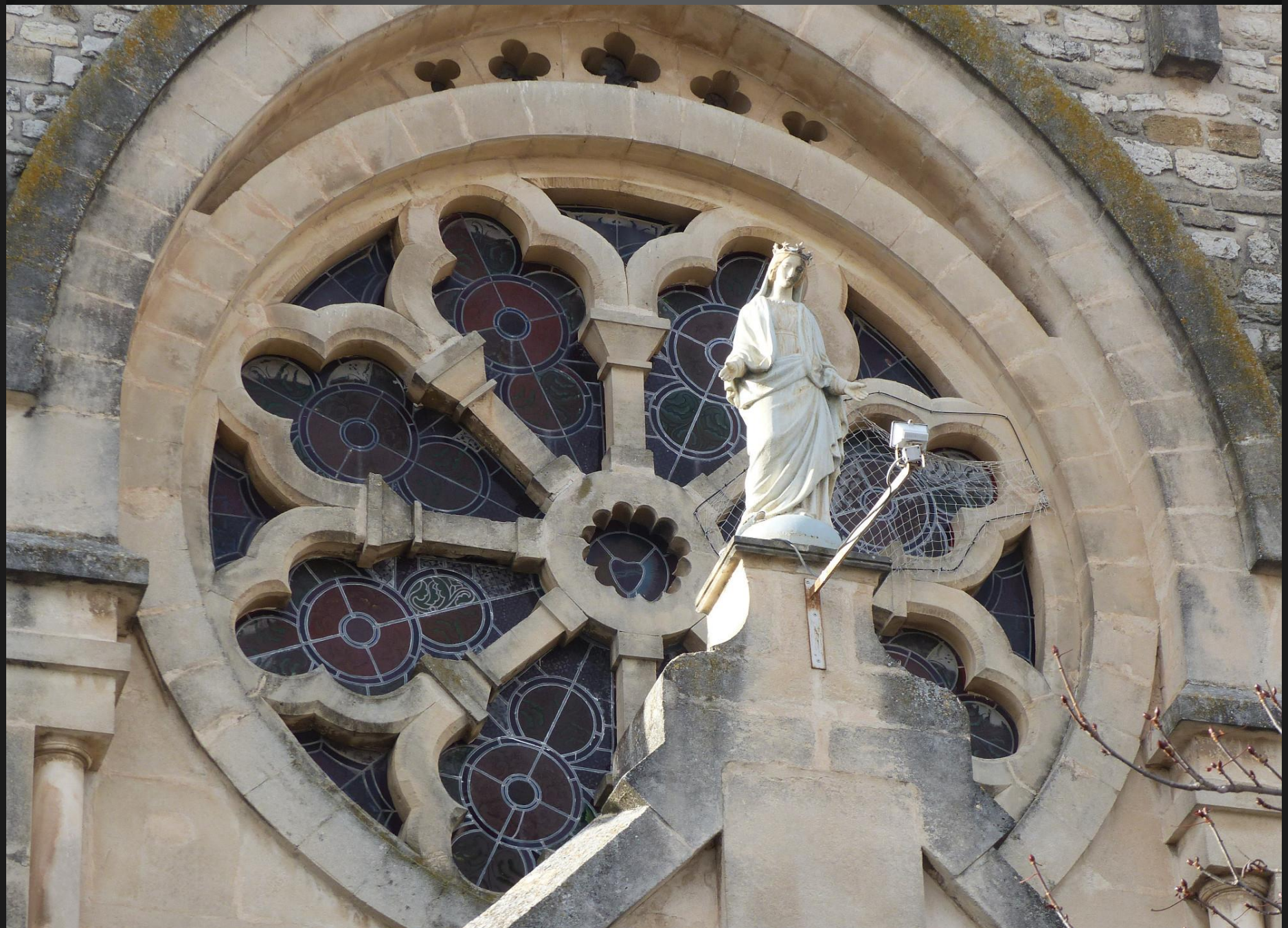
Reconstruite après le tremblement de terre de 1909 qui détruisit le village, l'église de Saint-Cannat a été consacrée en 1927 sous la protection de la Vierge Marie en la fête de la Nativité (1 er dimanche de Septembre).