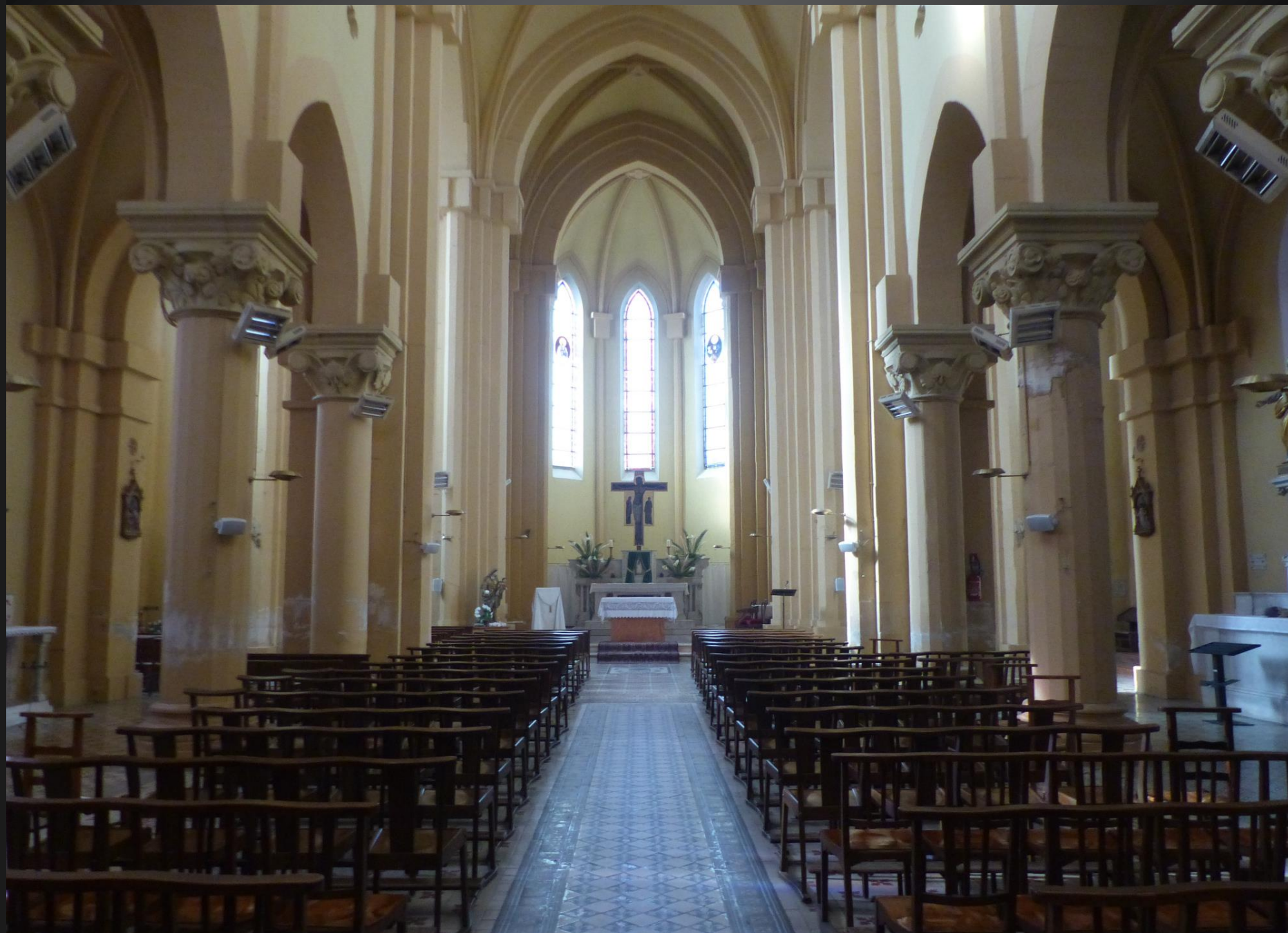
Cette église en ciment, l'une des premières, a été entièrement ravalée et réhabilitée en 1996-1997 (façades principales et toiture), 1997-1998 (façades arrière), 1999 (clocher et chauffage) et 2000 (parvis et accès).