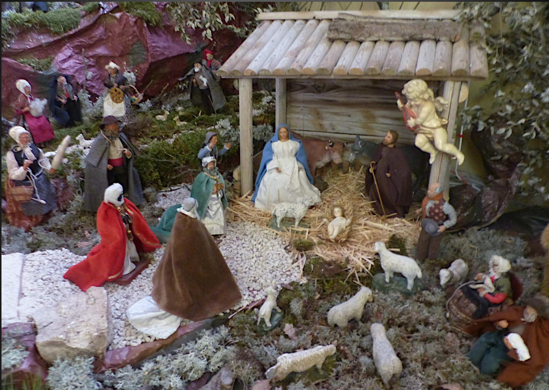
Nativité _ Or, pendant qu'ils étaient là, arrivèrent les jours où elle devait enfanter. Et elle mit au monde son fils premier-né; elle l'emballota et le coucha dans une mangeoire, car il n'y avait pas de place pour eux dans la salle commune. (Luc 2, 7).