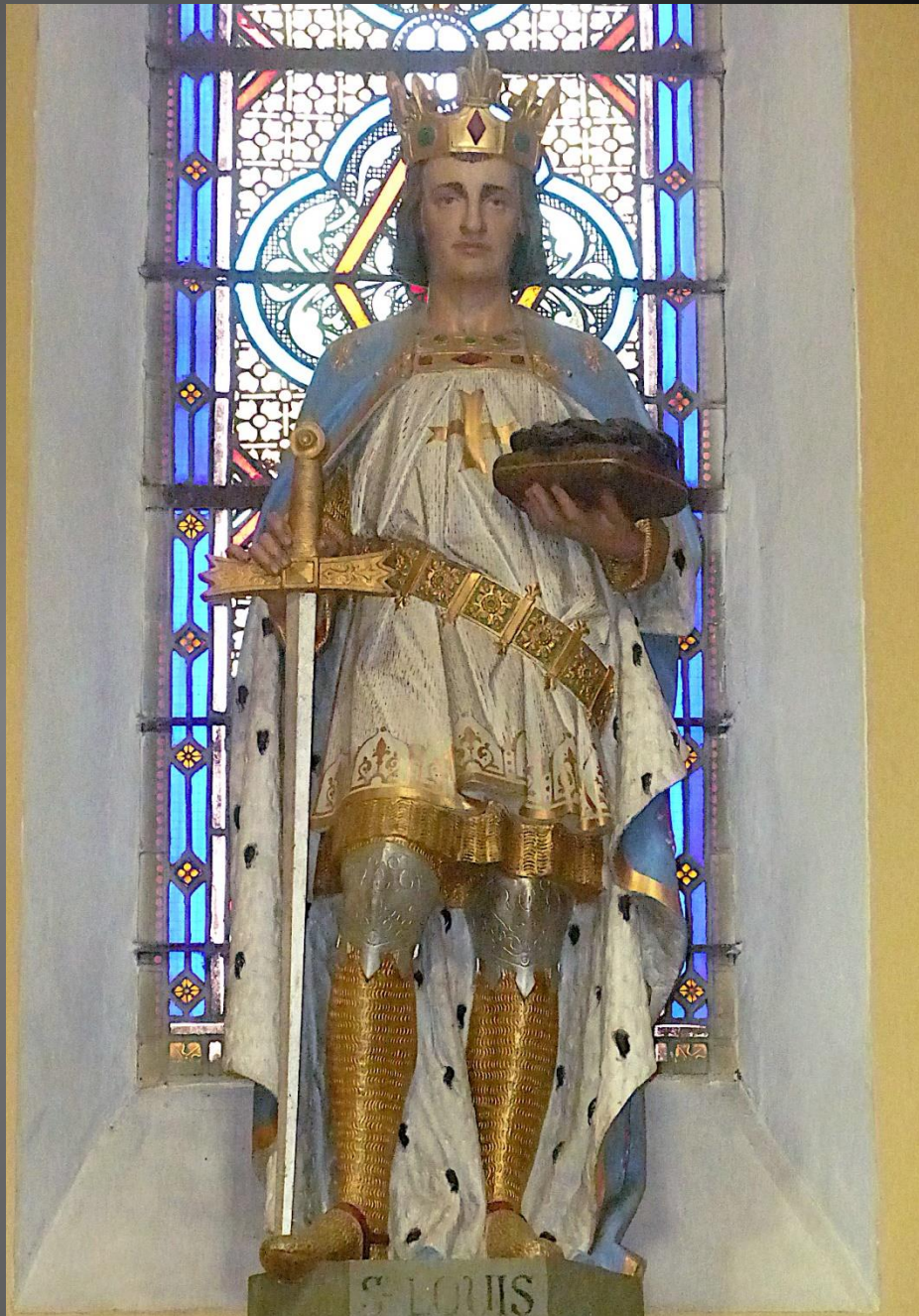
Statue de Saint Louis, avec les attributs de la Royauté ainsi que la Sainte couronne d'épines acquise en 1238 auprès de Baudouin II de Courtenay, dernier empereur latin de Constantinople.