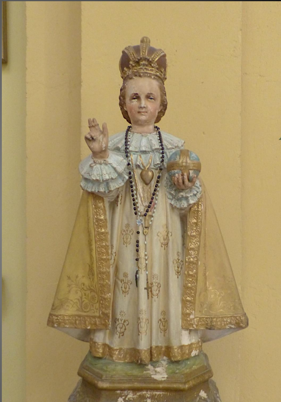
Statue de l'Enfant Jésus: soutenue par des faits miraculeux, la dévotion à l'Enfant Jésus de Prague s'est répandue à travers le monde à partir du XIXe siècle.