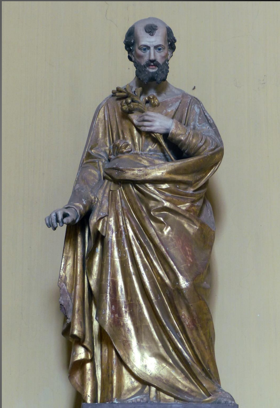
Statue de Saint Joseph, le père nourricier de Jésus.