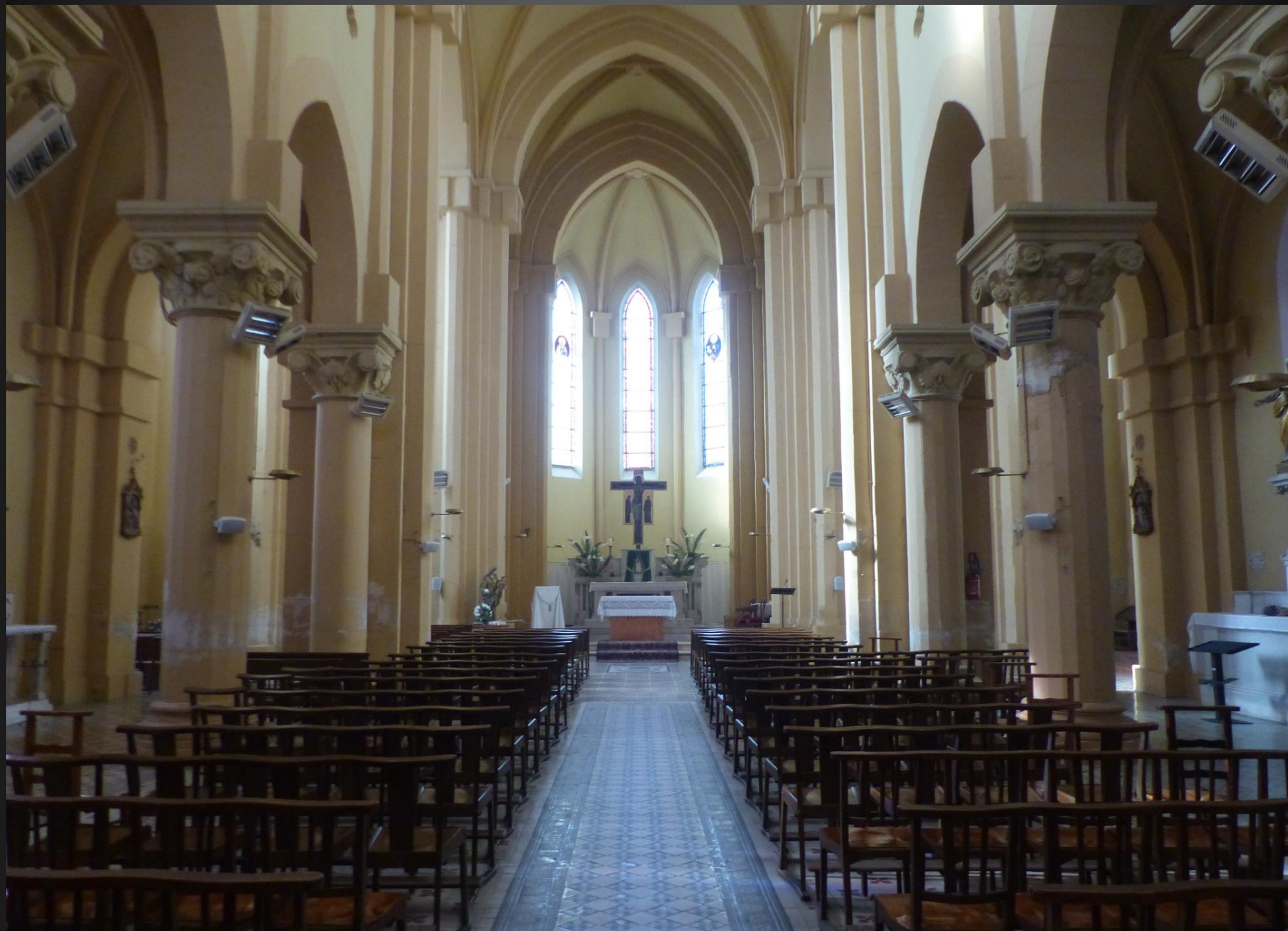
Cette église en ciment, l'une des premières, a été entièrement ravalée et réhabilitée en 1996-1997 (façades principales et toiture), 1997-1998 (façades arrière), 1999 (clocher et chauffage) et 2000 (parvis et accès).