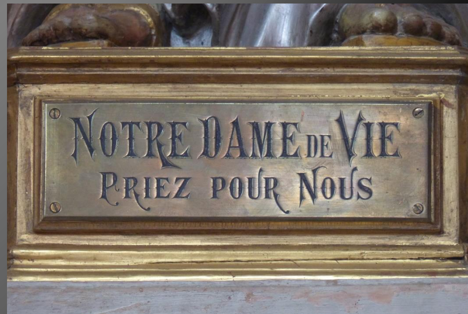
La Vierge et l'Enfant.