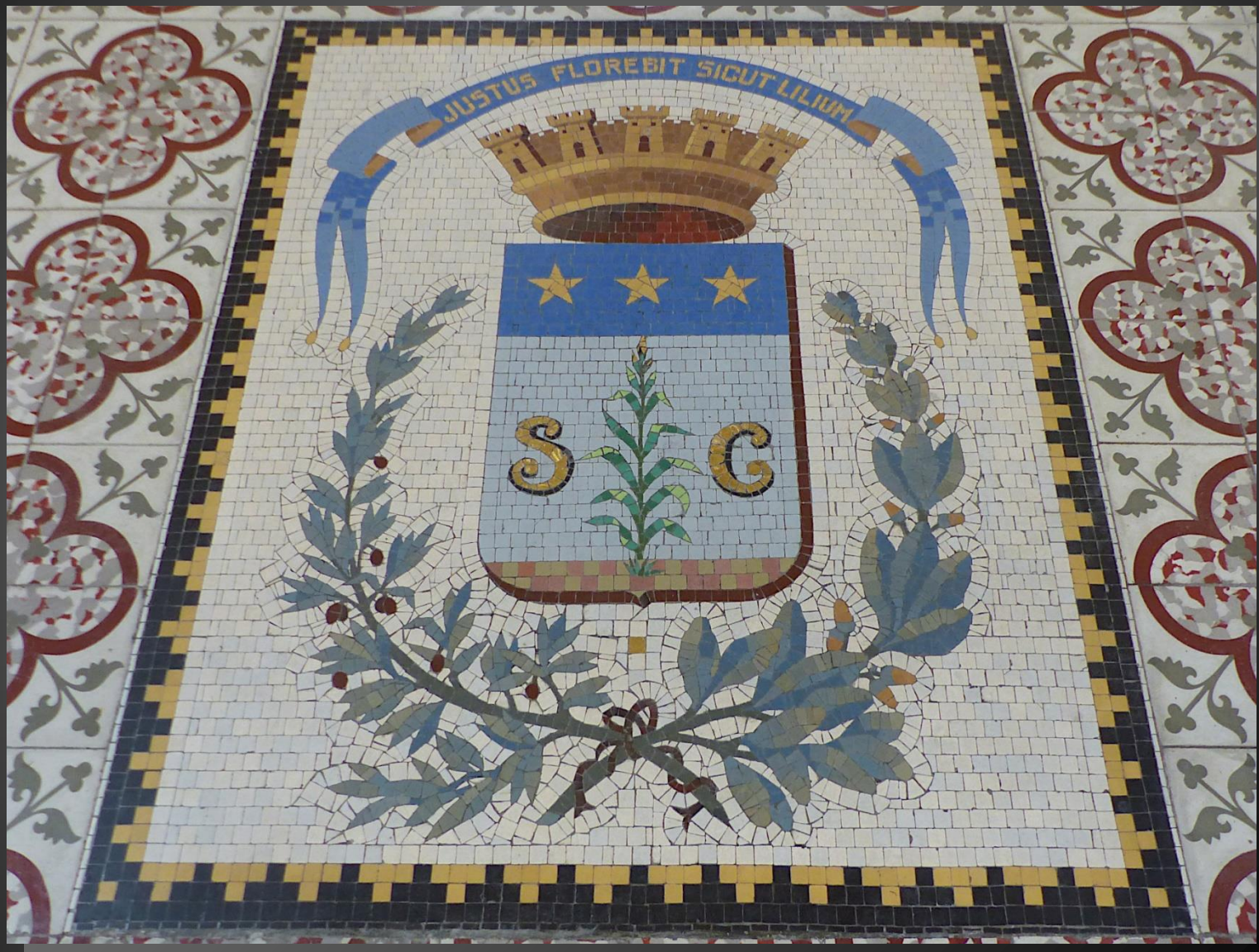
Devant l'autel, une mosaïque représente les armes de Saint-Cannat avec sa devise : JUSTUS FLOREBIT SICUT LILIUM (Le juste fleurira comme le lis)