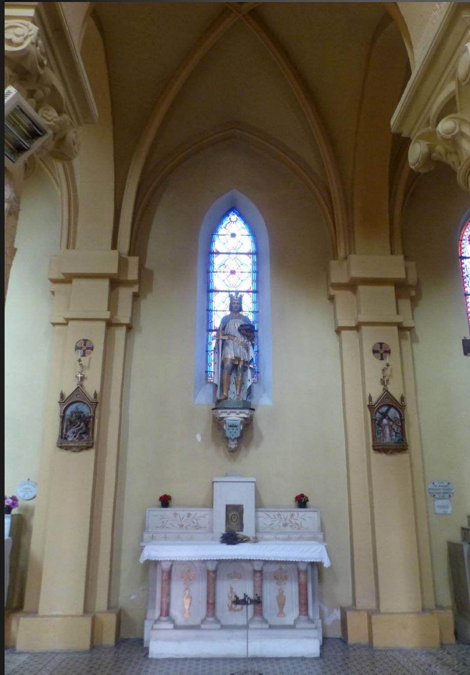
Autel de Saint Louis, Roi de France (1214-1270), Il mène un règne inspiré des valeurs du christianisme qui fonde l'idée que les pouvoirs spirituel et politique peuvent être incarnés par un seul homme.