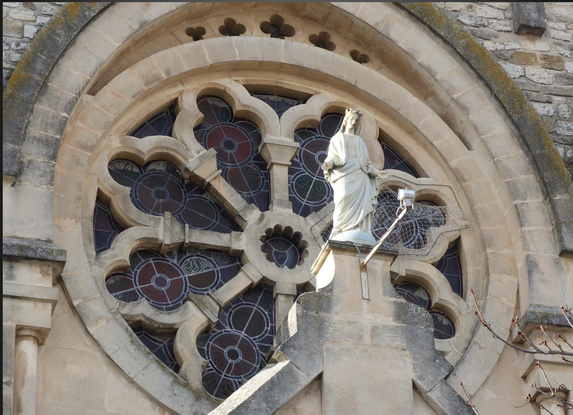
Reconstruite après le tremblement de terre de 1909 qui détruisit le village, l'église de Saint-Cannat a été consacrée en 1927 sous la protection de la Vierge Marie en la fête de la Nativité (1 er dimanche de Septembre).