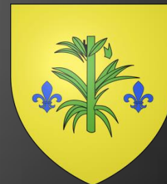
Blason de Saint-Cannat

D'or au gousset renversé d'azur chargé en cœur d'une fleur de lys du champ surmontée d'un lambel de gueules brochant sur le tout.