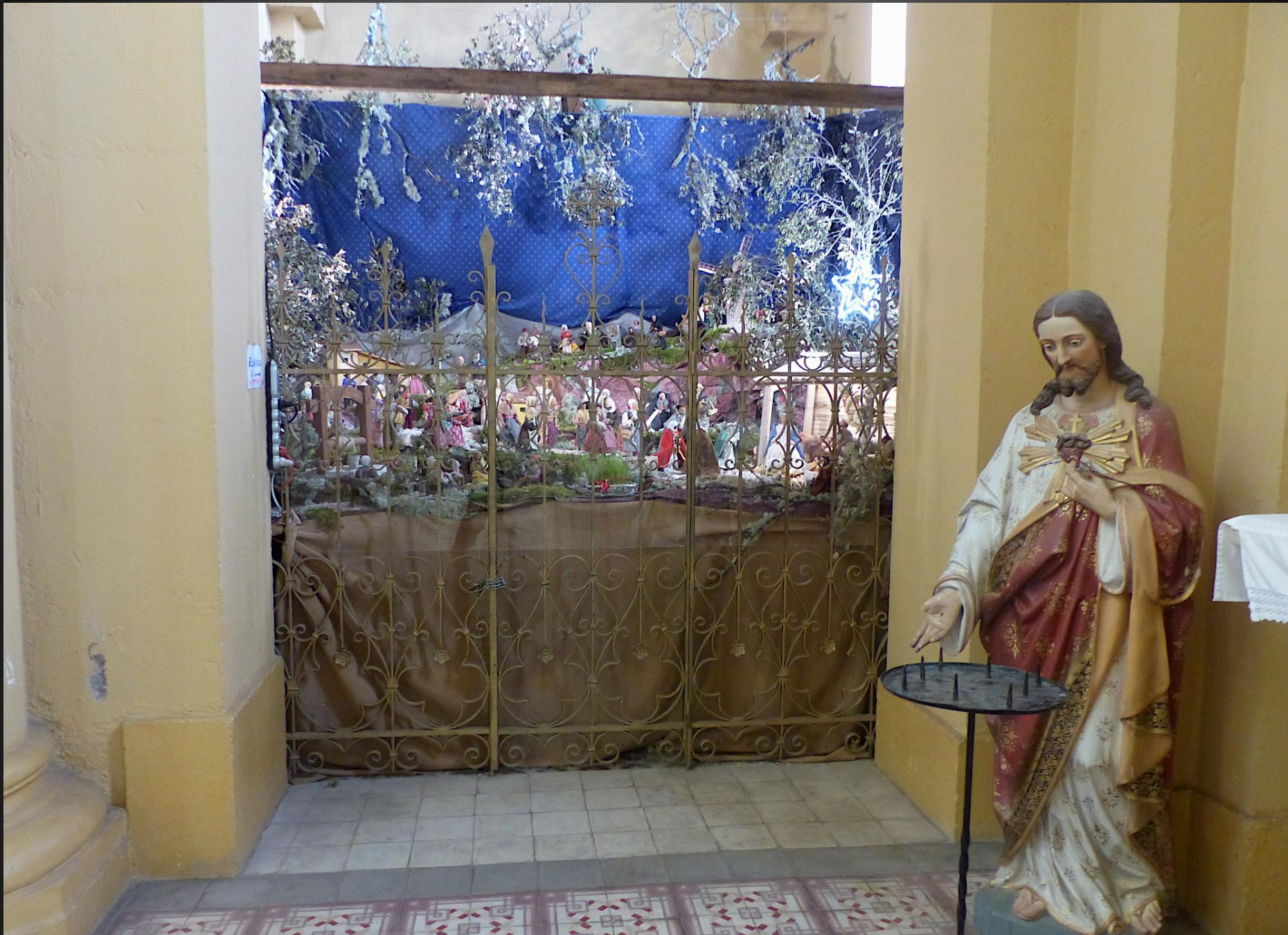
Statue du Sacré-Cœur qui semble inviter à contempler la scène de la Nativité.