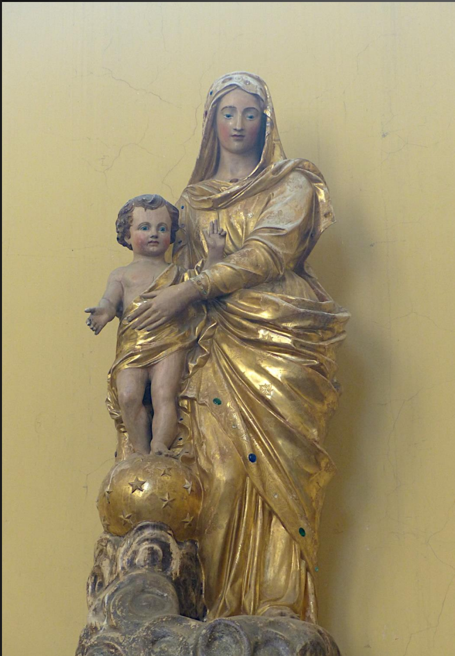
Statue de de la Vierge à l'Enfant.