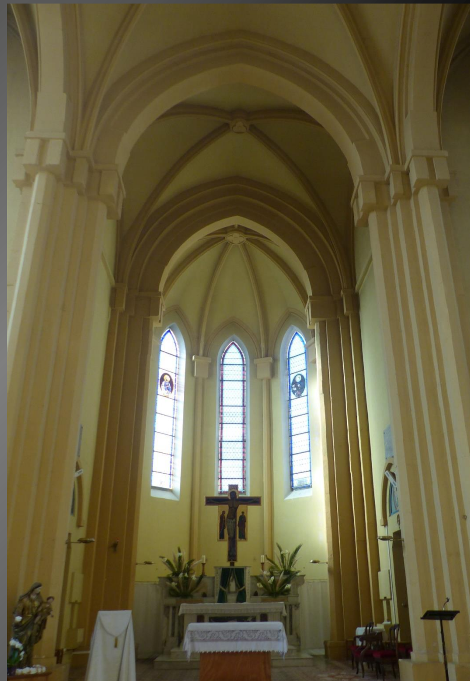
Le chœur néo gothique.