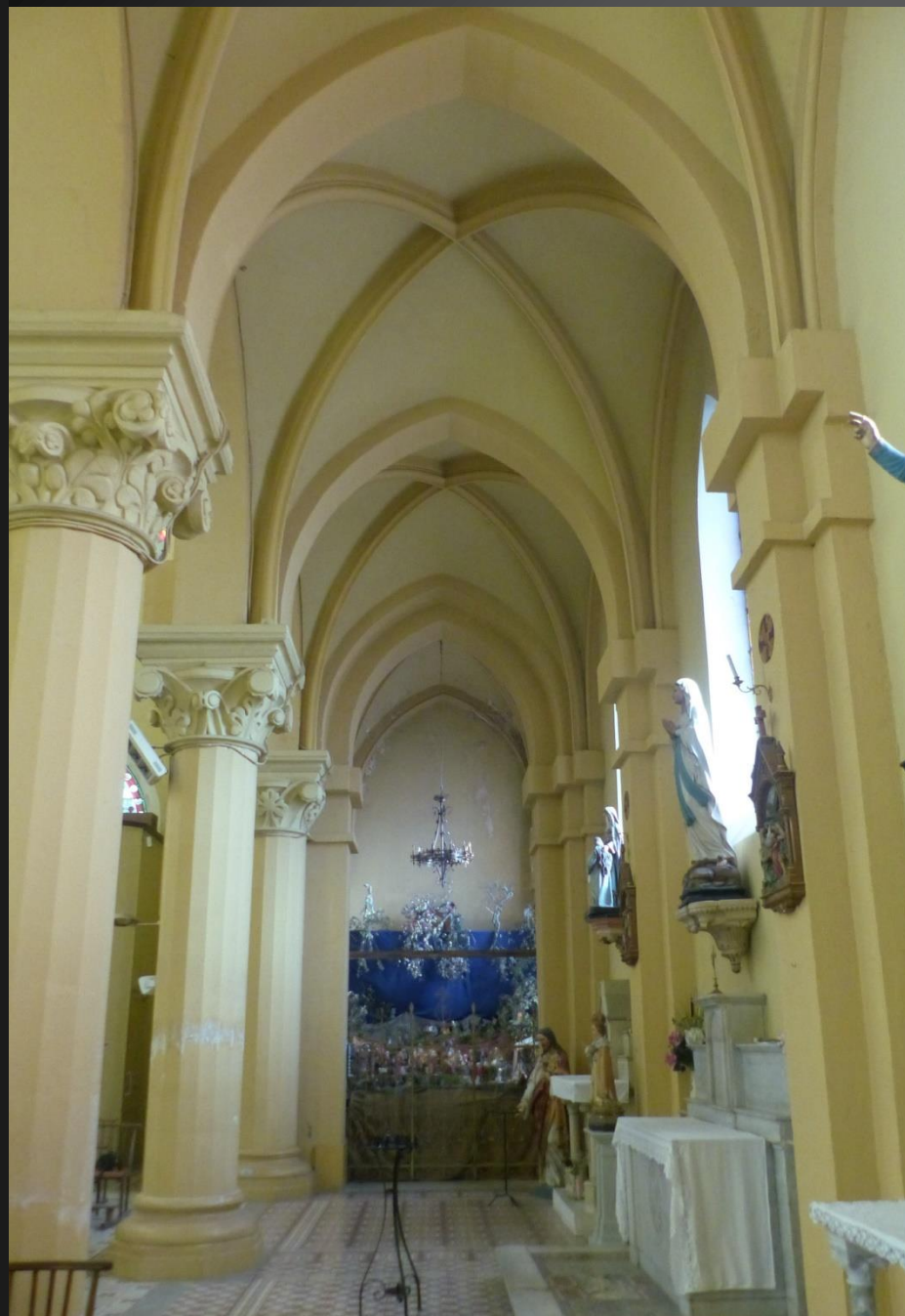
Le collatéral gauche et la crèche provençale.