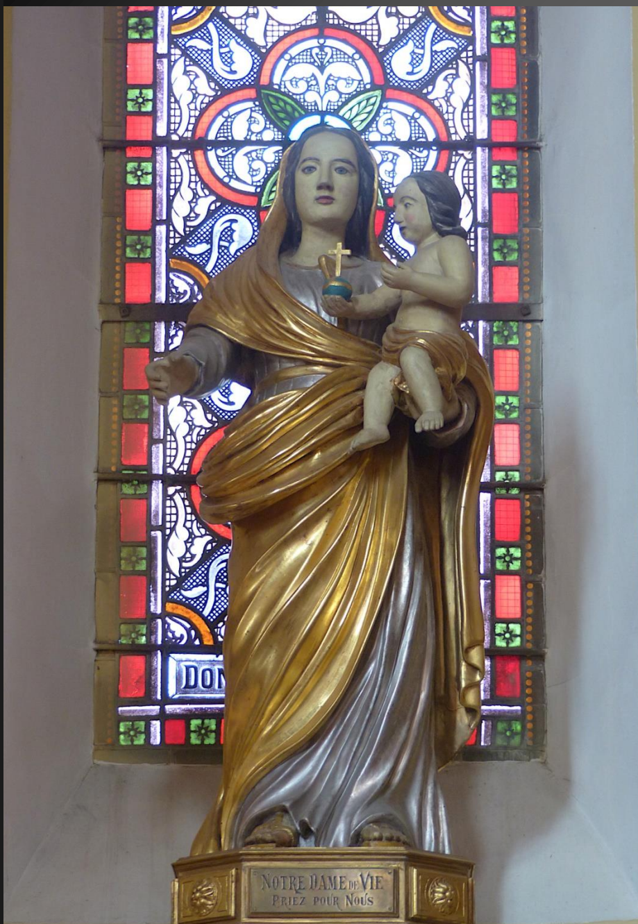
Statue de Notre-Dame de Vie.