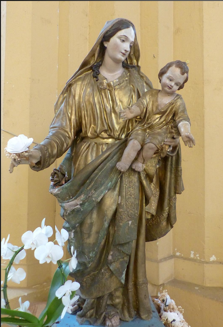
Statue de la Vierge à l'Enfant.