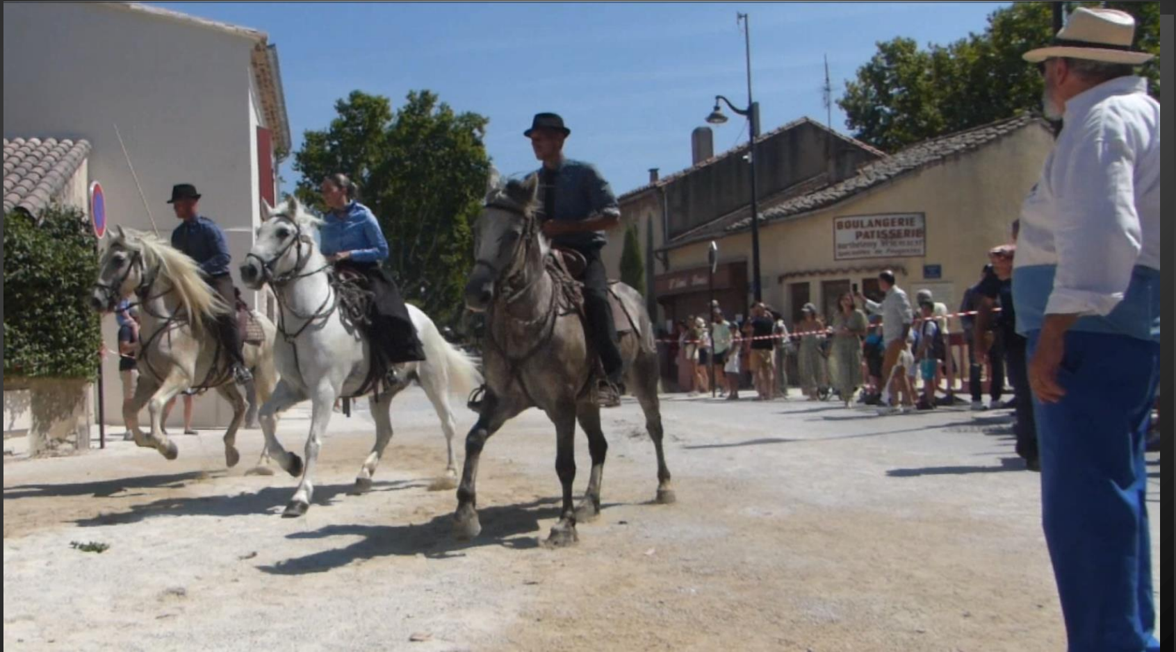
ST ETIENNE DU GRES_ La charrette revient dans l'autre sens ...