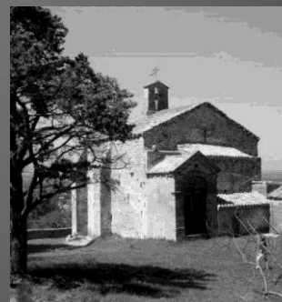
Chapelle romane Notre-Dame du Château, mentionnée en 1180, sur la colline Saint-Michel-de-Briançon, lieu d'un grand pèlerinage marial au mois de mai.