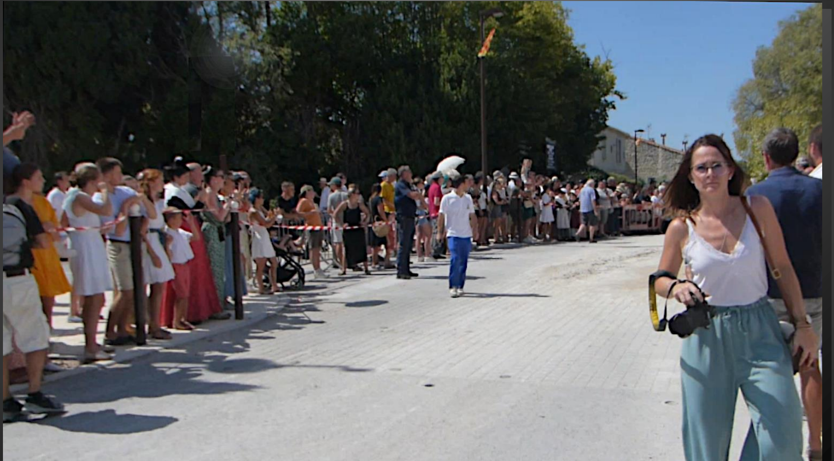
ST ETIENNE DU GRES_ Le virage à angle droit de la place Jean Galeron est dégagé, la charrette est très attendue!