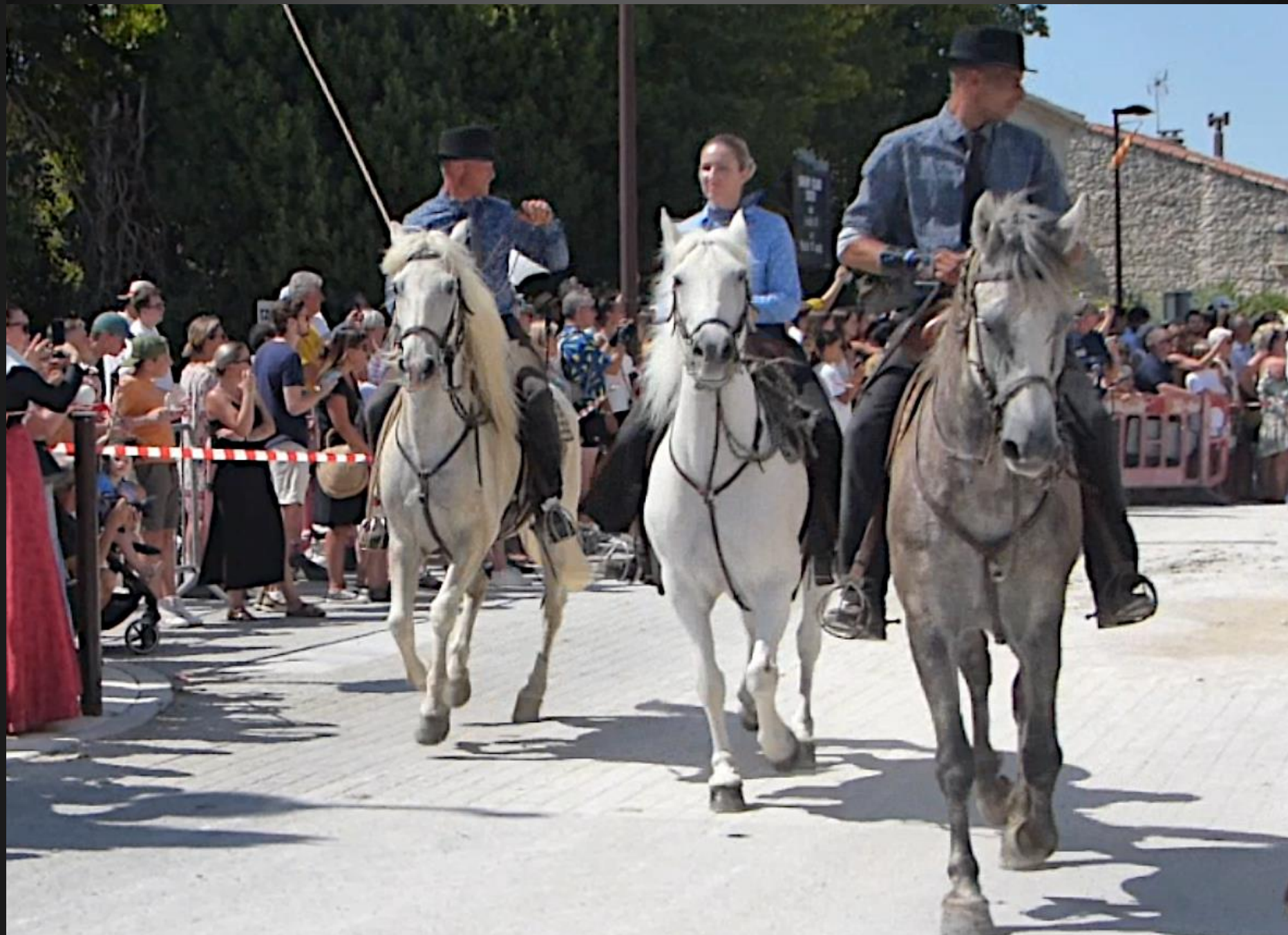
ST ETIENNE DU GRES_ L'attelage de la charrette est précédé par trois gardians à cheval qui ouvrent la route ... parce que ça arrive très vite.