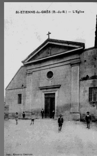
L'église autour de 1900 n'avait pas encore le clocheton.