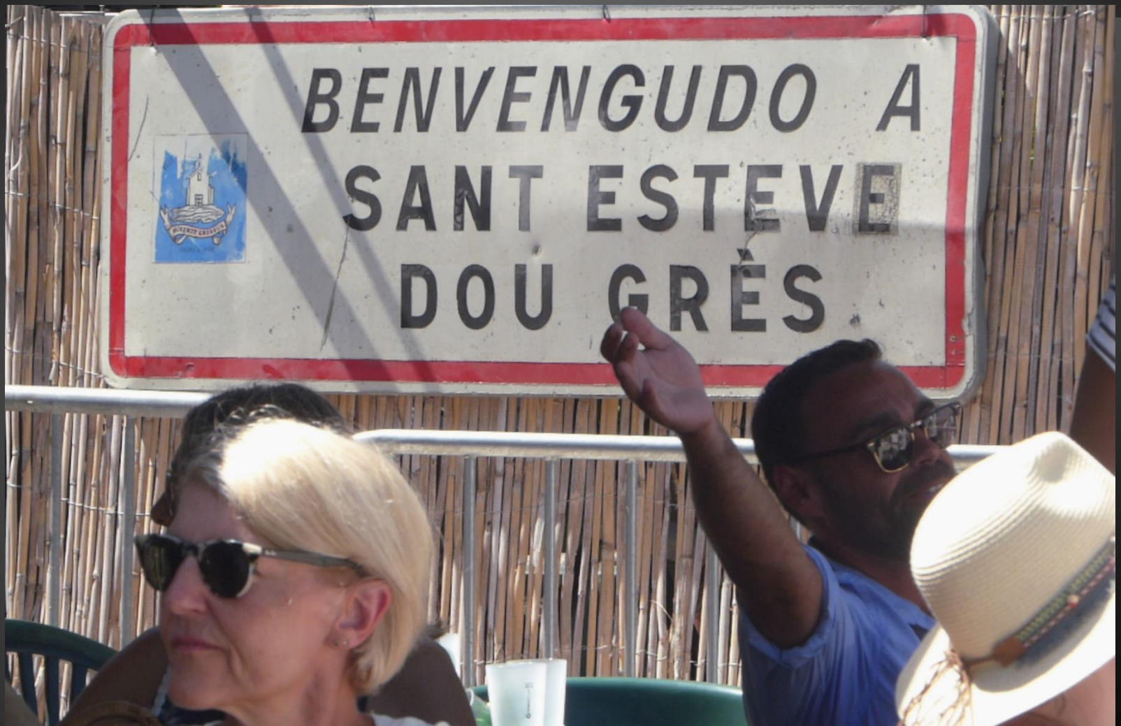
ST ETIENNE DU GRES _ Assurément, un pays où il fait bon vivre.