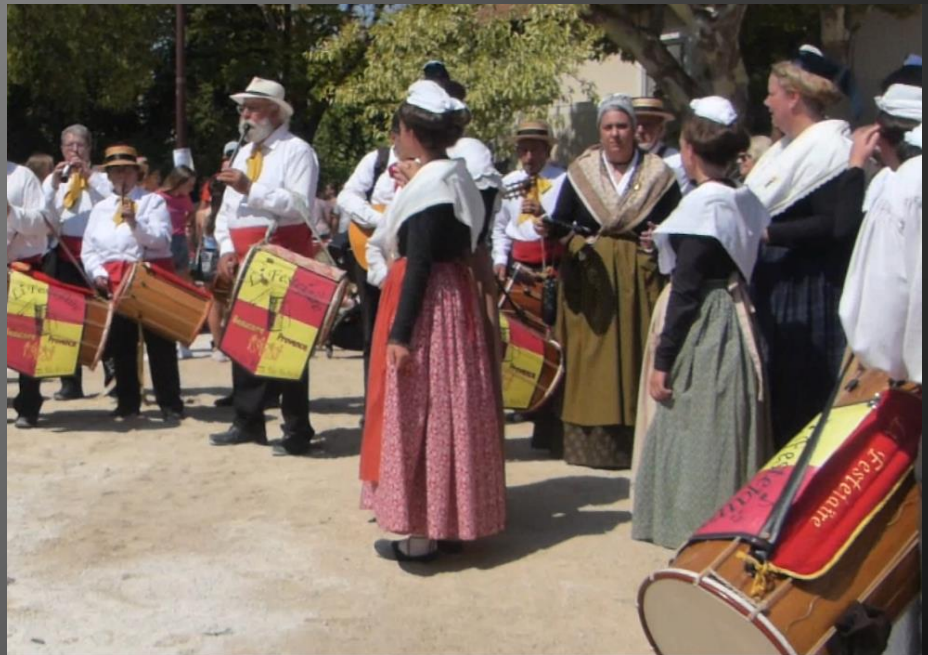
ST ETIENNE DU GRES_ Les tambourinaires de LI Festejaire accompagnent les danses traditionnelles.