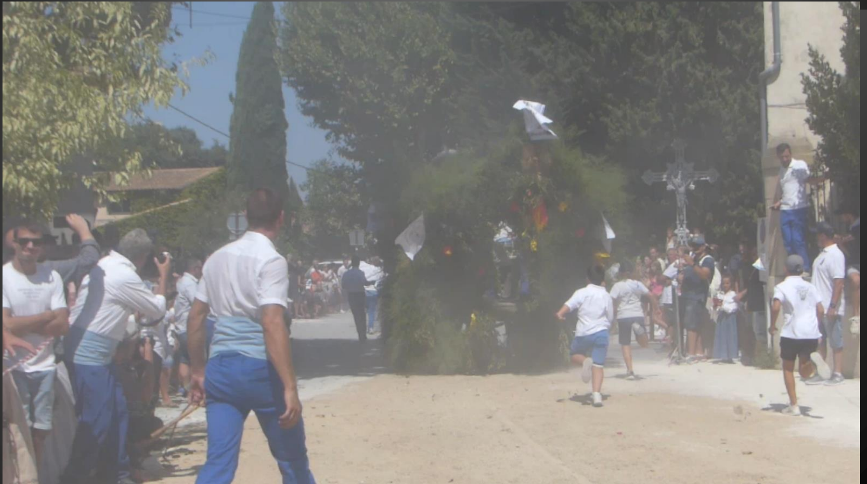
ST ETIENNE DU GRES _ La charrette de la Saint-Eloi 2023 s'éloigne dans un nuage de poussière, on la reverra dans un an. Vivo Sant Aloi !