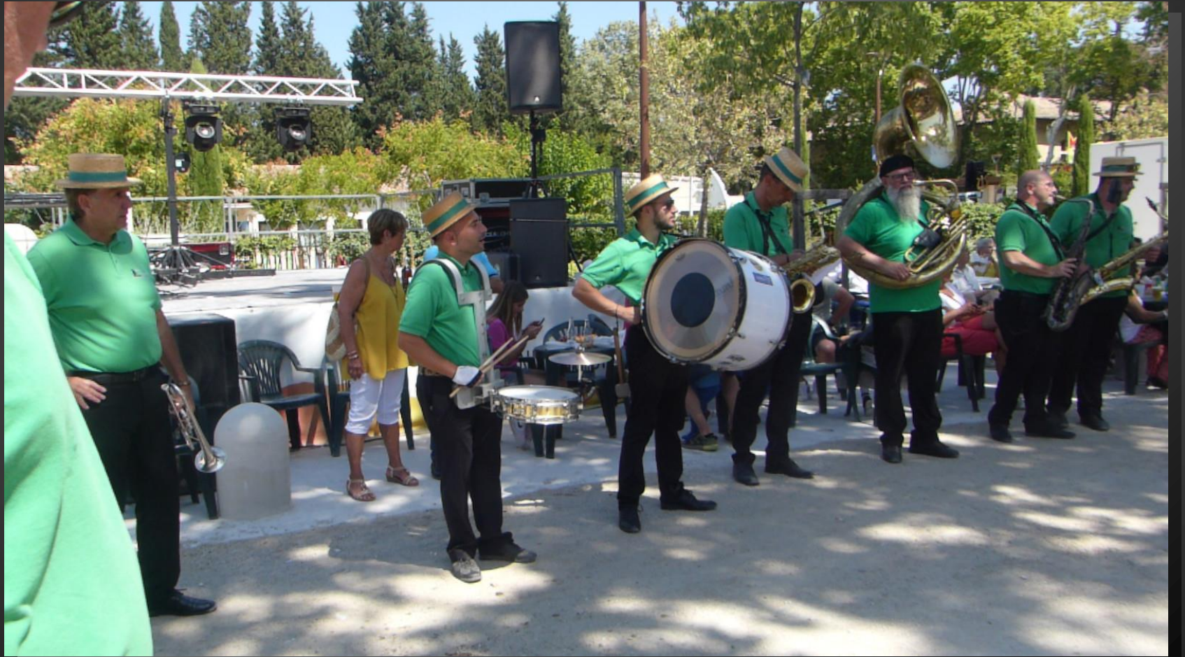
ST ETIENNE DU GRES _ La Peña de Saint-Etienne-du-Grès créé une ambiance très festive en face du Café du Vieux Grès.