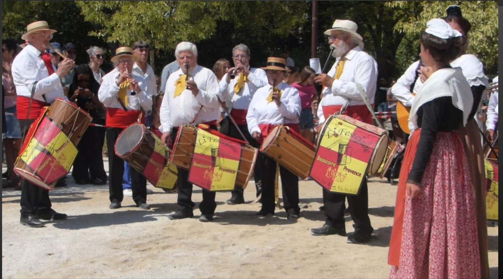
ST ETIENNE DU GRES _ Virage de la place Jean Galeron, un moment provençal avant l'arrivée de la charrette au grand trot.