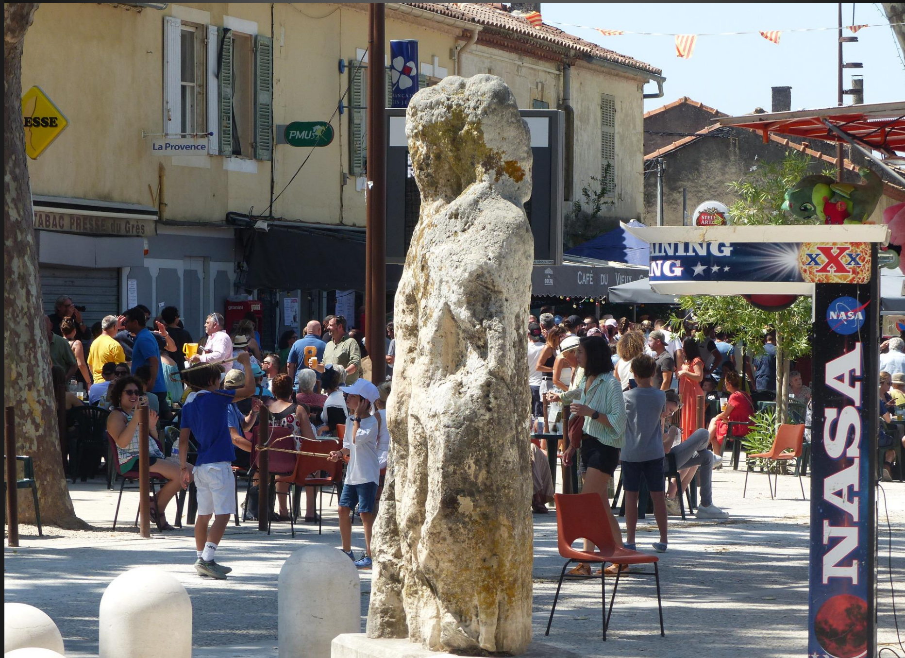
ST ETIENNE DU GRES_ Les Grésoullais évoluent sans se soucier du regard minéral de La Mourgue : il devait bien y avoir des festivités à son époque, et des Peña archaïques aussi ?