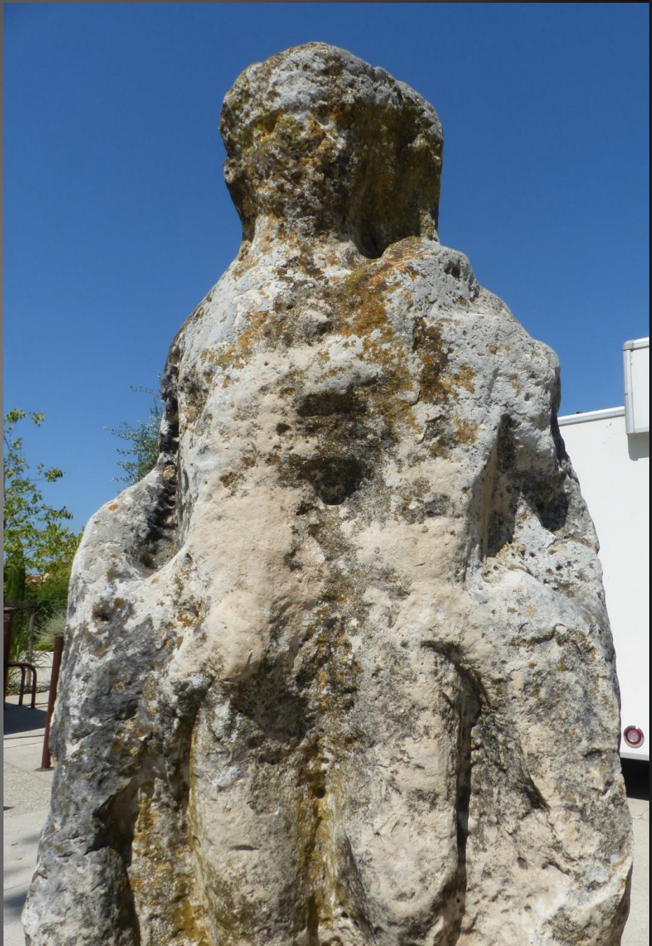
ST ETIENNE DU GRES_ Du haut de cette vénérable statue, plusieurs millénaires contemplent les habitants du XXIe siècle....qui festoyent en l'honneur de saint Eloi.