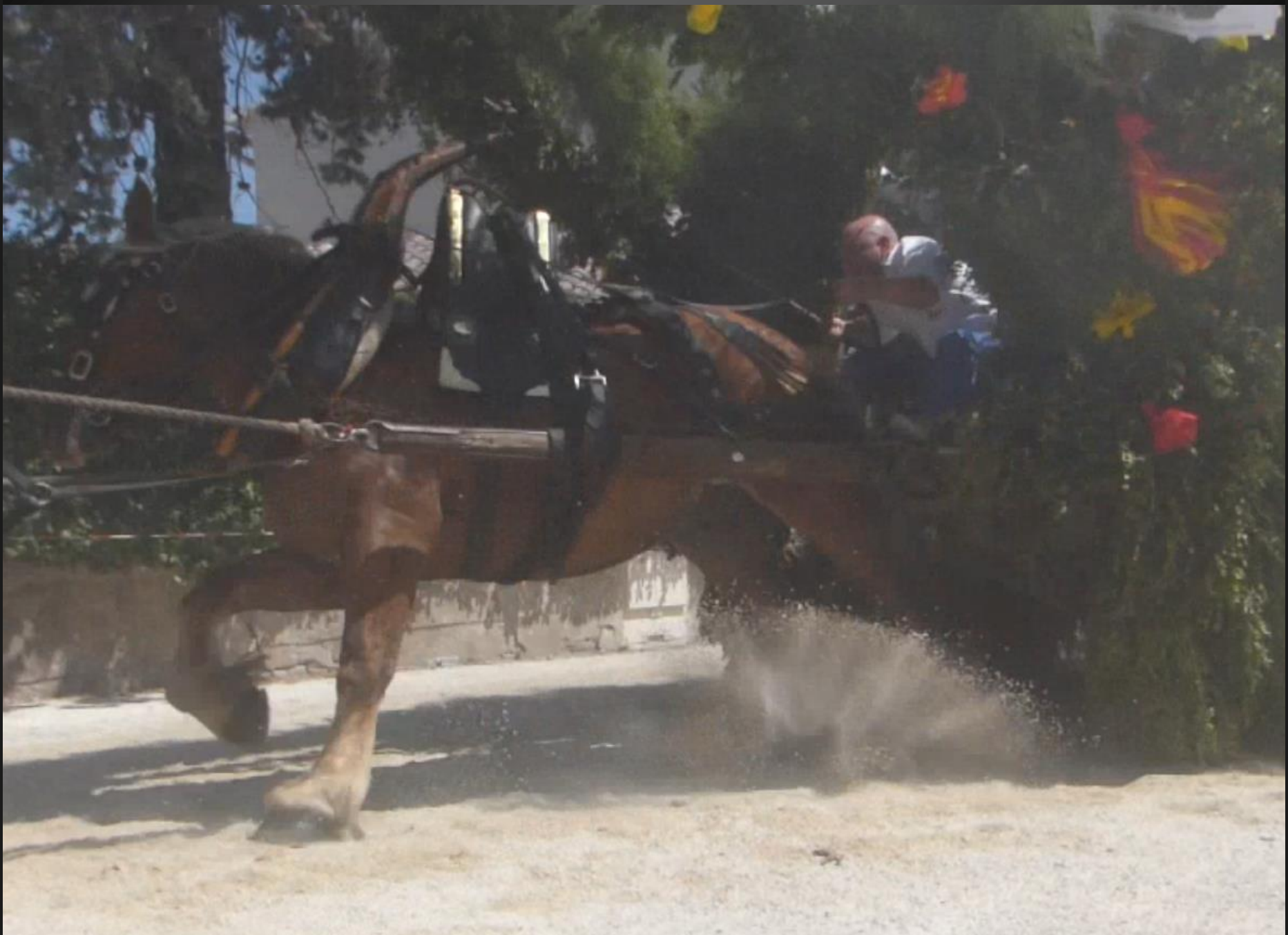
ST ETIENNE DU GRES_ La procession d'entrée se met en place derrière la croix et la bannière.