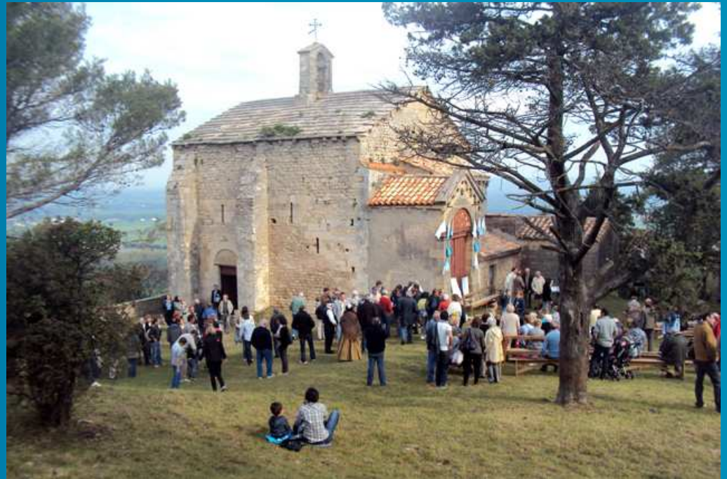
09H30 _Début de la traditionnelle messe en plein air au sanctuaire des Alpilles.