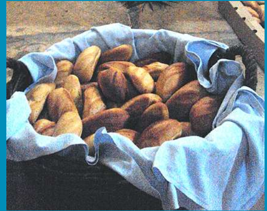
07H30 _ Office marial dans la chapelle, consécration des nouveaux prieurs de la confrérie de Notre-Dame du Château, bénédiction des petits pains, et vénération de la statue par les nombreux pèlerins (en bas à dr.)