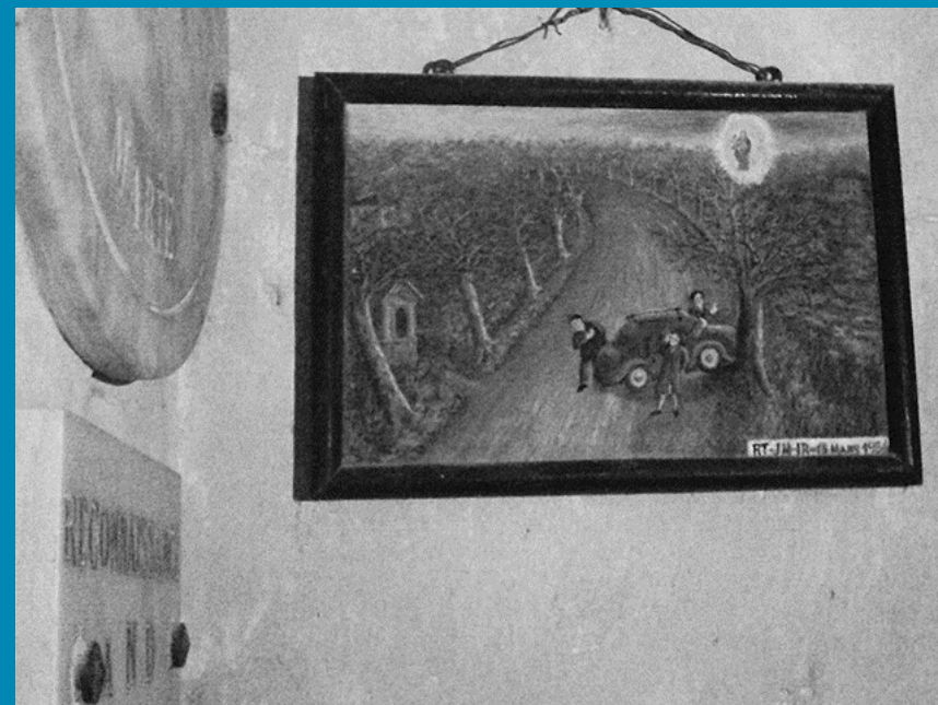
EX-VOTO_ Chaque ex-voto a son histoire, ceux-ci sont remarquables, soit par leur forme de médaillon (à g.) soit par leur expression naïve sur un tableau (protection de la Vierge lors d'un accident de voiture), soit par le nom célèbre de La Pérouse, dont un descendant fut protégé en mer en 1920.