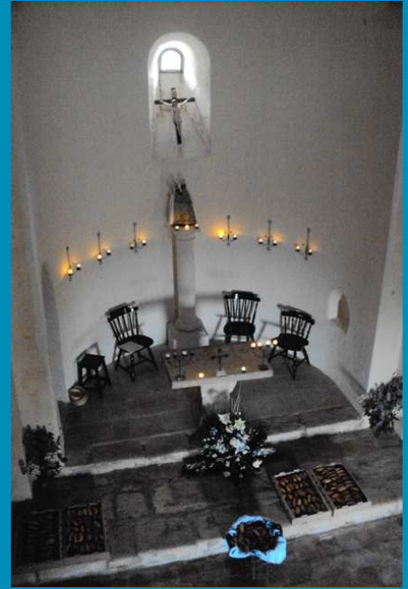
RECONNAISSANCE_ Près de l'entrée, le catalogue des prieurs de ND du Château depuis 1650. Les très nombreux ex-votos sur les murs et les piliers sont l'expression de la reconnaissance des fidèles envers Notre-Dame pour les grâces reçues par son intercession et qui explique la ferveur des tarasconnais qui chantent depuis des siècles : « Reviens, Ô notre grande sainte, O Notre-Dame-du-Château, Reviens dans notre vieille enceinte Nous abriter sous ton manteau. »