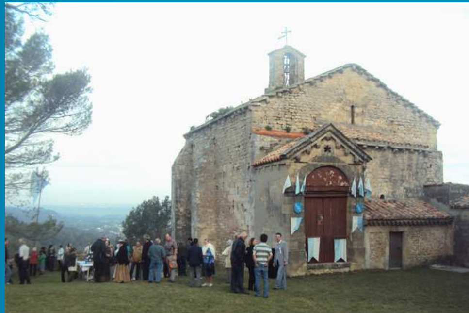
CHAPELLE NOTRE-DAME DU CHÂTEAU _ Arrivée des pèlerins dans la fraîcheur matinale sur le piton rocheux de l'ancien castrum où se trouvait au XIIe s. une église connue sous le nom de Sancta Maria de Castello, plus tard appelée Saint-Michel de Brianzone, c'est-à-dire, Saint-Michel du roc : la statue serait donc Brégançonne et non pas Briançonne... L'édifice est un caractèreistique du premier art roman provençal, toit de lauzes soutenues par des modillons, nef en plein cintre, abside en cul-de-four, rares ouvertures.