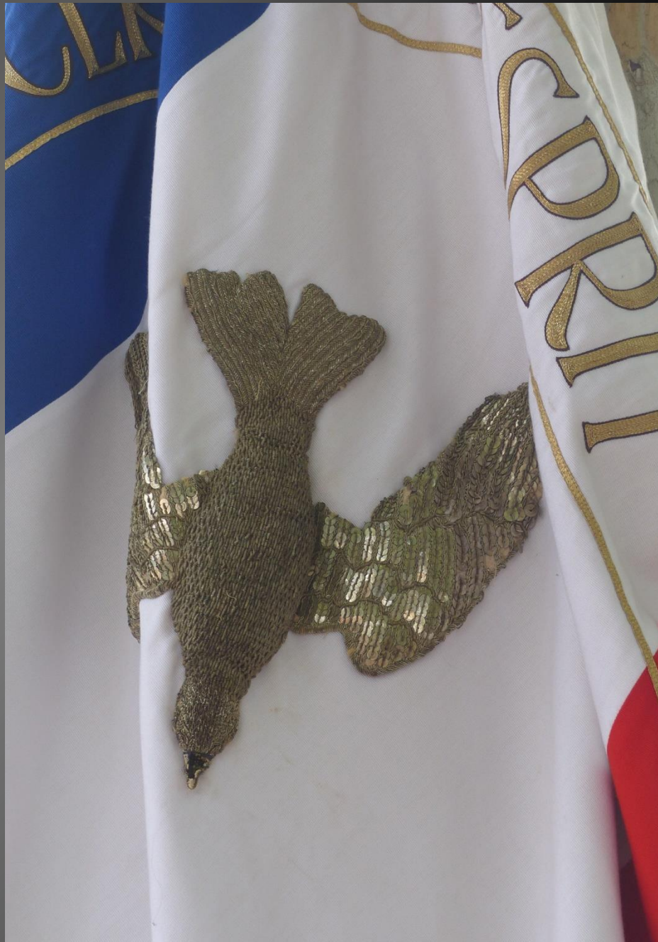
ST JULIEN-LES-MARTIGUES _ La Colombe de l'Esprit-Saint sur un drapeau tricolore rappelle le signe du Sacré-Cœur sur les drapeaux français en 14-18, interdit par la République et cependant encouragé sur le front par des chefs de corps catholiques ...