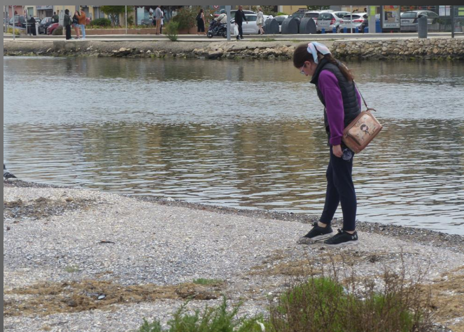
MARTIGUES _ Sur un pont, à la terrasse d'un café, ou au bord d'un canal, tout le charme martégal.