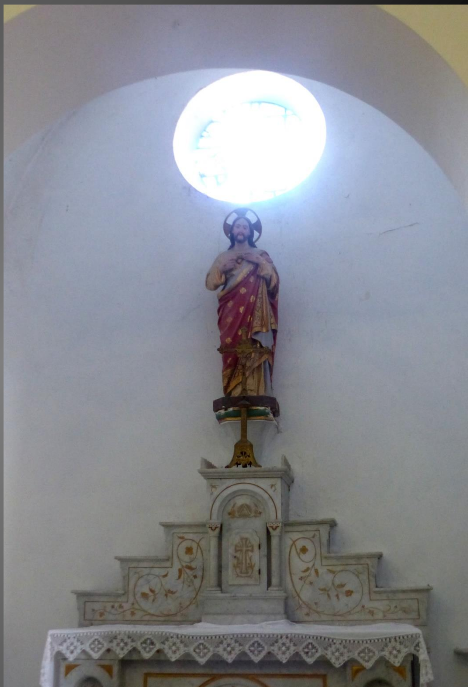
ST JULIEN-LES-MARTIGUES _ Chapelle de la Vierge et chapelle du Sacré-Cœur.