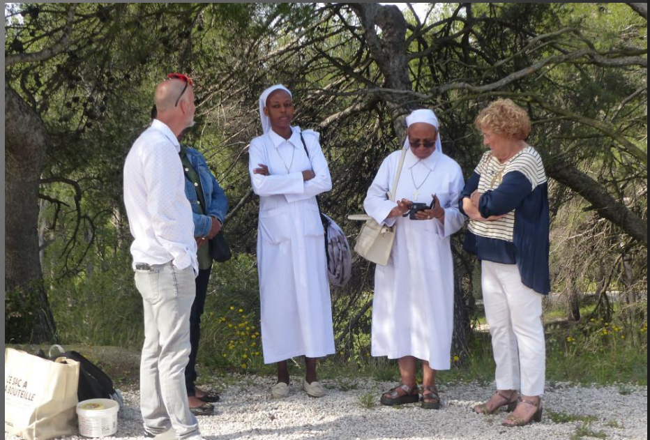
ST JULIEN-LES-MARTIGUES _ Deux nouvelles religieuses martiniquaises ont fait leur entrée à la paroisse de Martigues en 2014. REF : https://www.laprovence.com/article/edition-martigues-istres/3072582/deux-nouvelles-religieuses-martiniquaises-font-leur-entree-a-la-paroisse.html