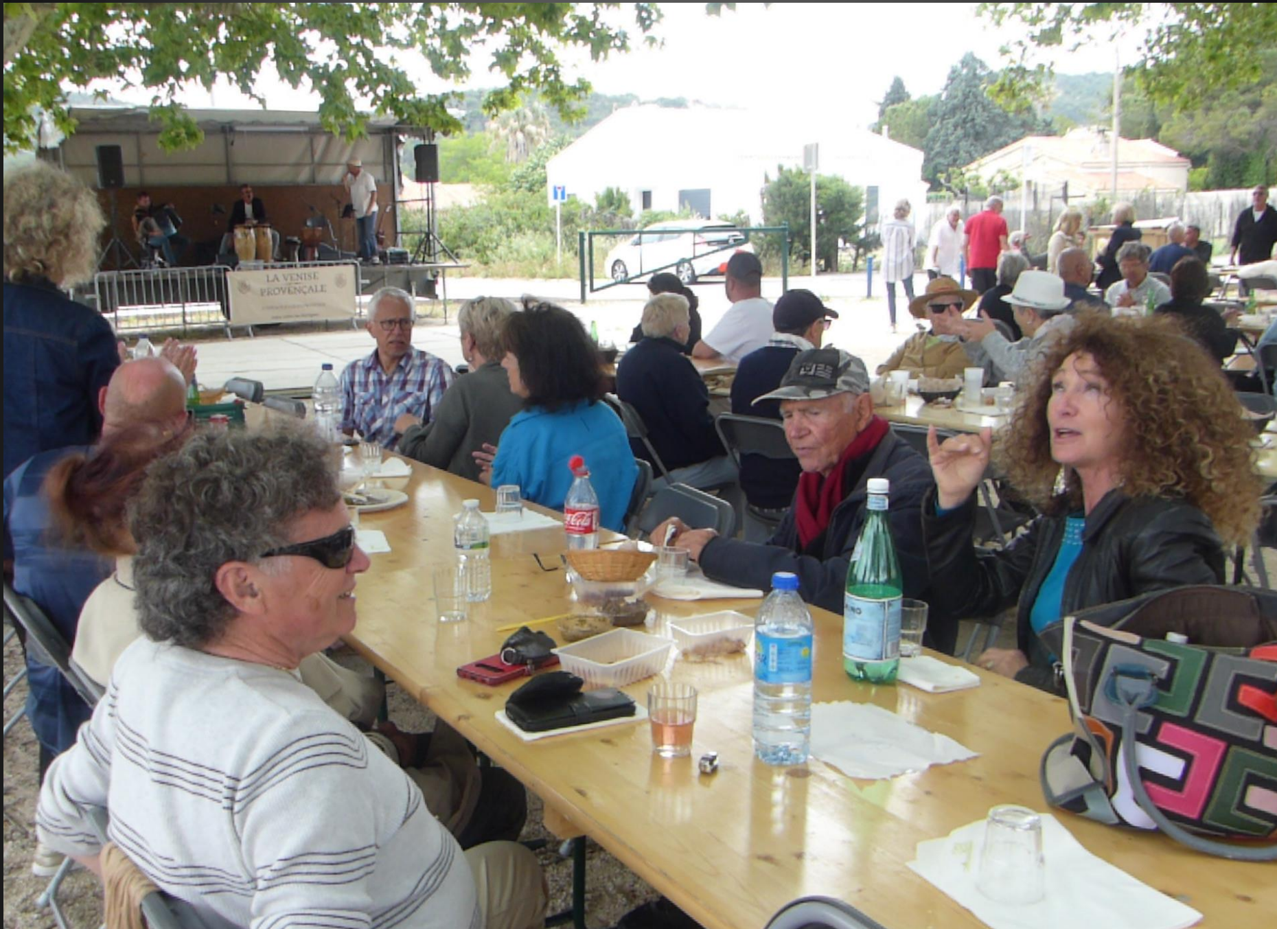
ST JULIEN-LES-MARTIGUES_ Des chansons populaires qui nous transporte au grand large, comme « Dès que le vent soufflera » (Renaud)