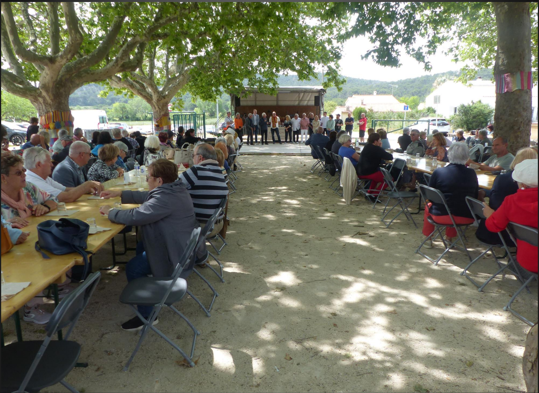
ST JULIEN-LES-MARTIGUES_ Discours officiels des organisateurs, notamment le Cercle Saint-Julien et le Football Club.