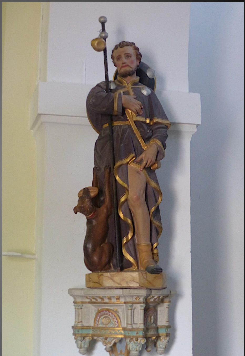
ST JULIEN-LES-MARTTIGUES _ La chorale a été très applaudie. Gageons que Saint-Roch et son chien auront apprécié ...