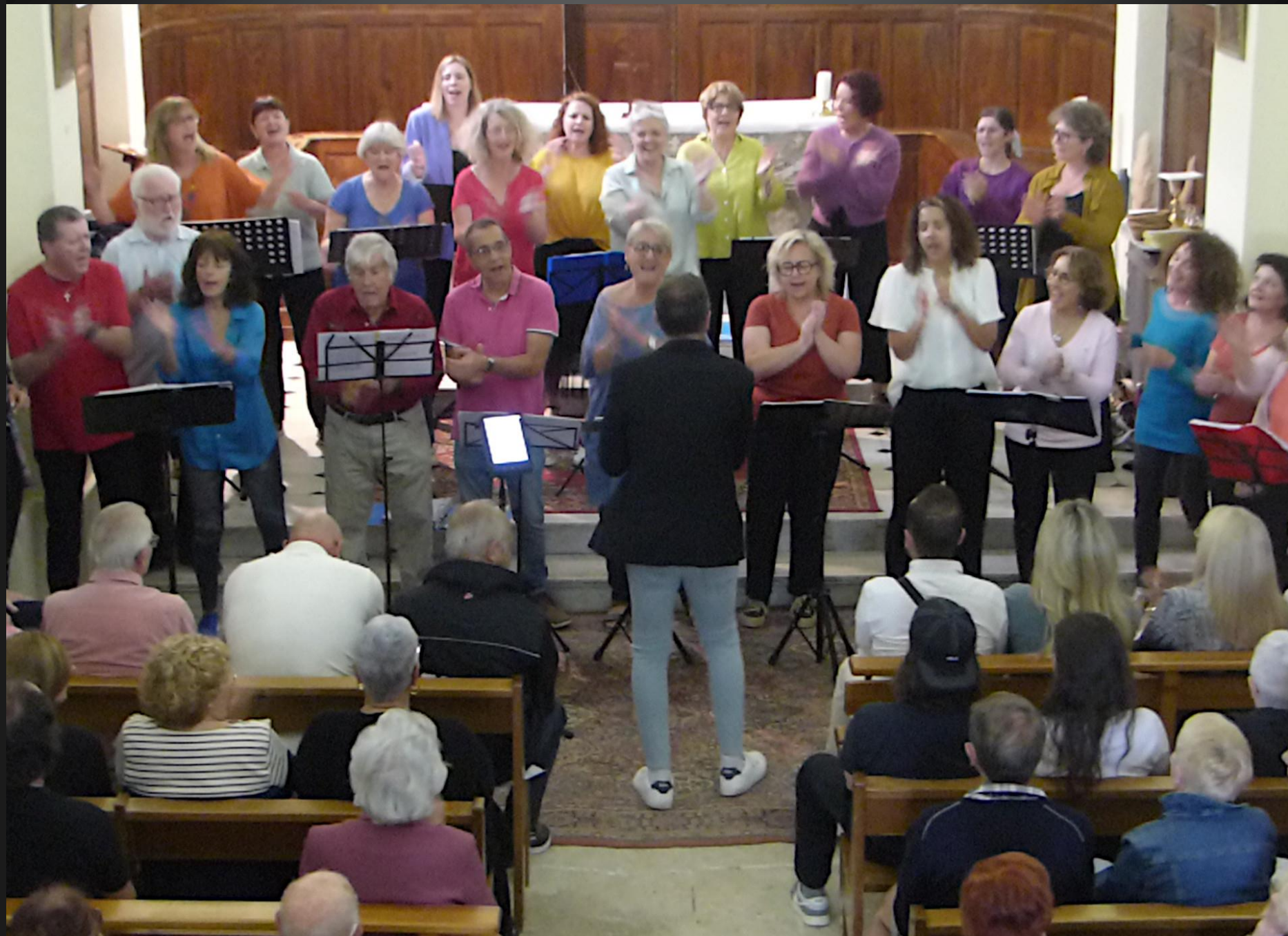
ST JULIEN-LES-MARTIGUES _ Derniers chants, « Amen » et « Oh happy days »