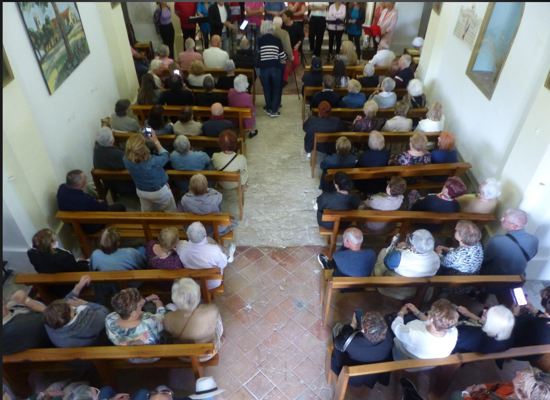
ST JULIEN-LES-MARTIGUES _ Toutes les places assises (environ 80) sont vite occupées...