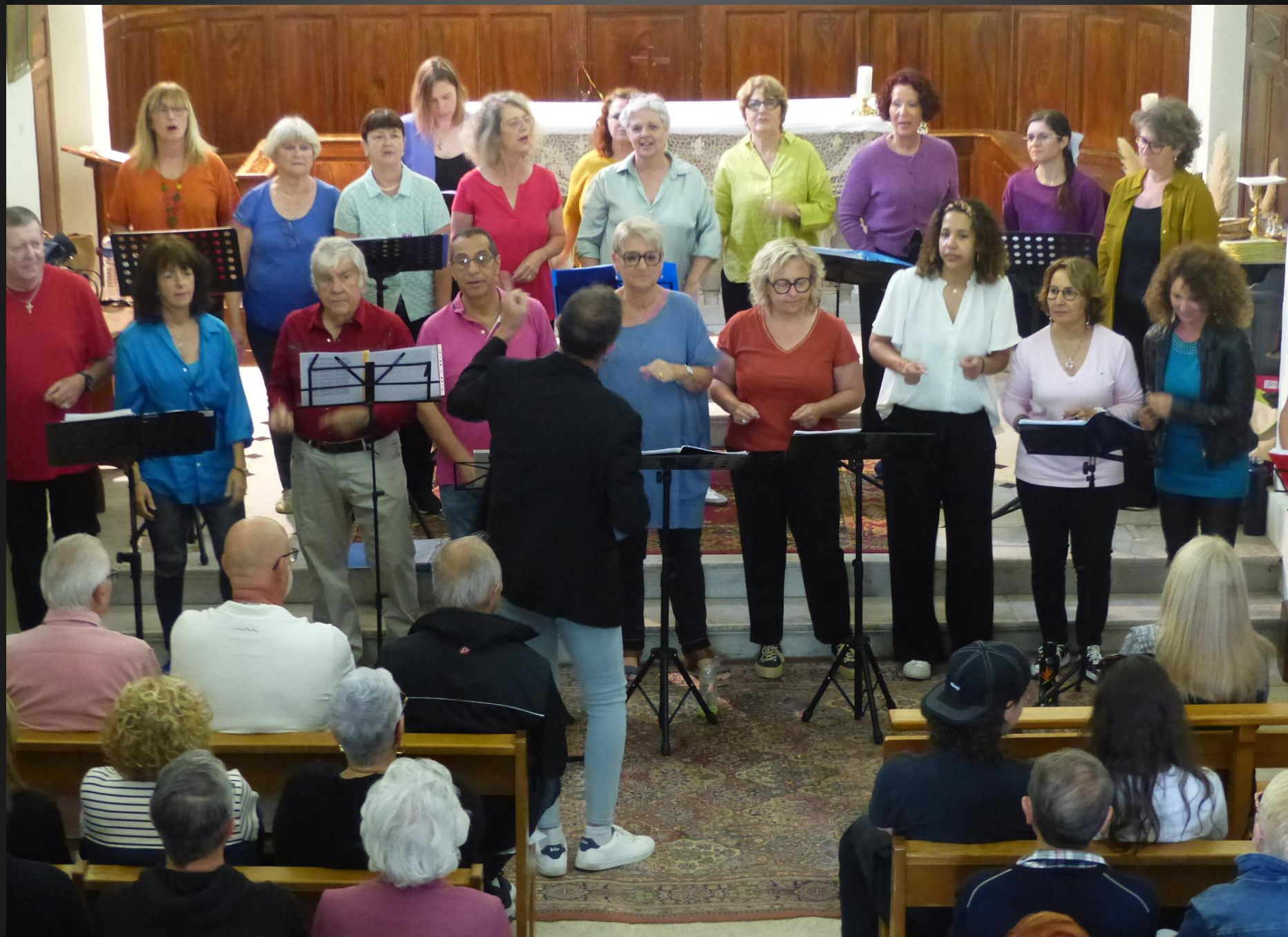
ST JULIEN-LES-MARTTIGUES _ 2 e chant, « Mandela »