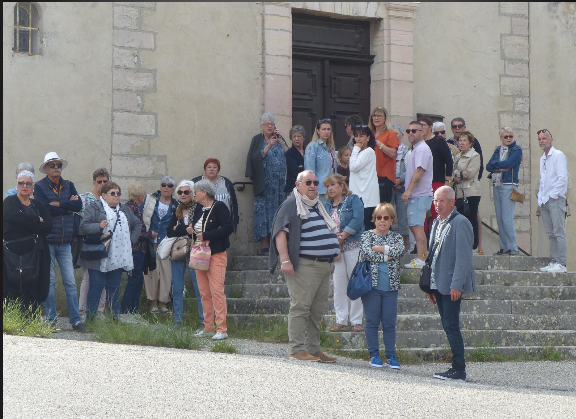
ST JULIEN-LES-MARTTIGUES_ Les paroissiens sont arrivés tôt et attendent l'ouverture de la chapelle.