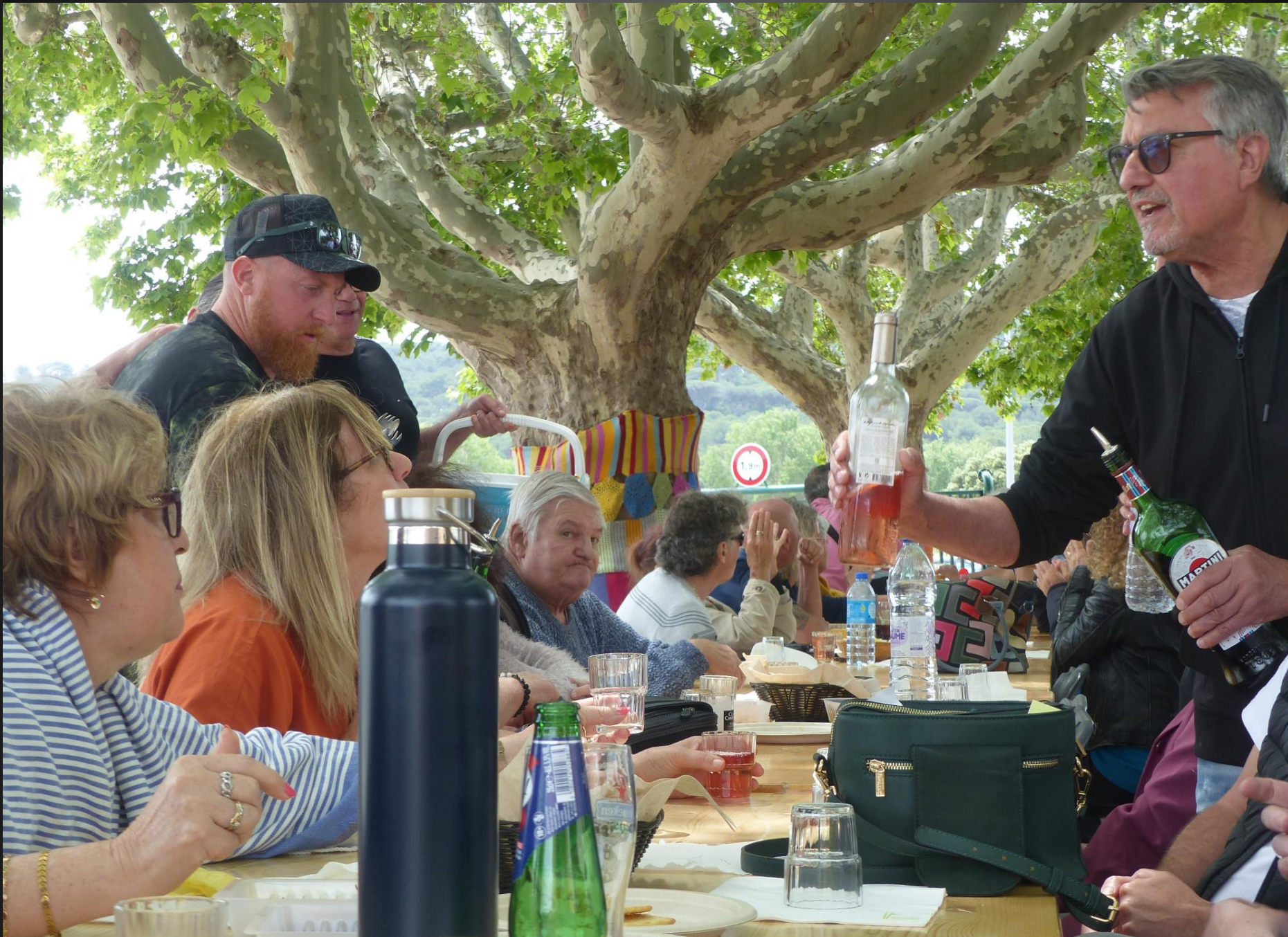
ST JULIEN-LES-MARTIGUES_ Avec les amuse-gueules viennent les boissons rafraichissantes, Pastis, Martini et Rosé de Provence.