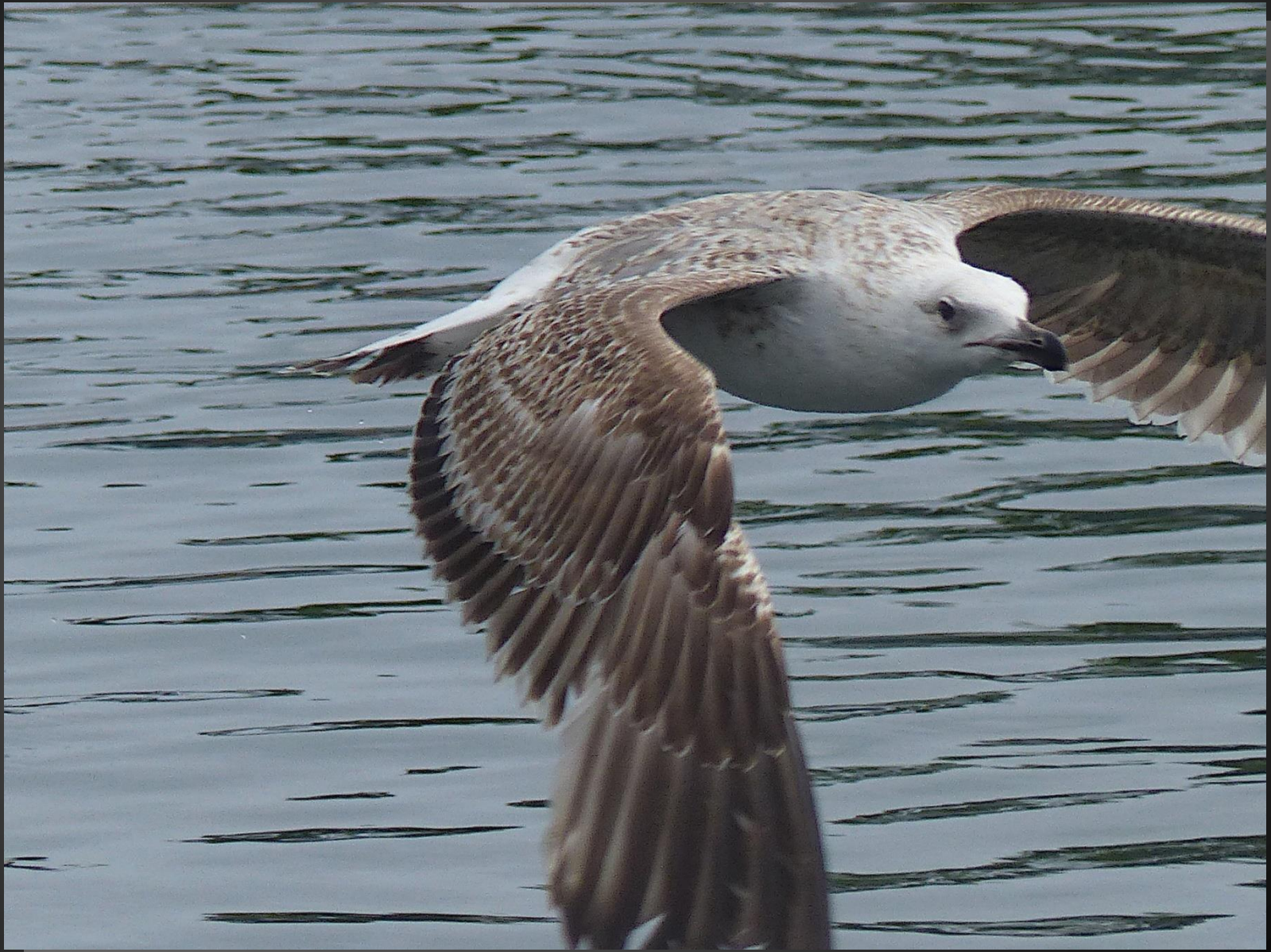
MARTIGUES _ Le Gabian (nom marseillais du goéland leucophée ) est ici chez lui...