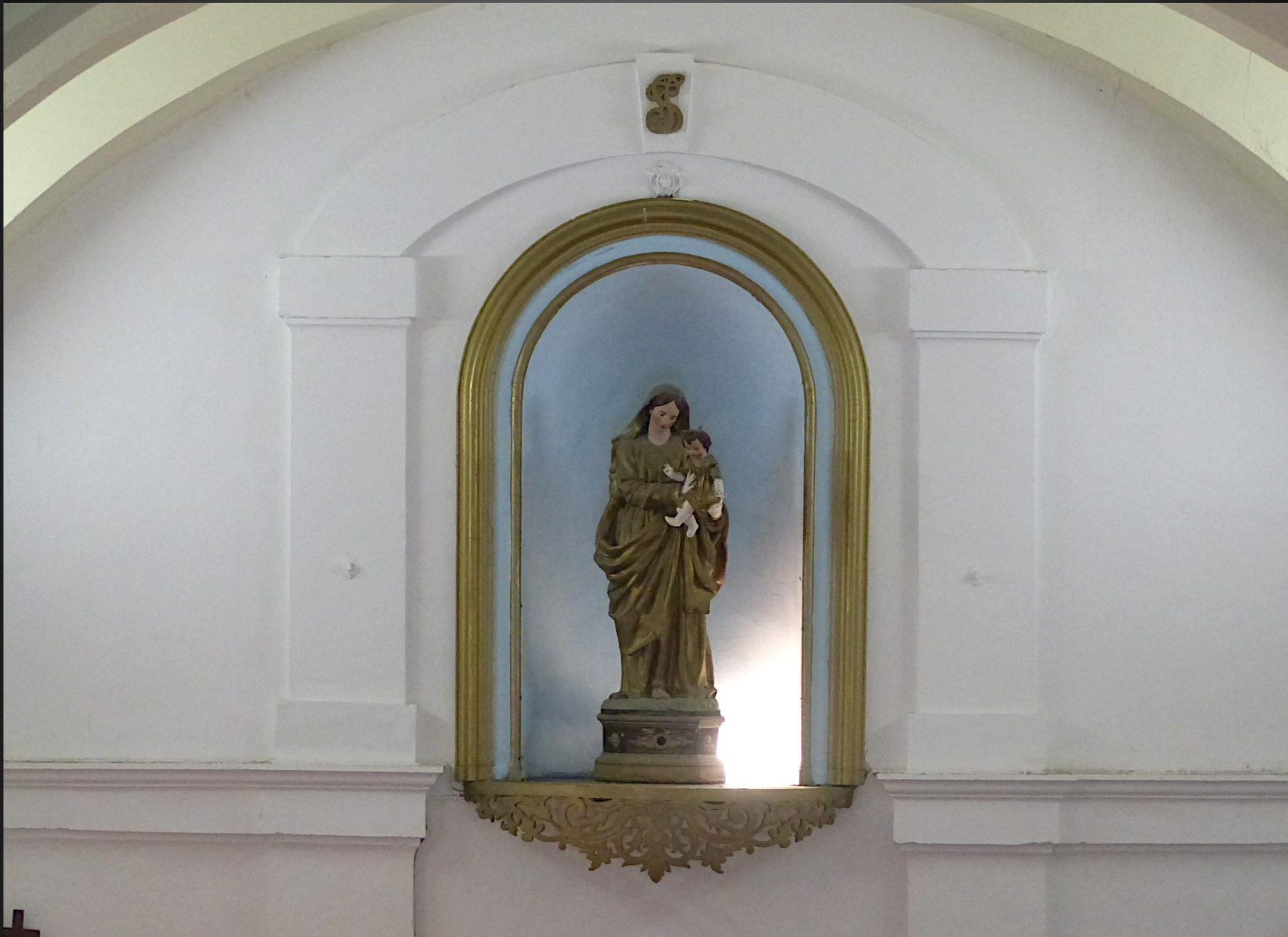
ST JULIEN-LES-MARTIGUES _ Statue d'une Vierge à l'Enfant sur le fond plat de l'abside.