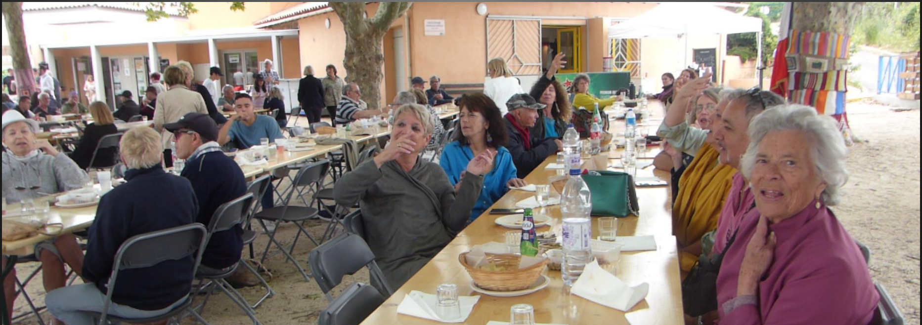
ST JULIEN-LES-MARTIGUES _ Le public suit les chansons populaires reprises par l'orchestre... dont Le Port d'Amsterdam de Jacques Brel.