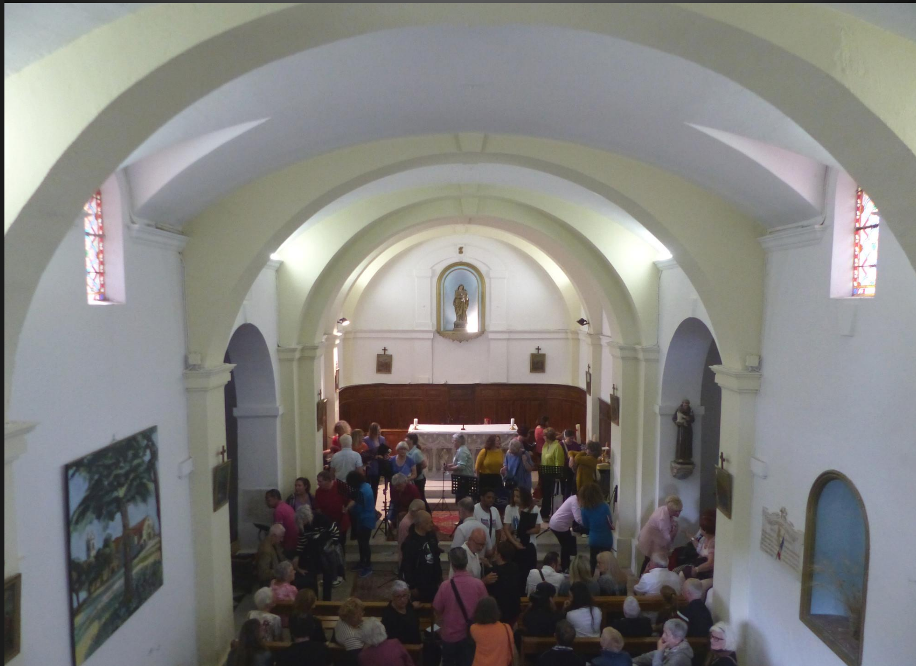
ST JULIEN-LES-MARTIGUES _ Fin de la représentation de Urban Gospel .