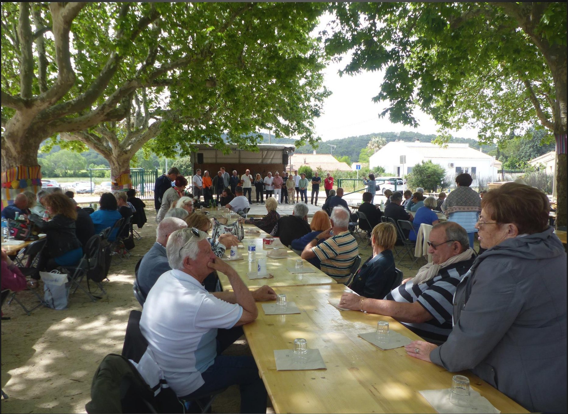
ST JULIEN-LES-MARTIGUES _ Le public attend patiemment l'heure de l'apéro ...