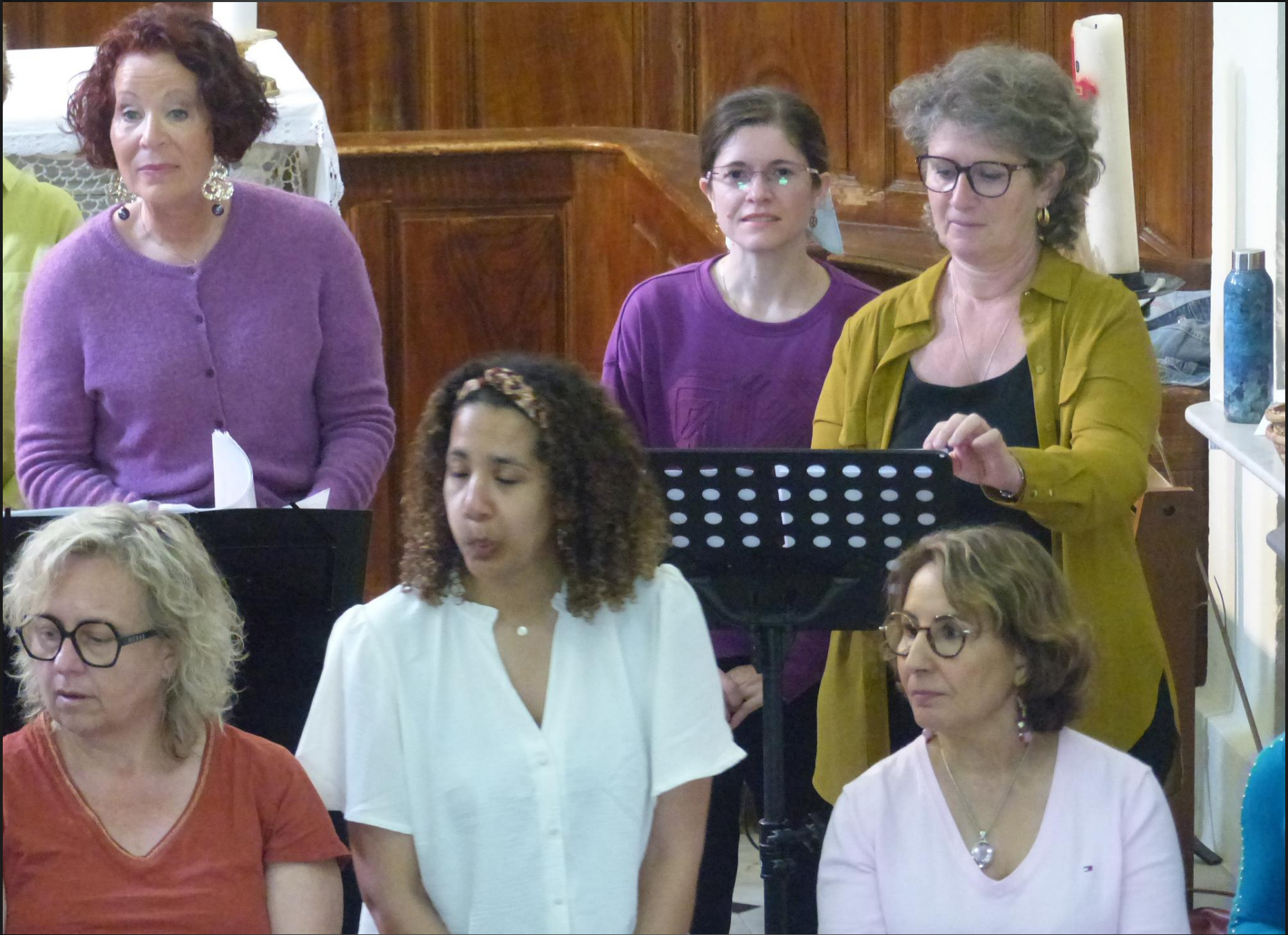
ST JULIEN-LES-MARTTIGUES _ Cinquième chant, « Hail holy queen »