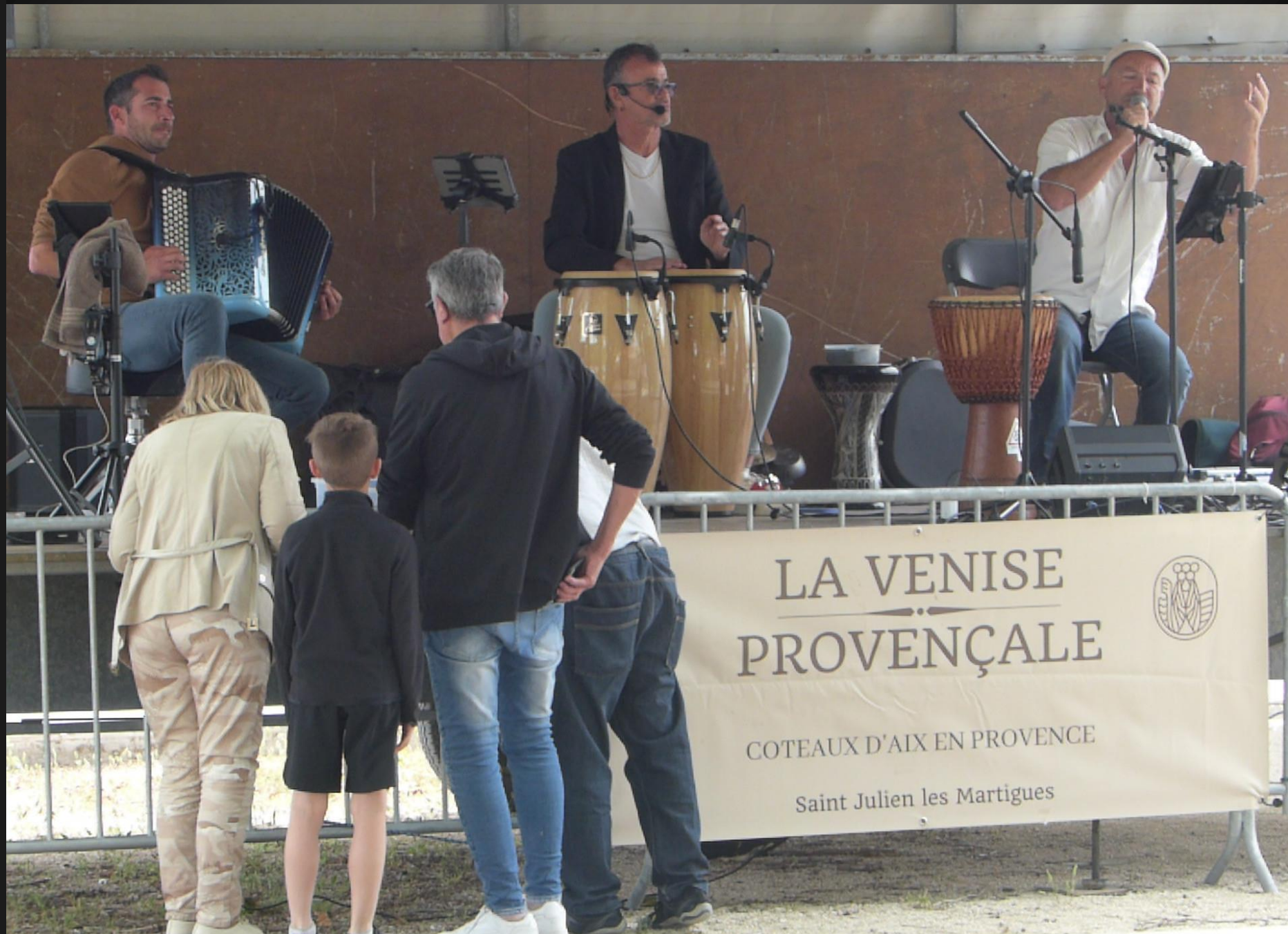
ST JULIEN-LES-MARTIGUES _ L'expression Venise Provençale désigne Martigues, la ville aux multiples canaux, entre mer et étang.