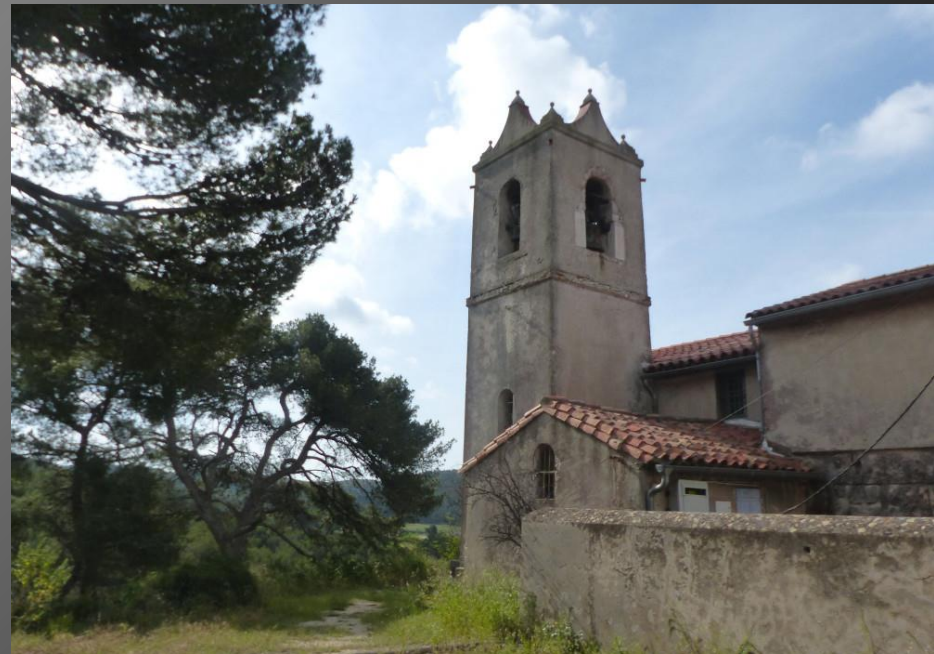
ST JULIEN-LES-MARTTIGUES _ Le clocher de la chapelle Saint-Julien.