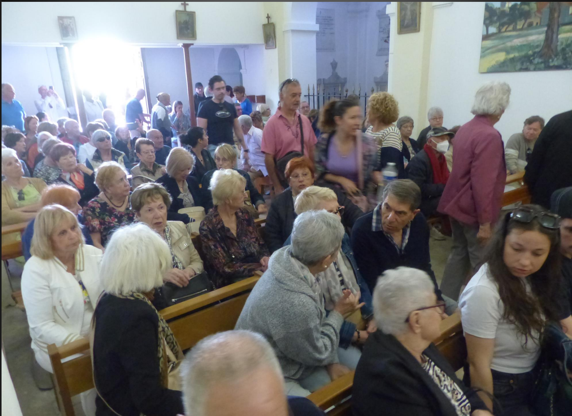
ST JULIEN-LES-MARTTIGUES _ La petite chapelle à nef unique est rapidement comble.