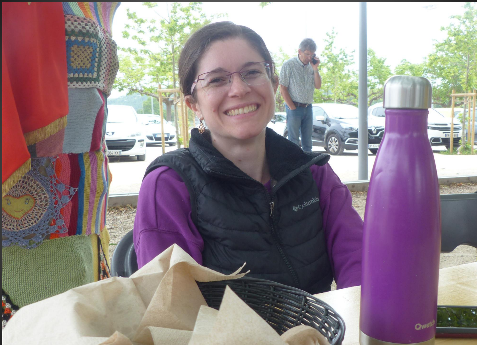
ST JULIEN-LES-MARTIGUES _ La fête fut franchement joyeuse, à l'image du Gospel qui chante la Bonne Nouvelle .