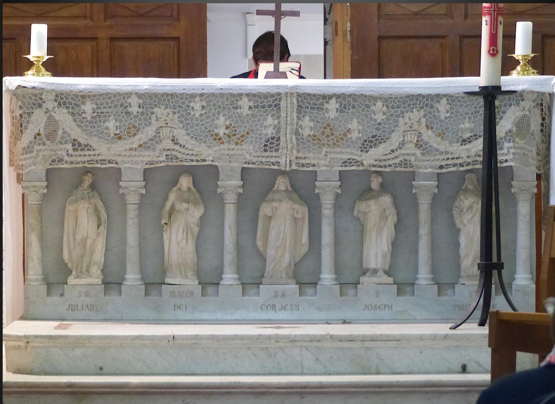
ST JULIEN-LES-MARTIGUES _ Dans le marbre de l'autel se dégagent cinq haut-reliefs : St Julien, Mater Dei, S S Cor Jesu, St Joseph, Ste Philomène ...