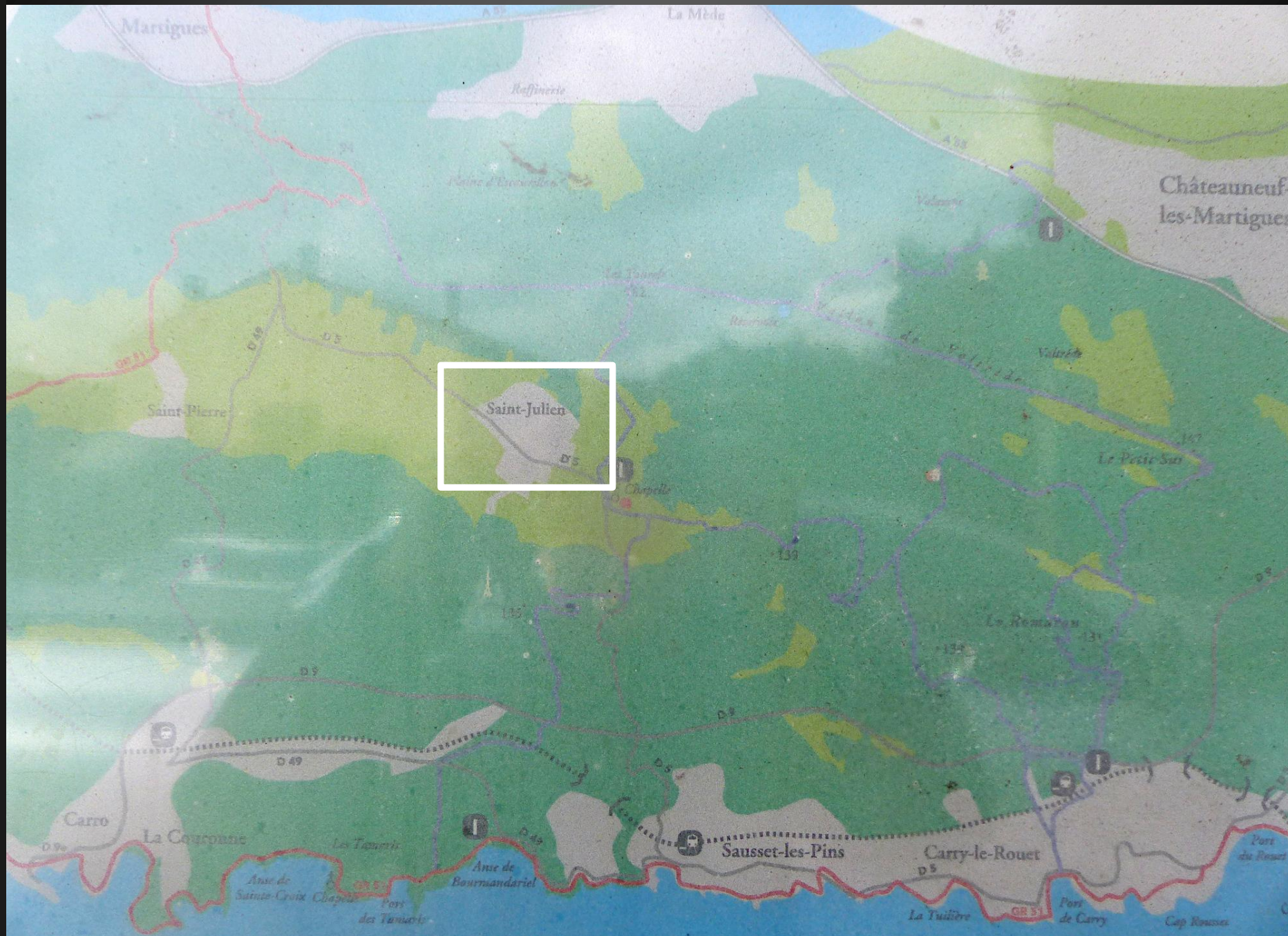
ST JULIEN-LES-MARTIGUES_ Village de 1200 habitants intégré à la commune de Martigues, à mi-chemin entre Martigues et Sausset-les-Pins