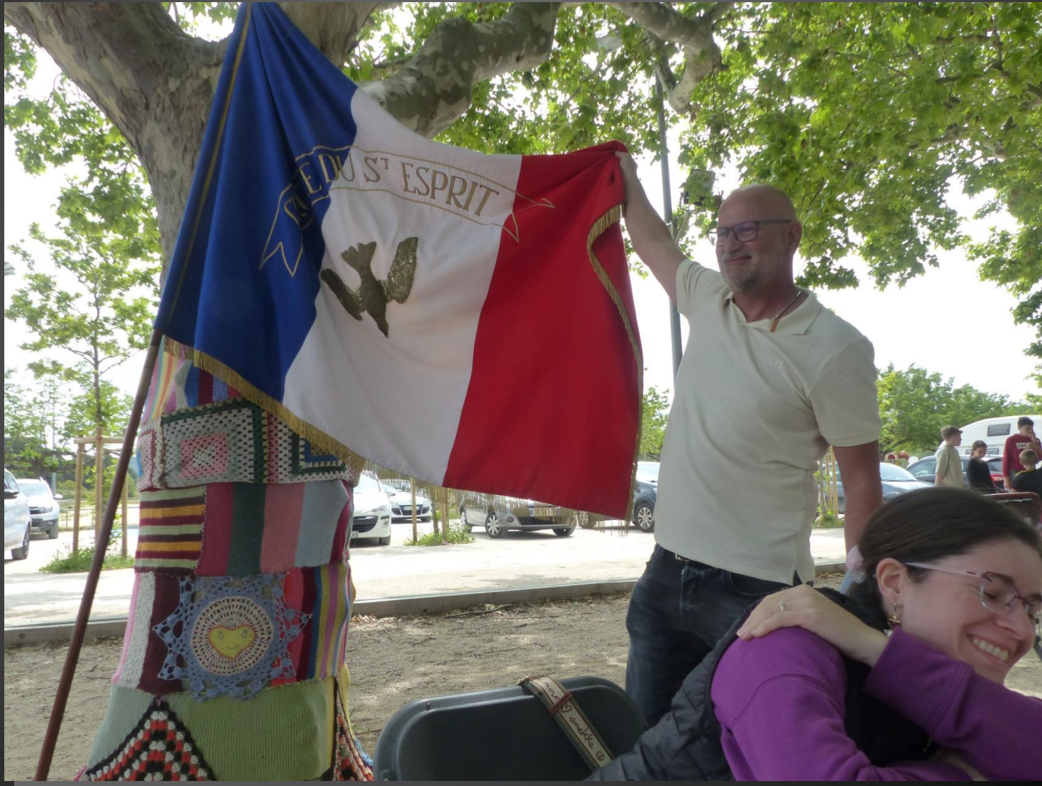
ST JULIEN-LES-MARTIGUES _ Apéritif offert sous les platanes, derrière la Maison pour Tous.