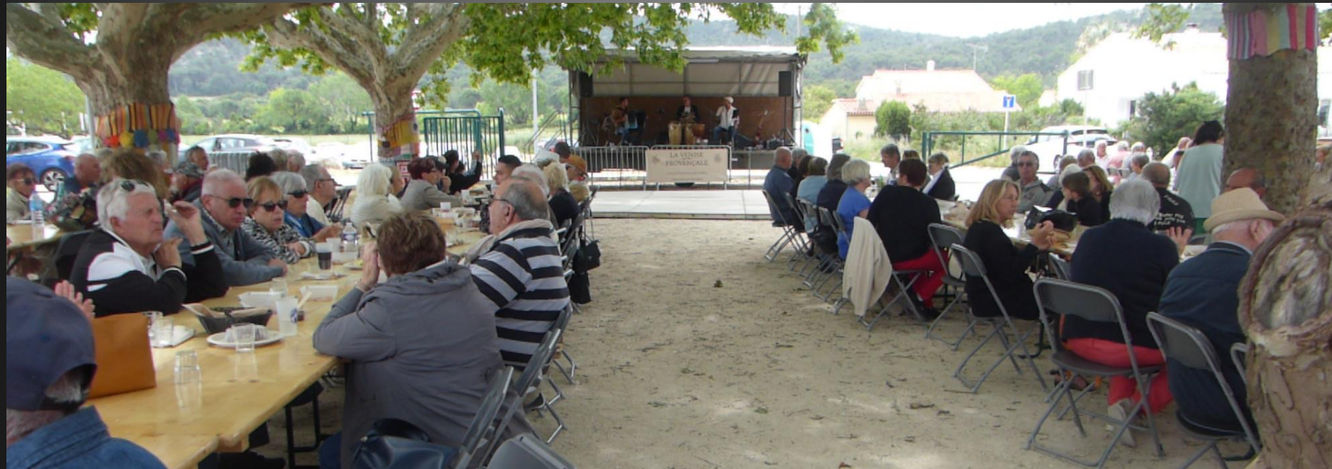
ST JULIEN-LES-MARTIGUES _ Des chansons qui font rêver... « Emmenez-moi » (Charles Aznavour)