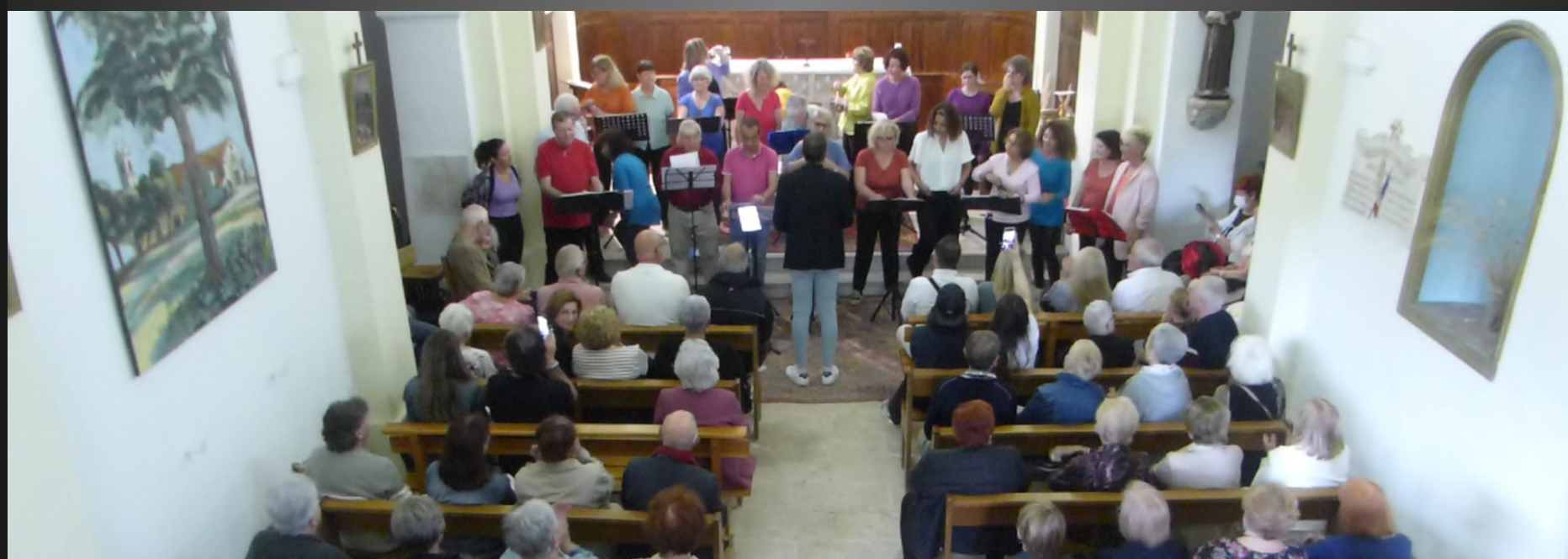
ST JULIEN-LES-MARTIGUES _ Troisième chant, « We shall overcome »