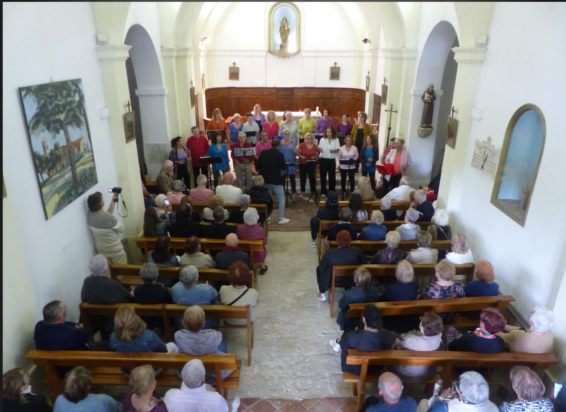
ST JULIEN-LES-MARTTIGUES _ Premier chant, « Listen to the rain ».