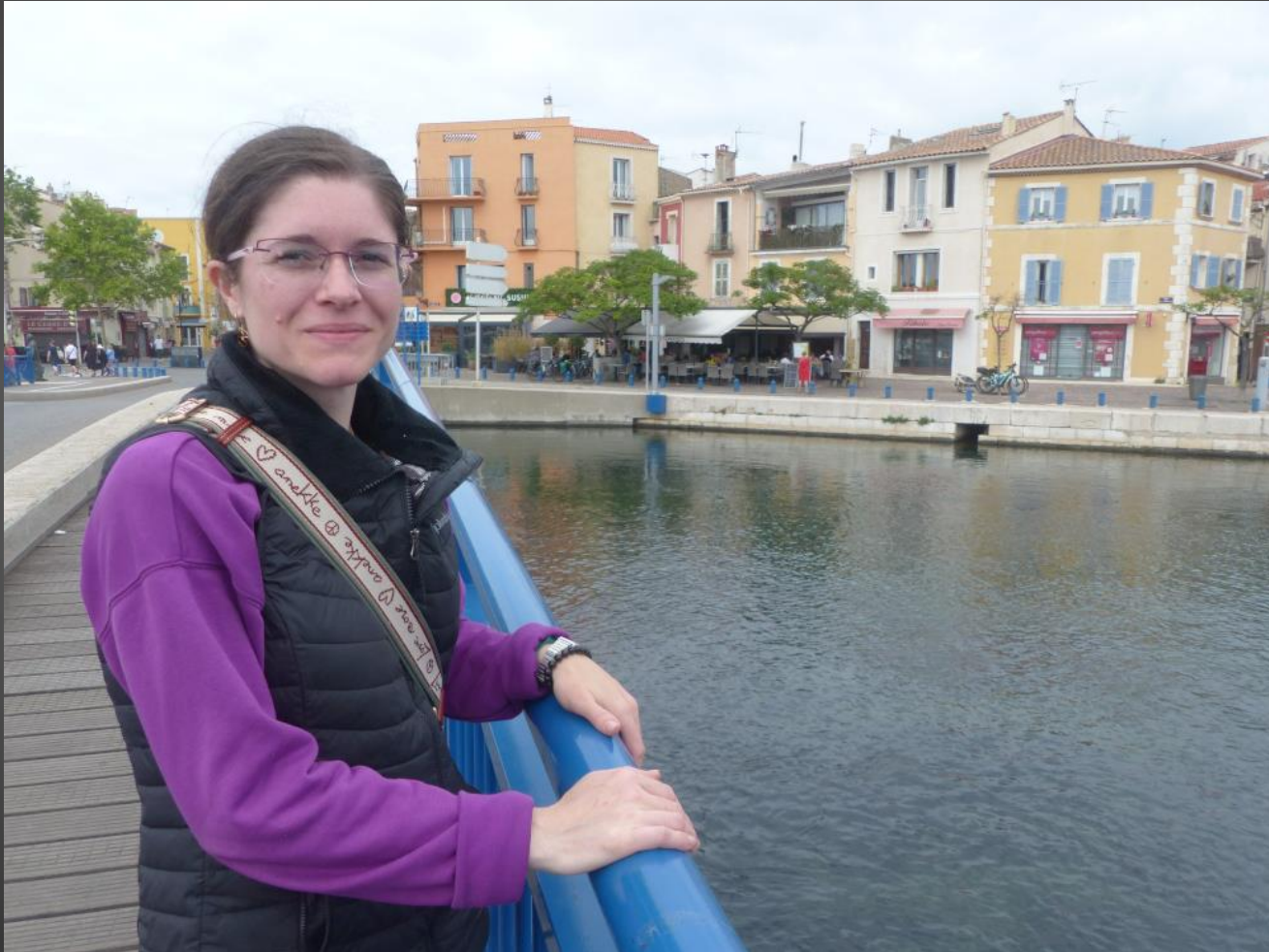
MARTIGUES _ Une petite pause dans la très romantique Venise Provençale , avant de retourner chez soi.