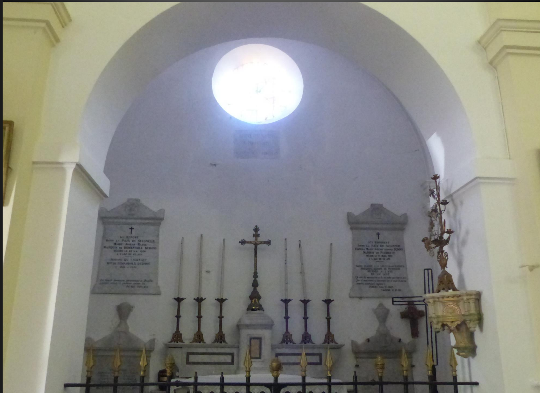
ST JULIEN-LES-MARTIGUES _ Chapelle funéraire de la famille Dedons de Pierrefeu.