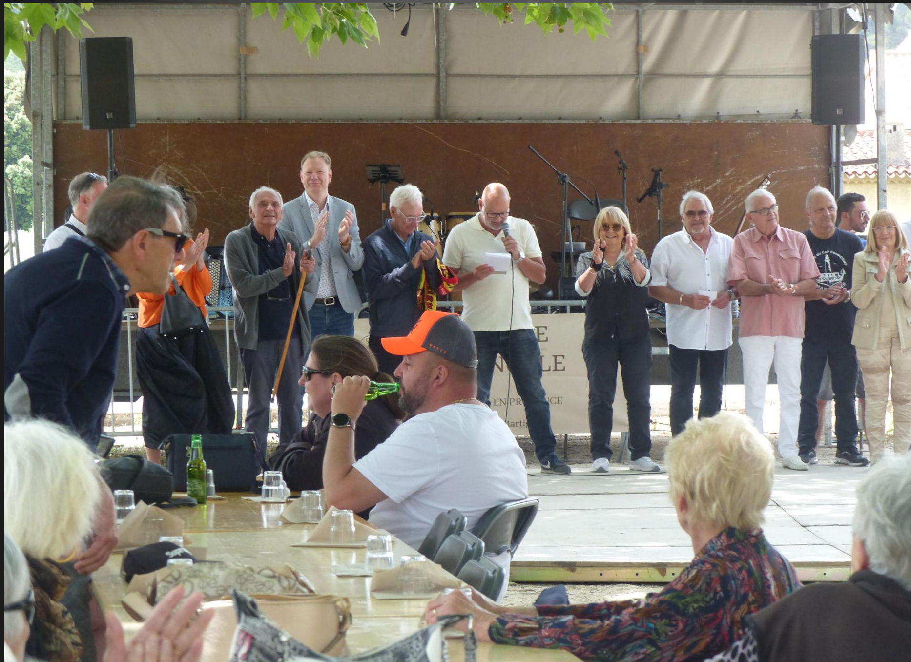
ST JULIEN-LES-MARTIGUES_ Applaudissements pour les bénévoles qui ont préparé la fête.