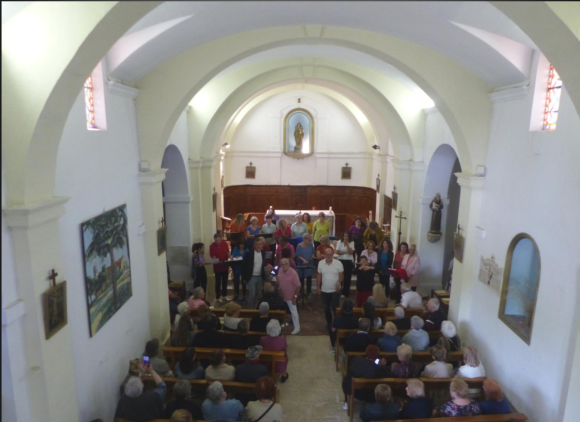
ST JULIEN-LES-MARTIGUES _ La chorale URBAN GOSPEL s'est mise en place devant l'autel.