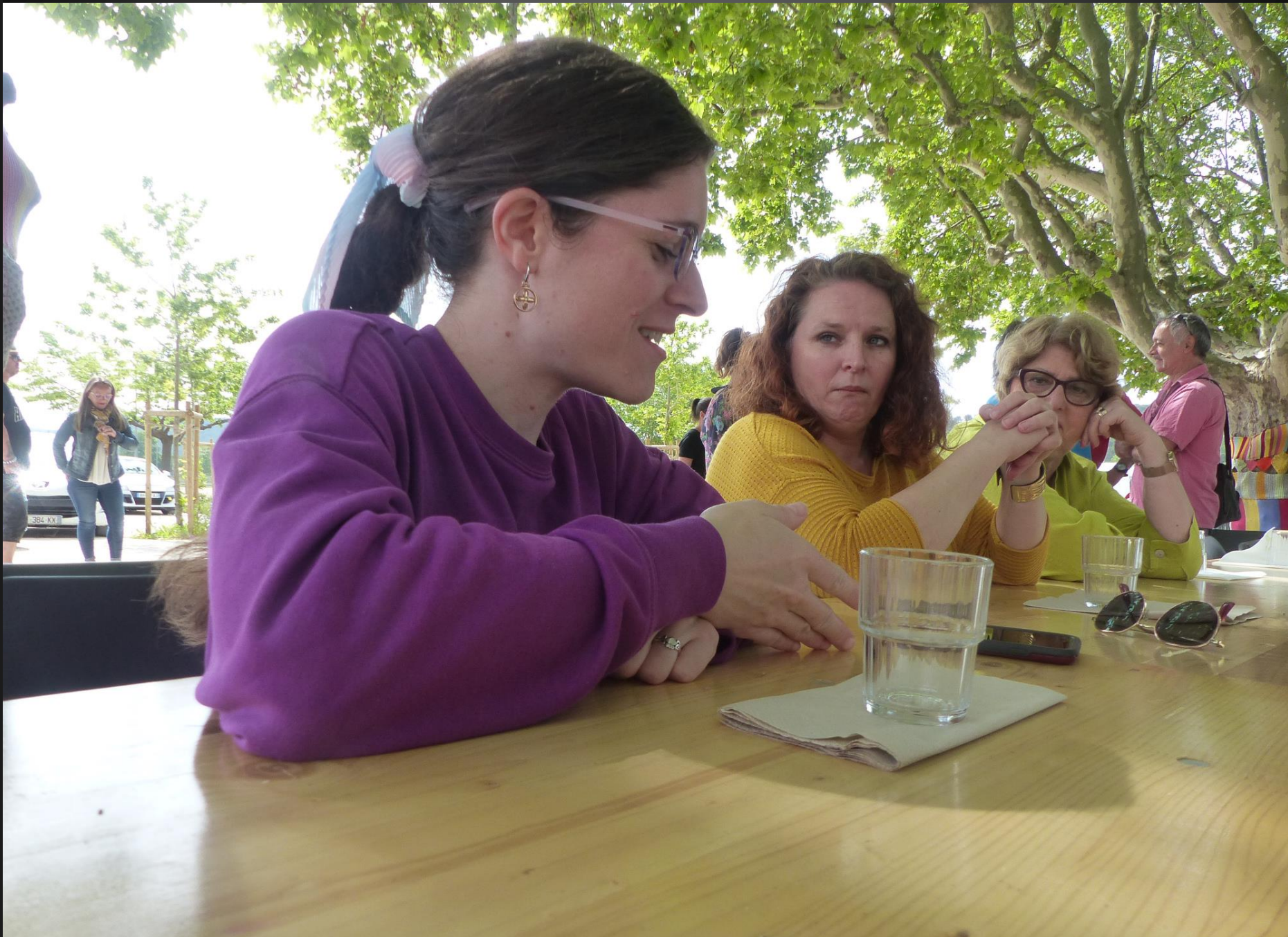
ST JULIEN-LES-MARTIGUES_ Pendant ce temps, les discussions vont bon train.