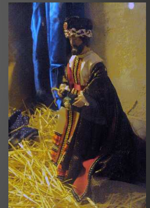
L'église Saint-Martin, le 26 janvier 2014, jour du Pastrage, avec l'ancien clocher roman du XIIe siècle (à g.) qui servait de tour de guet dans les temps peu sûrs du Moyen Age, et l'édifice néo-roman qui date du XIXe : deux agnelets ont été bénis à la Messe des Bergers avant la procession des offrandes. A droite, l'un des trois Rois Mages venus à Bethléem offrir l'or, l'encens et la myrrhe à l'Enfant-Roi.