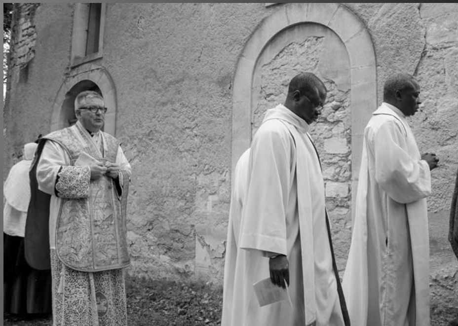
Chapelle St Bonet de Lagoy _ Après la cérémonie, les pèlerins font trois fois le tour de la chapelle au son des galoubets et tambourins, suivant ainsi l'ancienne tradition à Lagoy, afin d'obtenir du Saint des grâces de guérison pour prévenir maux de ventre et fièvre malignes.