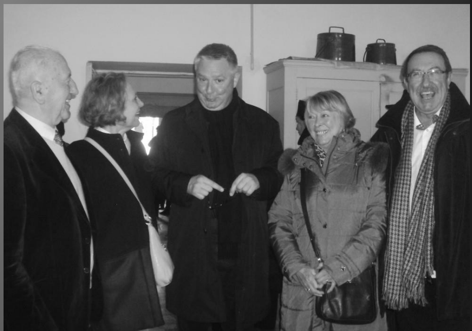
LE DOMAINE DE LAGOY _ Cette année, le temps pluvieux n'a point permis la fête provençale dans la cour du château, néanmoins le vin chaud était le bienvenu. Fidèle à cette dévotion à saint Bonet depuis tant d'années, le Père Desplanches a manifestement plaisir à revoir ses hôtes.