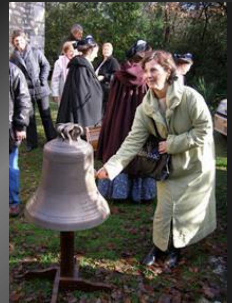
CHAPELLE SAINT-BONET DE LAGOY _ Prières après la procession des fidèles autour de la chapelle.