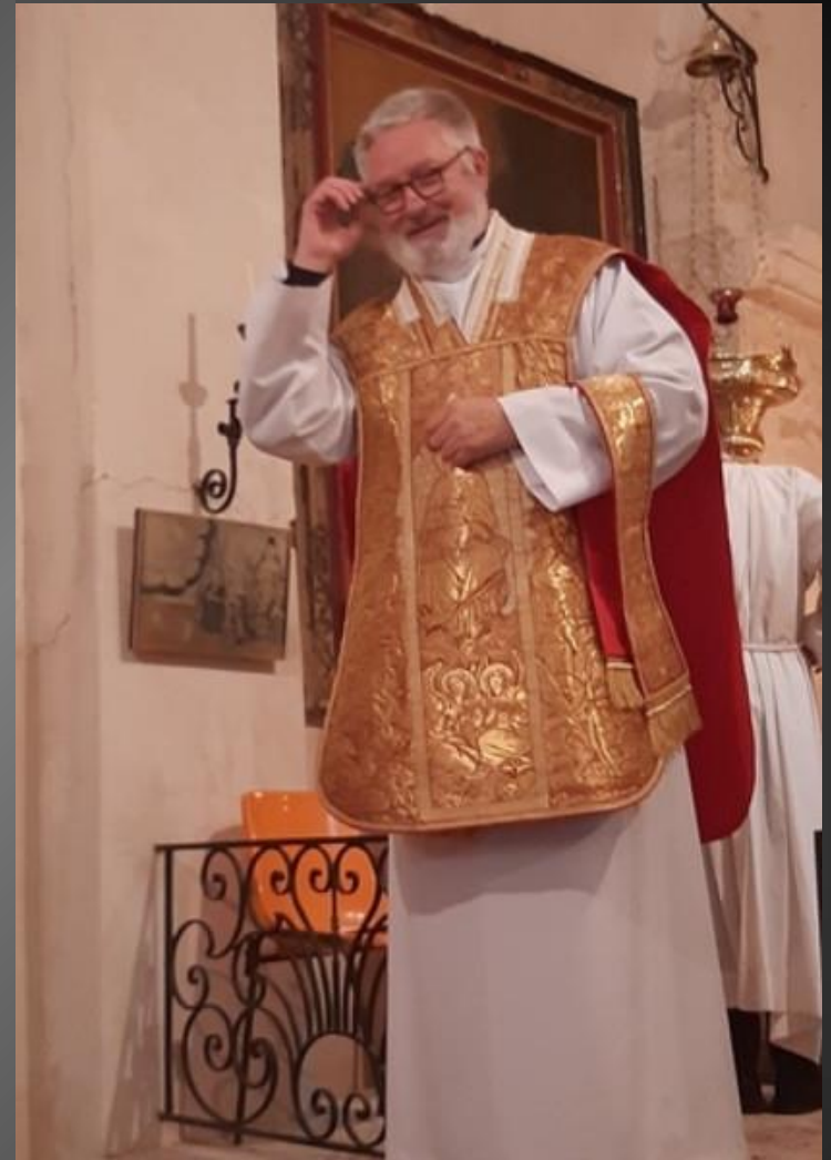
CHAPELLE SAINT-BONNET DE LAGOY

Comme chaque année a eu lieu la célébration en l'honneur de Saint Bonnet dans la chapelle du domaine de Lagoy. (Cette année, Saint Bonnet était fêté le 14 janvier)