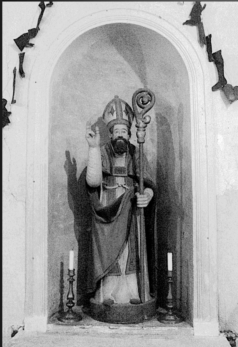
Chapelle St Bonet de Lagoy _ Statue de saint Bonet dans une niche sur le mur de la chapelle.