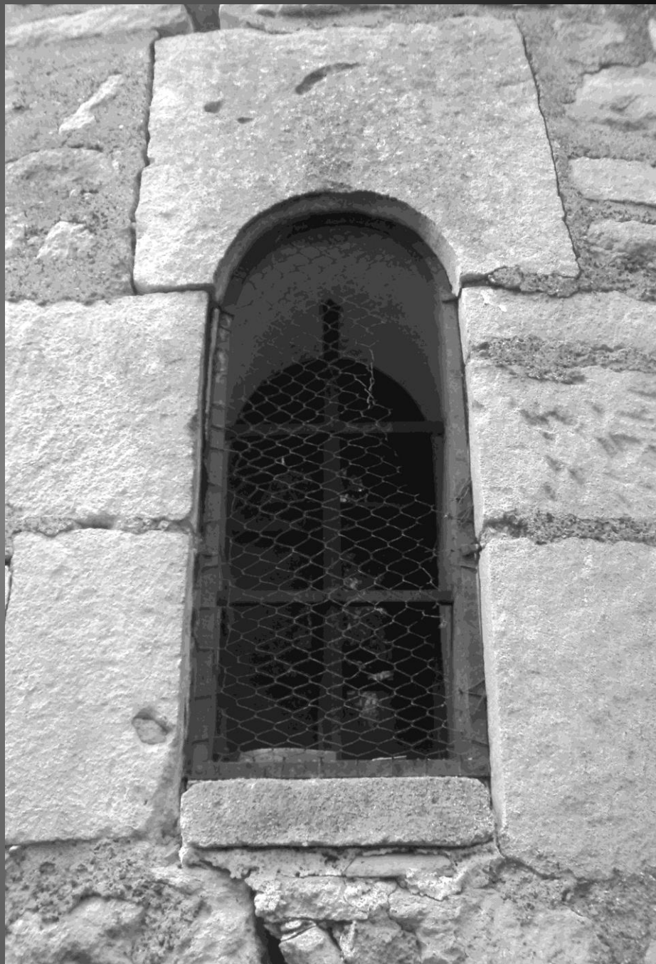
Chapelle St Bonet de Lagoy _ Détails de l'architecture romane.