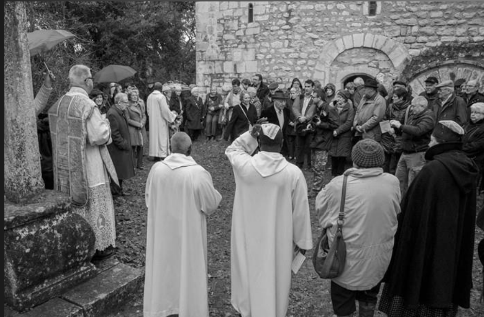
Chapelle St Bonet de Lagoy _ Cette tradition multi séculaire est chère au cœur des Saint-Rémois, qui participent quel que soit le temps, même pluvieux comme ce 18 janvier.