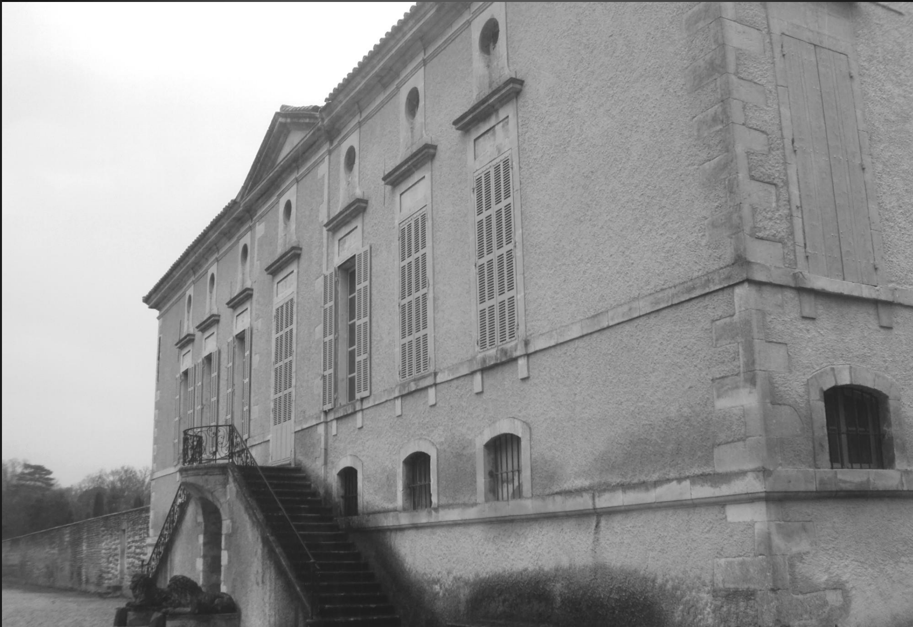
LE DOMAINE DE LAGOY, éléments protégés _ Le château, avec la cour d'honneur, la grille d'entrée, le parc et la chapelle Saint-Bonnet qui s'y trouve comprise, sont classés par arrêté du 11 mars 1946, modifié par arrêté du 14 décembre 2010. En totalité : le pigeonnier avec le poulailler et son enclos ; le bâtiment agricole renfermant le moulin à huile et la cave viticole ; le puits ; les deux meules à broyer ; le bassin de pierre enterré devant la façade du logement du fermier : inscription par arrêté du 19 juillet 2006.