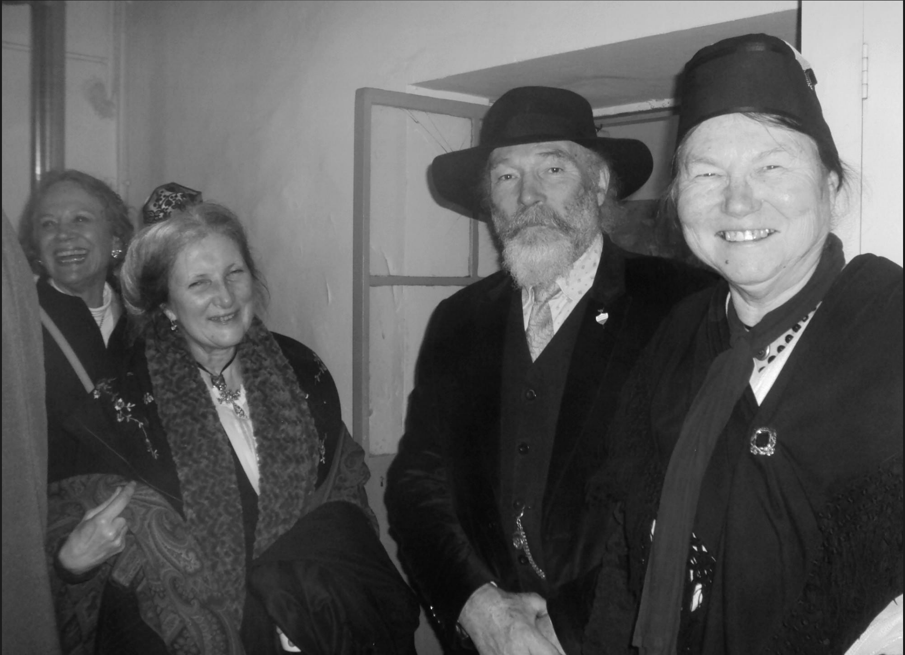
LE DOMAINE DE LAGOY _ Nous avons retrouvé ces Provençaux de Vernègues dans de nombreuses fêtes traditionnelles de la région ainsi qu'à Lourdes pour le pèlerinage de la Nation Gardiane.