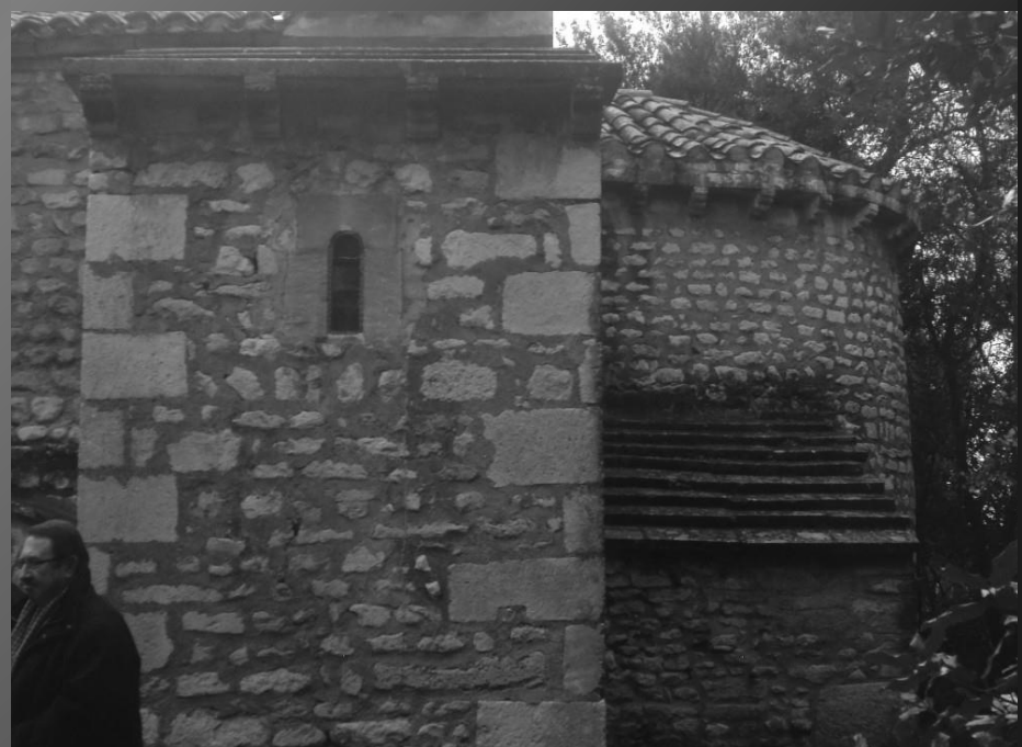
Chapelle St Bonet de Lagoy _ Détails de l'architecture romane : toit de lauzes, dalles de pierre plate et abside semi-circulaire. .