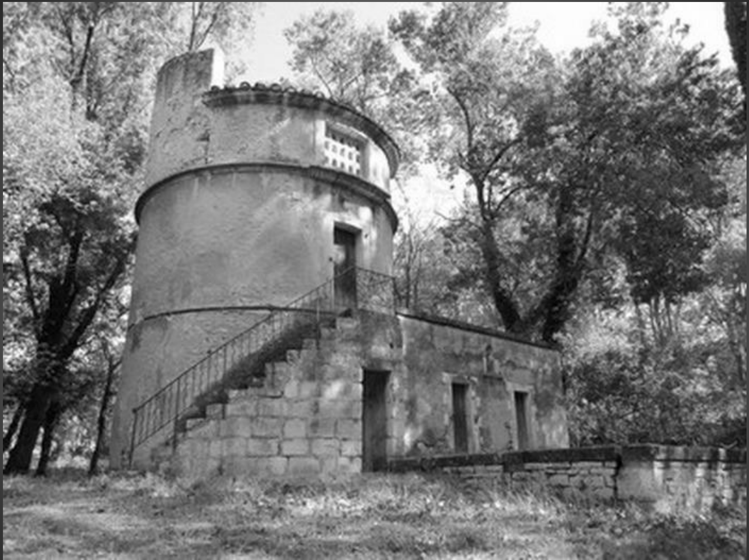
LE DOMAINE DE LAGOY _ Le pigeonnier du XVIIe siècle, avec poulailler et enclos, est une curiosité.