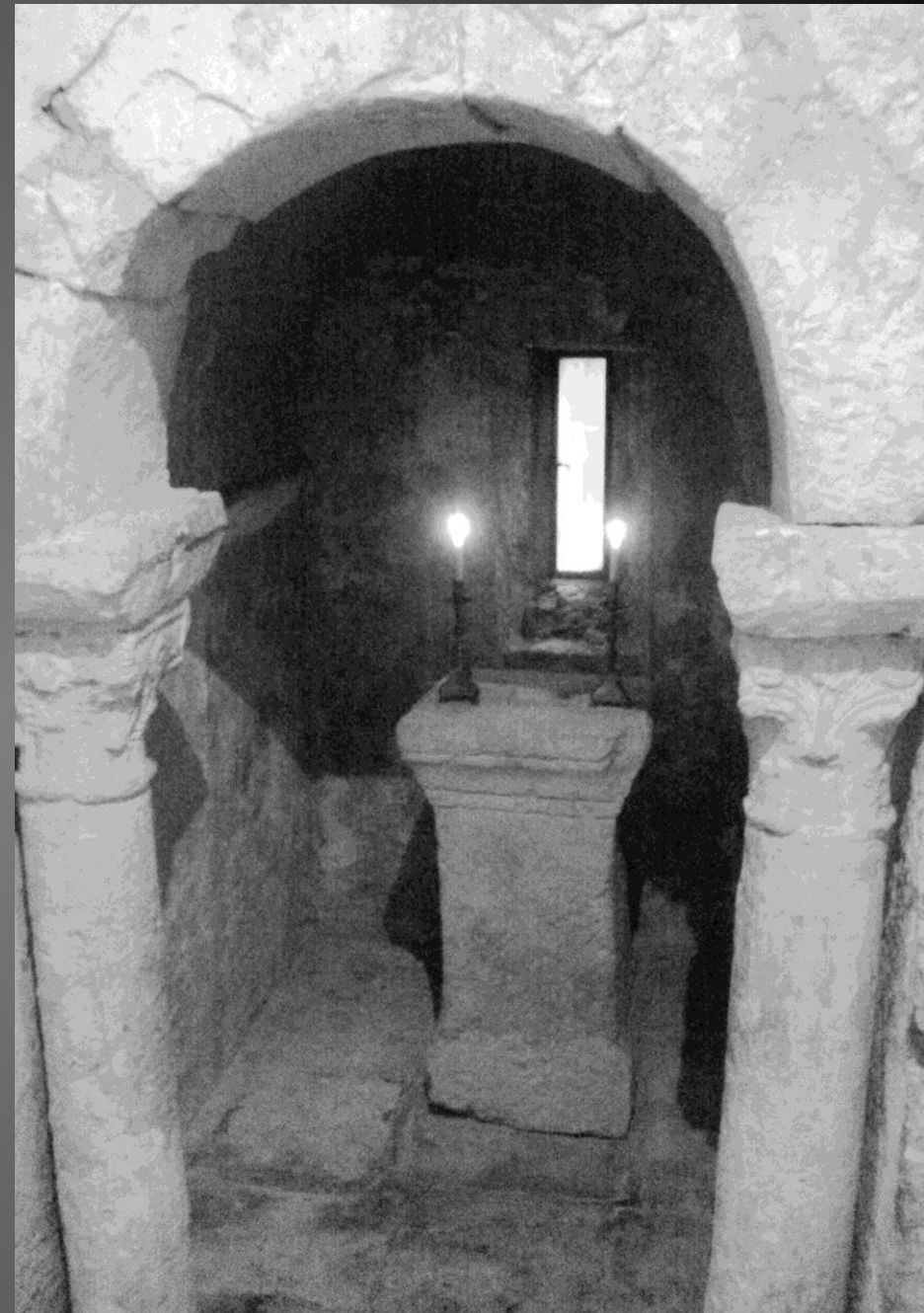
Chapelle St Bonet de Lagoy _ Une statue représentant saint Bonnet trône au-dessus de l'autel. Une petite chapelle latérale avec autel et colonnes romaines aux chapiteaux ouvragés, rappelle que le Domaine de Lagoy est sis sur l'emplacement d'une Villa antique.