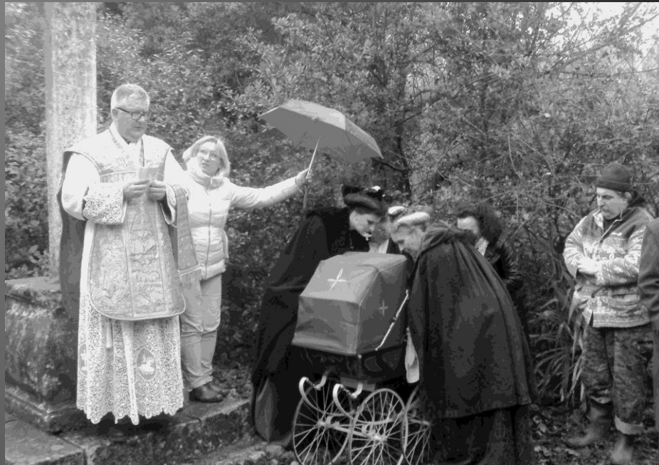
Chapelle St Bonet de Lagoy _ Des dames sont venues en costume d'Arles, maintenant, elles mettent le bébé à l'abri dans sa poussette... il va être temps de se mettre à l'abri de la pluie au Domaine.