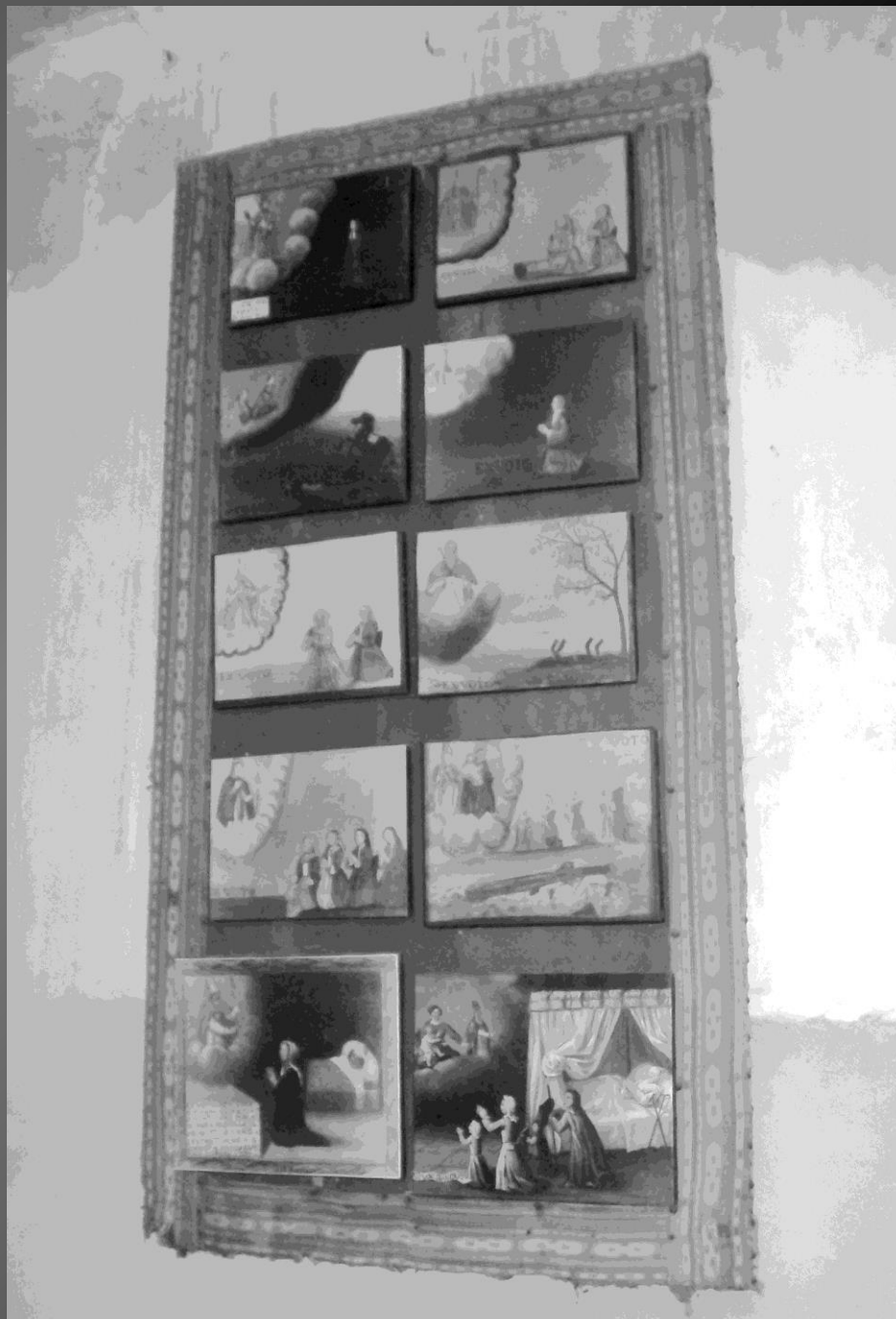
Ex-votos, peintures naïves, témoignages des grâces reçues.