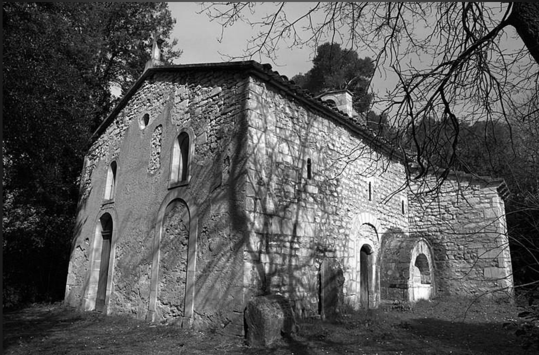
Chapelle St Bonet de Lagoy _ Cette chapelle romane du XI e siècle – édifice le plus ancien du Domaine de Lagoy – fut autrefois l'église paroissiale d'un petit village ou « castrum », disparu à la fin du Moyen-Âge, qui a donné son nom, Lagoy (d'origine gauloise et signifiant « la source »), au château et au domaine tout entier. Comme souvent, ce village médiéval était lui-même l'héritier d'une villa antique. Le chevet de l'église primitive, datant du VIIIe siècle, est incorporé dans la chapelle actuelle, qui reçut au XVIIe siècle, dans le cadre des nouvelles dévotions associées à la Contre-Réforme, son nom actuel de Saint-Bonet, évêque de Clermont mort en 710 qui est aussi le Saint Patron de la petite ville voisine d'Eyragues. Ce saint guérisseur, qui a accompli plusieurs miracles, est évoqué notamment pour les maux de ventre et les fièvres malignes. Source : https://domaine-lagoy.com/histoire/traditions-fetes-st-remy/