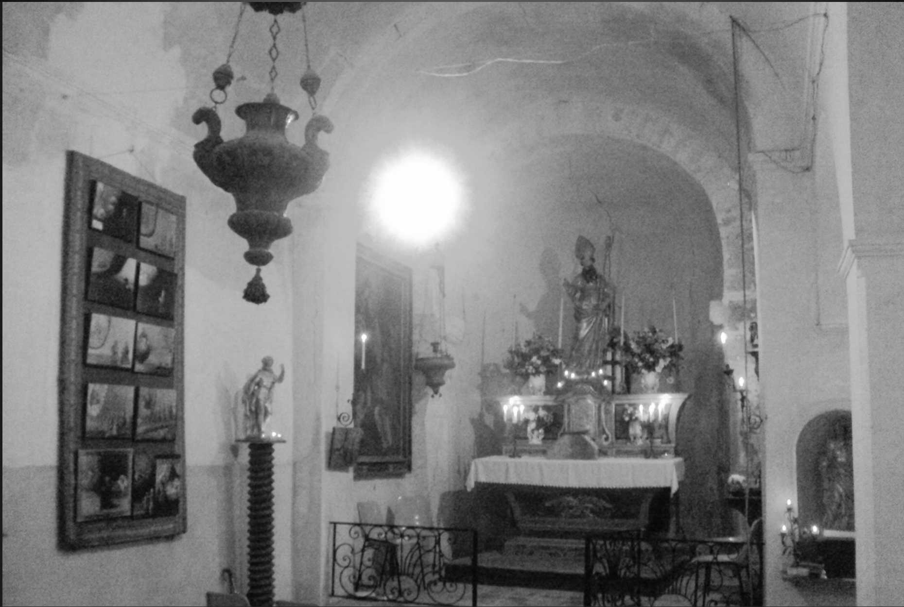
Chapelle St Bonet de Lagoy _ L'abside, voûtée en cul-de-four, serait une partie de l'église primitive du VIIIe siècle incorporée à la chapelle. L'autel et la grille de communion en fer forgé ont résisté aux outrages du temps et des hommes ...