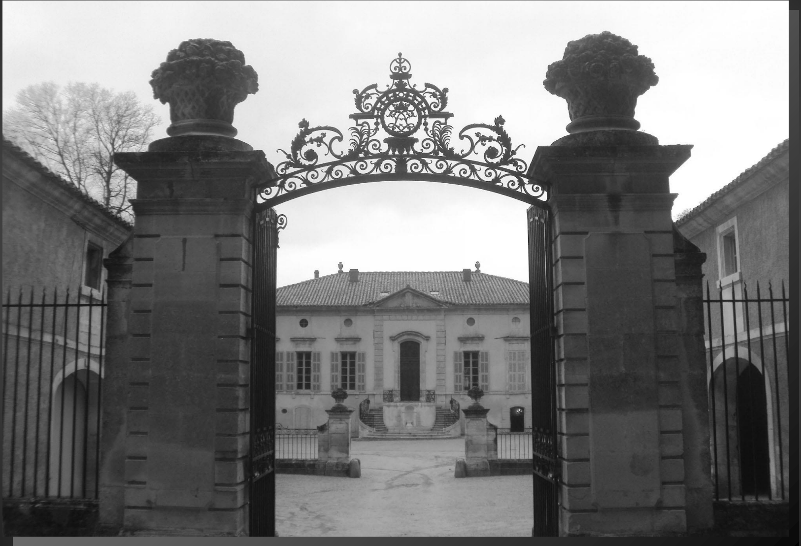
LE DOMAINE DE LAGOY _ Un lieu occupé depuis l'époque gallo-romaine sous forme de villa, puis castrum regroupé autour de la chapelle.