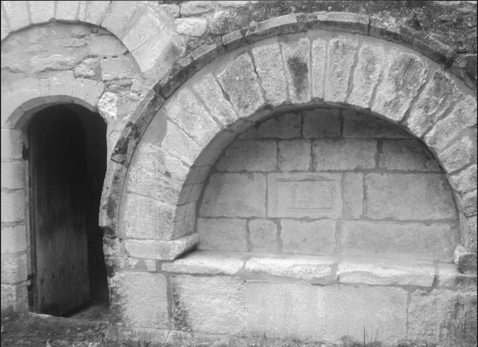
Chapelle St Bonet de Lagoy _ Un enfeu imposant – en plein cintre – a été édifié pour abriter un tombeau près de la porte d’entrée de la chapelle.