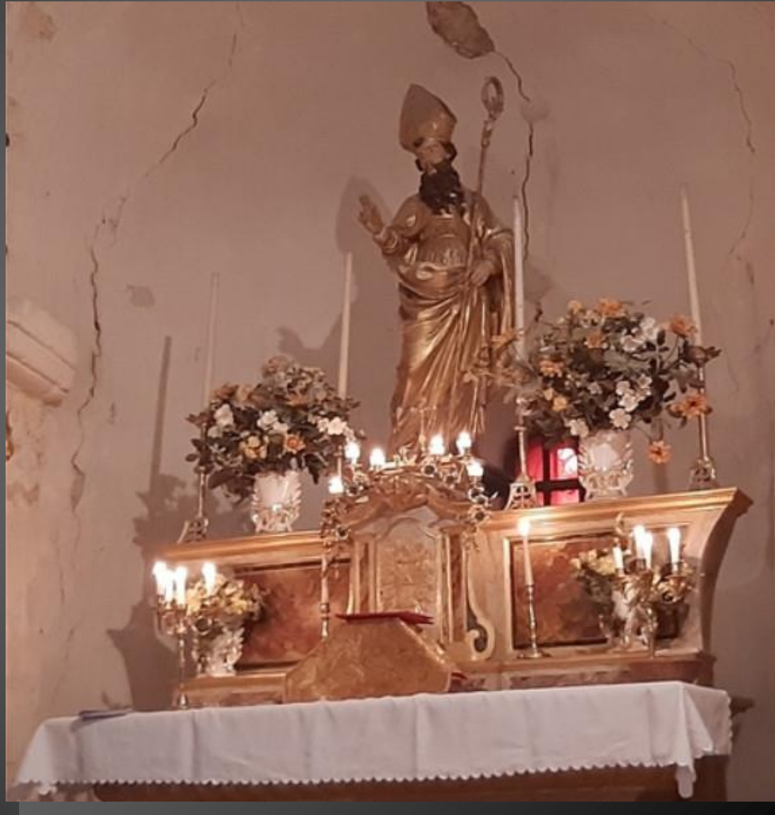
Chapelle Saint-Bonet de Lagoy _ L'autel de Saint Bonet.