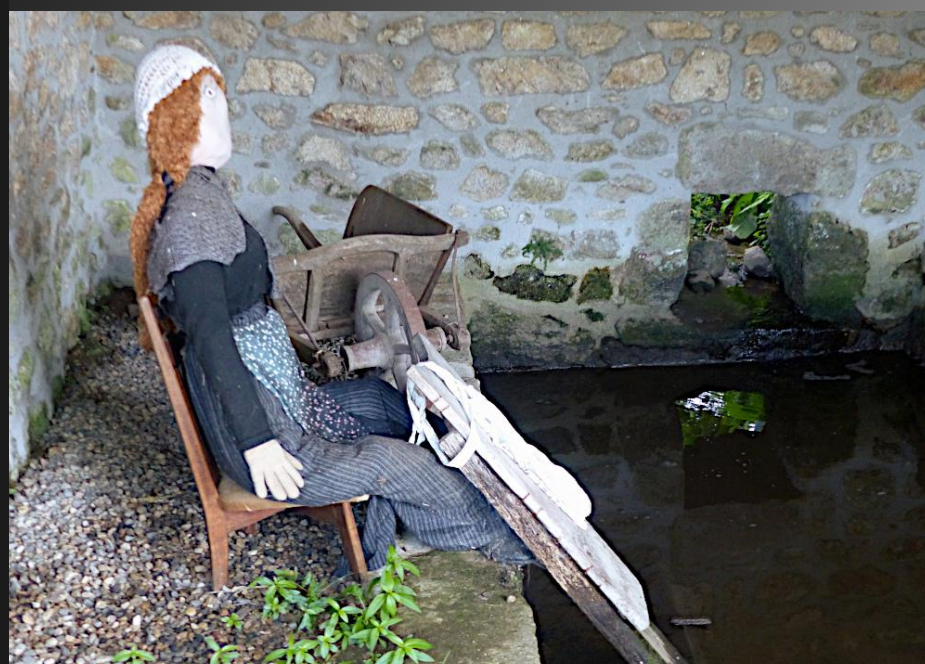
ST ROMAIN _ Le lavoir Valencheres. : des mannequins rappellent le dur labeur des lavandières du temps jadis.