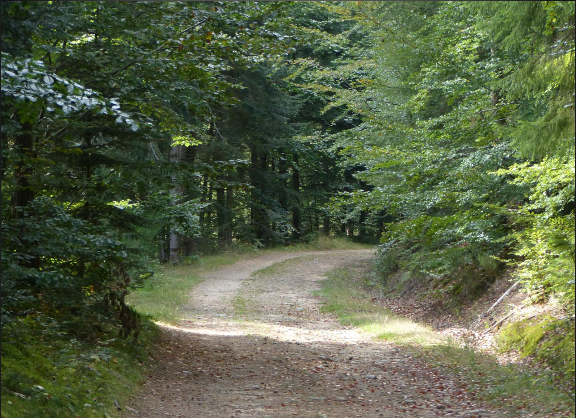
ST ROMAIN _ On ne sait jamais ce qu'on va découvrir au détour d'une chemin forestier...