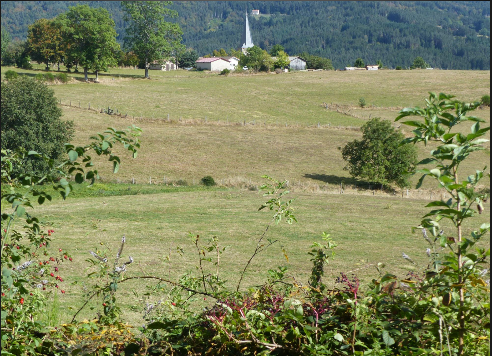
ST ROMAIN _ Scène apaisante tout le long du chemin de la forêt ...