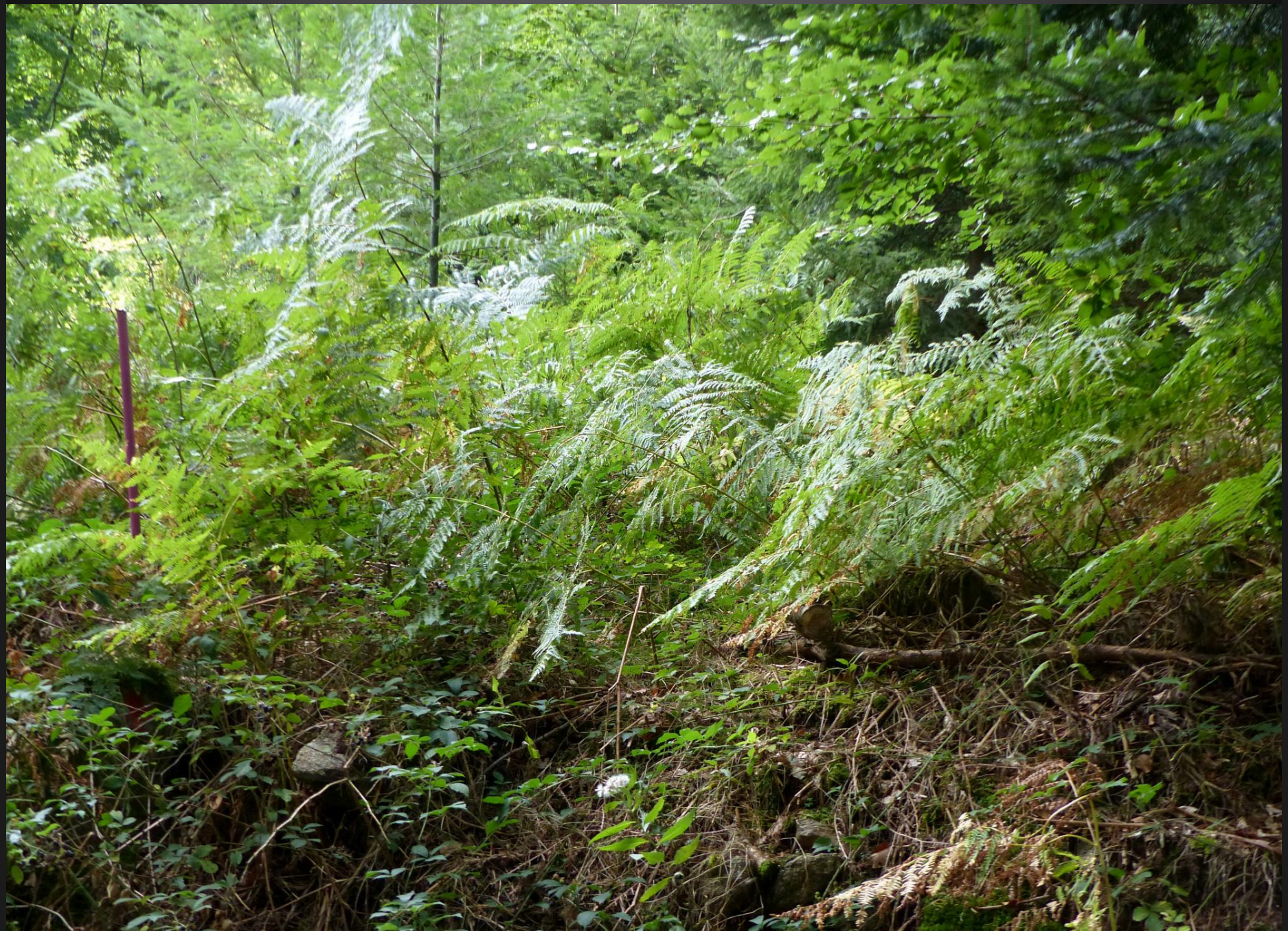
ST ROMAIN _ Les hautes fougères contribuent elles aussi à la sensation d'une fraîcheur bienfaisante.