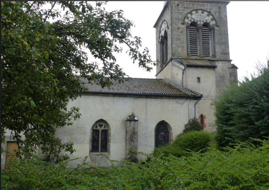
ST ROMAIN _ Pour le visiteur qui a un petit creux, il y a un restaurant accueillant, à côté de l'église, en face du Tilleul.