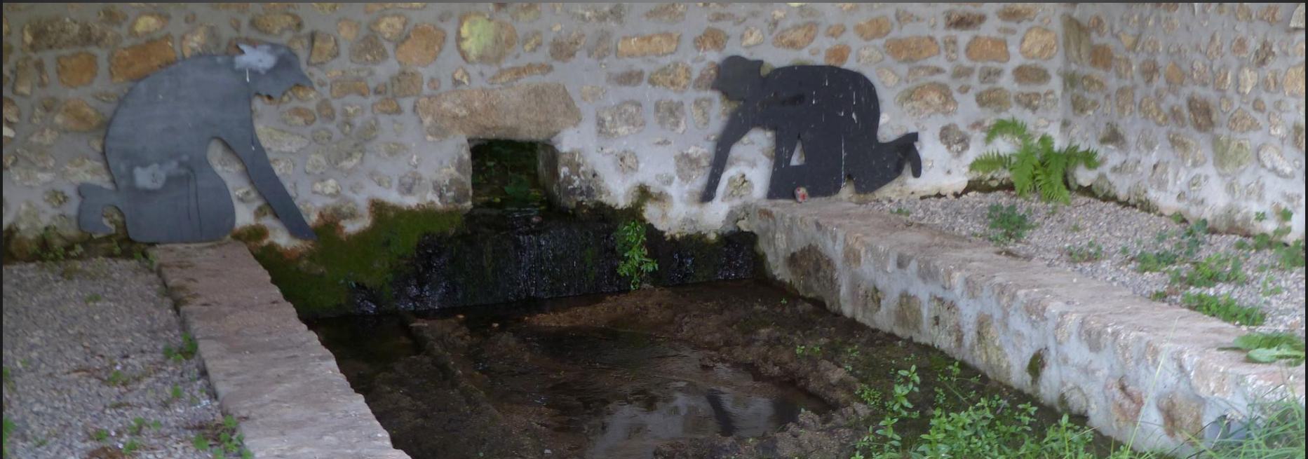
ST ROMAIN _ Le lavoir Les Côtes : ici ce sont des silhouettes qui sont penchées sur le bassin.