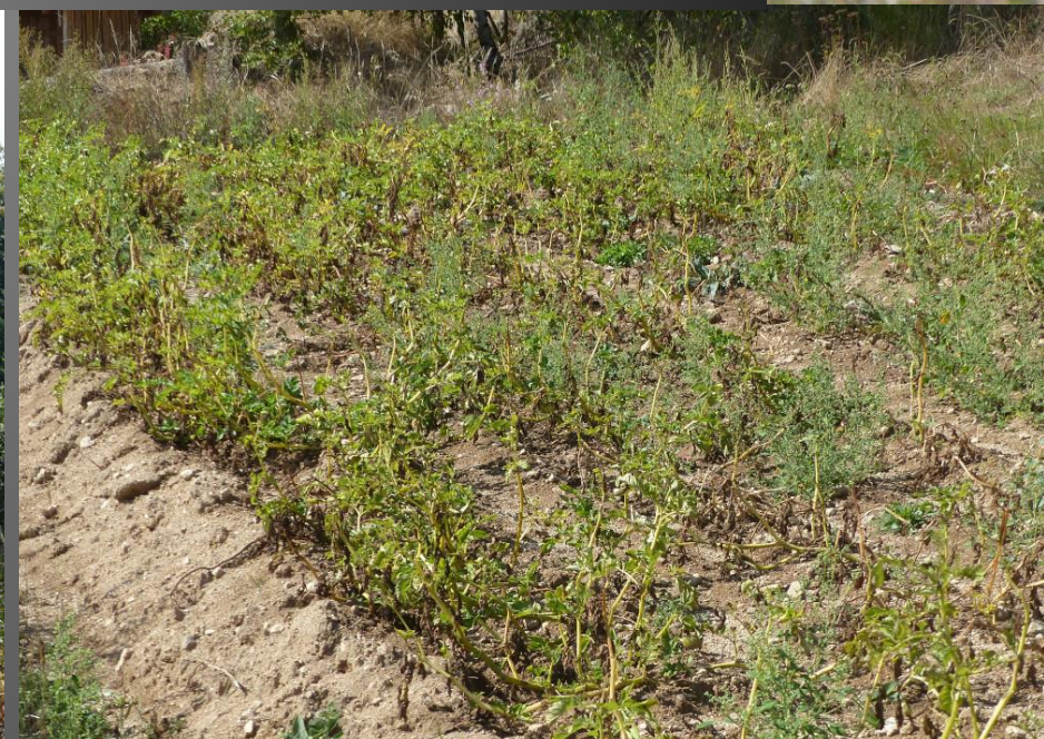
ST ROMAIN _ A la sortie du village sur la petite route en direction d'Ambert, le point de vue est saisissant, tout comme les plantations de pommes de terre (ci-dessus), lesquelles sont délicieuses.