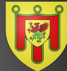
Blason du Puy-de-Dôme « D'or au gonfanon de gueules frangé de sinople, chargé en abîme d'un écusson d'or au griffon coupé de gueules et de sinople. »