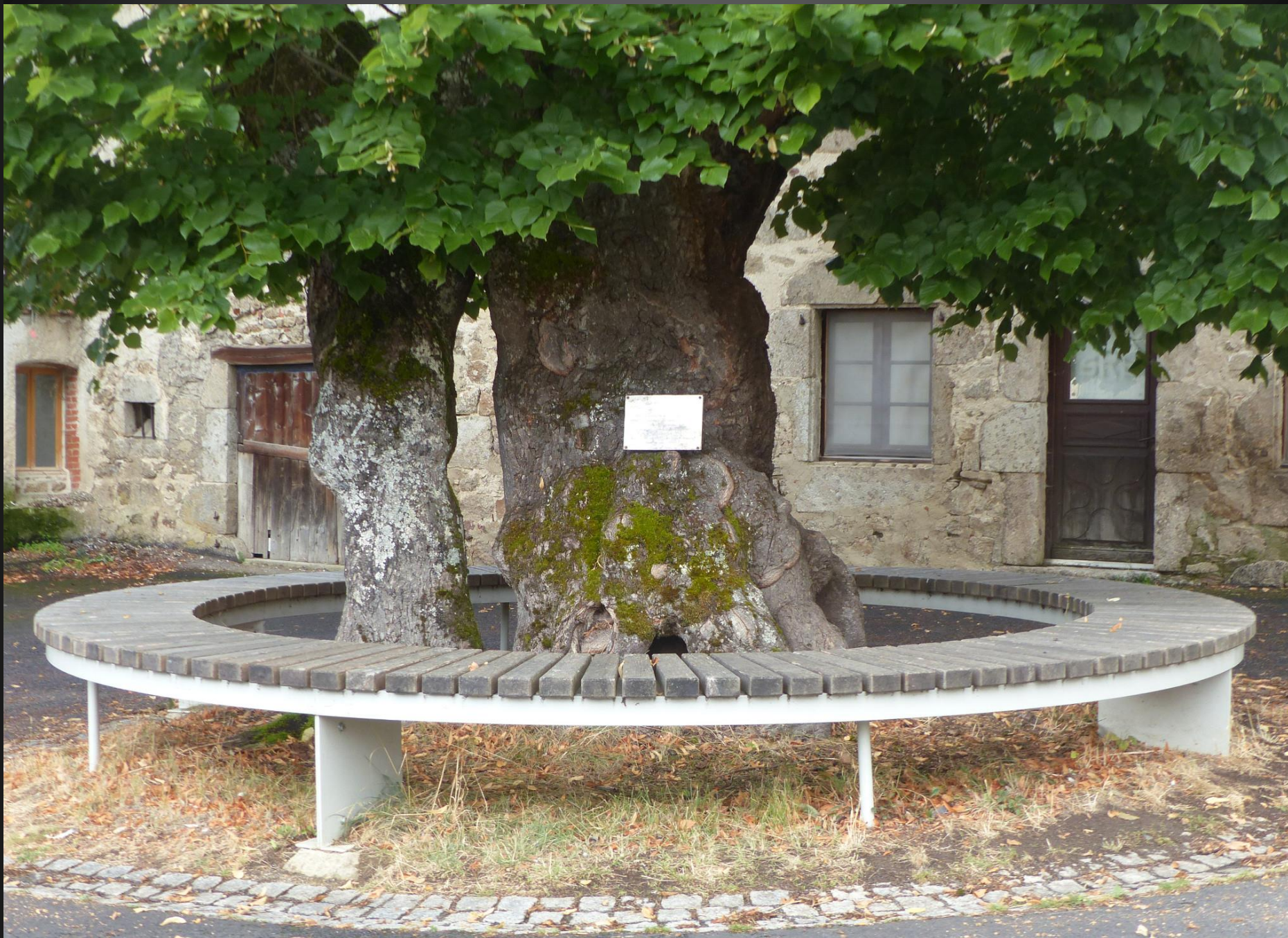
ST ROMAIN _ Ce vénérable tilleul est une curiosité du village, qui permet également de se reposer sous son ombrage.