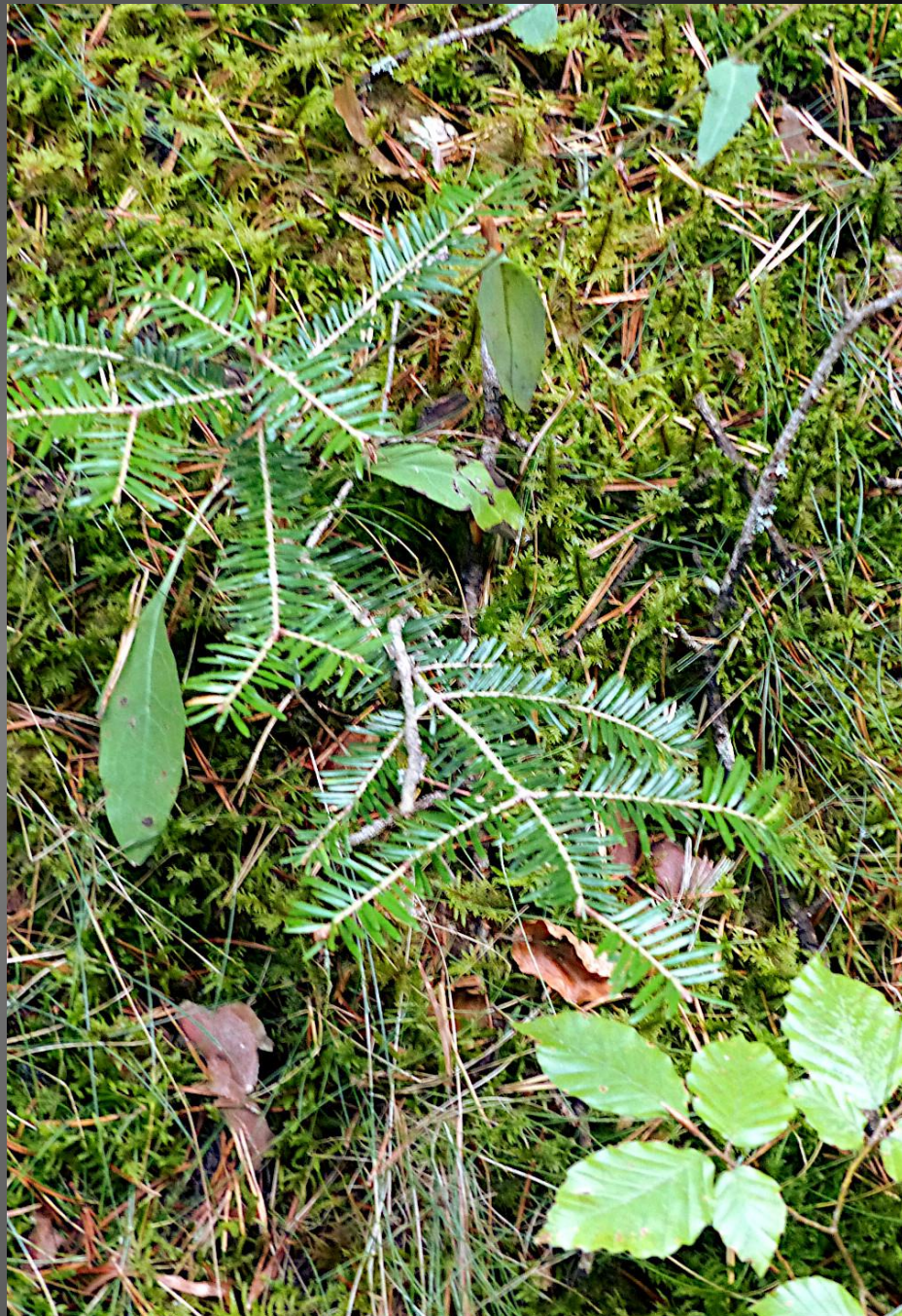
ST ROMAIN _ Laissezée par les fortes pluies de la veille, c'est une belle flaqué d'eau où se mirent feuillages et nuages, pendant que petit sapin s'élançe patiemment vers le ciel.