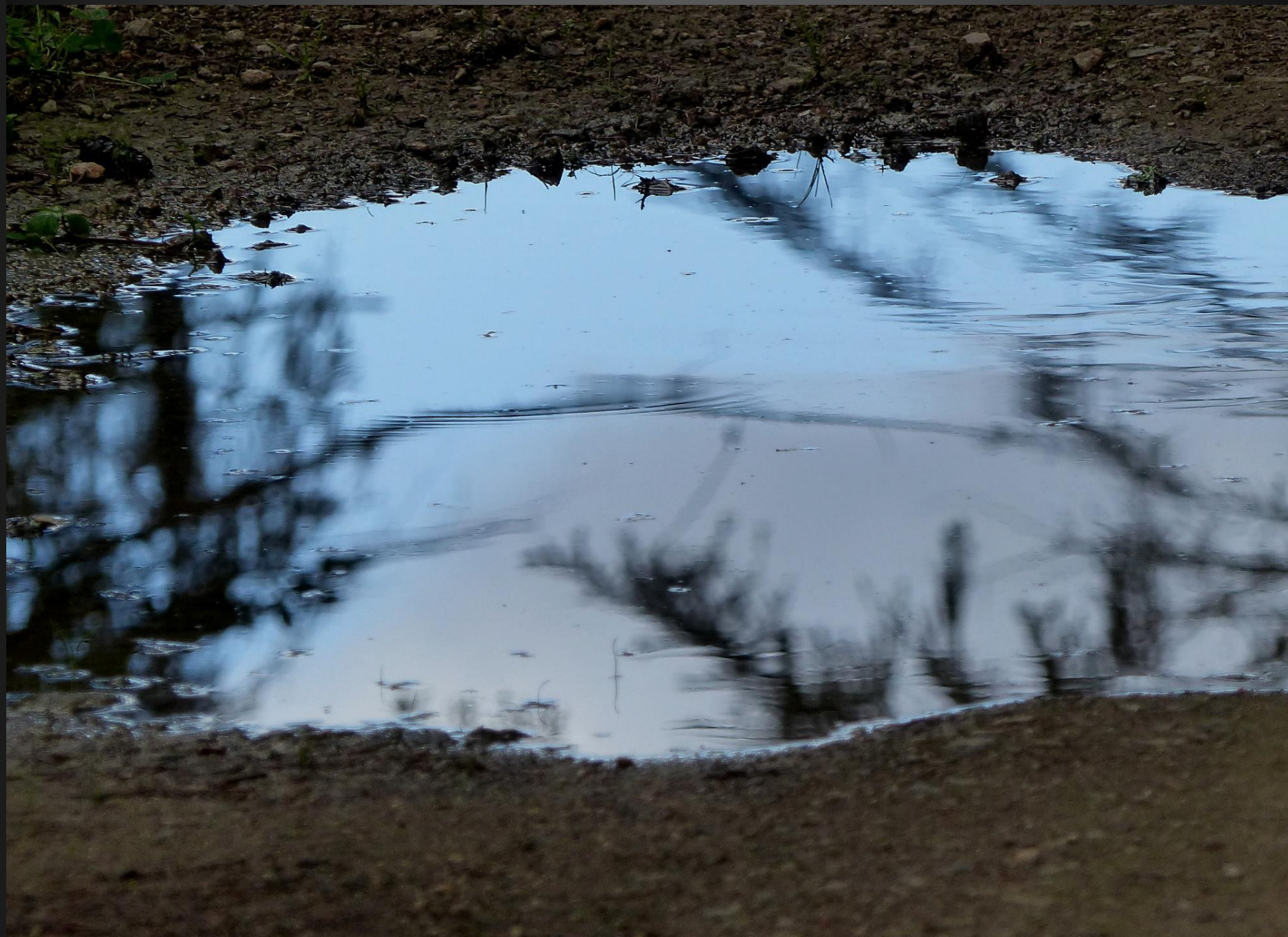
ST ROMAIN _ Reflets du ciel dans la même flaue d'eau, au retour.