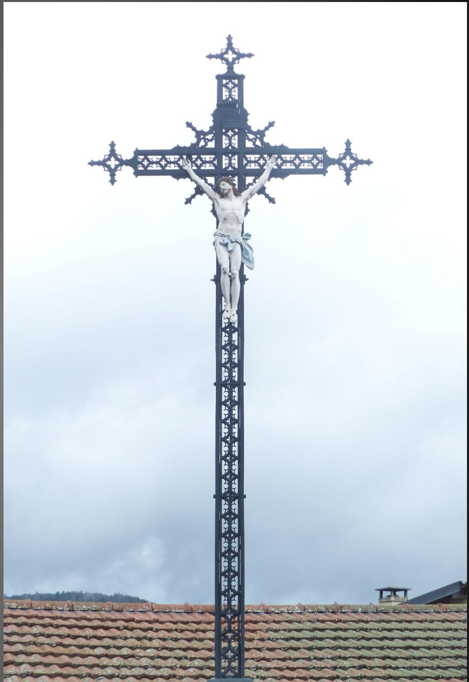
ST ROMAIN _ La grande Croix de Mission 1957 se détache dans le ciel gris au-dessus de la chapelle de St Joseph-des-Montagnes.