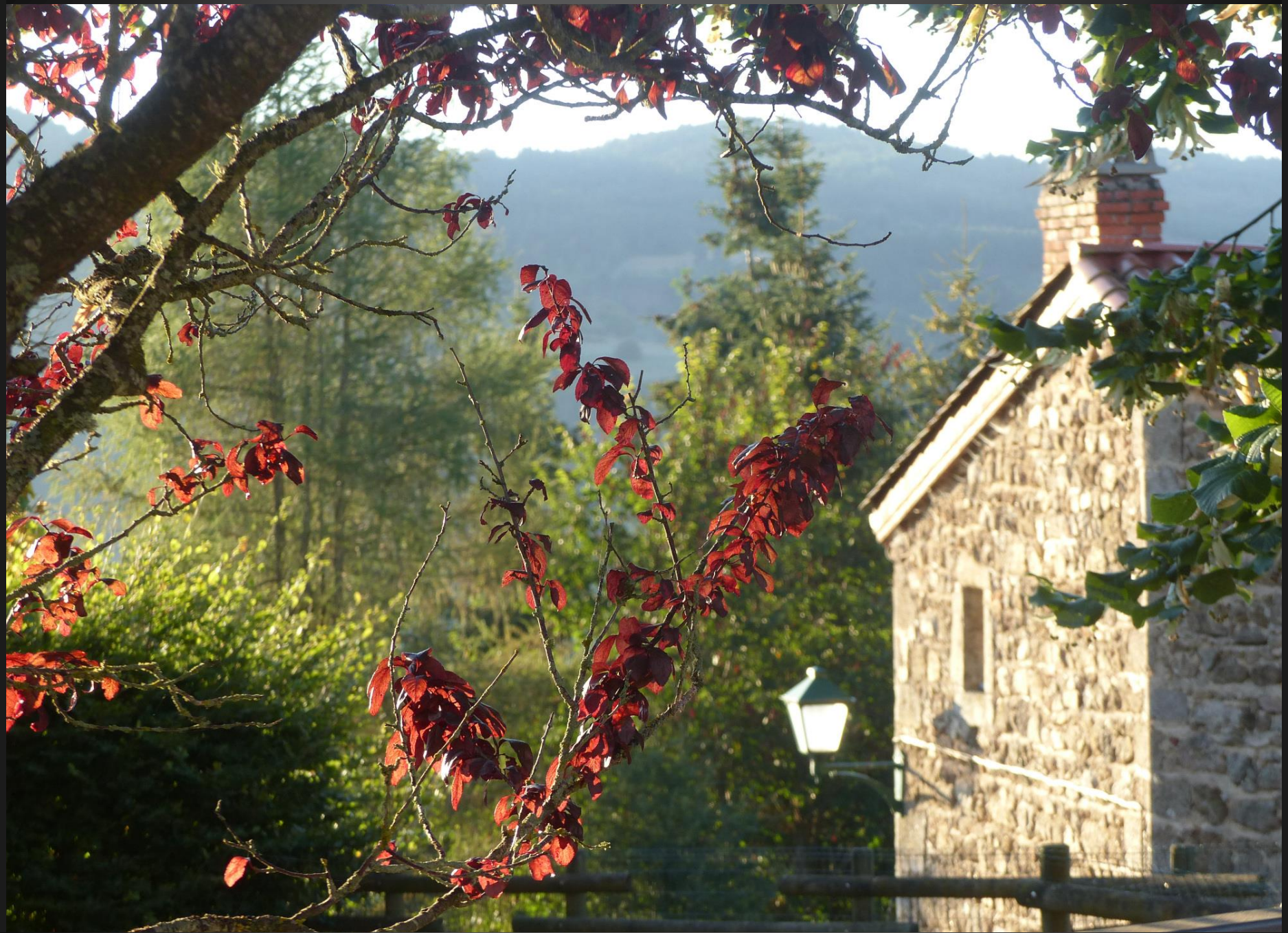
ST ROMAIN _ Jeux de lumières sur feuillages et mur de pierre.