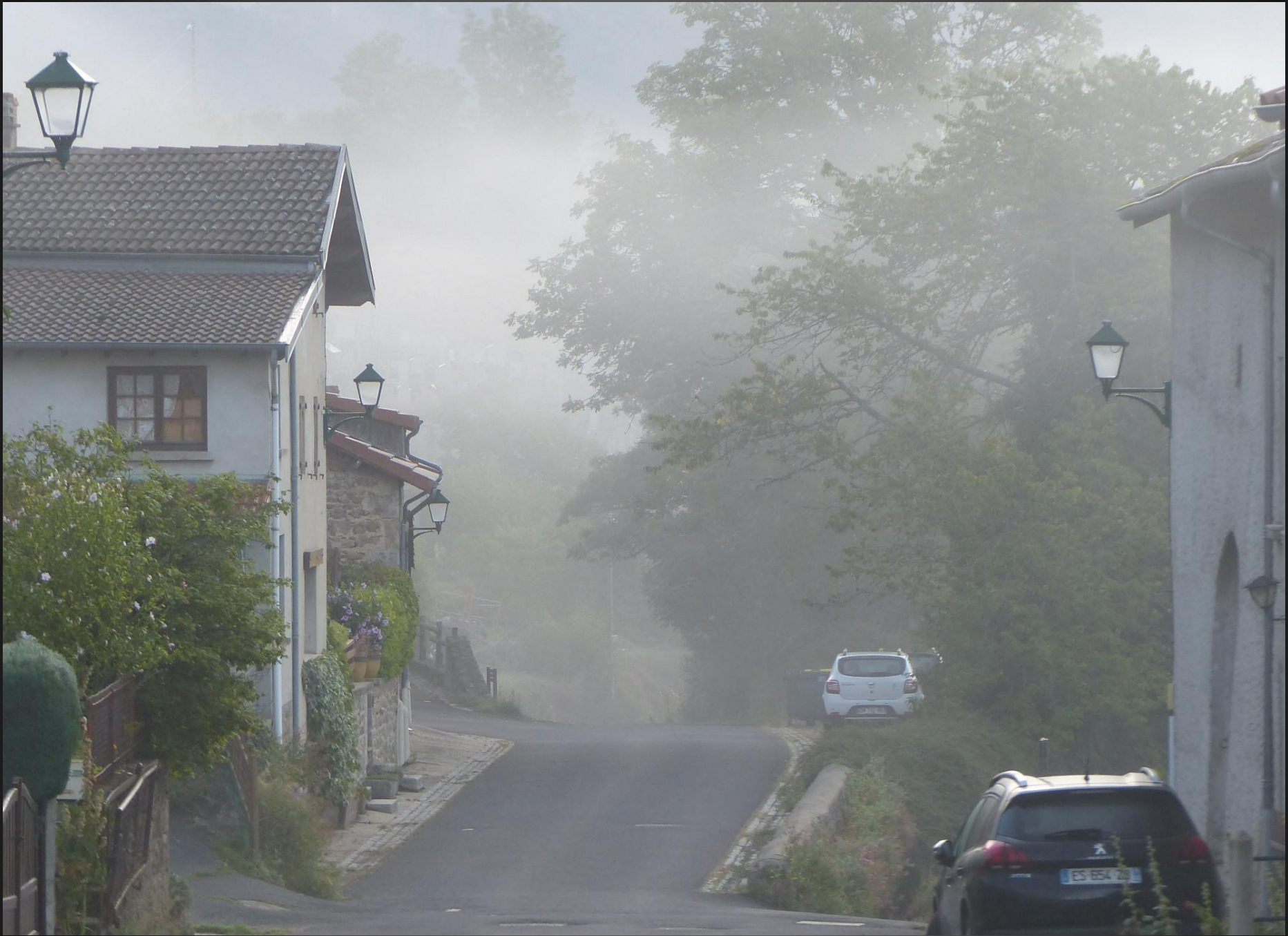
ST ROMAIN _ Brouillard matinal.