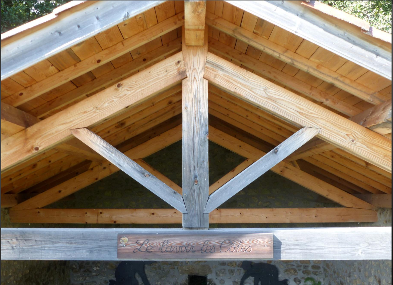
ST ROMAIN _ Le lavoir Les Côtes.