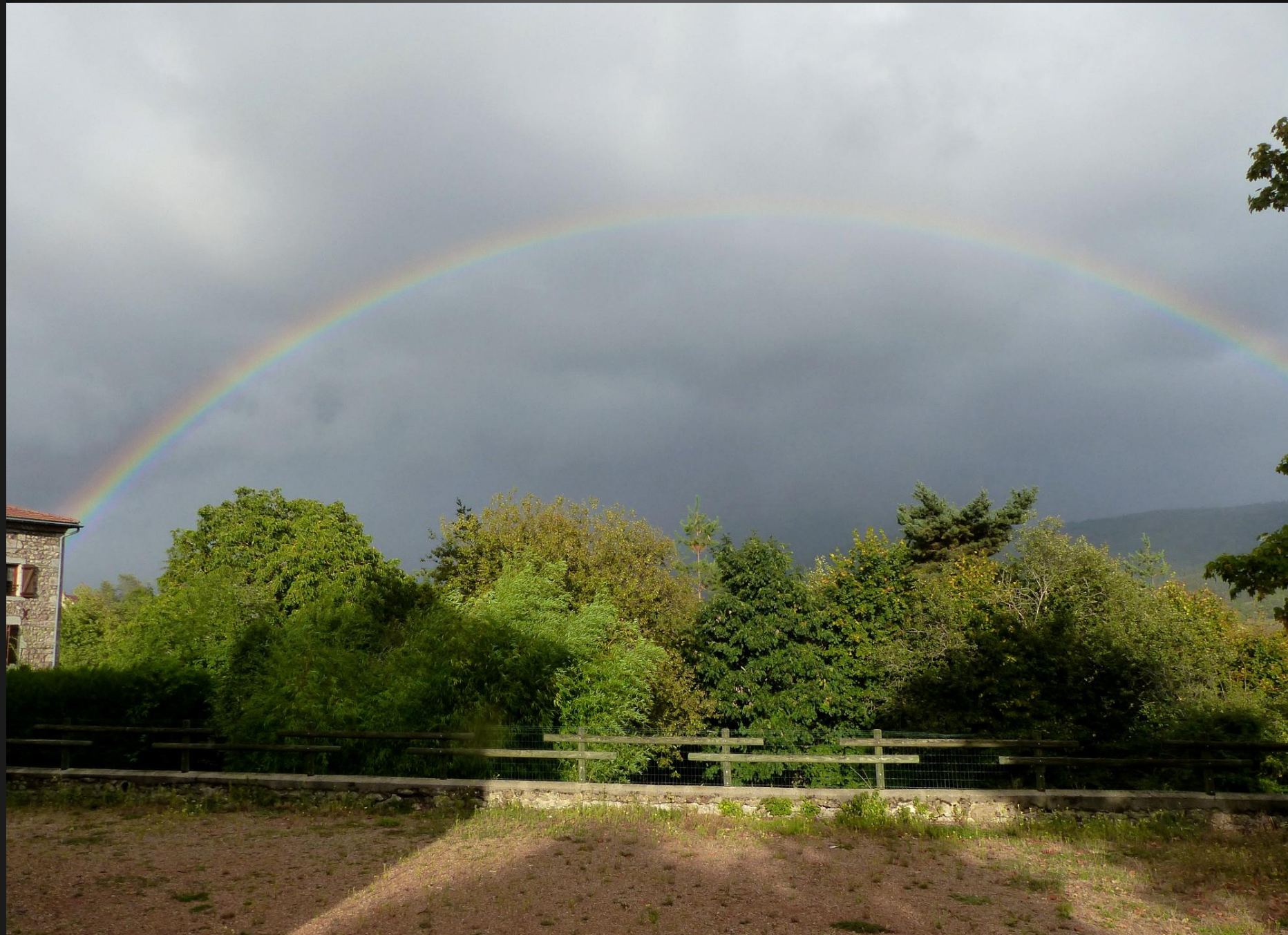
ST ROMAIN _ Après la pluie se dévoile sur la contrée un arc-en-ciel complet.