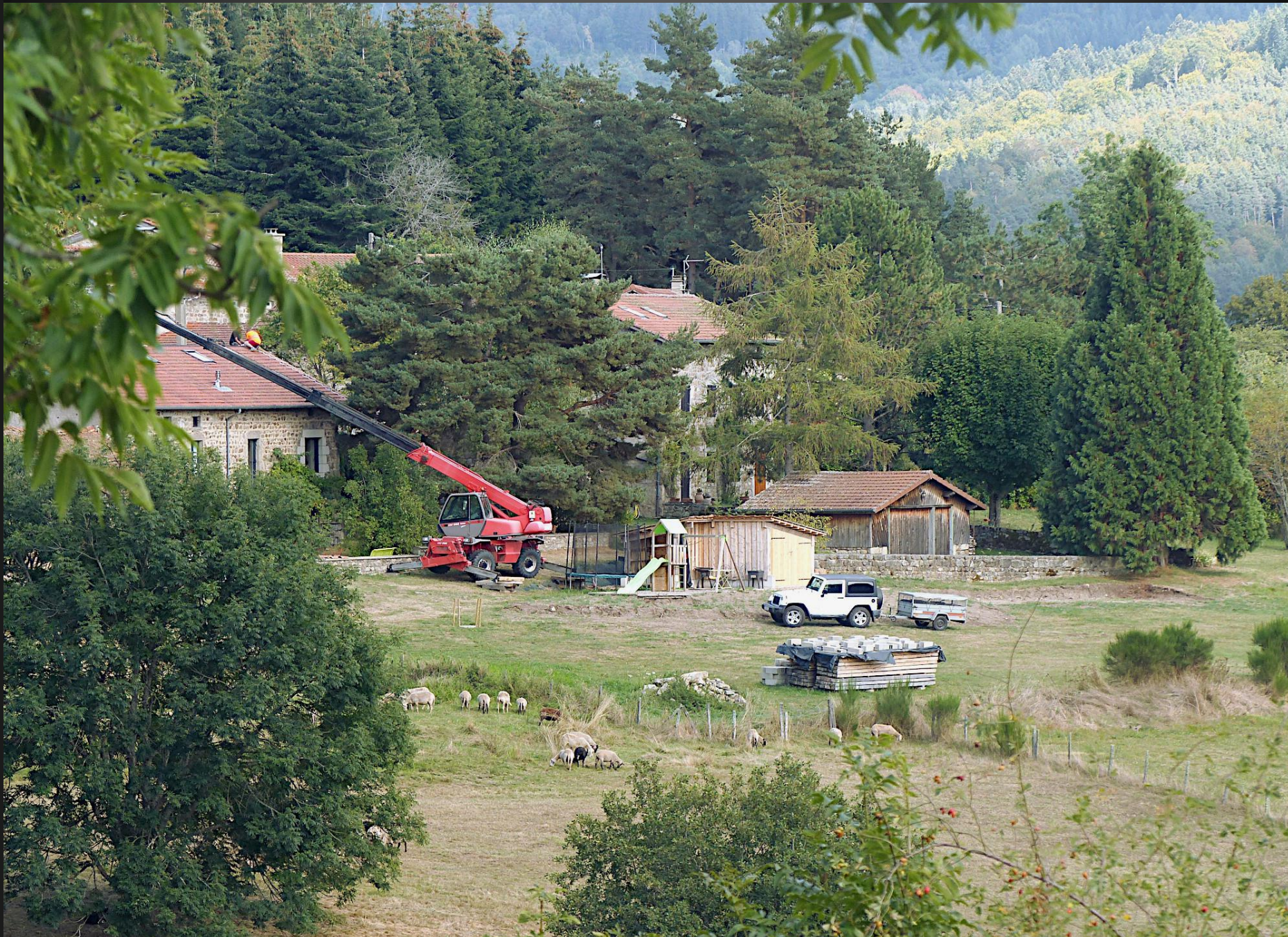
ST ROMAIN _ Toiture en cours de rénovation : à 950m d'altitude, la neige tombe dru en hiver et le chasse-neige a bien du travail.