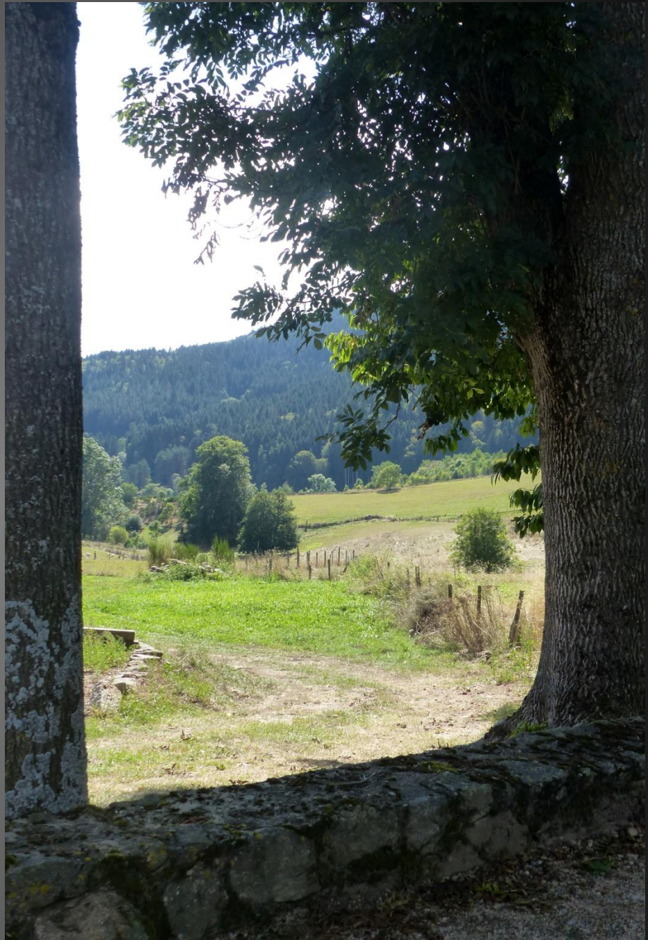
ST ROMAIN _ Un peu plus loin, des moutons broutent placidement, le silence est absolu, sauf peut-être pour un aboiement de chien ou le chant d'un coq qui aurait mélangé les heures.