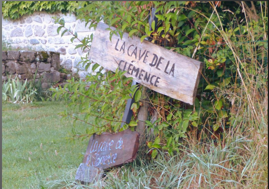
ST ROMAIN _ Ces corps de ferme rénovés, aux épais murs de granit, sont construits pour durer. Le chasseur qui furette au petit matin n'a aucune clémence pour les mulots, nonobstant la cave du même nom.