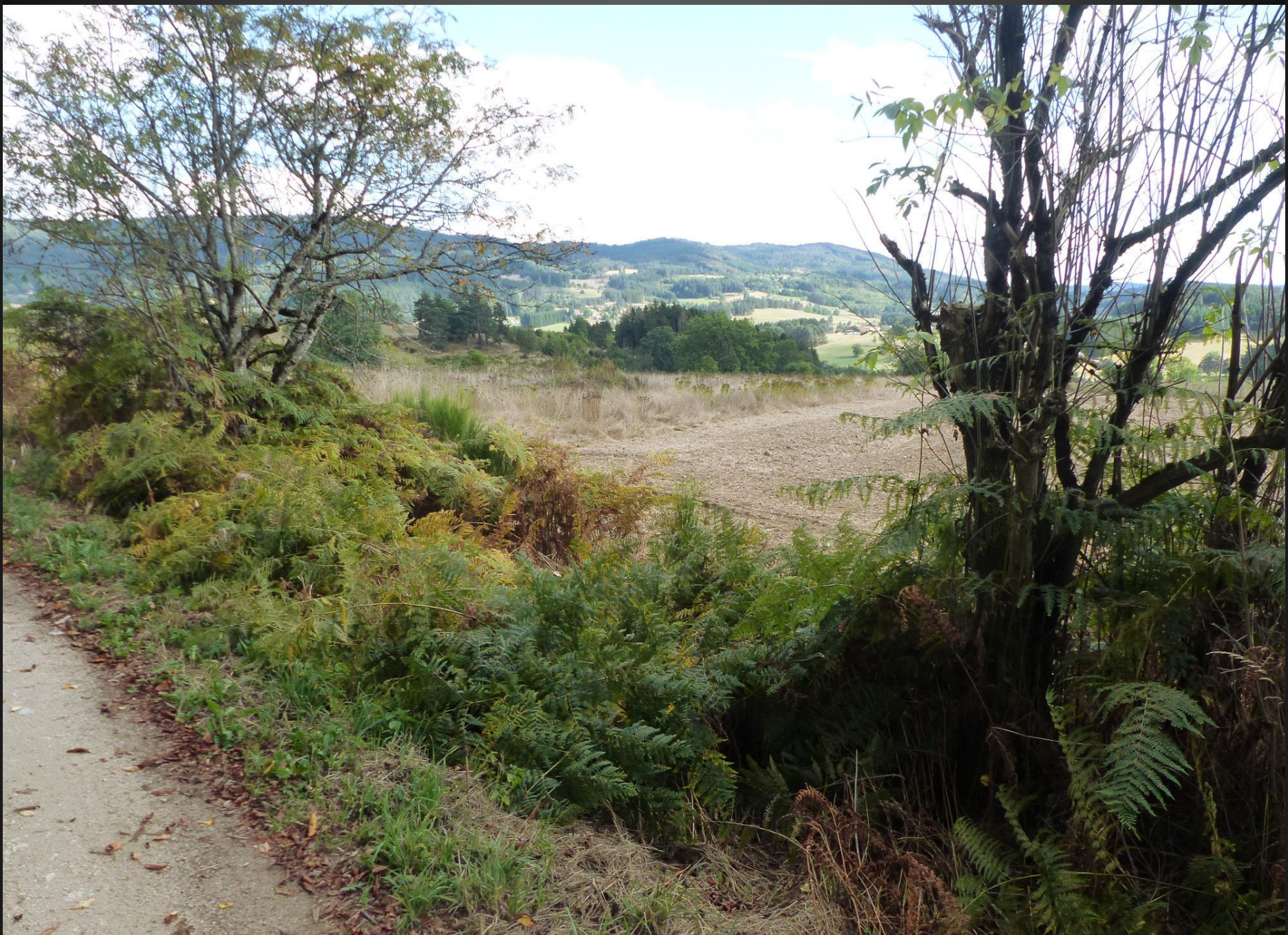
ST ROMAIN _ Sortie de la forêt, décidément cette contrée verdoie intensément.