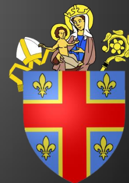
Blason des Evêques de Clermont