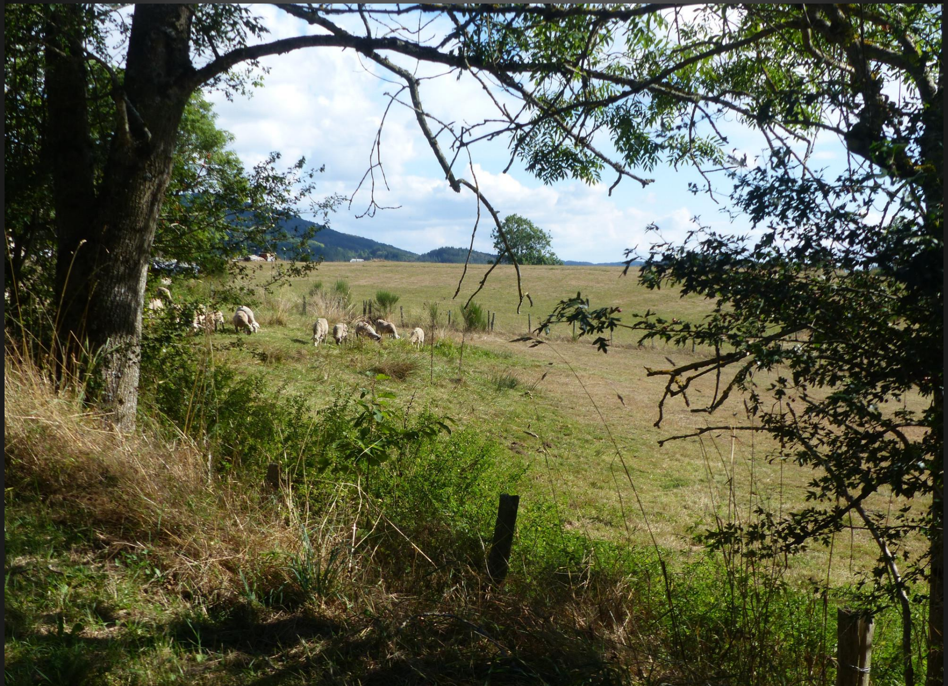
ST ROMAIN _ Sur ce tableau pastoral et bucolique à souhait, on entendrait une mouche voler...