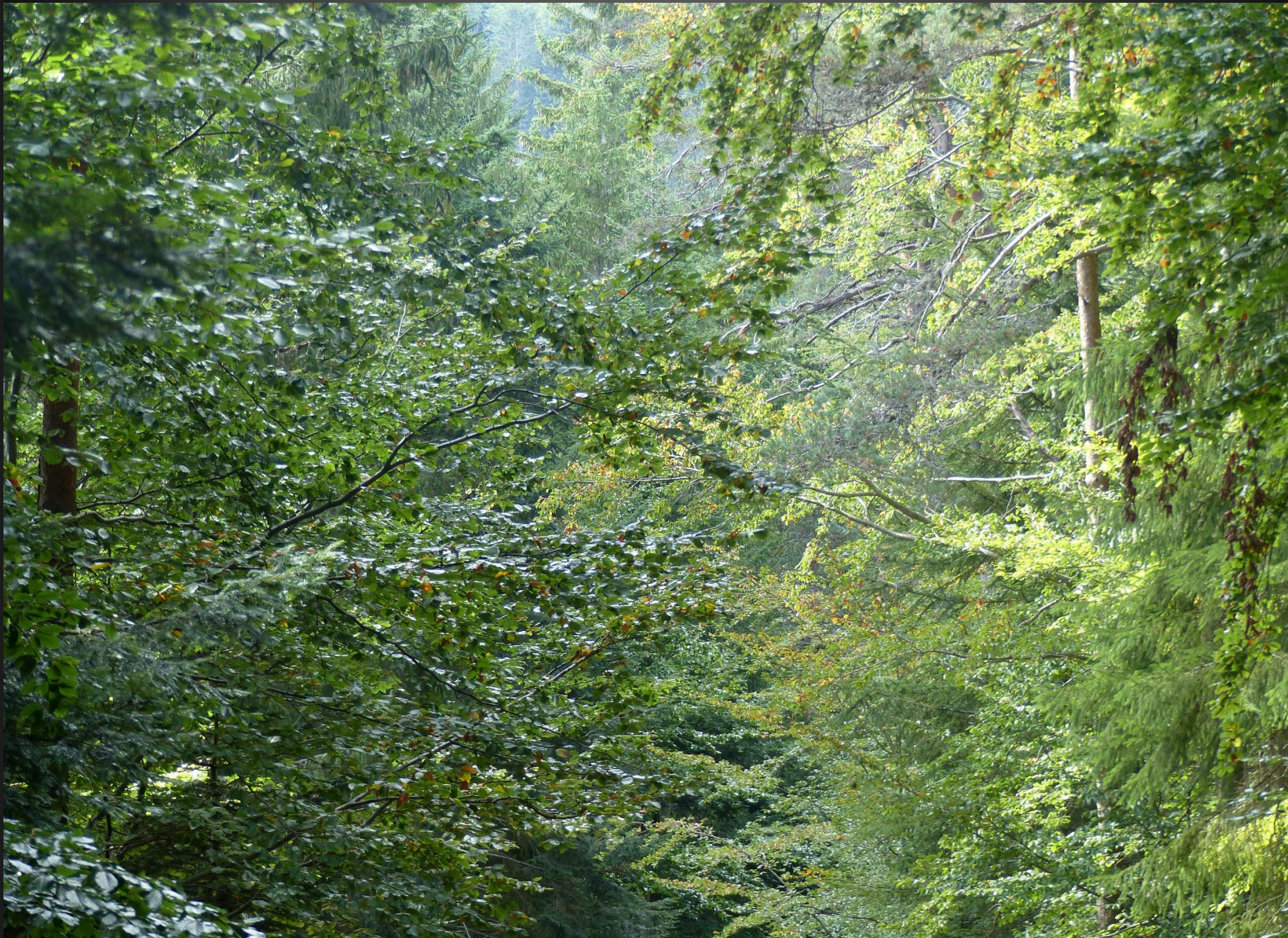
ST ROMAIN _ Les frondaisons sont d'une variété de verts qui subjugue le marcheur et lui commande de s'arrêter, et de méditer sur la Création.