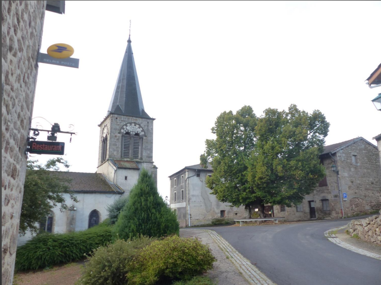
ST ROMAIN L'église (XII-XIIIe s.) et le tilleul de Sully.