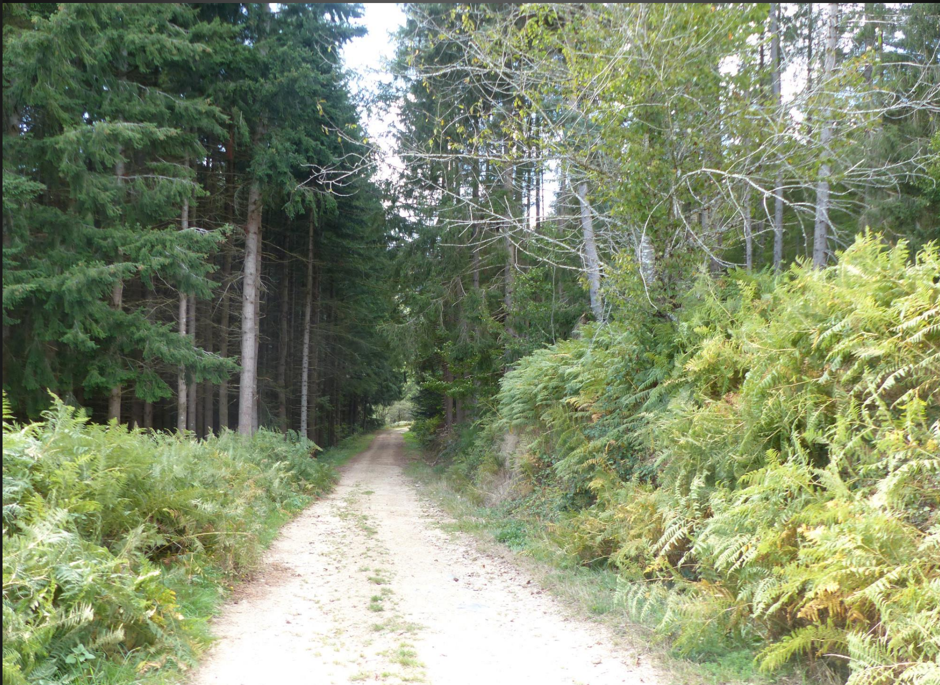
ST ROMAIN _ Le sentier entre dans la forêt, beaucoup de conifères, mais pas seulement.