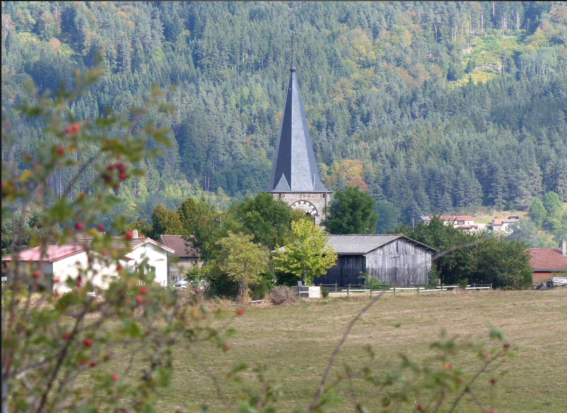
ST ROMAIN _ Le haut clocher de l'église marque le centre du village, pour le marcheur égaré.