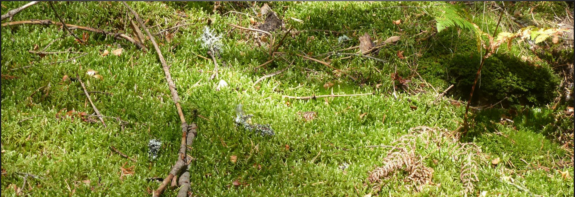
ST ROMAIN _ Il n' a pas que la fougère, ce tapis de mousse est une invitation à faire une pause et s'y étendre pour une petite sieste revigorante.