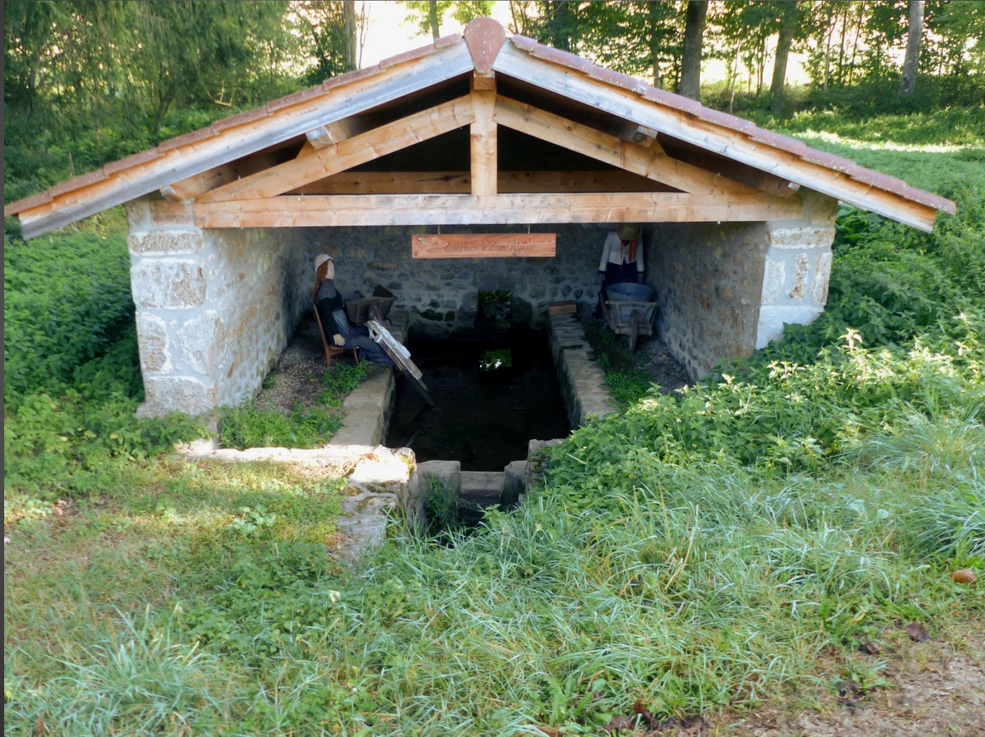
ST ROMAIN _ Le lavoir Valenchères.