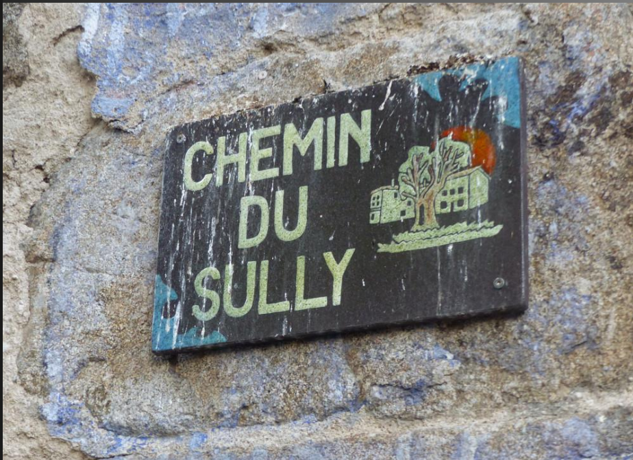
ST ROMAIN _ Rues du village tôt le matin, et une étrange plaque...