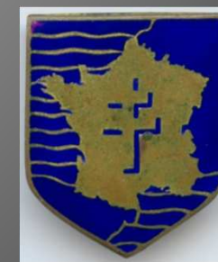
Insigne de la 2 e DB