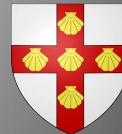
Blason des comtes de Hauteclouque