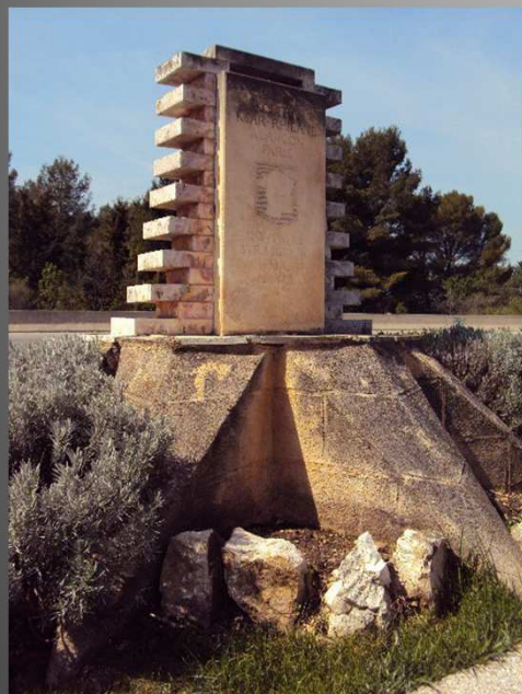
Une stèle solitaire sur l'avenue qui porte son nom, près du Moulin du Pont, en mémoire du Maréchal Leclerc...