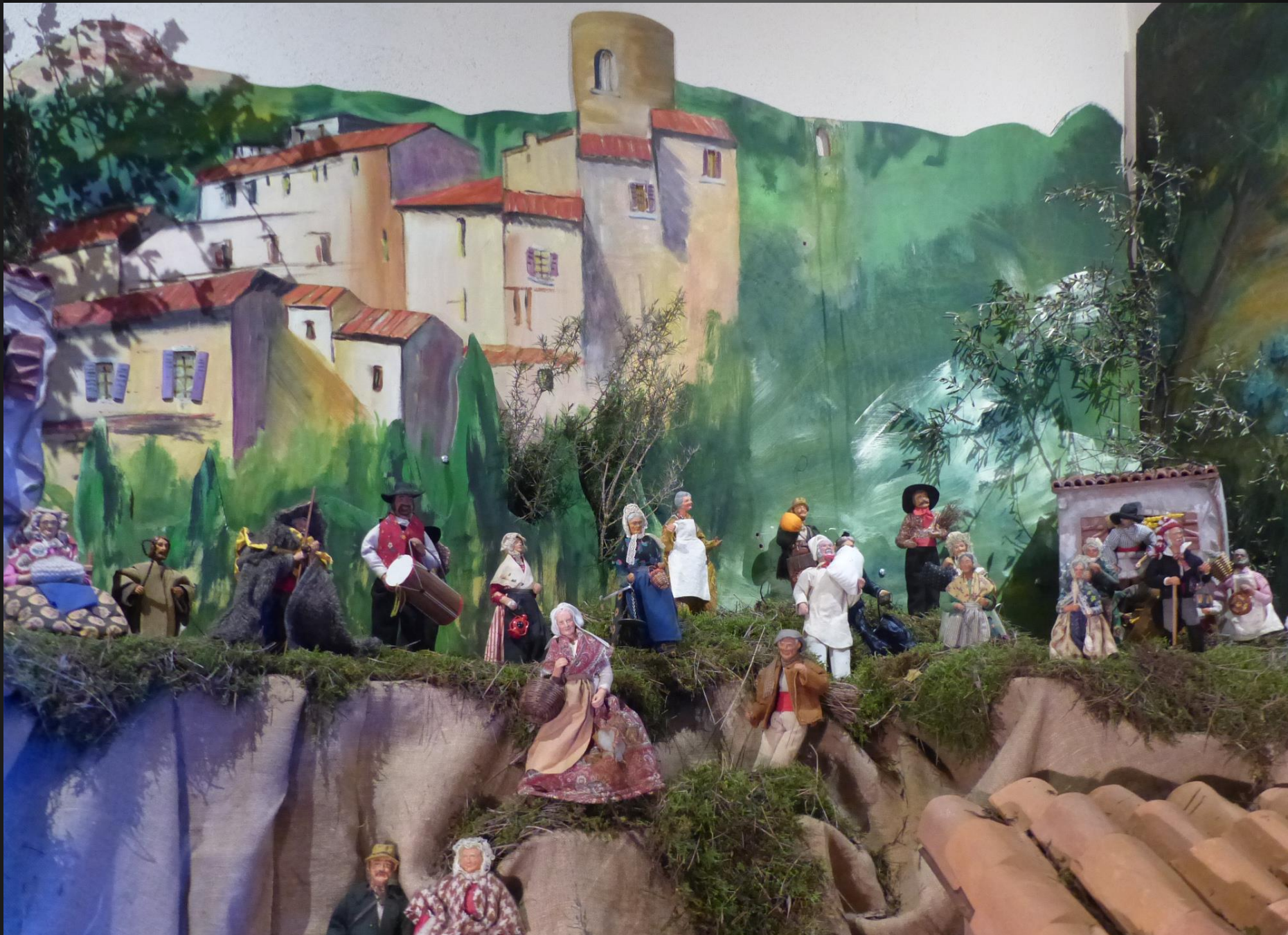
Eglise Saint-Trophime _ Les santons de la crèche évoluent dans une reproduction du centre ancien de Velaux, dominé par la tour du château seigneurial.