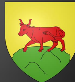
Blason de Velaux

D'or au gousset renversé d'azur chargé en cœur d'une fleur de lys du champ surmontée d'un lambel de gueules brochant sur le tout.