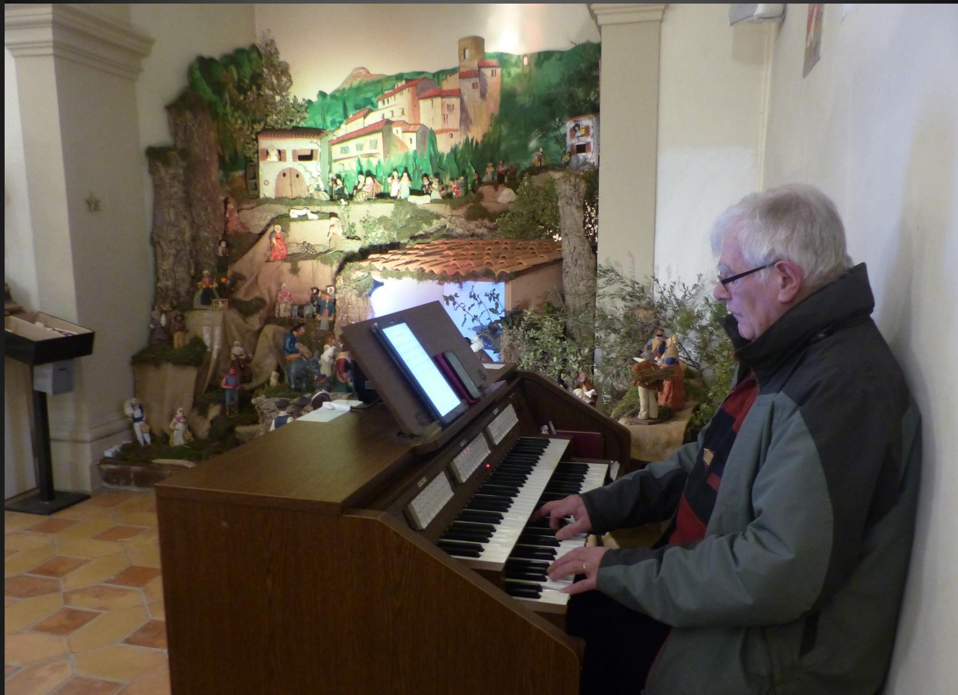
Eglise Saint-Trophime _ Près de la crèche, l'organiste se prépare pour la messe dominicale.