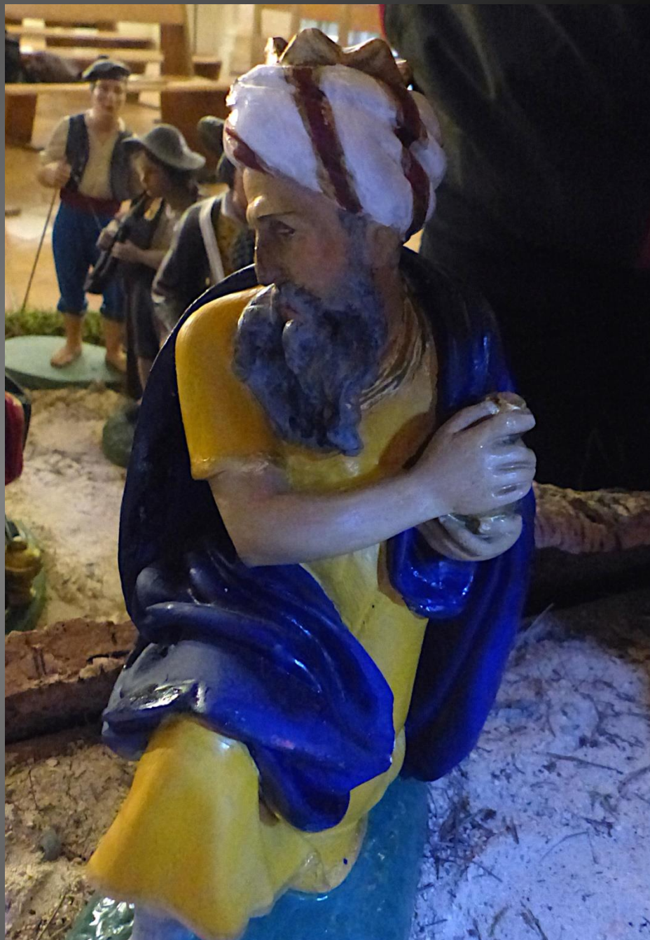
Les Rois Mages, Melchior, Gaspard et Balthazar ont suivi l'Etoile jusqu'à l'étable de Nazareth où ils ont offert respectivement à l'Enfant Roi l'or, l'encens et la myrrhe.