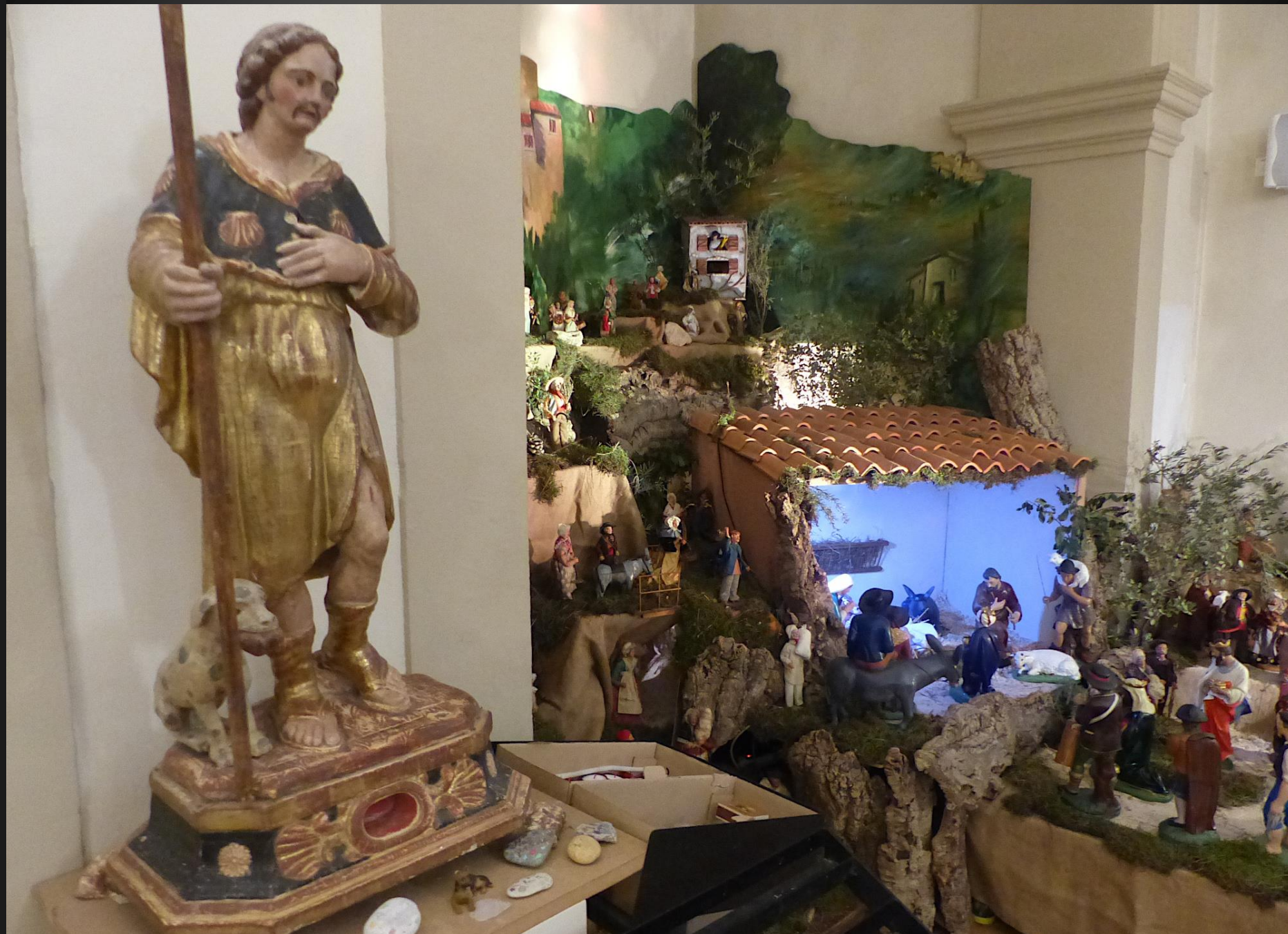
Eglise Saint-Trophime _ La statue de saint Roch rappelle aux paroissiens que la Saint de Montpellier a protégé le village de la Grande Peste de 1720 qui ravageait la Provence...