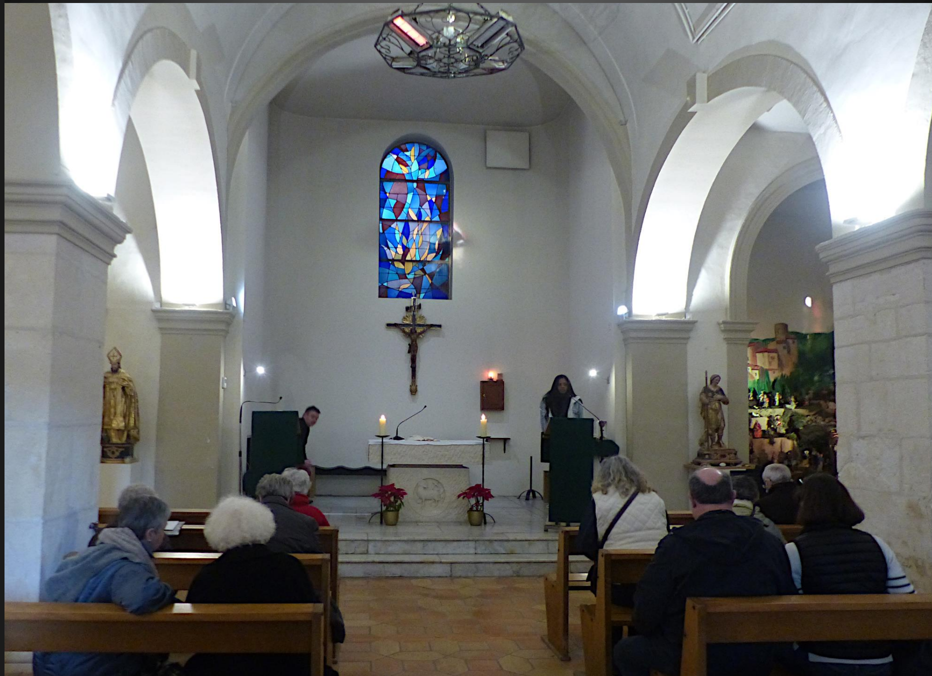
Eglise Saint-Trophime _ La crèche est située dans la chapelle à droite du chœur.