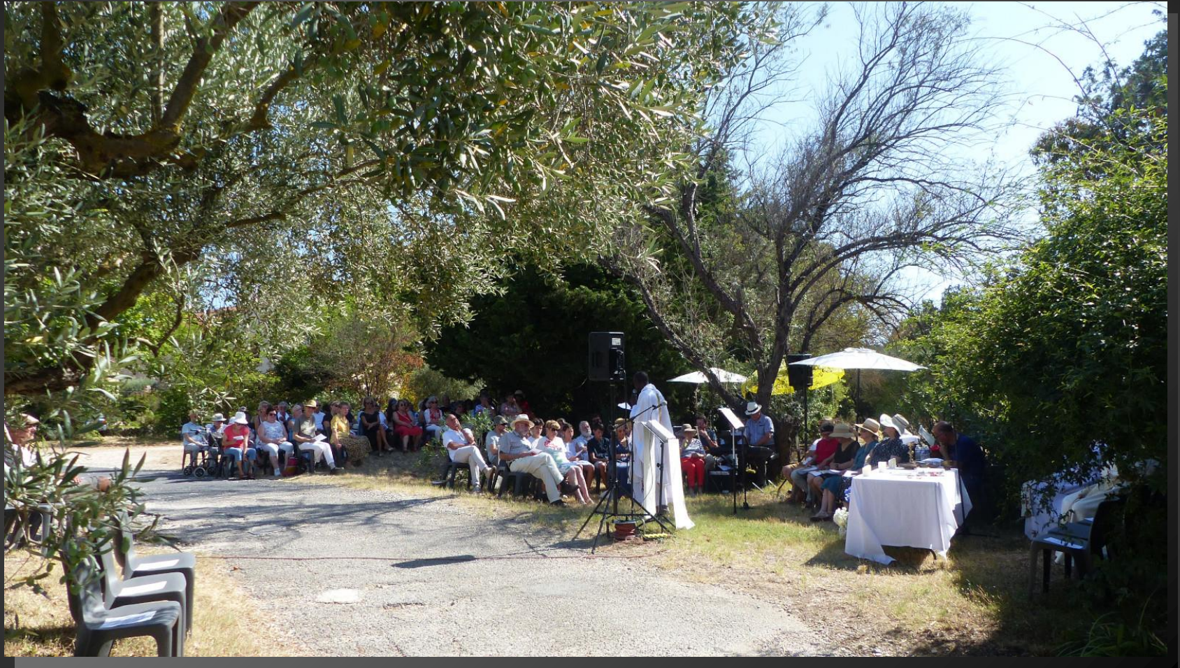
VENTABREN _ Fin de la Liturgie de la Parole...