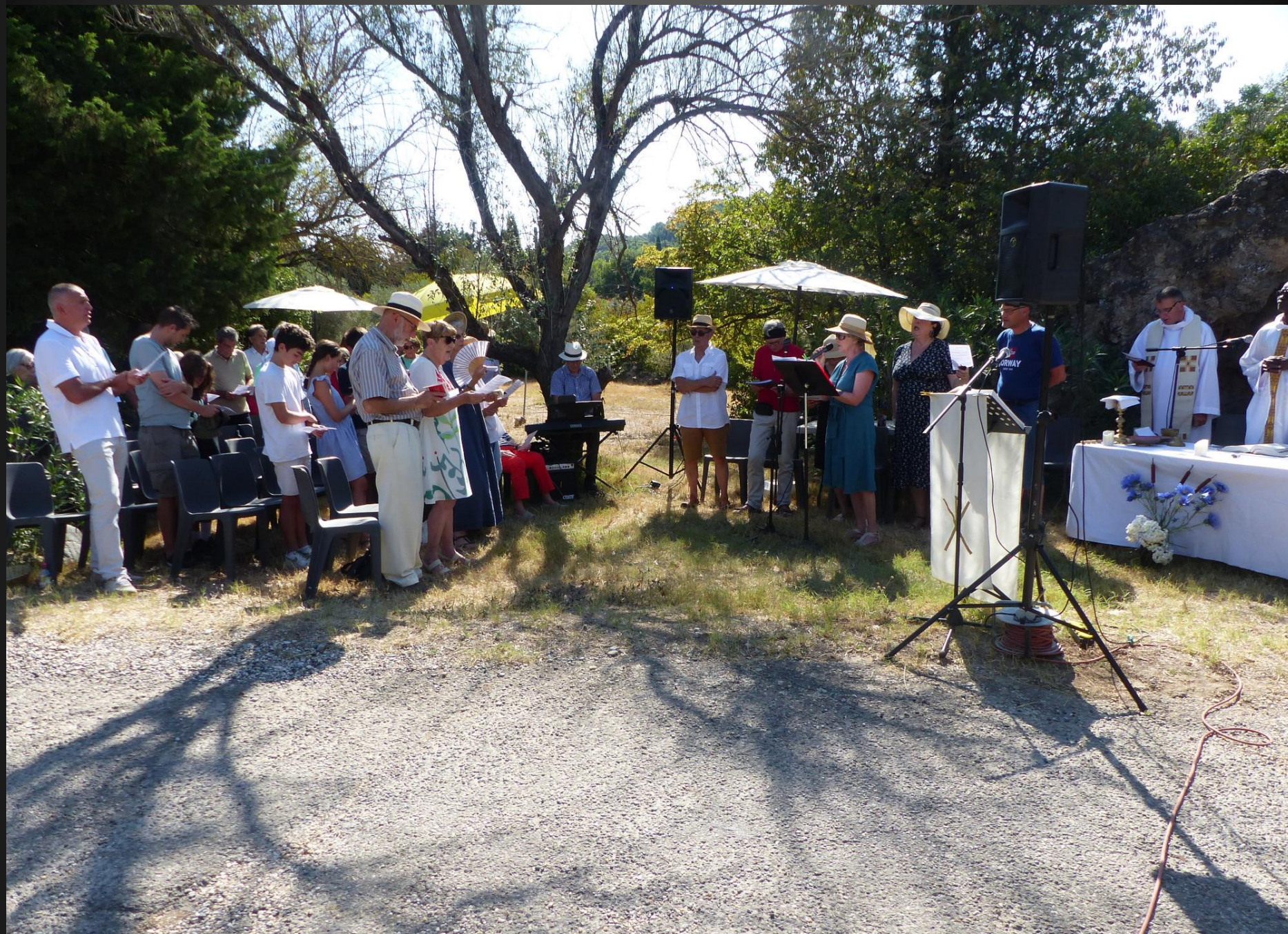
VENTABREN _ Kyrie, JESUS BERBER DE TOUTE L'HUMANITE