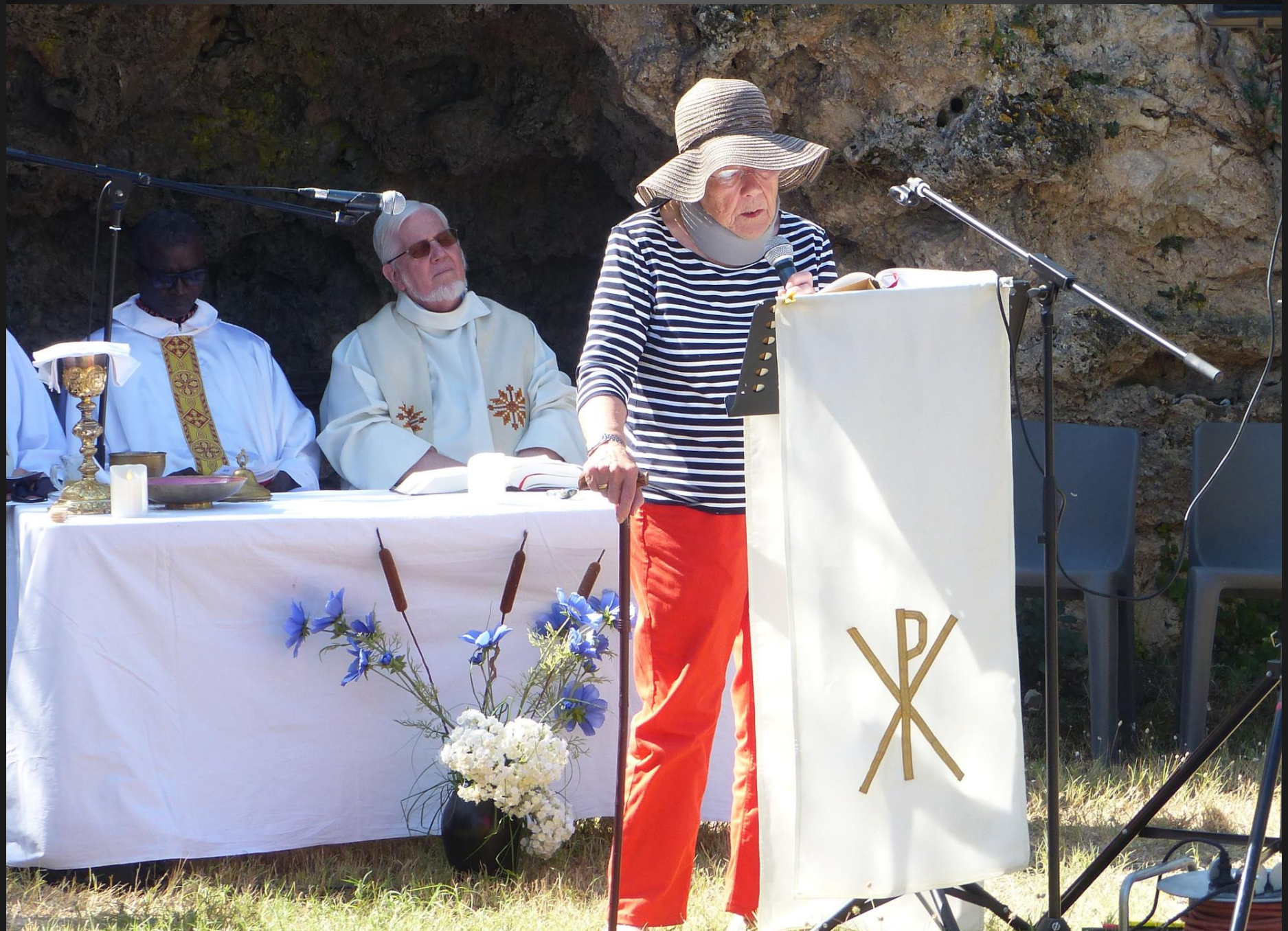
VENTABREN _ Deuxième lecture.