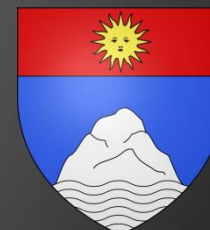
Blason de Ventabren « D'azur à la montagne d'argent posée sur des ondes du même mouvant de la pointe, au chef cousu de gueules chargé d'un soleil d'or. »

« D'or au gousset renversé d'azur chargé en cœur d'une fleur de lys du champ surmontée d'un lambel de gueules brochant sur le tout. »