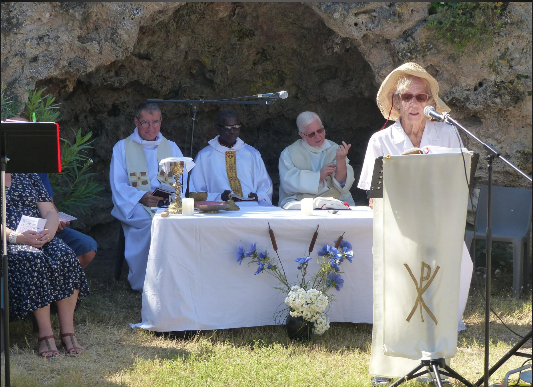
VENTABREN _ Lecture de la Première lettre de saint Paul Apôtre aux Corinthiens.