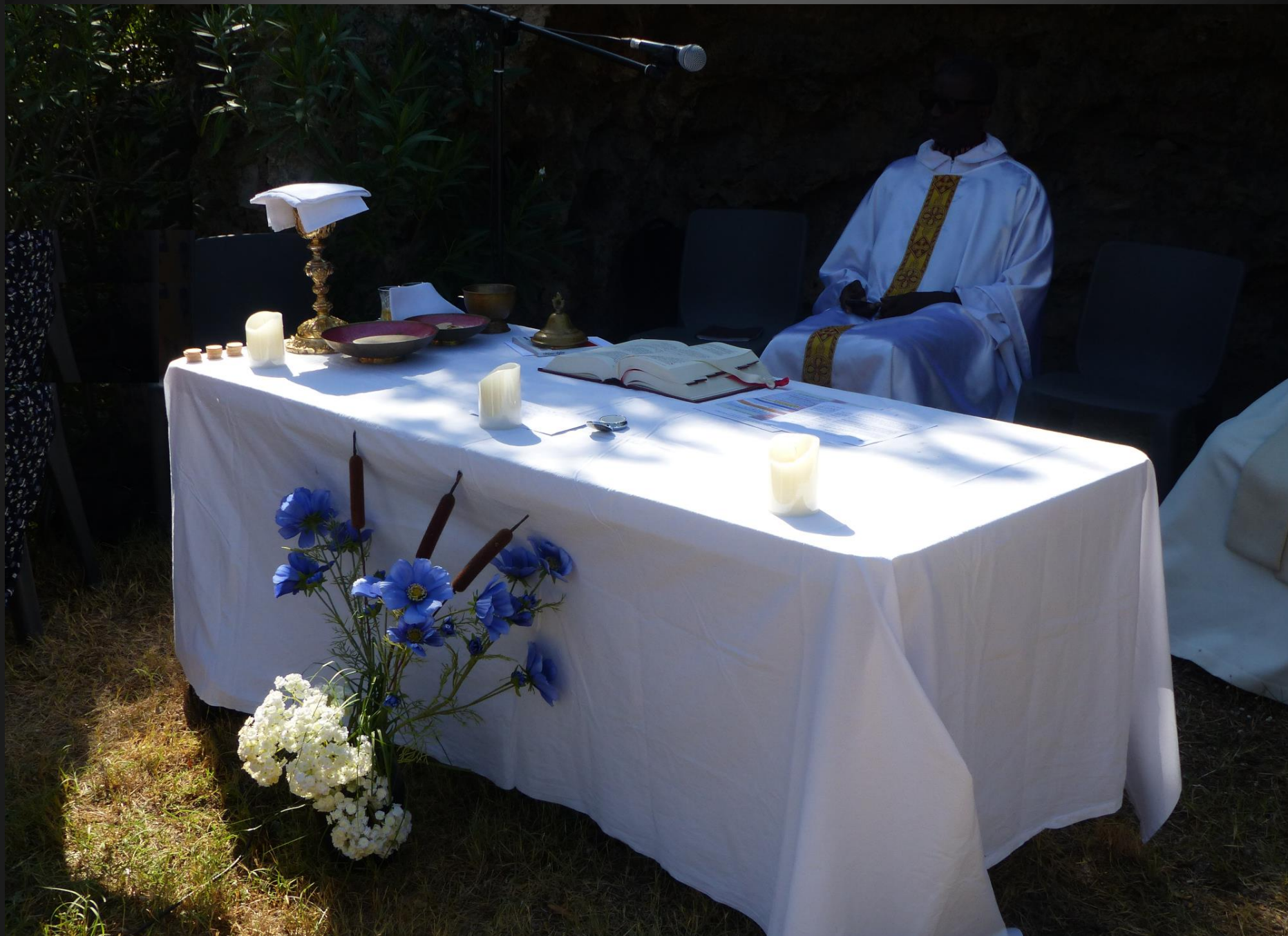
VENTABREN _ L'autel est prêt pour la célébration eucharistique.