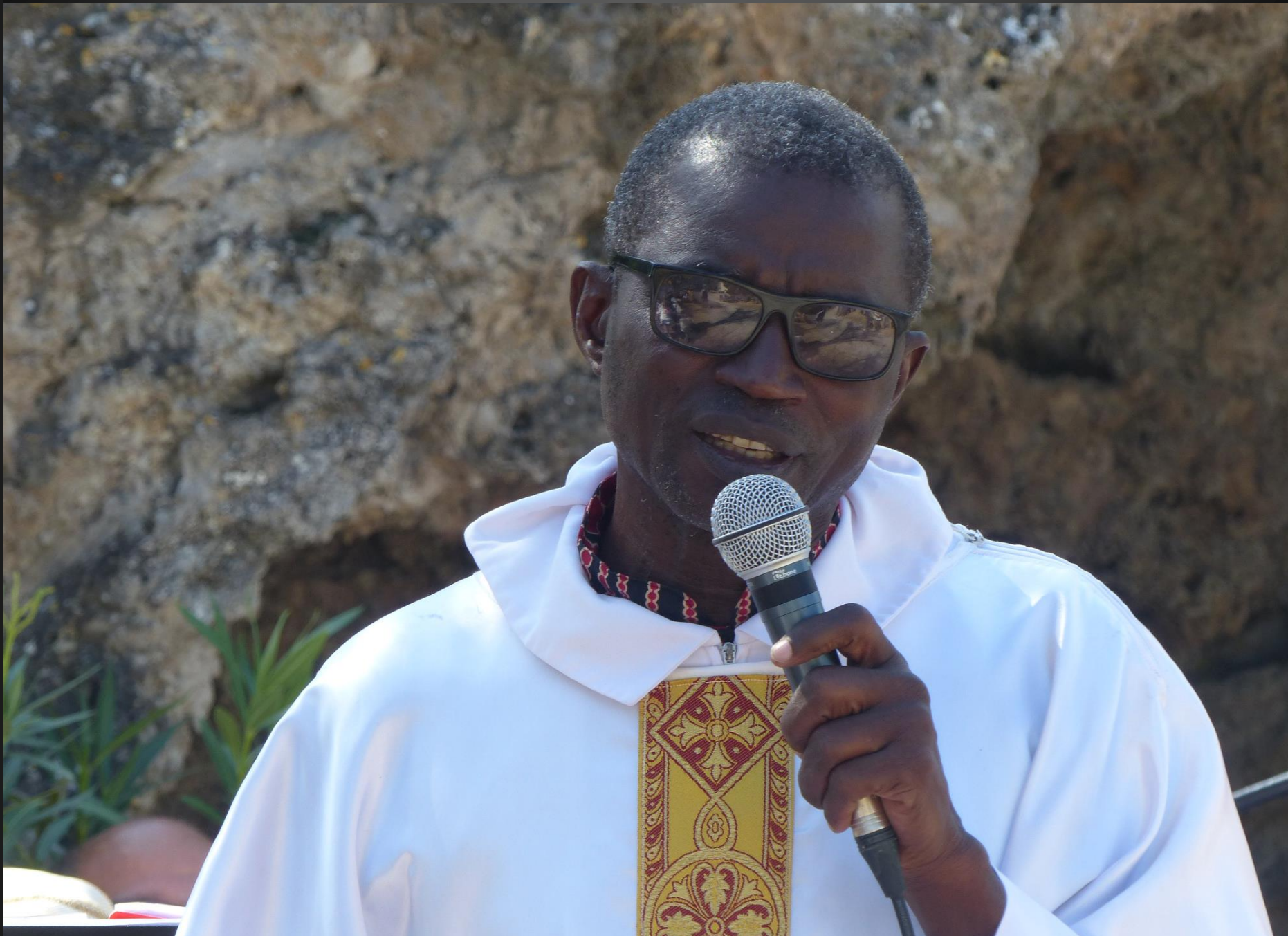
VENTABREN _ L'homme de Dieu s'adresse aux fidèles.