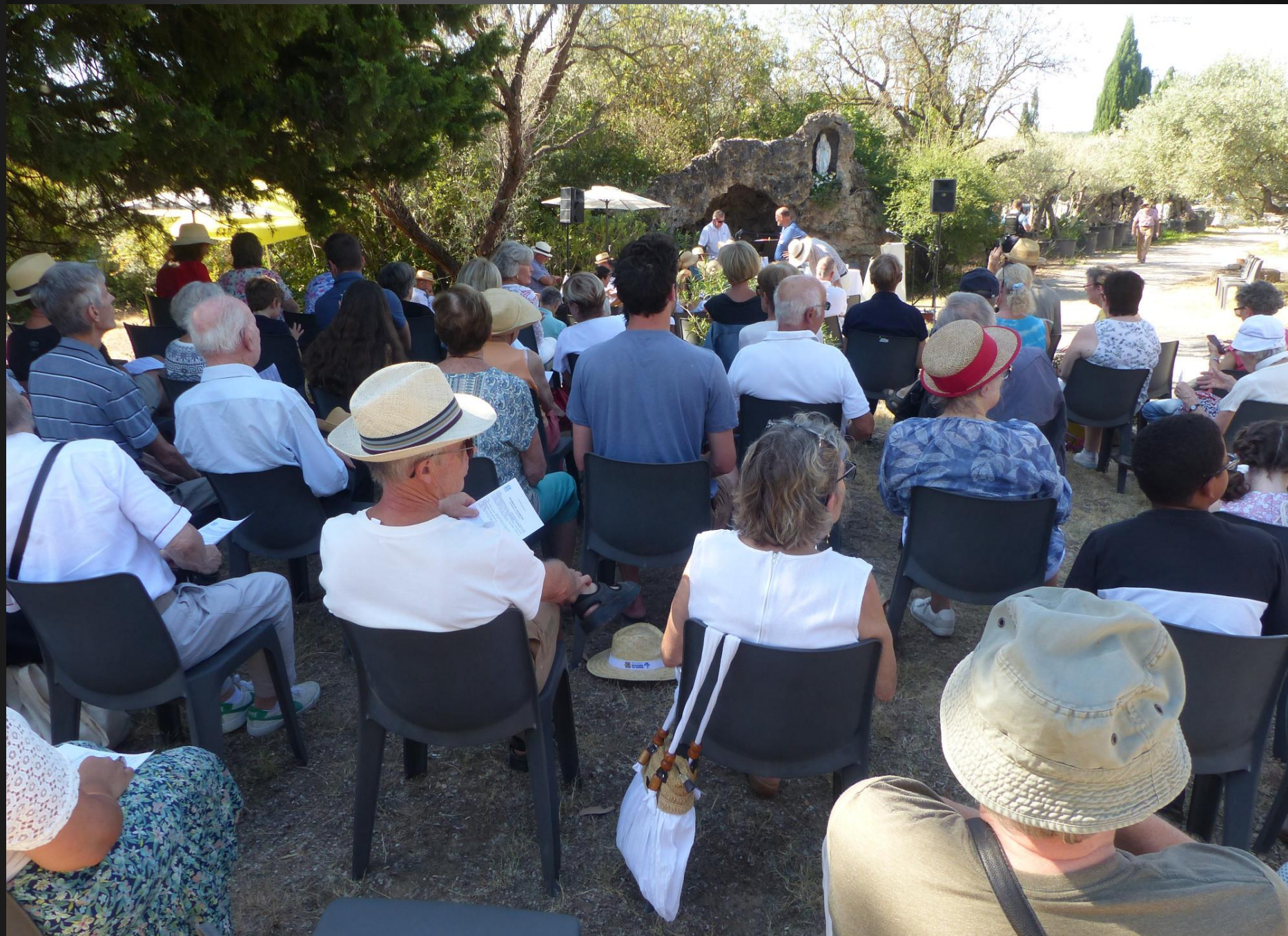
VENTABREN _ Vue générale de l'assemblée des fidèles.