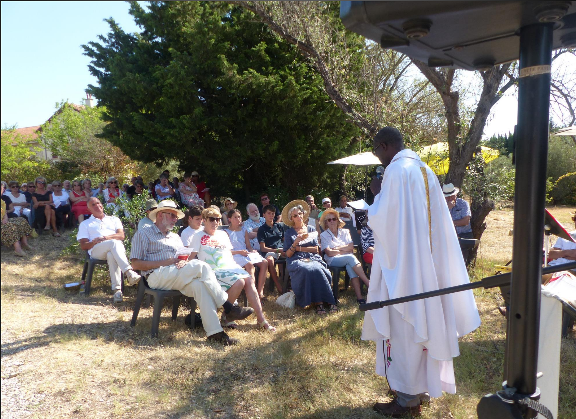
VENTABREN _ L'assemblée est très attentive aux paroles du célébrant.