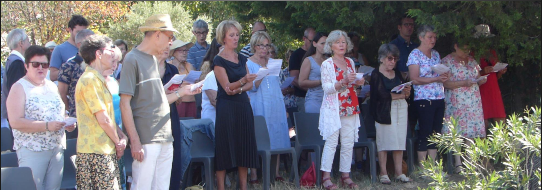
VENTABREN _ Chant d'entrée, CHERCHER AVEC TOI, MARIE