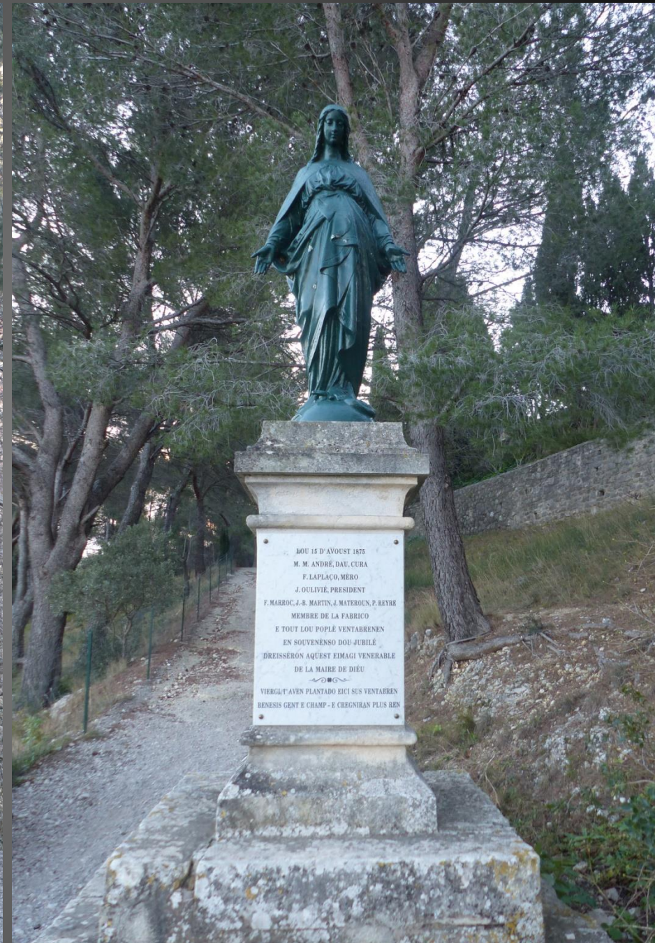
Après avoir longé le cimetière, le sentier arrive au pied du château de la Reine Jeanne où se dresse une remarquable statue de la Vierge enceinte, témoin de la piété mariale des anciens.