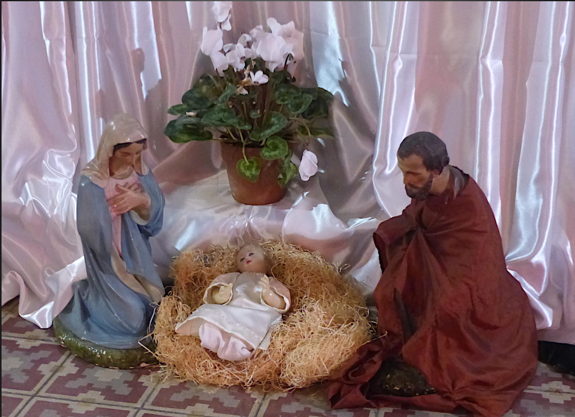
Devant l'autel, la Sainte Famille est mise à l'honneur jusqu'au 02 février, date de la Chandeleur (Présentation de Jésus au Temple)...