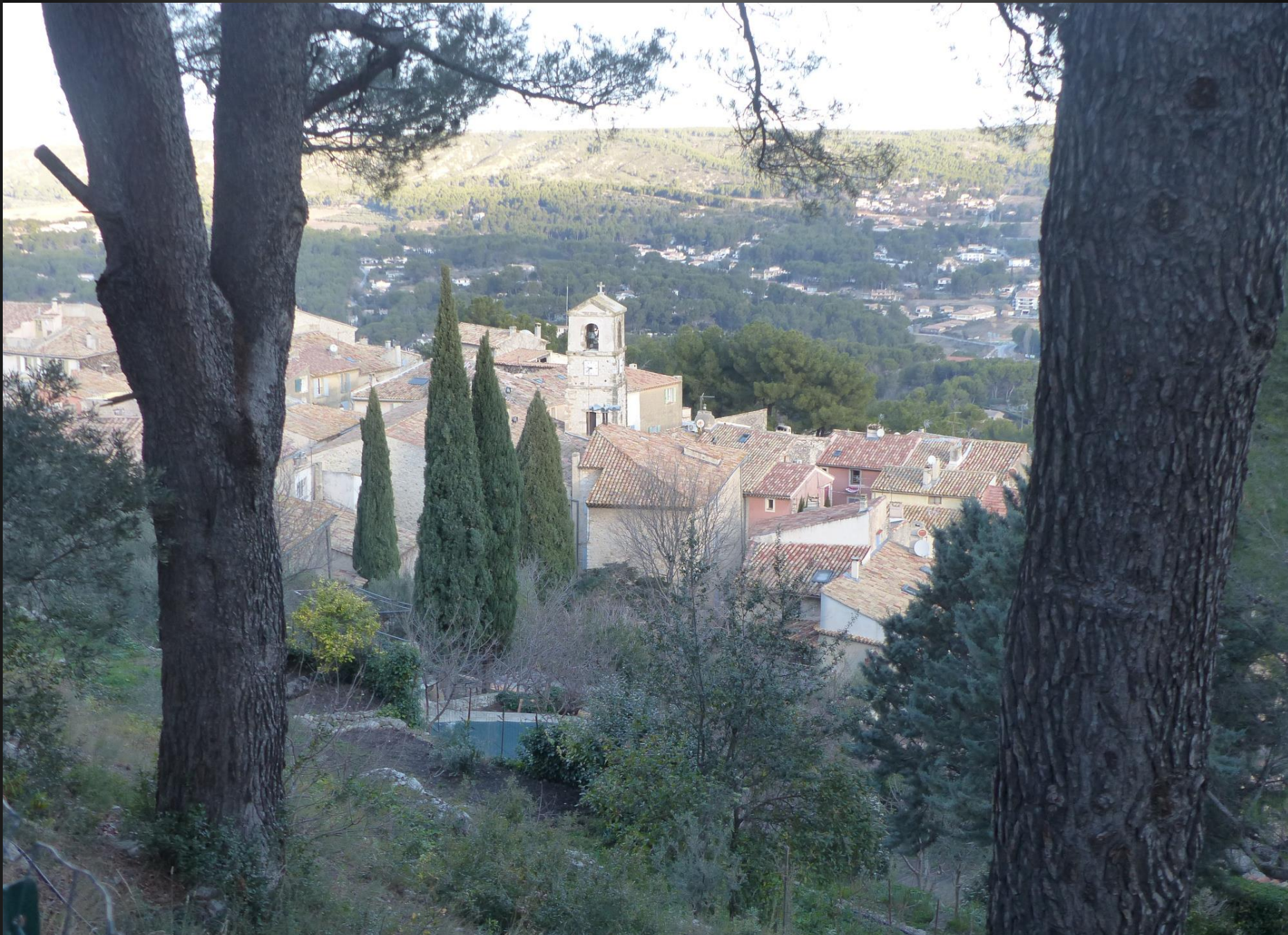
Le sentier qui descend du plateau vers le village offre un beau panorama.