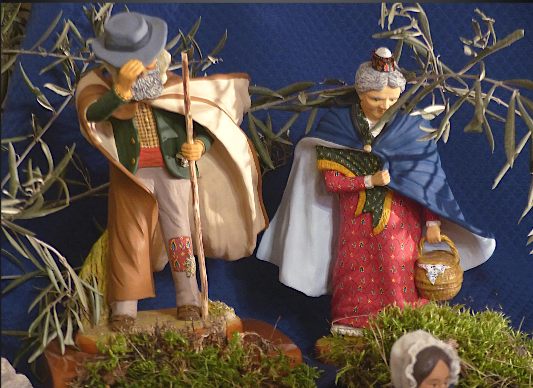
Le santon « Mistral » de la Maison Fouque fut offert lors de la dissolution du groupe provençal local.