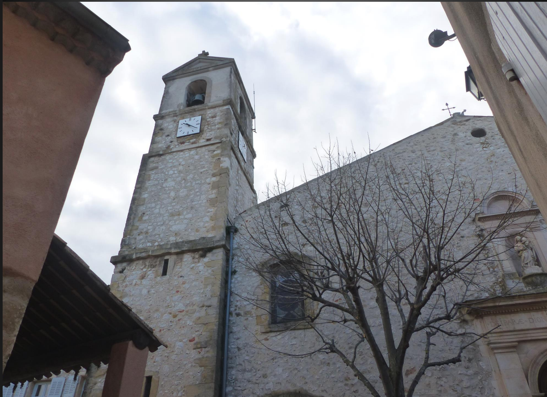
La nouvelle église Saint-Denis fut livrée au culte en 1772 .