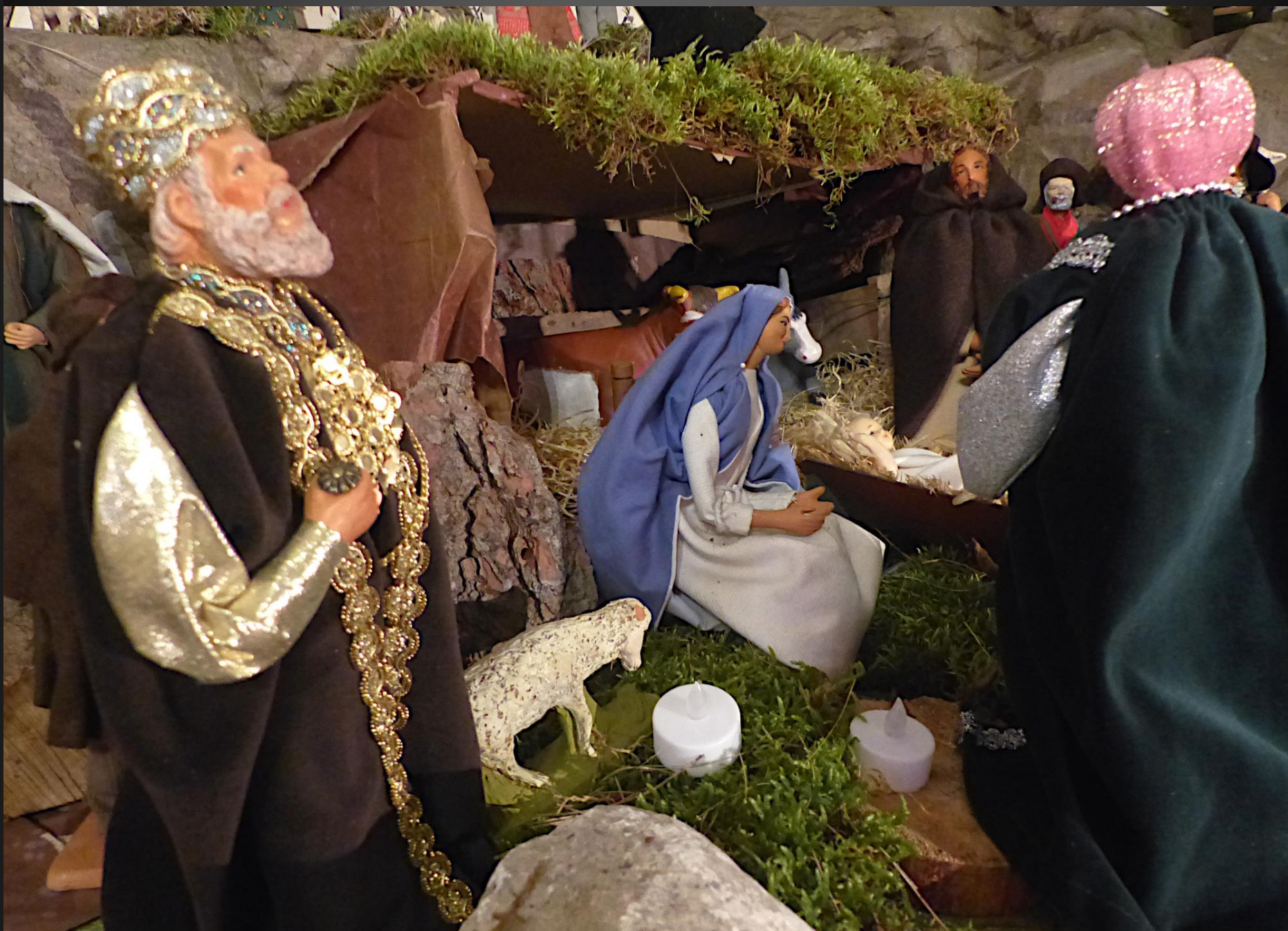
Les Rois Mages, Melchior, Gaspard et Balthazar ont suivi l'Etoile qui les a conduits à l'étable de Nazareth où ils ont offert respectivement à l'Enfant Roi l'or, l'encens et la myrrhe.