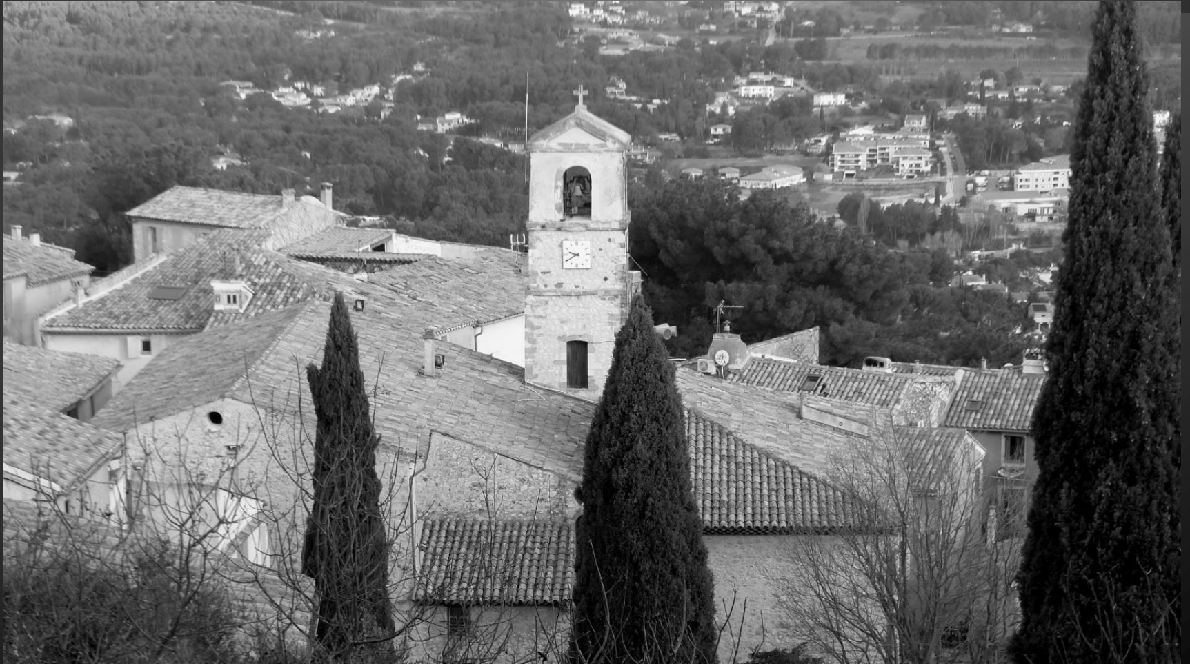
VENTABREN_ Le haut clocher de l'église Saint-Denis domine le village.