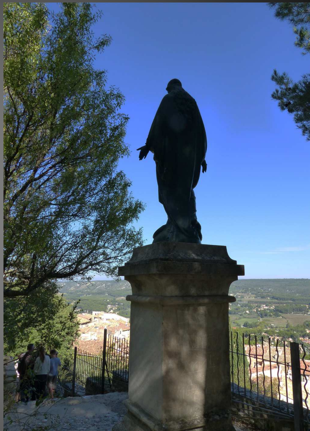
VENTABREN / Le Père Michaud procède à la bénédiction du village et de ses habitants, puis les pèlerins s'en retournent vers la place de l'église en chantant un cantique à Marie...