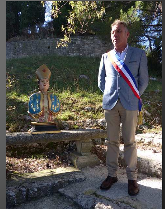
VENTABREN / La procession avance vers le château par le chemin du cimetière, la pente est sévère, on prend grand soin de saint Denis ... et de sa tête.