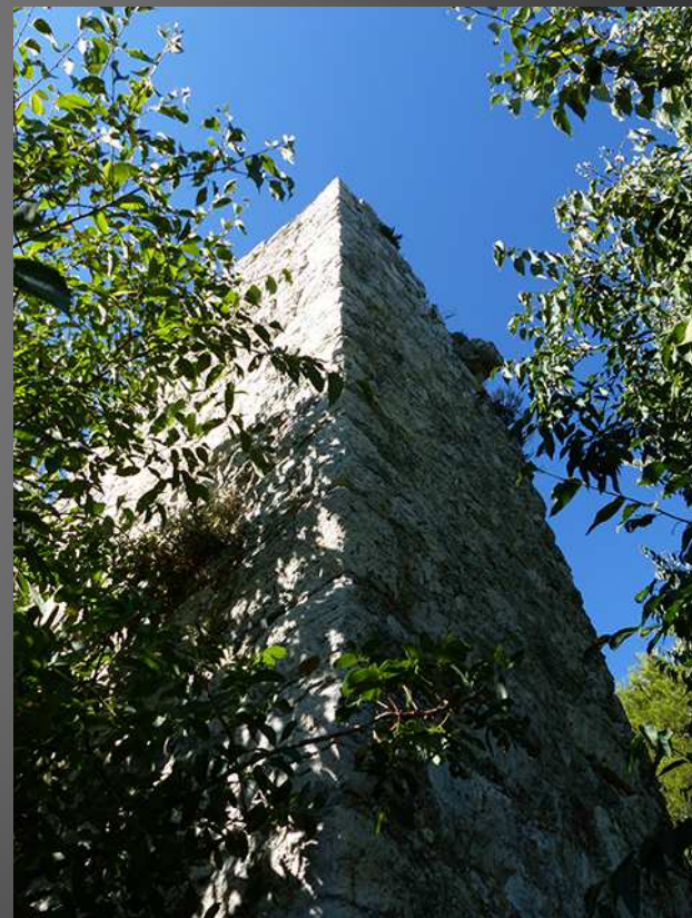
VENTABREN / Dans les ruines imposantes du château de la Reine Jeanne, on distingue encore l'emplacement de la chapelle castrale qui abrita jadis les reliques de saint Denis, avant la construction de la nouvelle église dans le village en contrebas.