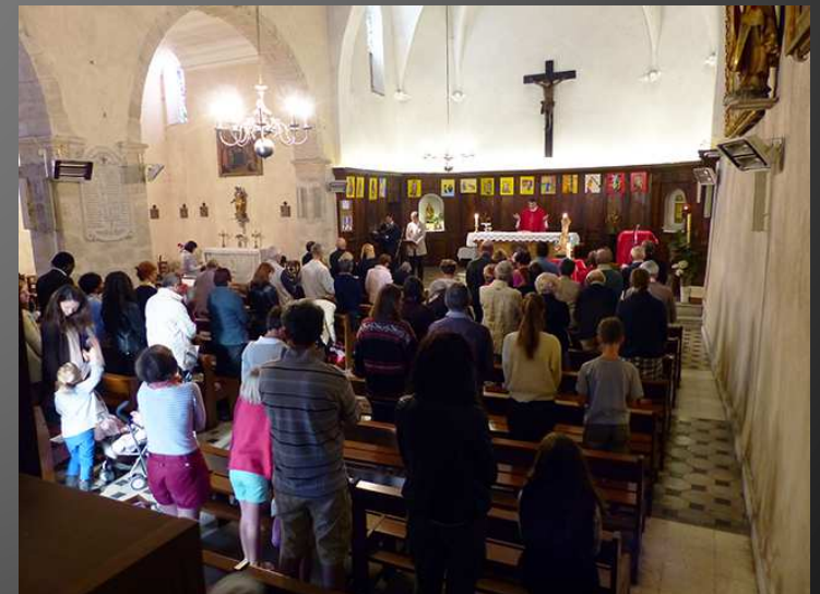
VENTABREN / Eglise Saint-Denis : le buste-reliquaire a été placé devant l'autel pour la cérémonie, avant d'être porté en procession jusqu'à la statue de Notre-Dame, au pied du château.