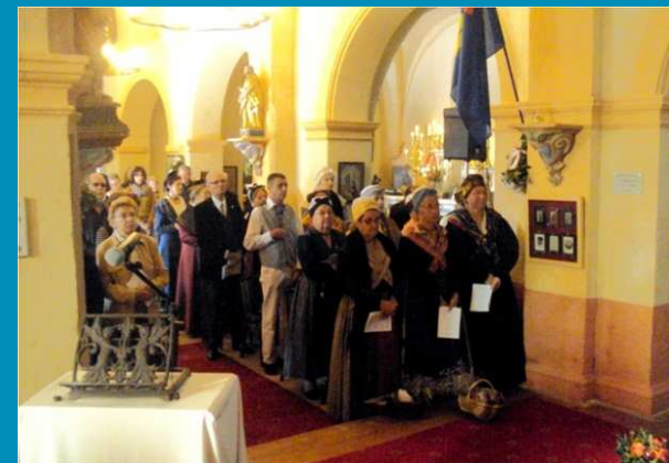
Les pèlerins se pressent dans la nef principale.