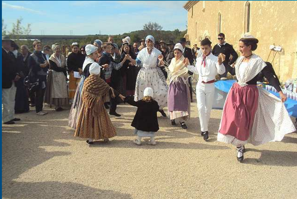
Les danses provençales ... farandole, gigue, gavotte, etc. sont indissociables de la fête traditionnelle . Le costume de paysanne (porté ici) est simple et coquet ; il reflète les teintes chaudes du midi sous un soleil d'azur.