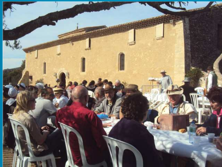
LE PIQUE-NIQUE / REPAS complet avec « gardianne de taureau » pour les uns, ou tiré du sac pour les autres ; un grand moment ensoleillé et convivial.