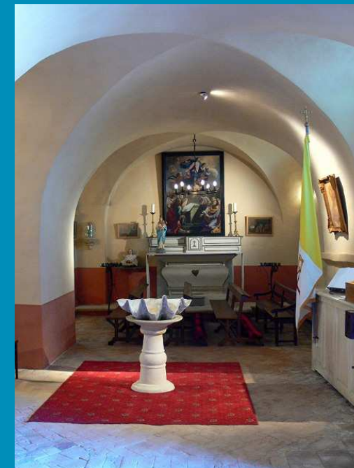
Photos de la chapelle restaurée.