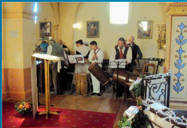
Les tambourinaires se mettent en place.

Dans la chapelle magnifiquement rénovée, le père BERT ALFARO célèbre la messe. Parmi les nombreuses offrandes, le beau pain du boulanger marqué du nom du saint, le raisin du terroir et la bouteille de vin rosé, emblématique du pays provençal. Tous les chants sont en lengo nostro , et résonnent dans la vénérable chapelle comme un défi aux tentations matérialistes de ce temps et à l'oubli subséquent de nos racines.