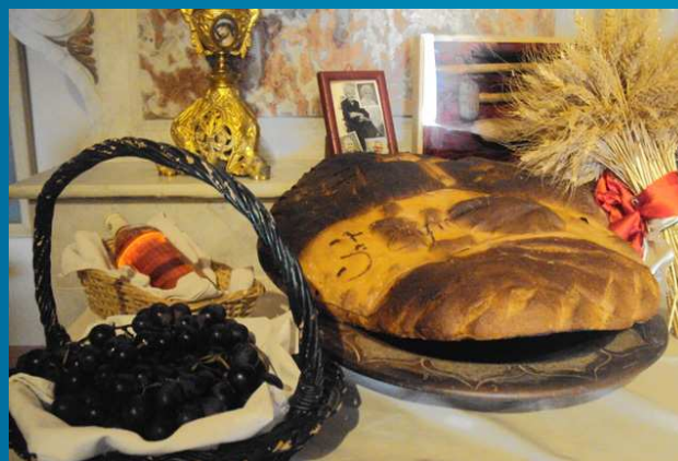
Offrandes sur l'autel de St Symphorien : pain et raisin