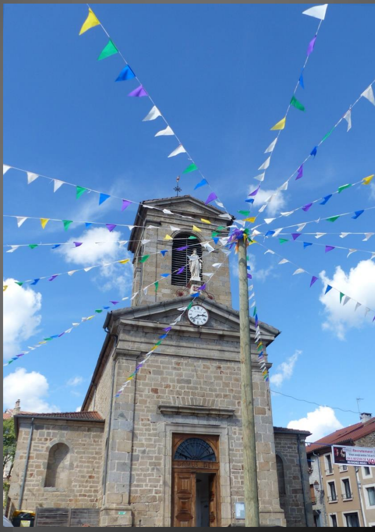
VIVEROLS L'église paroissiale