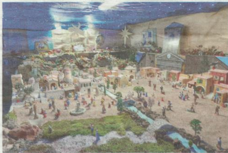
Les crèches sont à admirer dans la salle d'exposition de l'ancienne gendarmerie du village

Avec les scènes confectionnées dans les rues, le nombre s'élèvera à 290. Les crèches sont à admirer jusqu'au 7 janvier 2024 dans la salle d'exposition de l'ancienne gendarmerie, tous les jours de 14h à 18h30 et librement dans les rues du village. « On est ouverts tous les après-midi donc il faut deux personnes à chaque fois, mais tout le monde est motivé à Viverols », assure Chantal Tournebize, alors que l'an passé, l'événement a attiré près de 5 000 visiteurs.