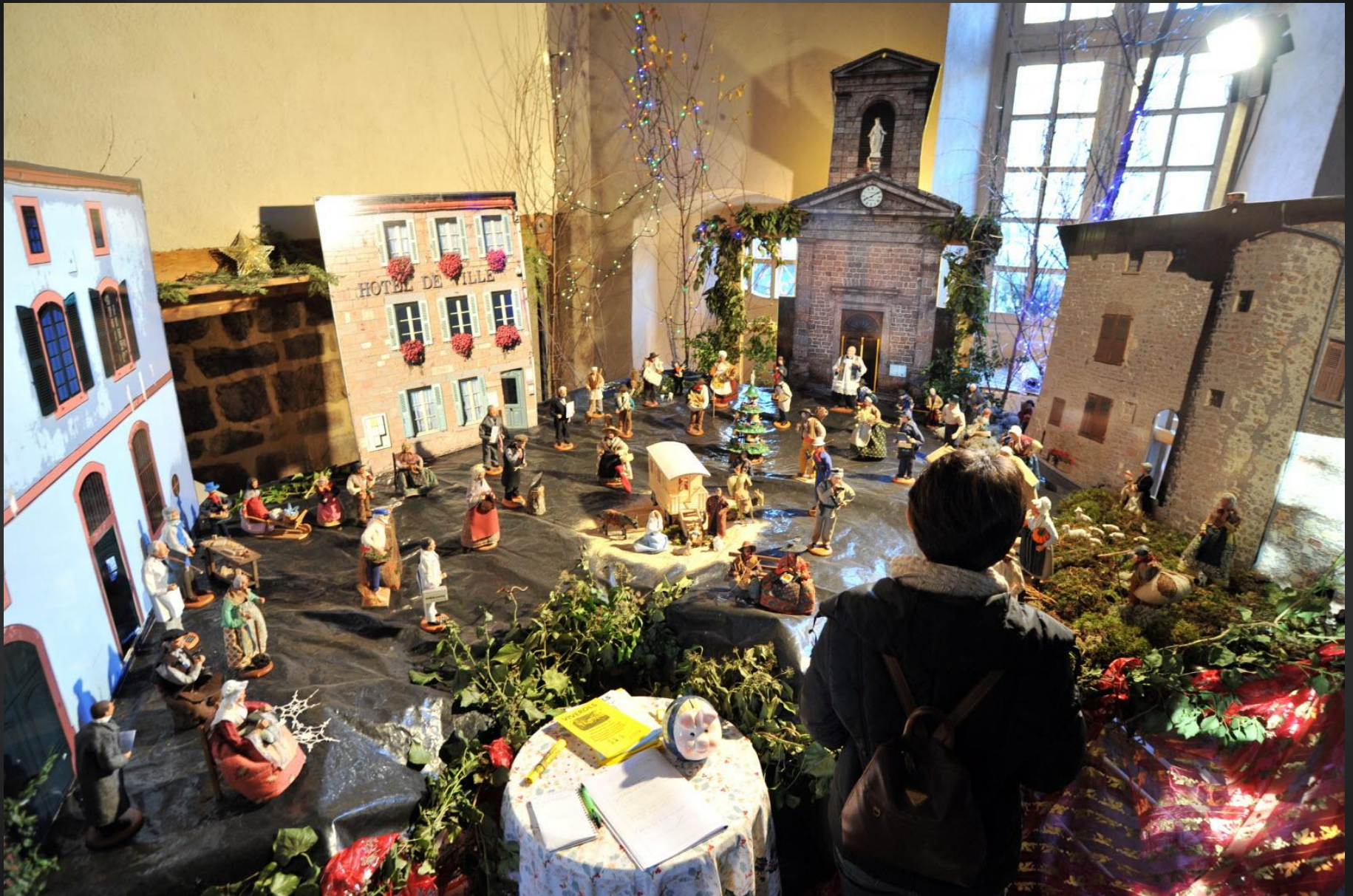
Représentation de VIVEROLS : Place du village, Eglise, Hôtel de Ville, Château ...