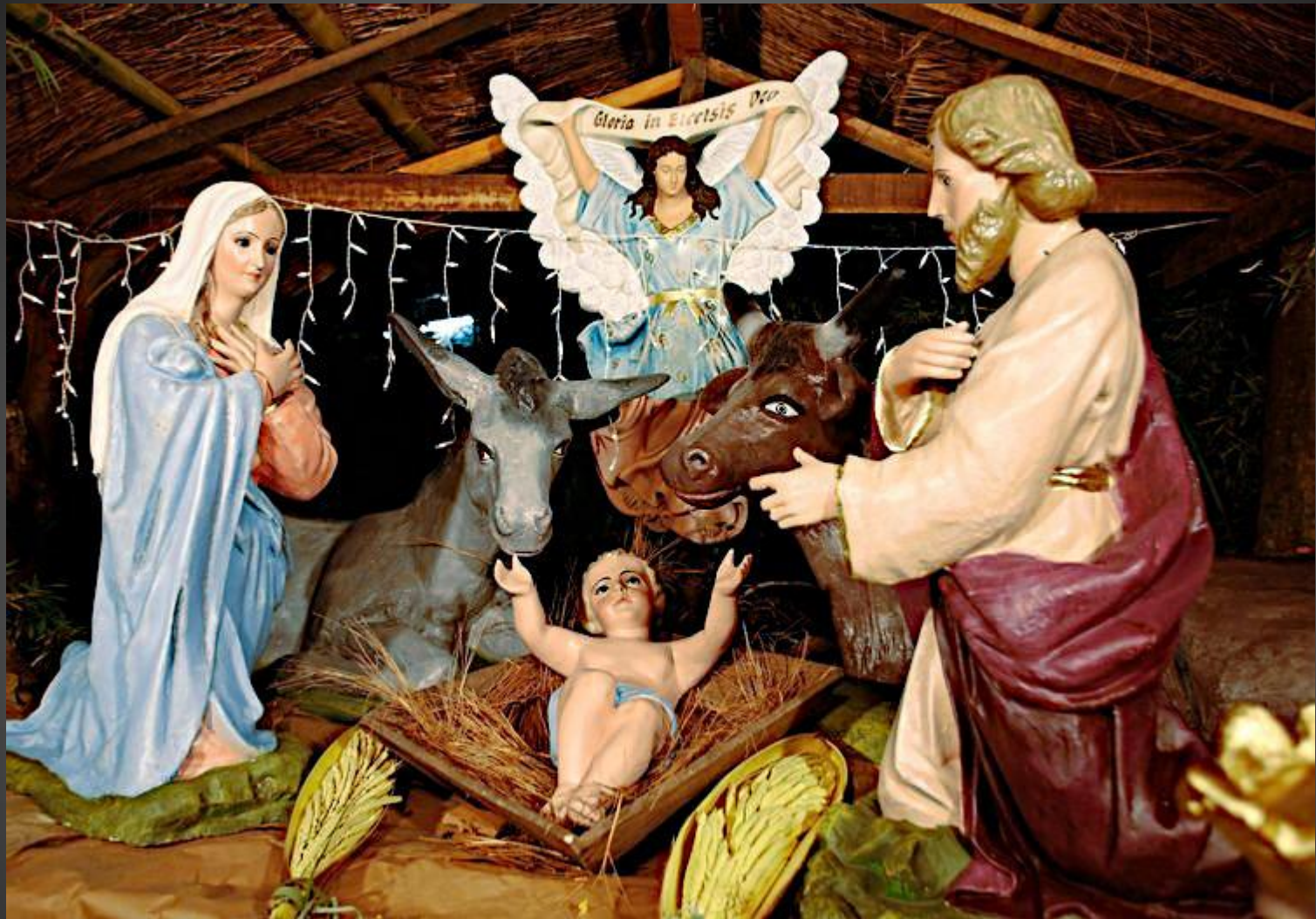
Tous les rois se prosterneront devant lui, toutes les nations le serviront. (Psaume 72:11)