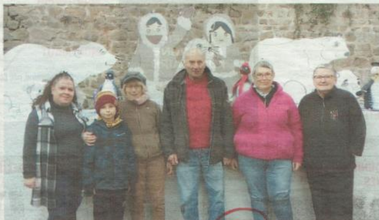
Cette année, le nombre de crèches atteint les 290 - © comité des fêtes de Viverols.

Du latin cripta, qui désigne la mangeoire d'un animal, la crèche fait aujourd'hui référence au symbole de la Nativité. Dans les foyers ou dans les communes, elle est souvent installée pour la Sainte-Barbe, le 4 décembre ou la Saint-Nicolas, le 6 ou encore le premier dimanche de l'Avent. Aujourd'hui, la crèche s'ancre dans les